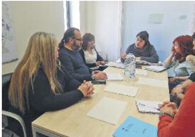
Reunió dels representants llagostencs amb Melgares.

Des de l'Ajuntament asseguren que els representants de la Llagosta s'han reunit amb els de Terrassa perquè aquesta ciutat està servint com a model a moltes altres per ser pionera