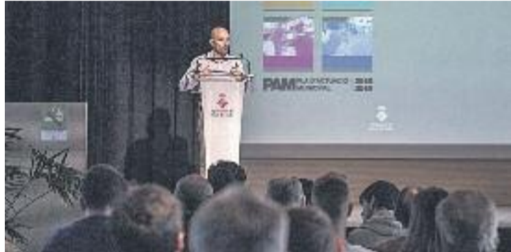
Presentació del PAM 2015-2019.

El PAM inclou novetats respecte d'altres mandats. Així doncs, en l'àmbit educatiu destaca el programa de gratuïtat dels llibres de text, a partir d'un model de socialització, per als ensenyaments de primària dels centres educatius de Parets. En Benestar Social destaca el milió d'euros que es destinarà a ajuts socials i, en l'àmbit de l'ocupació, el compromís de crear 1.000 llocs nous de treball mitjançant plans d'ocupació, ajuts a la con-