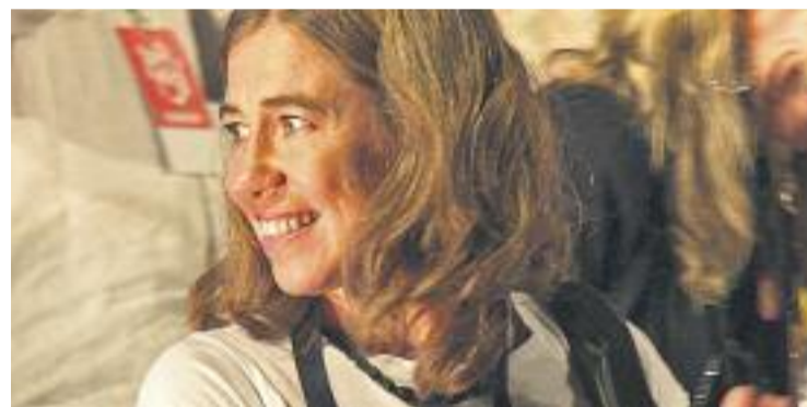
Parellada rebrà la distinció per la seva trajectòria professional.

La Creu de Sant Jordi és un dels màxims reconeixements que pot rebre una persona per part de la Generalitat de Catalunya. La distinció es va crear el 1981 amb la finalitat de distingir les persones naturals o jurídiques que, pels seus mèrits, hagin prestat serveis destacats a Catalunya. Qualsevol ciutadà, grup de ciutadans o entitat pot demanar que s'atorgui aquest guardó a alguna persona, sigui física o jurídica.