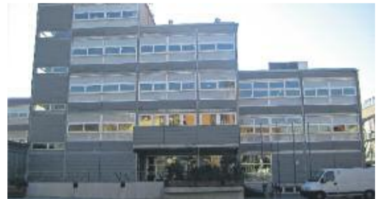
L'Ajuntament també reclama el deute no reconegut.

L'Ajuntament remarca que la Generalitat de Catalunya no els paga, "però, en canvi, els ajuntaments hem d'abonar les factures dels nostres proveïdors en un termini de 30 dies, cosa que disminueix greument la solvència dels consistoris".