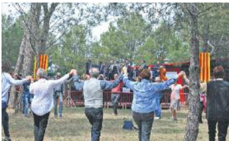
l'Aplec de la Sardana celebrat al Circuit de Catalunya.

Entre les sardanes que es podran escoltar, la Cobla Jovenívola de Sabadell interpretarà, al matí, Retornant a l'Aplec a Montmeló , sardana que va ser composta per Ramon Iglesias per ser estrenada a l'Aplec de