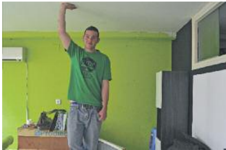
Els afectats van denunciar que vivien en trasters.

L'alcalde ho va admetre en el passat Ple municipal, on es va aprovar una moció en la qual el consistori es compromet a "augmentar els esforços per poder aplicar i fer complir" les lleis d'habitatge i la llei 24/2015. Malgrat l'autocrítica, Pujol també va lamentar la manca d'informació per part de la Generalitat sobre els habitatges buits propietat de bancs o grans empreses. Segons les dades de la Generalitat, a Llinars hi ha ac-