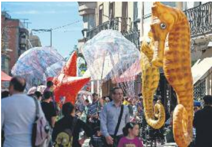
La Mostra se celebra des d'avui i fins diumenge.