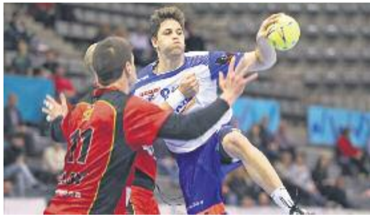
Márquez Illuita contra dos defenses aragonesos.

Henrique Teixeira i Ferran Solé van ser els referents ofensius de l'equip contra un Huesca que es presentava al Palau d'Esports amb un vell conegut de l'afició sota pals, Dimitrije Pejanovic. La primera meitat va ser tremendament igualada i cap dels dos equips va gaudir d'una renda superior als dos gols i el resultat al descans era d'empat a 14.