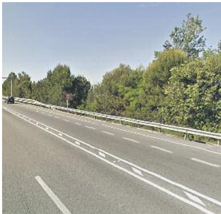
Granollers, la Roca i les Franqueses fa anys que demanen la divisió.