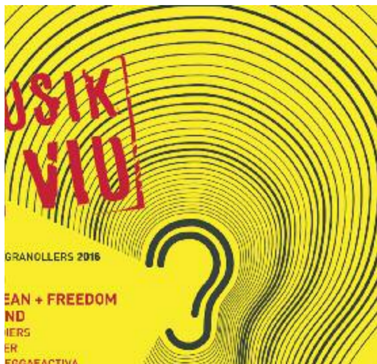
Detall del cartell del Musik N Viu 2016.