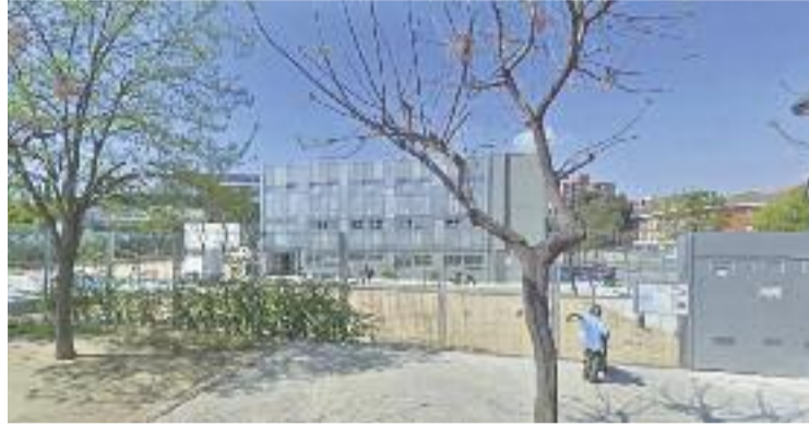
La línia que es tancarà és una de l'escola Bernat Mogoda.

L'AMPA de l'escola considera "injust" el tancament i ha mostrat la seva "repulsa i indignació" per la decisió del Govern, ja que el curs anterior es va tancar una altra línia pública, en aquest cas al col·legi Santiga. L'AMPA afirma que "sembla que tenien pressa per publicar el tancament d'una línia de P3 al nostre centre just en els primers dies de les preinscripcions i no deixar a les famílies decidir lliurement", ja que remarquen que "el fet de saber per endavant que només s'ofereix un grup pot