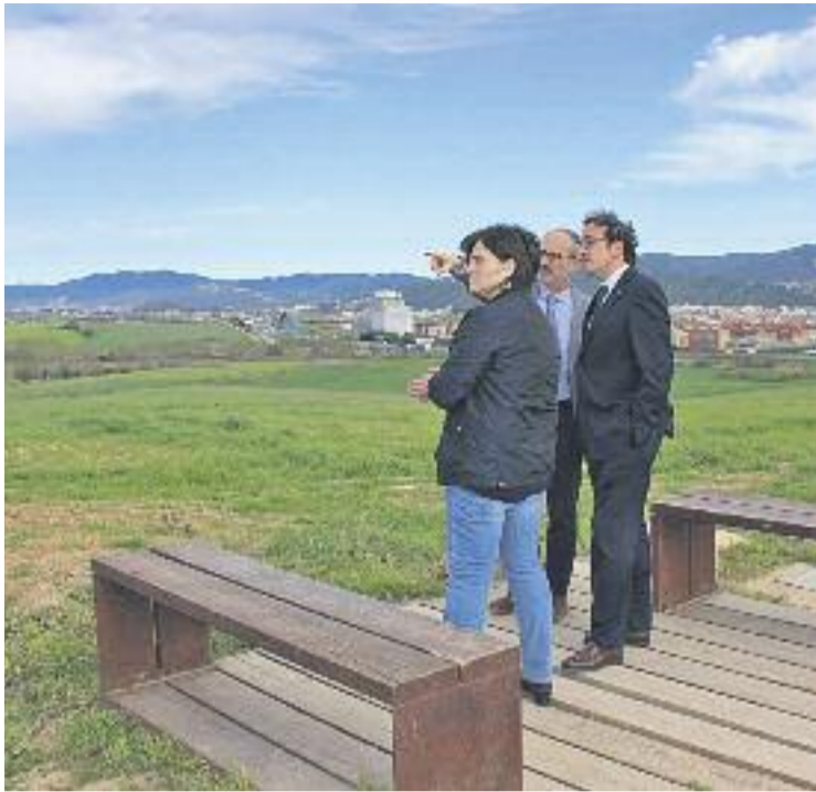
Un dels moments de la visita de Rull a Gallecs.