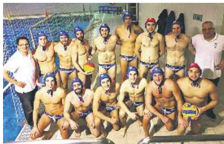
La foto de la plantilla i del cos tècnic d'aquesta temporada.

GRANOLLERS ▶ Ascens històric. Després de la victòria de dissabte passat contra l'AE Santa Eulàlia (11-7), el sènior masculí de waterpolo del CN Granollers va certificar el seu ascens a la Primera divisió de waterpolo, la segona màxima categoria estatal d'aquest esport.