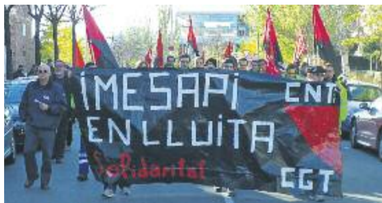
Una de les manifestacions dels treballadors d'Imesapi.

Des del sindicat CNT assenyalen que, davant d'aquest incompliment, precedit d'una si-