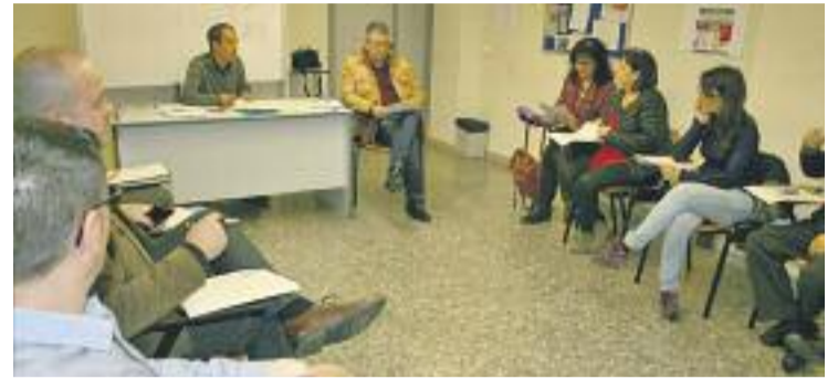
Reunió de la Comissió de la Festa Major.