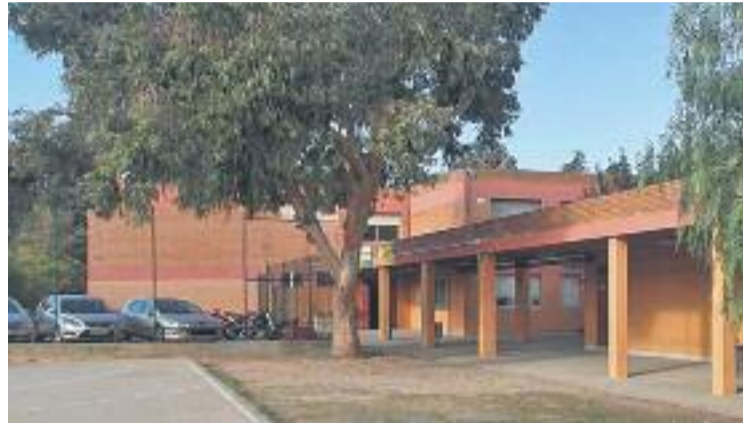
S'han presentat 26 sol·licituds més que places ofertes.

Des de l'Ajuntament assenyalen que aquestes dades corresponen a les sol·licituds formalitzades en el termini oficial de preinscripció, però "cal tenir en compte que, un cop tancat el període i fins a l'inici de curs, les dades poden variar". Tot i això, el regidor d'Educació, Raúl Broto, assegura que "més enllà de