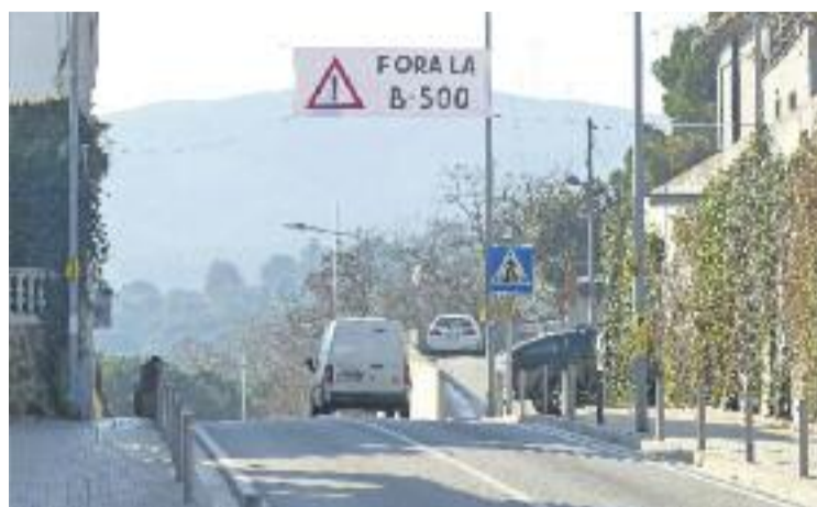
Sant Fost reclama el desviament des de fa 30 anys.