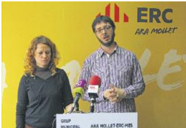
ERC parla d'"inseguretat jurídica sense precedents".