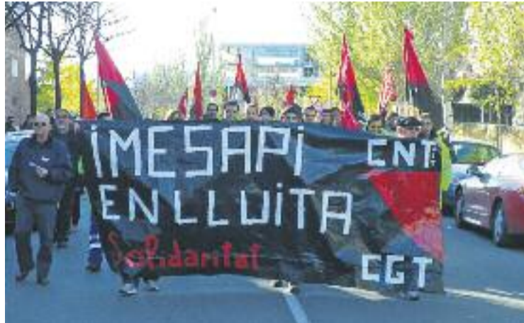
Una de les manifestacions dels treballadors d'Imesapi.

De moment, Sece ja ha incorporat sis dels 13 treballadors, però el sindicat CNT alerta que, tot i que l'empresa ha fet un primer gest, "es tracta d'un compliment irregular de la sentència". Des de la CNT assegu-