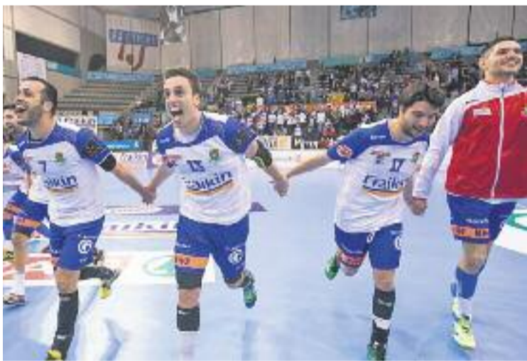
L'equip afronta dos mesos plens de partits.