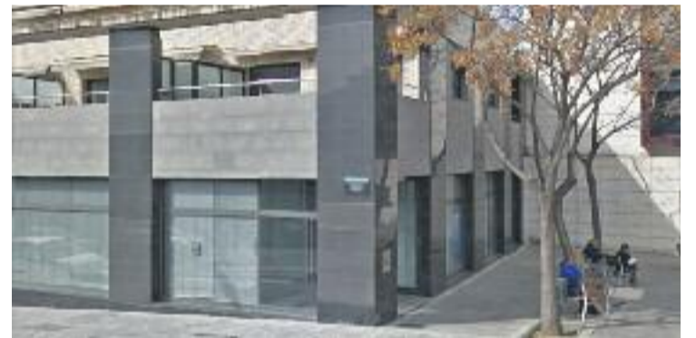
El local on s'ubicarà la nova seu del Col·legi d'Advocats.

El Col·legi d'Advocats ha justificat el canvi d'ubicació per l'increment de feina i dels serveis que ofereixen. Pel que fa a l'espai que ocupen actualment, l'Icavor preveu dedicar-lo a lloguer, bé com a local per a despatxos professionals o bé reconvertir-lo de nou en habitatges.