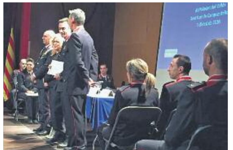
Un moment de l'homenatge als policies.

Aquest acte, que s'organitza anualment, vol reconèixer la tasca que duen a terme els agents de seguretat pública.