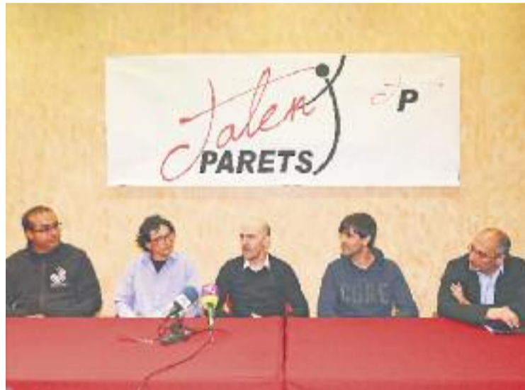
Un moment de la presentació del certamen.

La Sala de Plens va ser l'escenari triat per a la primera presa de contacte amb aquest concurs, que començarà a funcionar a principis de maig. "Habilitarem un compte de correu electrònic a través del qual rebrem i avaluarem tots els vídeos que ens enviïn", expliquen des del consistori a Línia Vallès . Aquests clips, que poden tenir una durada d'entre un minut i mig i dos minuts, seran examinats per un jurat que estarà format per diferents professionals i que tin-