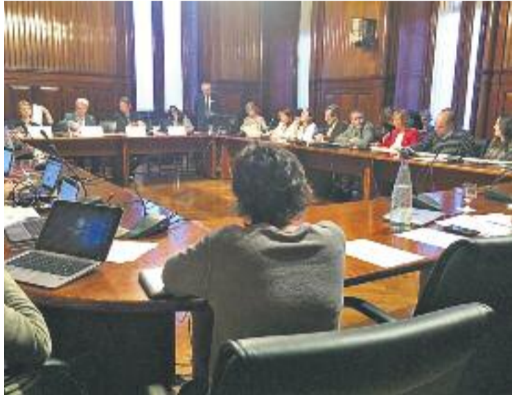
Una imatge del Ple de la Comissió d'Ensenyament.

El novembre de l'any passat el Ple municipal va aprovar per