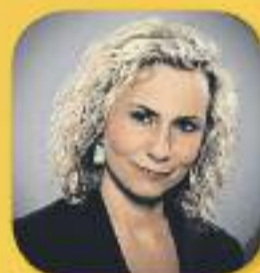
El matí de Catalunya Ràdio Amb Mònica Terribas De dilluns a divendres, de 6 a 12 h