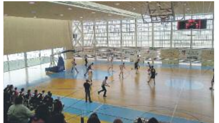
L'equip no va poder remuntar a l'últim període.

Demà passat, l'equip afronta el sisè partit del grup C-1 a la pista del BBA Castelldefels. Els del Baix Llobregat van donar la sorpresa al Plana Lledó (60-63).