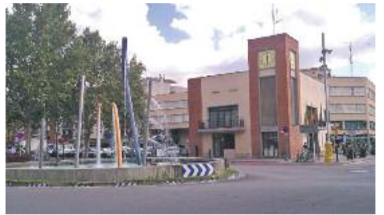
La Generalitat deu més de 500.000 euros al municipi.