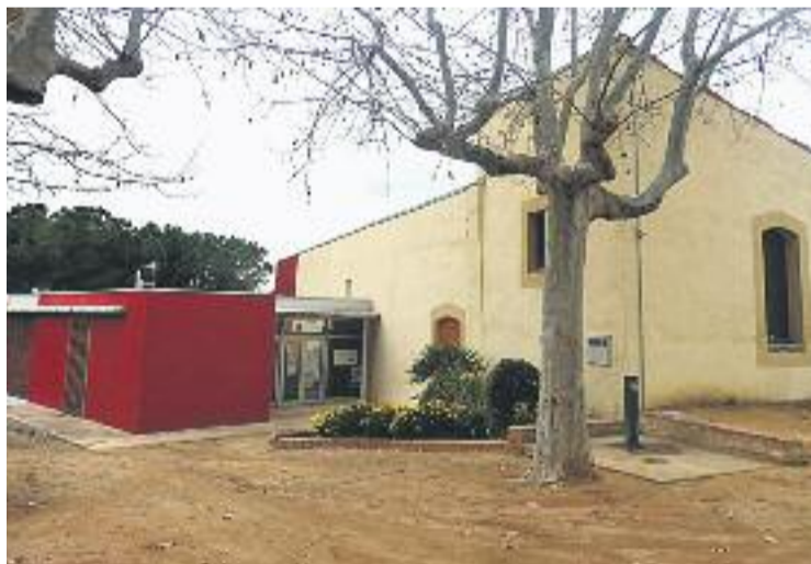
El Cellar es va inaugurar el setembre de 2012.