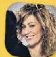
Les mil i una nits de Maria de la Pau Janer Amb Maria de la Pau Janer De dilluns a divendres, de 22 a 23 h