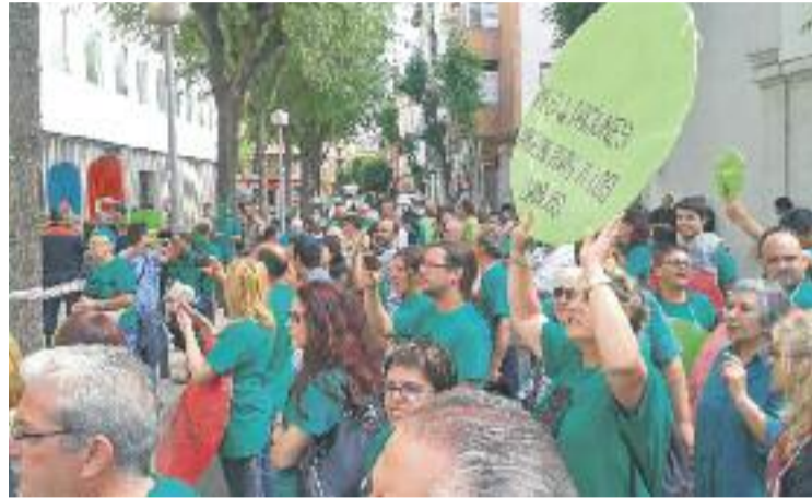
130 dels 153 pisos ocupats són d'entitats bancàries.

Durant la reunió que va fer la setmana passada la Taula, els membres de la PAH van explicar que un gran nombre d'aquests pisos estan ocupats pels que ells anomenen "recuperadors", que són famílies que ocupen un habitatge que havia estat seu o no i que volen fer front als pagaments, però que no ho poden fer al preu de mercat.