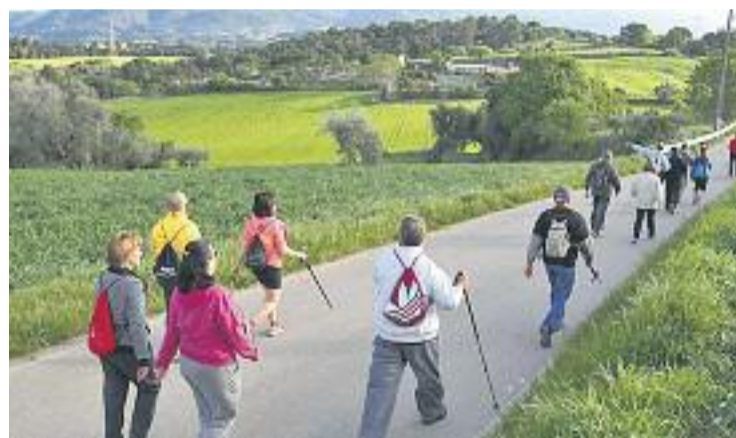
Els participants podran gaudir de vistes com aquesta.

Enguany, l'eslògan de la jornada serà Infant actiu = adult saludable , una declaració d'intencions amb la qual es vol promoure la pràctica d'exercici des de la infantesa.