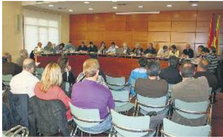
Una imatge del Ple de la setmana passada.

El document, una proposta d'ICV-EUiA que va ser aprovada amb els vots dels ecosocialistes, de Ciutadans i d'ERC, explica que la desaparició d'una línia i no pas dues com pretenia la Generalitat inicialment "no és cap èxit" i també exposa que aquesta situació "afavoreix els centres concertats" i que els criteris que el Govern fa servir per plantejar aquest tancament són "estrictament econòmics i no educatius". ICV també va incloure al document que, en el cas que finalment s'executi el