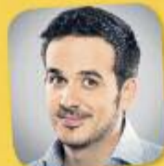
El club de la mitjanit Amb Francesc Garriga Cada dia, de 23 a 1 h