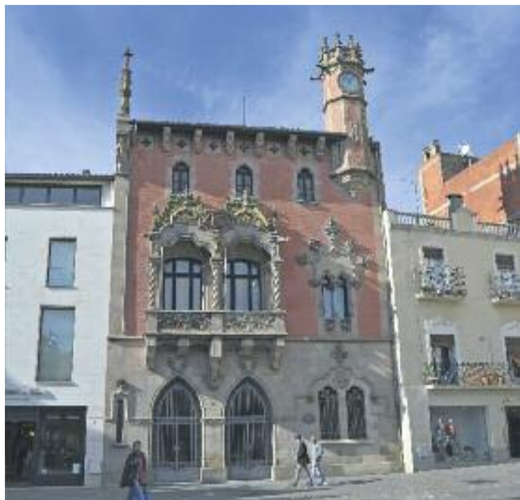
L'Ajuntament també elaborarà un protocol d'acollida.