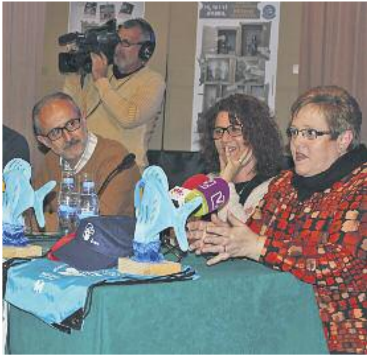
Presentació de la Mostra Internacional de Titelles 2016.