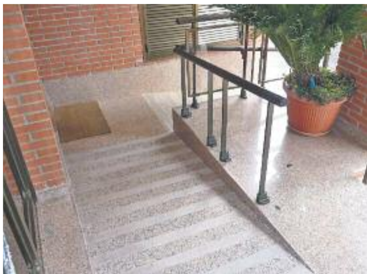
Els ajuts serviran per instal·lar rampes i ascensors.

A aquestes quantitats s'hi podrien afegir ajuts extres com un 10% per als edificis on hi hagi menys de 10 habitatges, un 5%