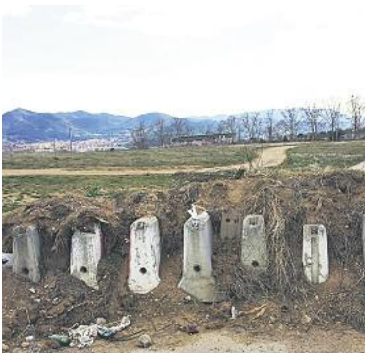
Imatge de la barrera de Can Ninou trobada per la CUP.