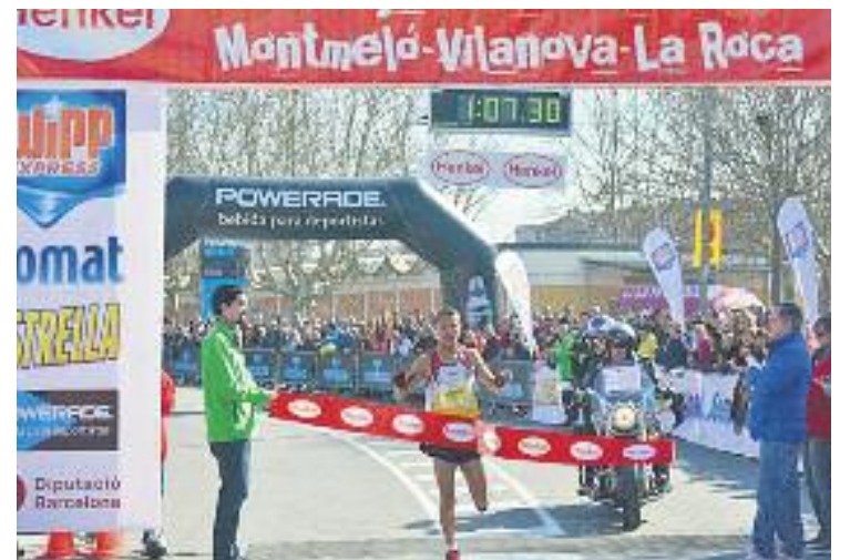
Behmbarka va guanyar l'edició de 2015.

COMARCA ▶ La 23a edició de la Mitja de Montornès, Montmeló, Vilanova i la Roca ja és aquí. Demà passat els carrers de bona part de la comarca seran l'escenari d'una nova edició d'aquesta prova que ja s'ha convertit en un referent de l'atletisme de casa nostra. Uns 3.000 atletes participaran en la cursa.