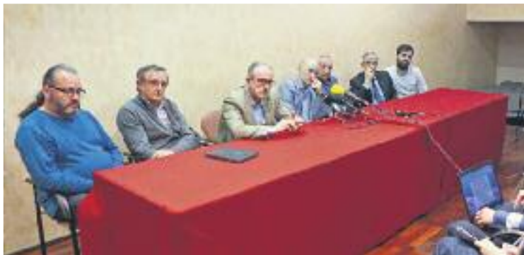
Els alcaldes vallesans demanen que hi hagi consens.