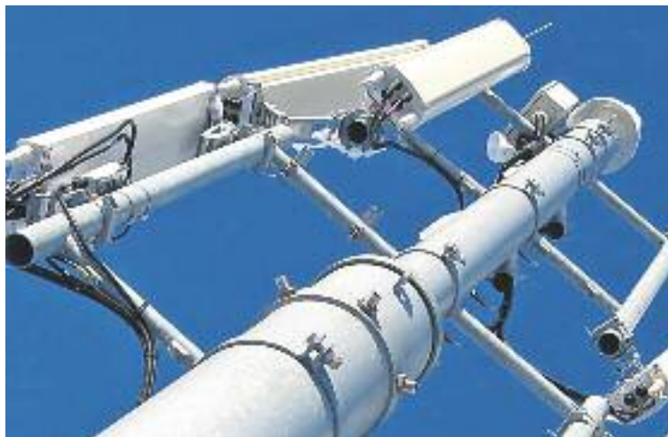
Es modificarà el PGOU per permetre les antenes als terrats.

Aquesta llei estatal ha generat molta controvèrsia perquè no fa cap referència a la salut dels ciutadans i elimina la capacitat de legislar, ordenar o decidir a la resta d'administracions, siguin autonòmiques o municipals. A més, la normativa contempla