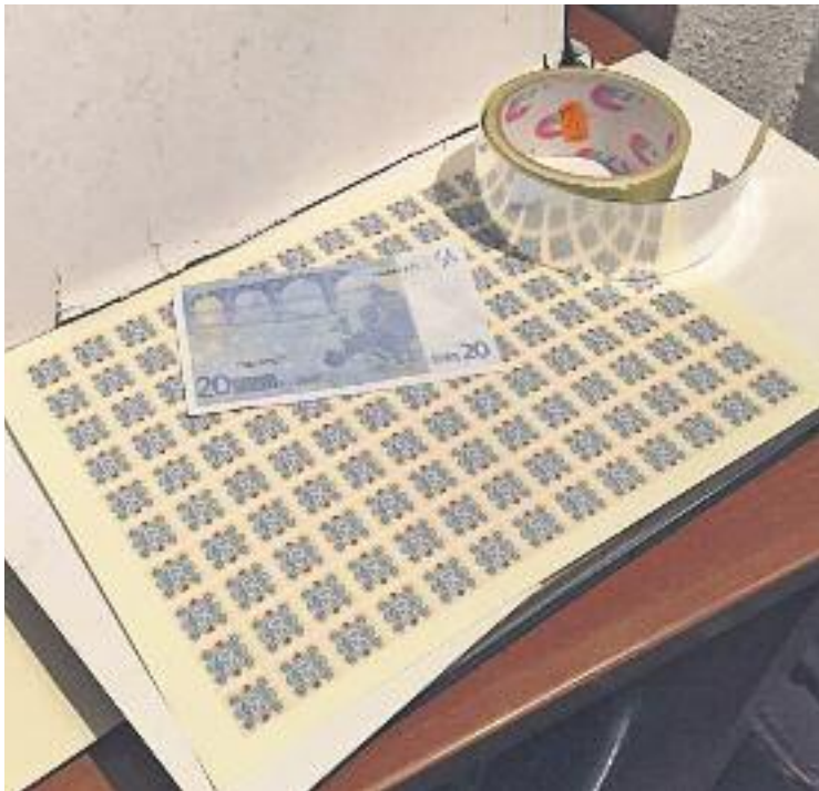
Alguns dels hologrames utilitzats en la falsificació.