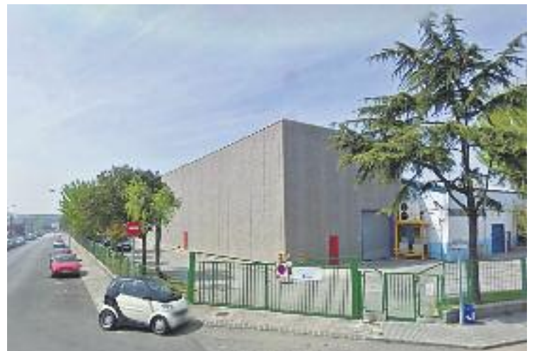
Una imatge de la seu de l'empresa al municipi.

El passat 21 de gener, dia del judici d'aquest cas, uns 100 delegats sindicals de tot el país van mostrar el seu suport a la treballadora, que més d'un any després veu com el cas se soluciona de manera favorable per als seus interessos.