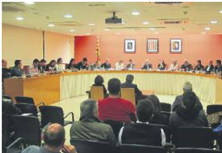
ERC i la CUP es van abstenir en la votació del Pla de Xoc.