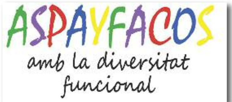
Detall del cartell de l'associació.

Comparat amb el primer recapte de l'any passat, el nombre de captacions va baixar una mica. El 2015 se'n van aconseguir 85 i enguany 79, però el nombre de persones que van visitar la Unitat mòbil del Banc de Sang ha pujat en 10.