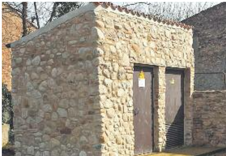
La nova instal·lació situada a Gallecs.