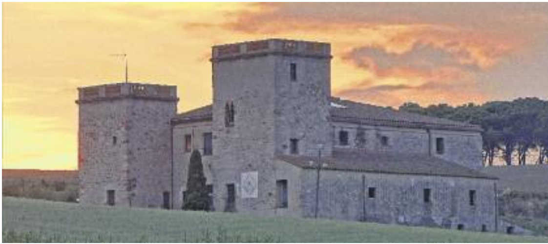
Amb aquest catàleg els serveis d'emergències podran accedir més fàcilment a les masies disseminades.