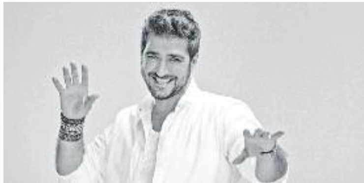
Antonio Orozco ha exhaurit totes les entrades per demà.

Amb més de 600.000 discs venuts i nou discs de platí, Antonio Orozco és un dels artistes més reconeguts del panorama estatal. Guanyador del Premi Ondas 2003 al Millor Artista en Directe , va ser nominat en l'edició del 2012 en els Latin GRAMMY entre els millors compositors del món per la seva cançó Estoy hecho de pedacitos de ti . La seva última producció, Dos Orillas , va entrar directament al número 1 de vendes a Espanya, va ser Disc d'or en menys de 24 hores i Disc de Platí en un temps rècord de menys de dos setmanes.