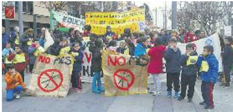
L'AMPA demana que es redueixin les ràtios.

Des de l'AMPA asseguren que la reducció d'un grup de P3 representarà una pèrdua de la qualitat educativa al centre per-