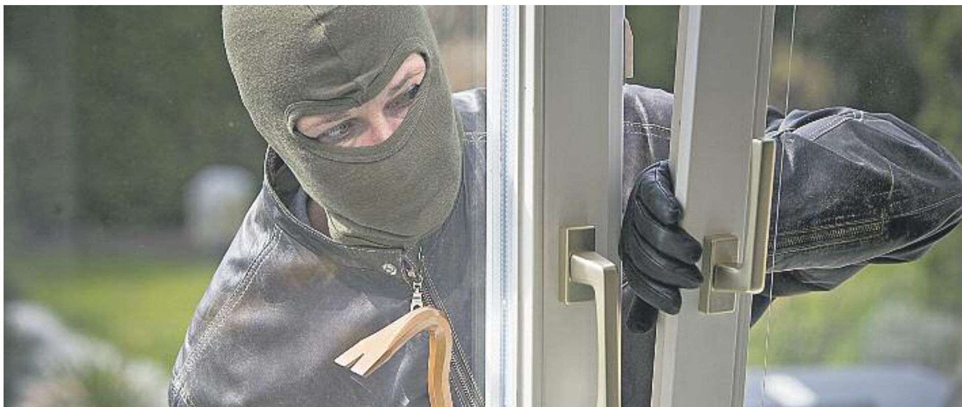
L'any passat es van registrar 355 robatoris a habitatges més que l'any 2014.