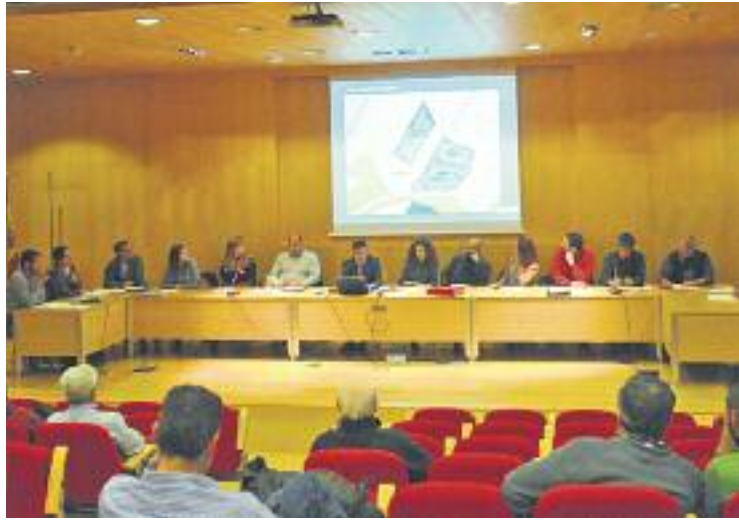
Un moment del Ple de dimarts passat.

Les anàlisis tenen un cost de 150 euros i Montserrat assegura que "s'haurien d'estudiar els casos per determinar si l'Ajuntament pagaria part o la totalitat