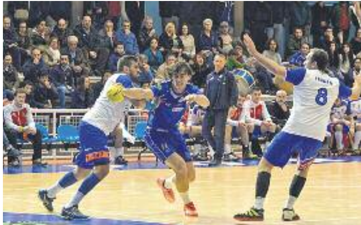
L'equip continua vivint un moment dolç.

L'inici de la segona meitat va ser molt més favorable als de Pontevedra, que van apropar-se a quatre gols aprofitant les males