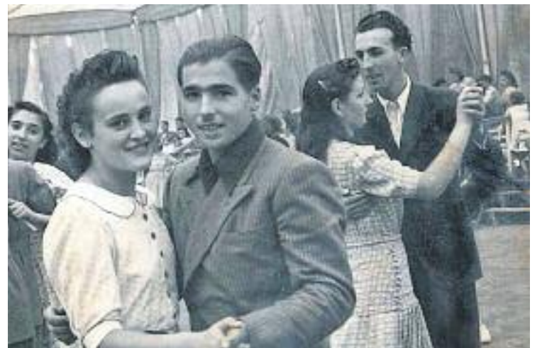
La mostra exhibirà fotografies com aquesta.

Un cop l'Ajuntament hagi recopilat tot el material, es decidirà quan s'inaugura la mostra. Tot i que declinen donar dates concretes, des de la Torreta asseguren que podria inaugurar-se el mes de juny, coincidint amb la Festa Major d'enguany.