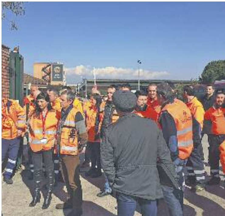
Els treballadors no han pogut evitar el tancament de la línia de producció.