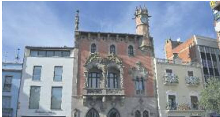
La UGT demana a l'Ajuntament més implicació.

Des de la UGT asseguren que els plecs de condicions de les concessions no fan referència al