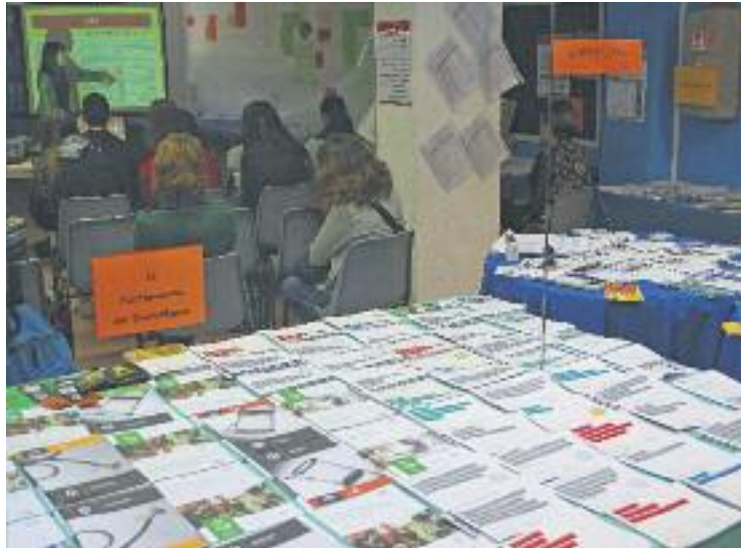
Els joves poden rebre assessorament sobre el seu futur.

L'horari d'obertura al públic és els dilluns i dimecres de 5 a 8 de la tarda i els dijous de 10 a 1 del migdia i de 5 a 8 de la tarda, però a banda dels punts d'infor-