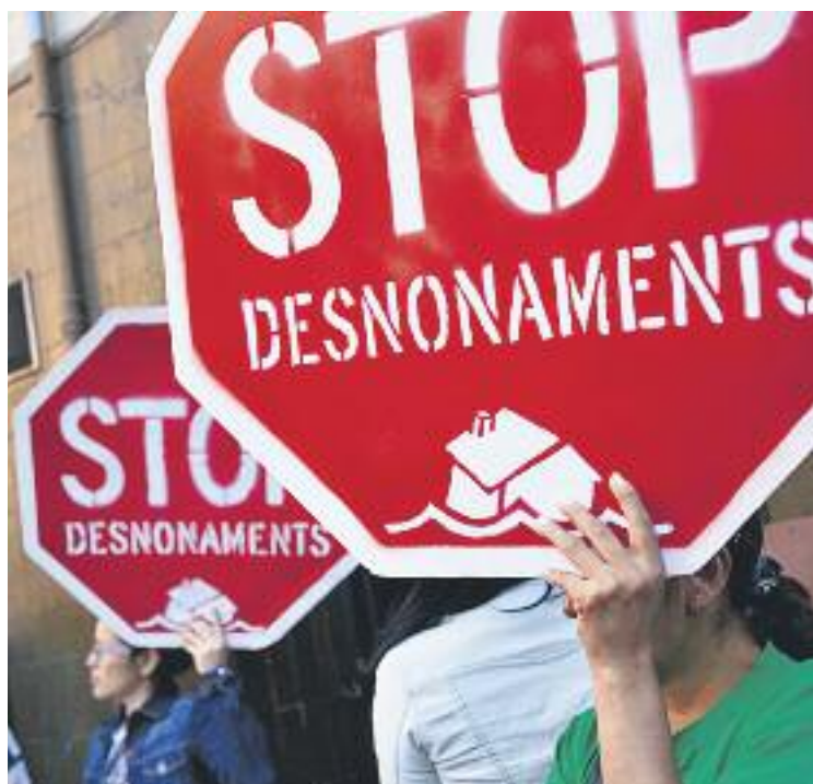
Actualment, els desnonats no poden ser real·lotjats.