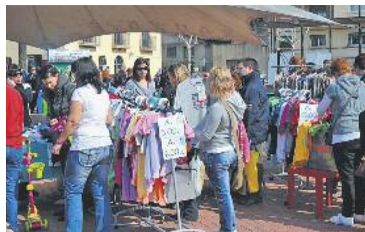
La 17a edició del Firastocks va ser un èxit.

Quan el rellotge toqui les 12 del migdia la cobla La Flama de Farners farà la seva aparició per amenitzar la jornada amb una ballada de sardanes.