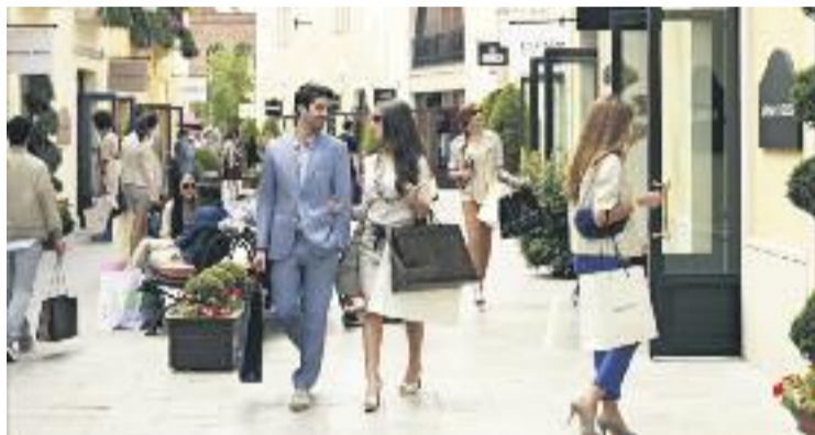
La justícia dóna la raó a l'Ajuntament i l'empresa Value Retail.

El jutge tampoc dóna per bo el recurs de la Confederació de Comerç de Catalunya i considera que la Sala d'Instància "no va infringir les formes essencials del judici" per no haver acordat l'emplaçament de l'entitat a personar-se contra els recursos que l'Ajuntament i l'empresa Value Retail van presentar al seu dia contra el