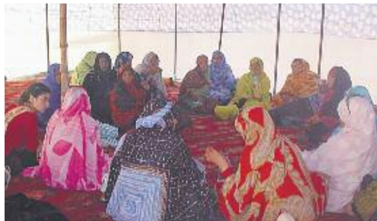
Una reunió de dones sahrauís.

La primera acció del programa, la mostra Dones sahrauís , es podrà visitar a partir de dilluns a la plaça de la Vila.