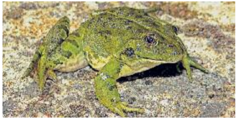
El fong causa la mort als amfibis que el contrauen.

Els avanços per frenar aquest fong estan mobilitzant molts grups de científics de tot el món. Recentment, un equip espanyol ha aconseguit eradicar-lo en una zona de la serra de tramuntana de Mallorca, però encara queda molt per investigar. A la península Ibèrica va ser detectat per primera vegada al Parc Natural de Peñalara el 1997 en el tòtil comú. Des d'aleshores s'han fet estudis que confirmen la seva localització a l'Aragó, País Basc, Comunitat de Madrid, Extremadura, Andalusia i País Valencià.