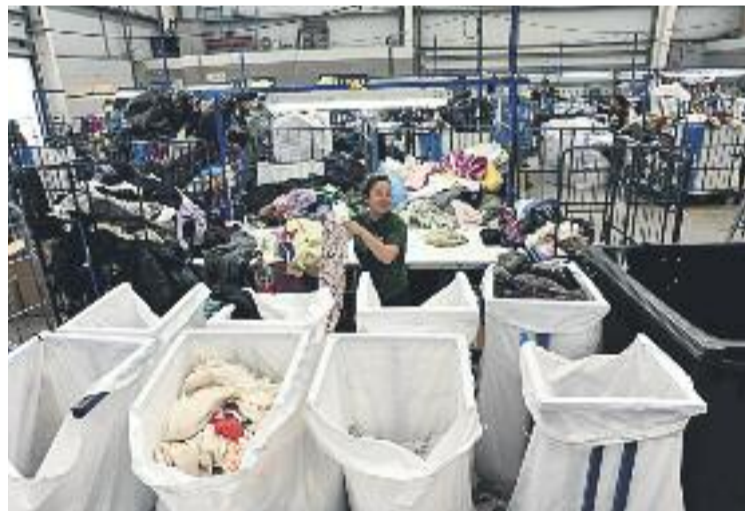
Planta de classificació de peces tèxtils.