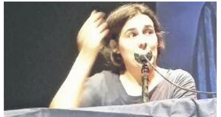
Un dels moments de la conferència.

Aquesta xerrada d'Elisenda Belenguer forma part del Cicle de Conferències que porta a terme el CFA al llarg del curs.