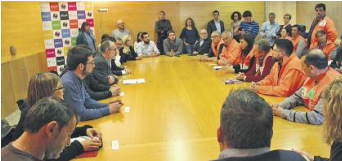
Els alcaldes del Baix Vallès es van reunir amb el comitè d'empresa per conèixer la seva visió.