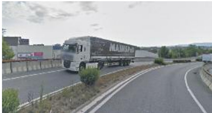
La ronda sud suporta el trànsit de camions que no volen pagar peatge.

Segons la CUP, els índexs de contaminació ambiental a Granollers "són alarmants" i per aquest motiu la ciutat forma part de la Zona de Protecció Especial de l'ambient atmosfèric, àrea on el Pla d'actuació proposa mesures que se centren bàsicament en la reducció del trànsit.