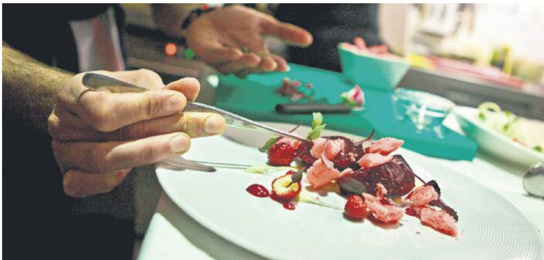
El Gremi d'Hostaleria alerta de la manca de formació en gestió empresarial de les persones que decideixen obrir un local de restauració.