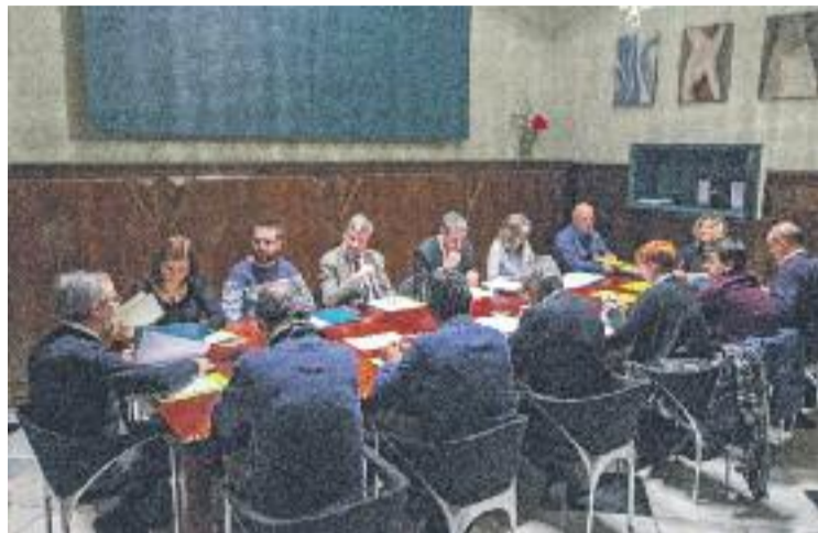
Habitatge i pobresa energètica han fet augmentar les partides.

Pel que fa a l'habitatge i la pobresa energètica, en un principi l'Ajuntament havia destinat 20.000 euros per fer front a les despeses de llum, aigua i gas, però, segons dades del consistori, finalment n'ha gastat 30.355 euros, és a dir un 151% més del previst. Aquests ajuts han beneficiat 494 persones de 134 famí-