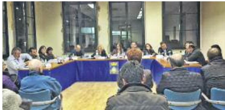
Ple municipal del mes de febrer.