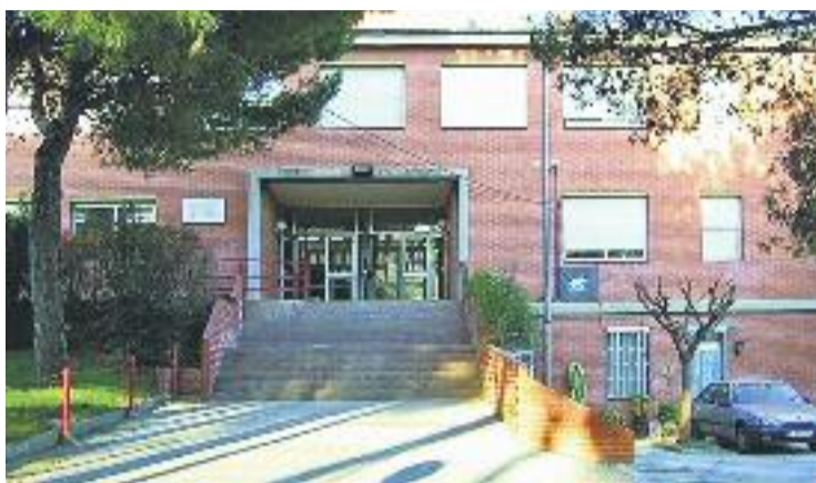
Una imatge de l'escola Pau Casals.

Aquesta xifra, però, s'ha actualitzat i, segons la base de dades del padró municipal, actualment hi ha 85 nens i nenes nascuts el 2013 i que, per tant, hauran de co-