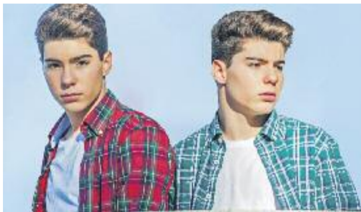
Gemeliers presentaran el seu nou disc Mil y una noches.

Els bessons han publicat també el seu primer DVD Gracias por nuestra primera gira , que inclou la gravació de les seves actuacions a Barcelona i Madrid i les col·laboracions d'India Martínez, Xuso Jones, Jaime Terrón, Calum, Jesús Giles i Aran One, posicionant-se en el número 1 de vendes.