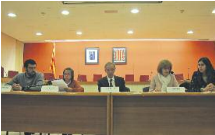
Els infants demanen que trobin els desapareguts.

Els representants dels dos consells demanen a la Unió Europea que posi els mitjans i recursos necessaris per trobar els infants desapareguts, perquè això no segueixi passant i per posar fi a les màfies de tràfic de persones i l'explotació infantil. Igualment, consideren que totes les persones, només pel fet d'entrar en un país d'acollida, "haurien de ser rebudes com a ciutadanes de ple dret d'aquell país, amb els seus drets i obligacions, i no ser considerats uns ciutadans de segona".