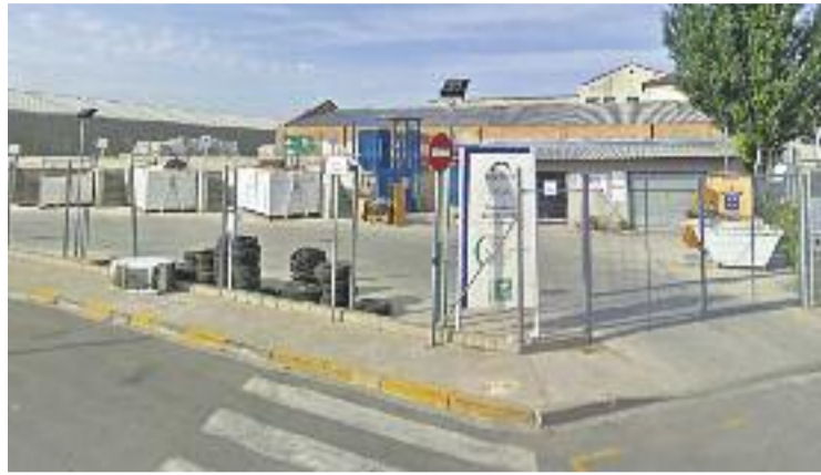
L'any 2015 els llagostencs van produir 4.610 tones de deixalles.

Pel que fa a la deixalleria de la Llagosta, l'any passat va rebre 3.859 usuaris, un 5,4% més que el 2014, que en va rebre 3.647.