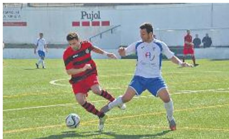
Els blancs van perdre contra el Cerdanyola FC.

GRANOLLERS ▶ Tercera derrota consecutiva. L'EC Granollers continua en caiguda lliure després de perdre diumenge passat contra el Cerdanyola FC (1-2).