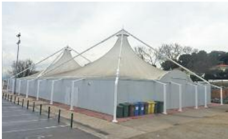
Estat actual de l'Envelat.

Pel que fa a Can Carrencà, amb una superfície afectada de 18.839 metres quadrats, es podran crear o regularitzar nous equipaments públics. Així doncs, a part de la construcció