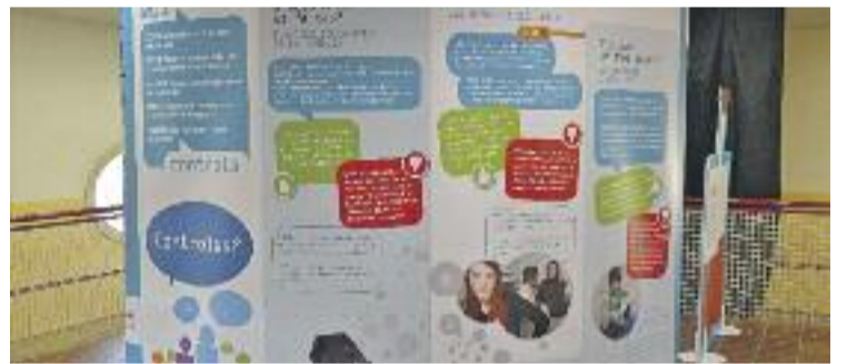
La mostra romandrà a Can Mulà fins a l'11 de març.

EXPOSICIÓ ▶ Els riscos de les drogues i com prevenir-ne el consum són els protagonistes de la nova exposició itinerant de la Diputació de Barcelona que acollirà fins al pròxim 11 de març la Biblioteca Can Mulà. Sota el títol Control·la? la mostra s'adreça als adolescents, joves, famílies i professionals implicats en aquest sector i es complementarà amb diferents activitats que es duran a terme als centres educatius.