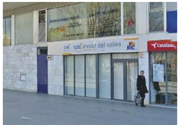
Les reunions es faran a la seu de CDC Mollet.

Des de Convergència recorden que quan es va fundar el partit, fa 40 anys, els principis eren "fer país, fer democràcia i fer benestar", i ara asseguren que aquests valors han evolucionat cap a "fer Estat, fer llibertat i fer més progrés i justícia social".