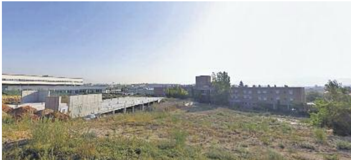
C's demana que es reconverteixin en aparcaments els terrenys on s'havien de construir els jutjats.