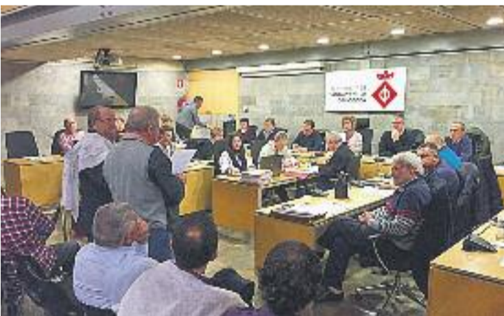
Una imatge del Ple celebrat ahir.

En aquesta proposició també se suggereix la creació d'una normativa municipal que reguli "la instal·lació d'antenes