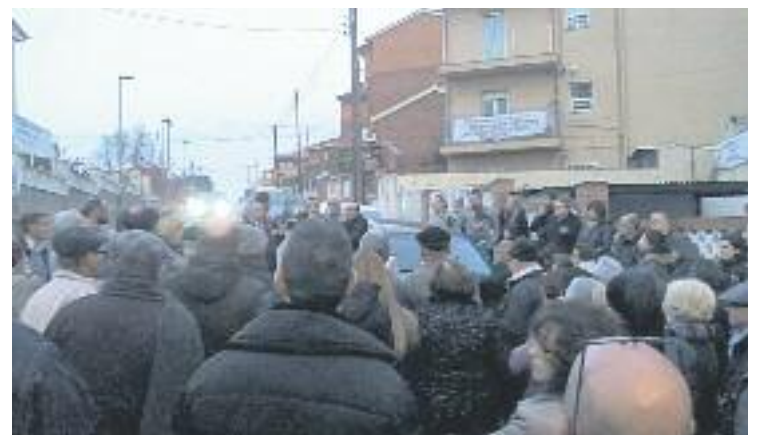
Una imatge d'una de les protestes veïnals.

Per altra banda, des de l'Ajuntament expliquen que la Junta de portaveus vol preparar una proposició sobre l'antena que es presentaria al Ple de dijous que ve.