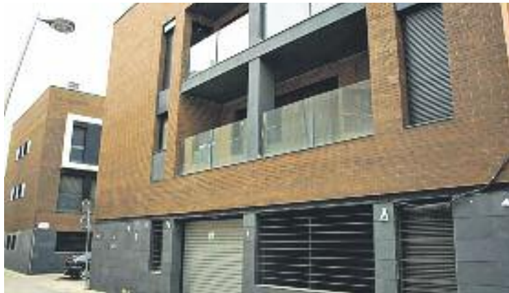
ERC demana nous barems econòmics per accedir als ajuts de l'IBI.

per la seva banda, especifica que cal que es faci "una nova regulació dels barems econòmics exigits, més publicitat d'aquesta proposta i que se'n puguin beneficiar també altres col·lectius socials, com els pensionistes que cobren poc, les persones que destinen pisos a lloguer social i les famílies monoparentals".