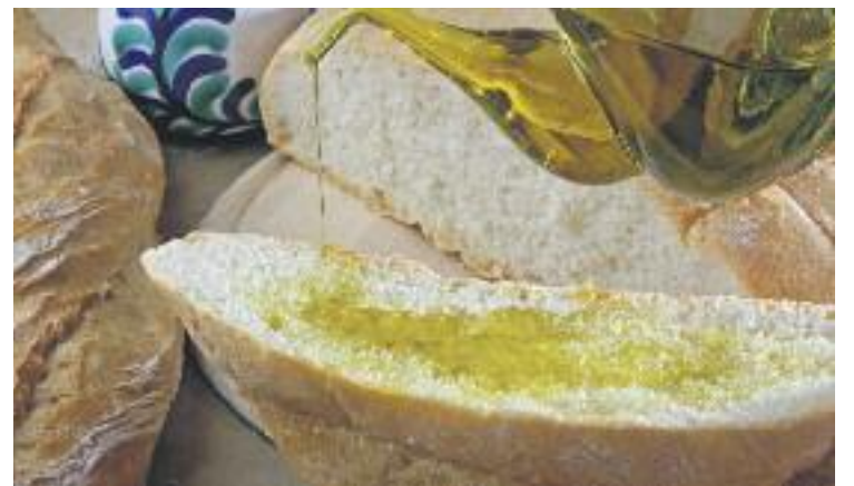
S'explicarà als visitants les particularitats de cada producte.

La Fira inclourà, a més de les parades, una carpa d'activitats gastronòmiques relacionades amb els productes protagonistes. Així doncs, es faran diferents tallers i l'exposició Els altres olis comestibles , que comptarà amb la presència de dos experts de l'Herbolari de Sau.