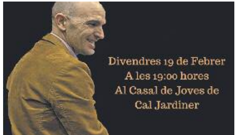
L'alcalde es reunirà amb els joves a Cal Jardiner.

Una hora abans de la trobada, que es farà al Casal de Cal Jardiner a les set de la tarda, es portarà a terme la Factoria d'Idees , adreçada a joves de 14 a 30 anys, en la qual els assistents podran fer totes les aportacions que creguin convenientes.