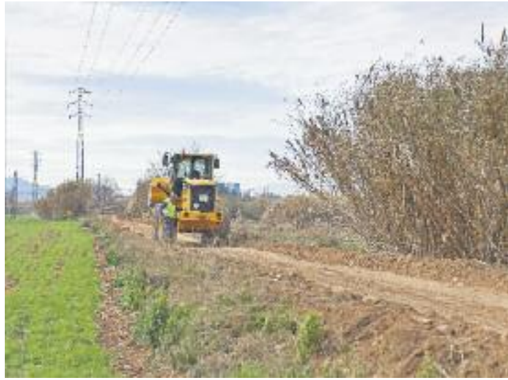
Les obres tenen un cost de 118.000 euros.

El punt fort d'aquest projecte, però, és l'obertura del tram final del camí, fins ara totalment inaccessible. Es tracta d'un pe-