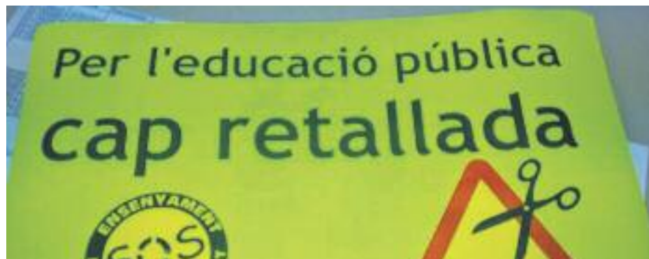
Les AMPA dels diferents municipis de la comarca es preparen per demanar a Ensenyament que no tanqui més línies de P3.