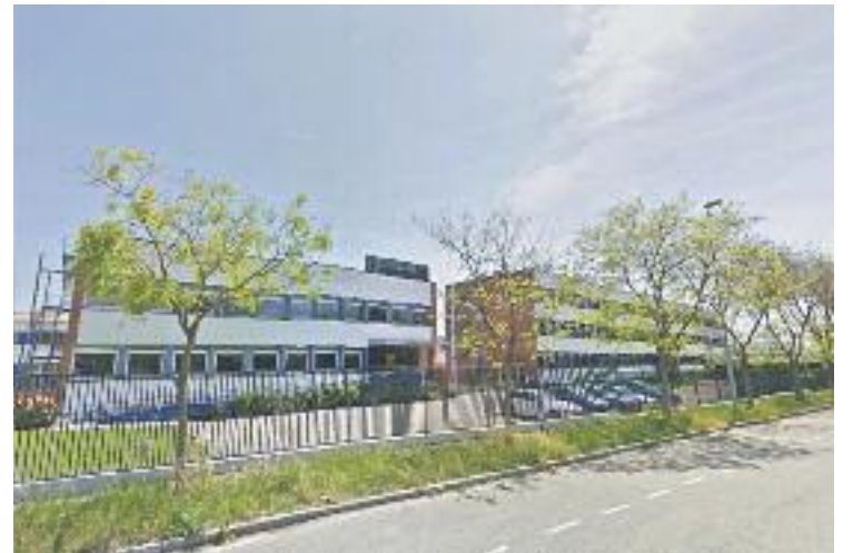
Bacardi vol acomiadar 82 treballadors de la planta de Mollet.

Aquest matí a les 12 del migdia s'ha convocat una assemblea informativa amb la plantilla, en la qual es proposarà un calendari de mobilitzacions.