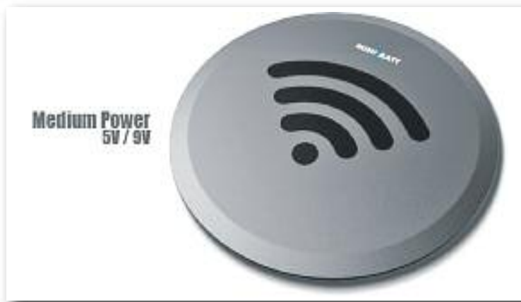
Minibatt presentarà el primer carregador del món sense fils.

En un principi, MiniBatt es dedicava a fabricar components per a l'automoció. El 2012 va començar a treballar en el camp dels bancs d'energia portàtils que permeten posar en marxa una bateria descarregada d'un cotxe. Aquesta tecnologia és la que ara aplica als mòbils.