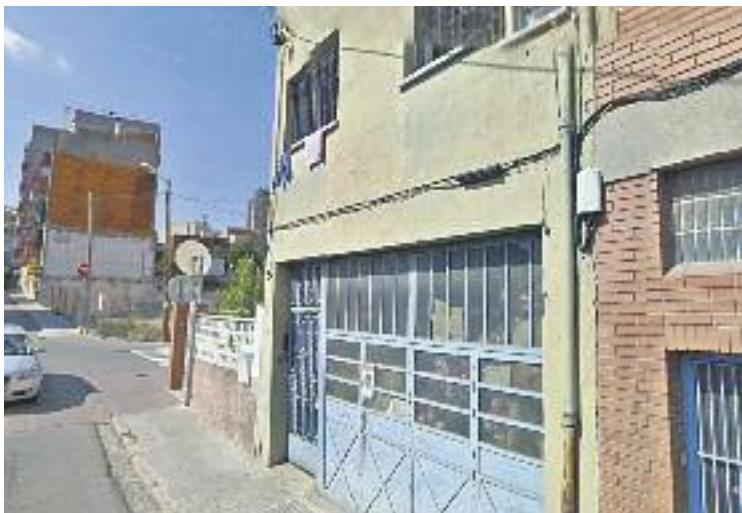
El desnonament s'ha ajornat fins a l'1 d'abril.

HABITATGE ▶ Avui a les 11 del matí s'havia de fer el desnonament d'una família de dos adults i dos nens que viuen de lloguer al carrer Sol, però de moment no es farà. Arran de les accions de la PAH i de l'Ajuntament, la jutgessa del jutjat número 1 d'instrucció l'ha ajornat fins al pròxim 1 d'abril. Un termini que, segons els afectats, hauria de servir perquè el consistori els pugui oferir un habitatge de lloguer social d'entre els pisos