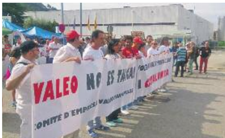
Els treballadors de Valeo van fer 101 dies de vaga indefinida.

En la seva proposta, Sintex garanteix la contractació de 100 treballadors en les condicions acordades en el marc dels compromisos de reindustrialització, com són la garantia d'ocupació d'un mínim de tres anys, vinculació al conveni sectorial i abonament de les indemnitzacions acordades per part de Valeo.