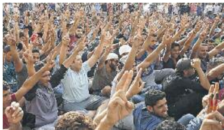
Santa Perpètua enviarà més de 130 caixes de roba a França.

Durant la campanya s'han recollit bàsicament mantes, mitjons, pantalons, pijames i jerseis, tant per a adults com per a nens.