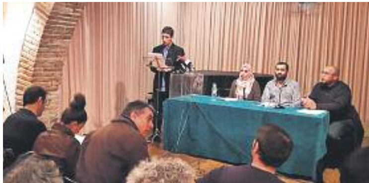
Lectura del manifest de les comunitats islàmiques.

Fent referència als centres de culte del carrer Sant Ramon i del polígon Can Prat, que en els darrers anys han generat polèmica a l'hora d'establir-se a la ciutat, els membres de les dues comunitats remarquen que no vo-