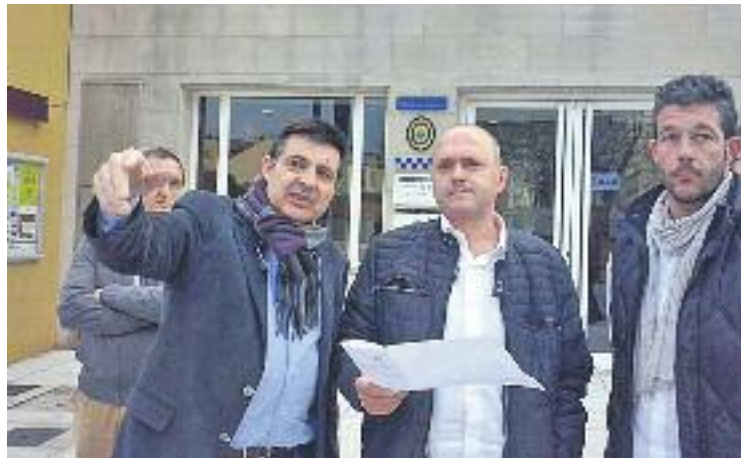
Guil i Fàbrega durant un moment de la seva trobada.

En aquesta primera fase s'han fet diferents remodelacions a l'avinguda de Pompeu Fabra entre el passeig de Miquel Biada i el carrer del Dr. Ferran, per un import que ronda els 1,1 milions d'euros. Ara es començarà a redactar el projecte de la segona fase i està previst que les obres per reurbanitzar el tram que va des del carrer Primer de Maig fins al carrer de Folch i Torres comencin l'any que ve.