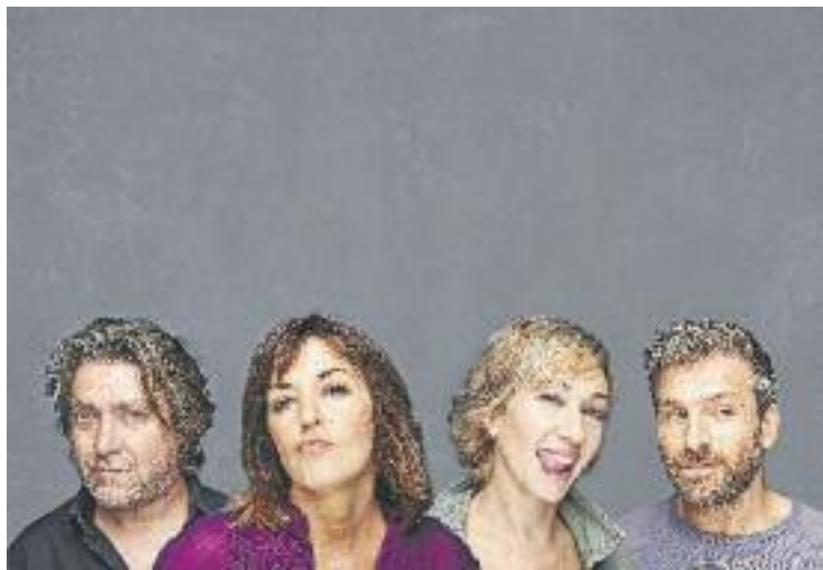
'Els veïns de dalt' es podrà veure aquest dissabte al TAG.