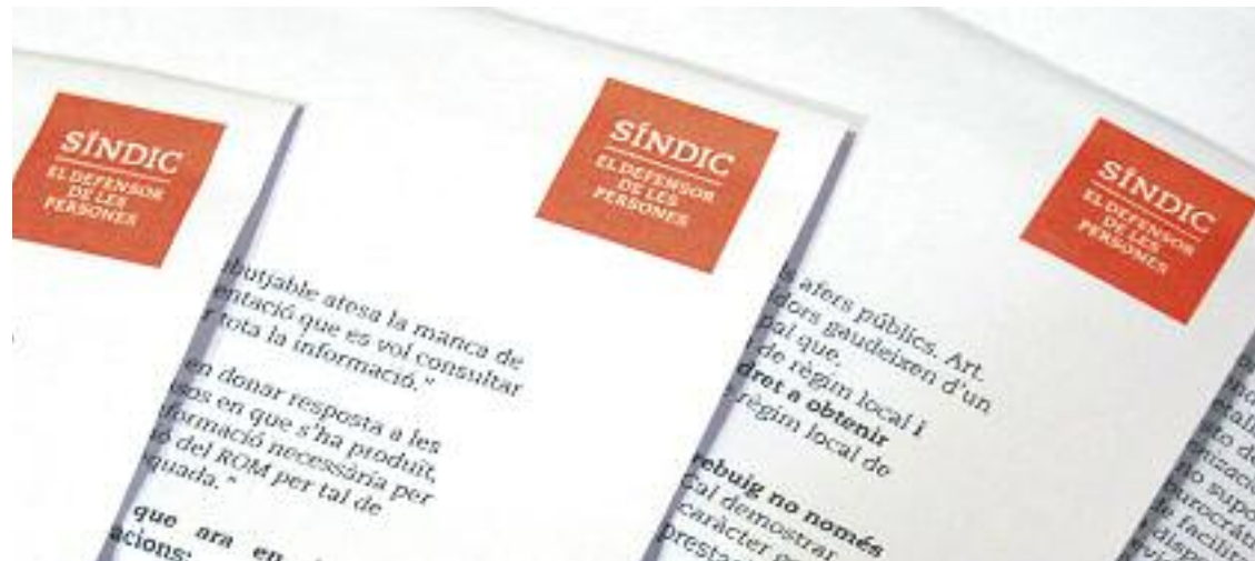
El Síndic fa la petició al consistori després d'haver rebut una queixa d'un veí en aquest sentit.