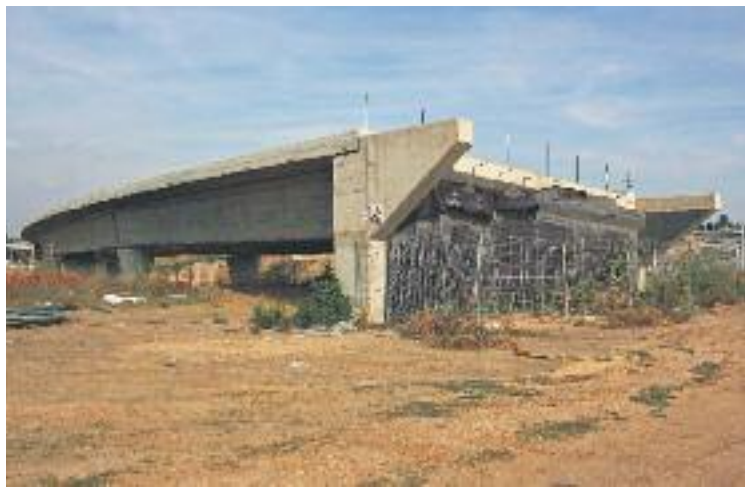
Per ara només s'ha fet una part del tram del Baix Llobregat.

De moment, les excavadores han començat a treballar al tram que va des d'Olesa de Montserrat a Terrassa, per on es preveu que