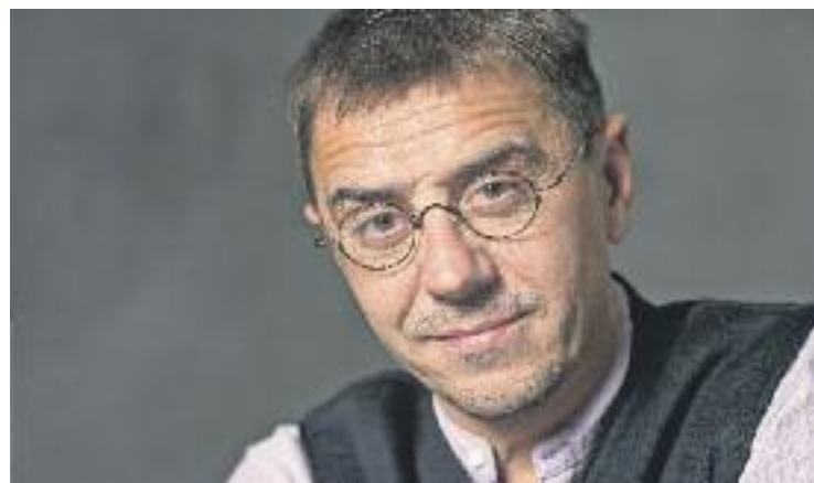
Monedero serà aquesta tarda al Mercat Vell.