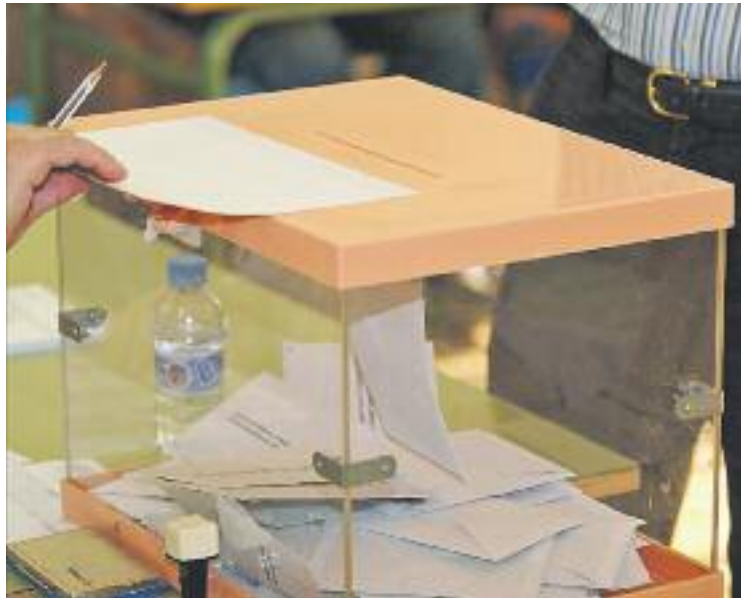
ERC i CDC han presentat una moció que es debatrà el pròxim Ple.

Una vegada realitzada la consulta, si el resultat fos positiu, ERC i CDC demanen que es faci un Ple extraordinari per ra-