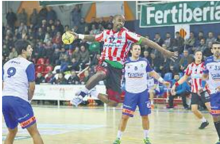
El partit contra els valencians va ser una exhibició ofensiva.

Després de l'amarga derrota que l'equip va patir dissabte passat contra el Dinamo de Bucarest (28-29), l'enfrontament de demà serà vital perquè els va-