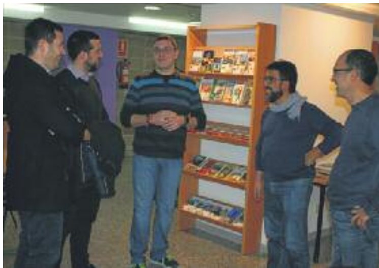
Inauguració del nou Servei d'Informació Juvenil.

Principalment, els joves que s'adrecin al SIJ podran trobar informació acadèmica, laboral i d'oci. De manera gradual, s'incrementaran els serveis amb tallers i xerrades. A més, està previst recuperar també la Viatgeteca , amb informació sobre di-