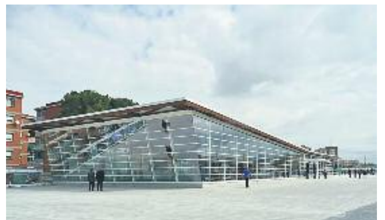
La línia de bus arribarà a l'estació de tren.

Està previst que el recorregut del vehicle comenci a Vallromanes i passi pels altres dos pobles.