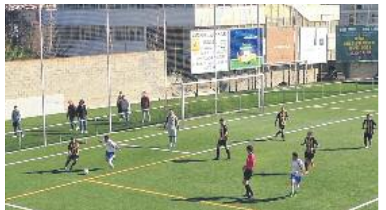
L'equip ha sumat 7 punts dels darrers 24.

GRANOLLERS ▶ Segona derrota consecutiva. L'EC Granollers continua immers en la crisi de resultats que ha fet que l'equip només hagi sumat 5 punts dels darrers 24 que s'han disputat.