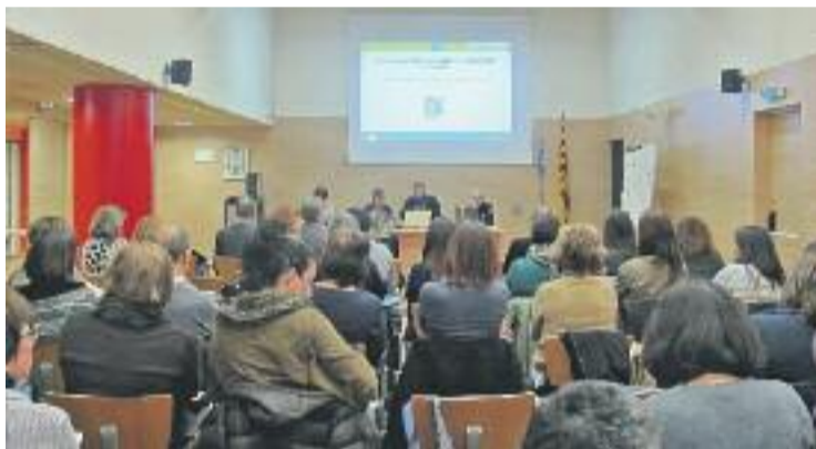
Reunió dels equips directius dels centres granollerins.

A les escoles i instituts de Granollers enguany hi ha 7.139 alumnes matriculats, que cursen entre 1r de primària i 4t d'ESO. Els pares o tutors tenen la responsabilitat de procurar l'assistència regular de l'infant a l'escola i l'Ajuntament té el deure d'actuar si es detecta un cas d'absentisme.