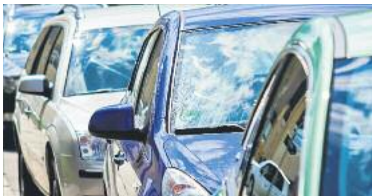
La ronda Sud i la Carretera de Lliçà són els punts amb més soroll.

Des de l'Ajuntament reconeixen que la ronda Sud és un dels punts més preocupants pel que fa al soroll i el portaveu de la CUP, Eduard Navarro, afirma que la construcció del vial "va ser un nyap que va separar el barri