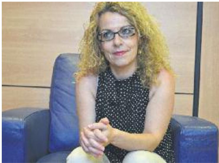
L'alcaldesa haurà de portar els seus números al Ple.

La batllessa va explicar que el consistori vol fer "un esforç per mantenir serveis, tot i que no siguin de prestació obligatòria, com el transport urbà o l'escola bressol" i va presentar les seves iniciatives per aconseguir estalviar en la gestió municipal. Sanmartí va