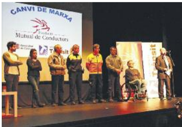
L'activitat s'ha fet al Teatre de Can Gomà.