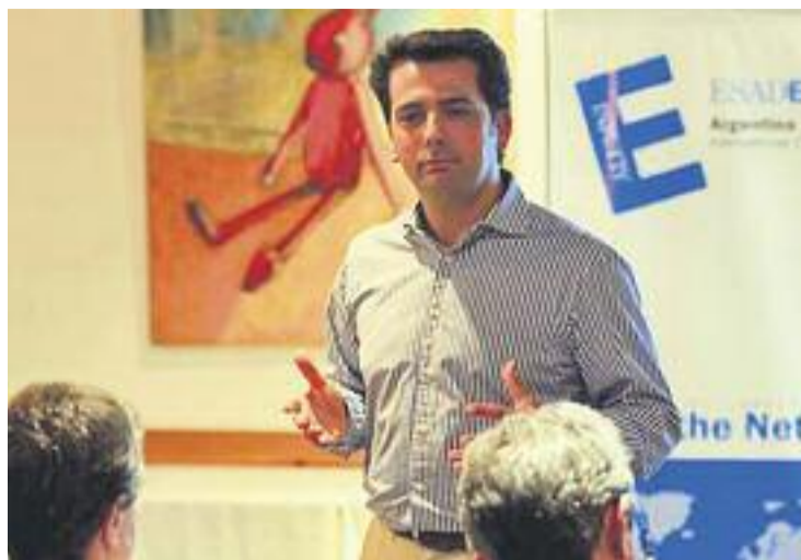
Delgado s'hauria apropiat de 525.000 euros de la Vall de Tenes.