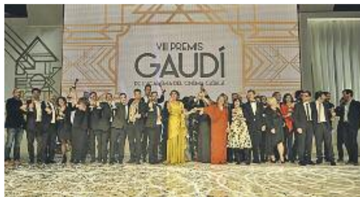
Tots els guanyadors dels VIII Premis Gaudí.

Els Gaudí, però, van tenir més presència vallesana a part de la de Balter Gallart, perquè el garriguenc Lluís Castells es va endur la figureta a millors efectes especials també per Anacleto: agente secreto .