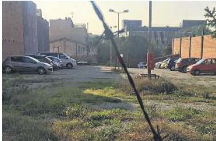
L'aparcament que lloga Socors Mutus.

Des de la plataforma asseguren que la FSM "va renunciar a prestar el servei de rehabilitació a l'Hospital i ho va derivar a un centre privat concertat (Fisiogestió) que presta servei en uns locals propietat del president de la Fundació". Segons la plataforma, "aquest centre rep 7.300 euros mensuals de l'Hos-