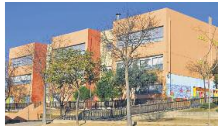
L'Ajuntament ha reclamat millores per a l'Escola Santa Perpètua.

La vila ja té experiència en aquesta mena d'iniciatives, com l'Agenda XXI de Medi Ambient.