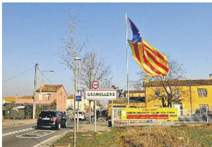
Nova estelada a l'entrada de Palou.