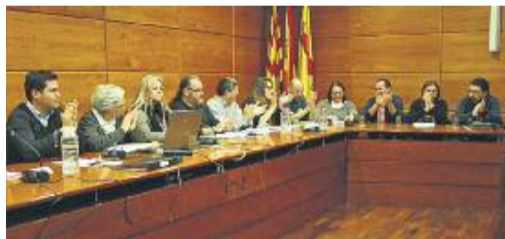
Una imatge del Ple durant el qual es va aprovar la moció.

Amb l'aprovació d'aquesta moció, l'Ajuntament també es compromet a penjar la bandera gai el 28 de juny -Dia de l'Orgull Gai- i l'1 de desembre -Dia de la Lluita contra la Sida-.