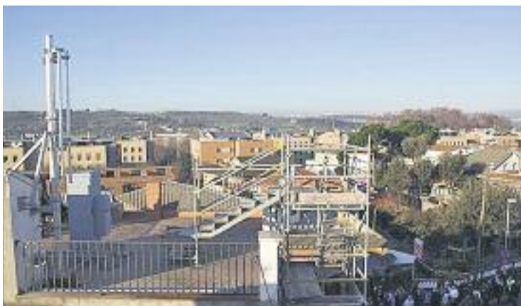
Una imatge de les obres de l'antena.

A causa del canvi de normativa de 2014, el consistori no té "instruments jurídics ni legals per autoritzar o no aquesta mena d'instal·lacions", però en els darrers dies i després de les repetides mobilitzacions dels veïns, l'Ajuntament ha recopilat la documentació de l'edifici i podria paralitzar les obres si detecta qualsevol mena d'irregularitat.