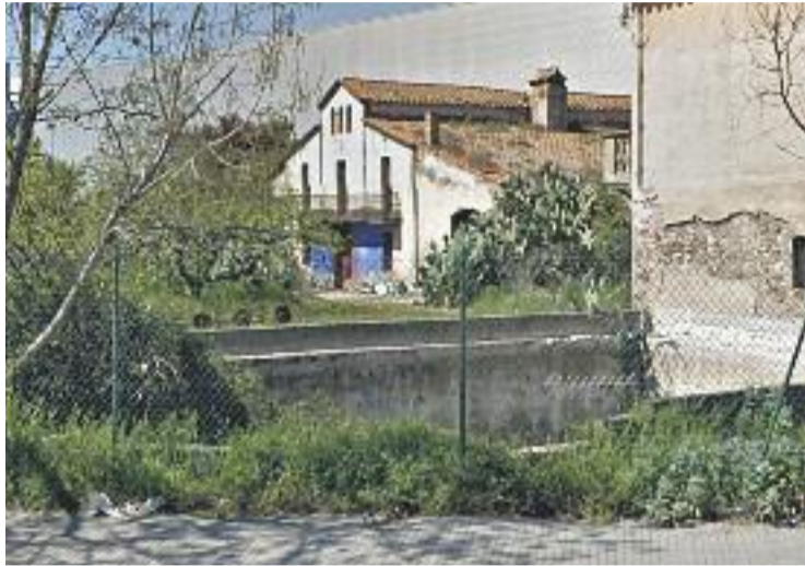
Una imatge d'arxiu de la masia de Can Cot.

Documentada des del segle XV, Can Cot és una de les masies més antigues del municipi, és una edificació catalogada i protegida i està qualificada de zona d'equipaments comunitaris. La masia té una superfície de prop de 1.200 metres quadrats i l'edifici auxiliar prop de 200 més. Va passar a propietat municipal com a part de les cessions fetes per l'empresa Gráficas de Prensa Diaria, del Grup Zeta, per la reparació del sector que es va fer a finals dels anys 90. El darrer propietari va ser l'artista de Parets Pepet Ribas, que hi va néixer. En el moment de rebre la cessió es va plantejar la possibilitat de fer-hi un museu del còmic o