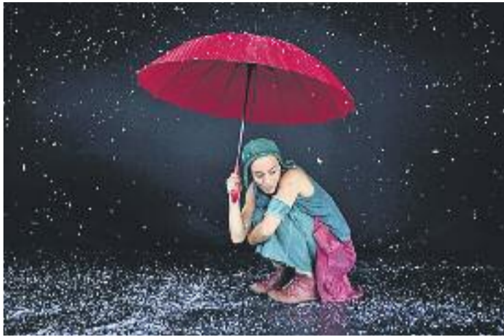
La ballarina francesa serà a Montmeló dissabte que ve.

En aquesta obra la ballarina es posaa la pell d'una rodamón que converteix tot el que l'envolta (un parc, un pont o una escultura) en un univers fantàstic,