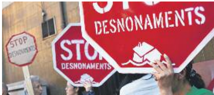
A Granollers hi ha 350 habitatges buits propietat de grans tenidors.