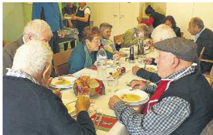
El consell defensarà els drets de la gent gran.

L'Ajuntament vol impulsar aquest organisme en el marc del PAM 2015-2019 per establir un programa d'envelliment actiu en el qual s'impulsin activitats com intercanvis amb casals d'altres municipis i tota mena d'accions per ajudar la gent gran a envellir saludablement.