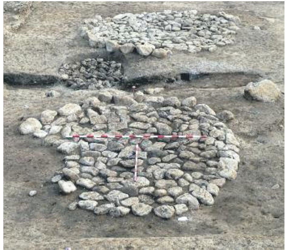
Aquest tipus de jaciment és únic a Catalunya i un dels pocs que hi ha a Espanya i a Europa.