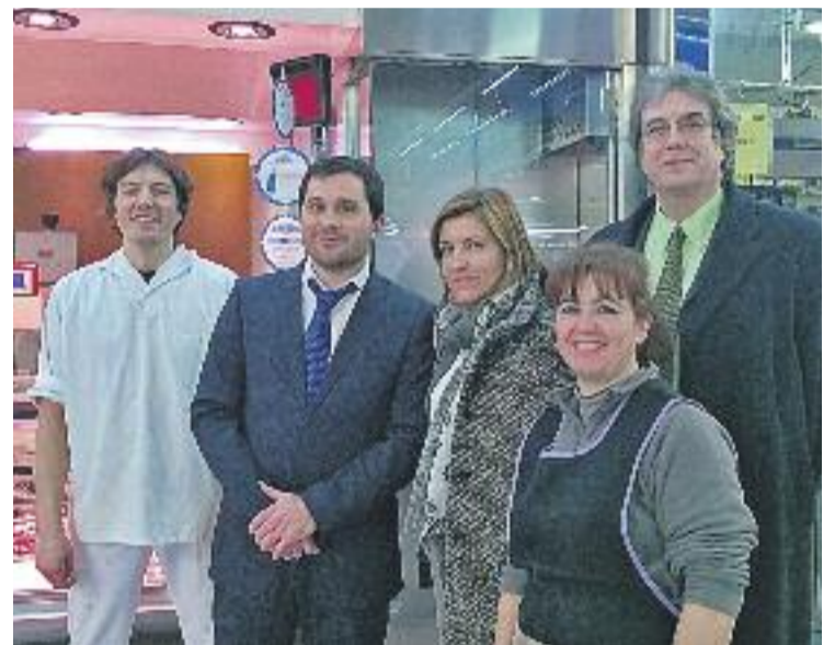
Presentació de la iniciativa al mercat municipal.

Segons Caixabank, "la iniciativa se situa dins de les accions de suport al petit comerç i de foment dels nous mitjans de pagament que l'entitat ha engegat, tant per a clients titulars de mitjans de pagament de l'entitat com per a comerços".