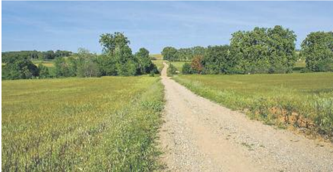
Circular amb vehicles de motor per Gallecs està prohibit.