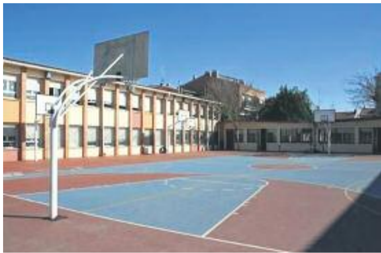
L'escola Sagrada Família seria un dels centres afectats.

En la trobada que s'havia de celebrar ahir estava previst que Ensenyament i l'alcalde abordessin la situació i Sierra volia transmetre a la Generalitat la disconformitat del consistori i de