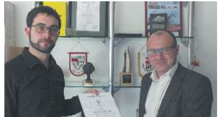
Moment de la renovació del certificat.

El fet d'estendre la certificació als serveis que ofereix SECE va permetre que l'Ajuntament de Martorelles fos pioner a Catalunya en obtenir un certificat d'aquest tipus.