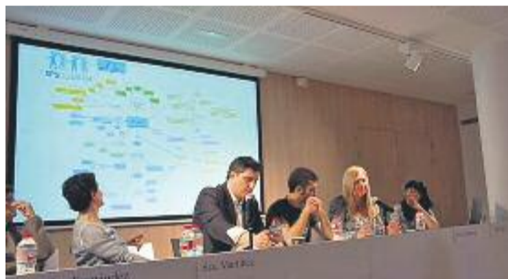
Jornada sobre codesenvolupament.

L'objectiu final d'aquest projecte seria crear les bases per a la institució d'una xarxa de treball, intercanvi d'experiències, incidència i elaboració d'estudis en temes de codesenvolupament.