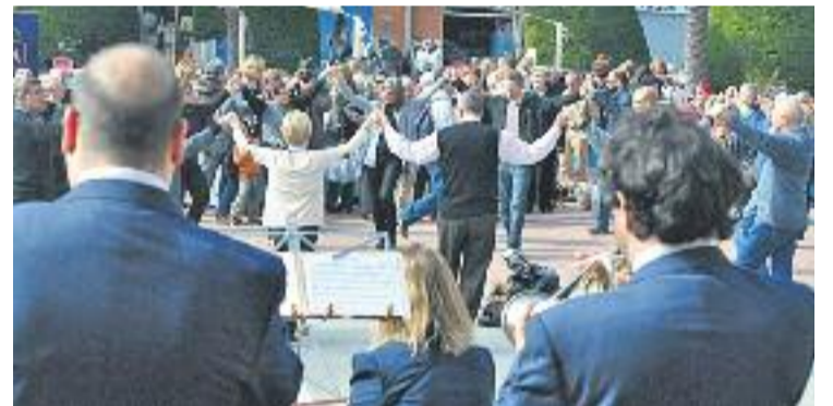
Una imatge de la ballada de sardanes de l'any passat.

L'Aplec d'enguany se celebrarà als Jardins de la Torreta i hi participaran la Cobla Ciutat de Girona, la Jovenívola de Sabadell i la Principal del Llobregat.