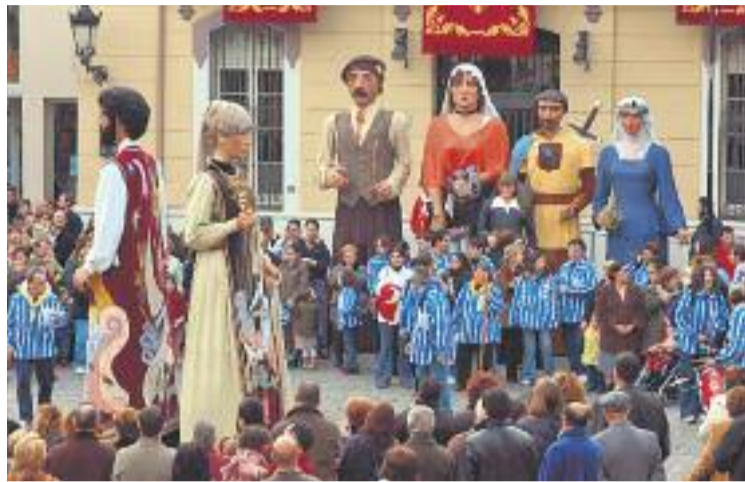
Els gegants són una peça clau de la festa.

Per altra banda, un dels actes que més participació va aple-