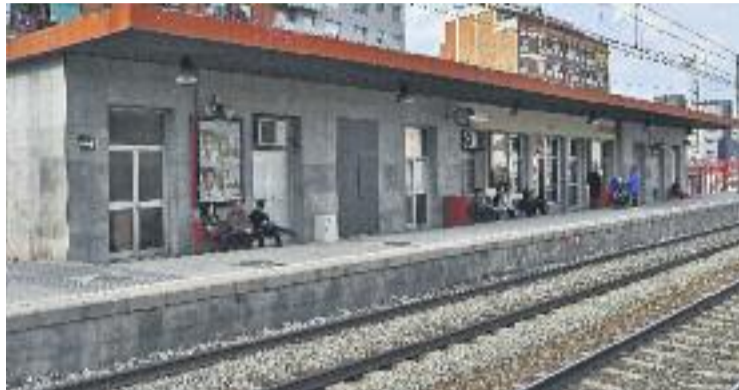
El robatori de coure va provocar el tall de l'R2, l'R11 i l'R8.

Segons informa Adif, "per motius tècnics i amb l'objectiu de facilitar els treballs de restabliment de la circulació habitual a la línia R8", des d'ahir i fins dissabte el servei d'aquesta línia entre Cerdanyola Universitat i Mollet Sant Fost es presta a intervals. Així doncs, entre les vuit i les cinc de la tarda, el tren circula entre Martorell i Mollet i entre Martorell i Cerdanyola Universitat. La resta del dia, el servei s'ofereix per carretera. Dilluns es mantindrà el servei de les darreres setmanes i entre les vuit del matí i les vuit del