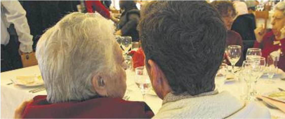
L'Ajuntament ha donat ajuts per a l'alimentació, les persones grans i els subministraments, entre altres.