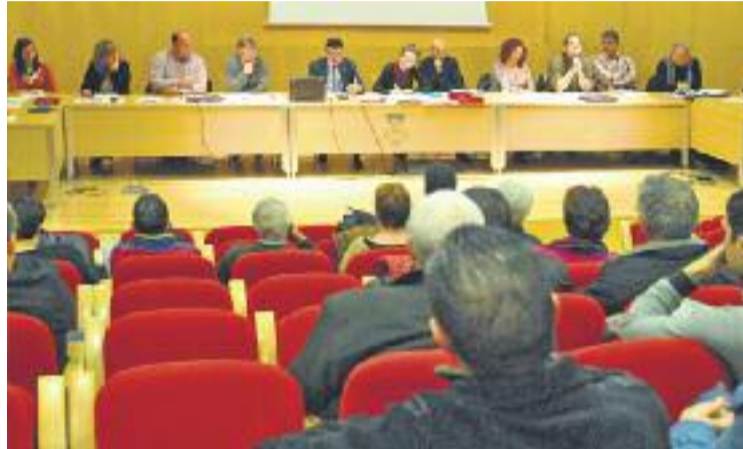
Els comptes es van aprovar en el darrer Ple municipal.

Fons de la regidoria d'Economia remarquen que el pressupost insisteix a aconseguir "la màxima eficiència, tot aplicant polítiques d'estalvi energètic, negociació dels contractes de manteniment i l'aplicació