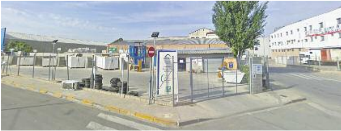
Les 150 persones beneficiàries rebran una bonificació del 10% en el rebut de les escombraries.