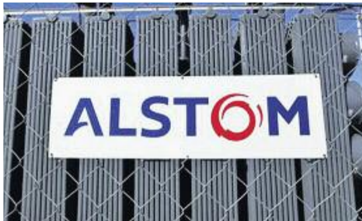
L'ERO temporal estava vigent des de l'any 2014.

Des d'Alstom afirmen que "amb els encàrrecs rebuts en el darrer any s'ha incrementat la càrrega de treball en les àrees d'enginyeria i els tallers de caldereria i pintura", cosa que ha fet que aquestes àrees s'hagin hagut de reforçar amb la contractació de fins a 60 persones en els darrers mesos. Segons vagi avançant el procés de fabricació dels projectes que estan en curs, "s'ampliarà també la càrrega de treball als tallers d'acabats i electricitat". Per tot això, Alstom