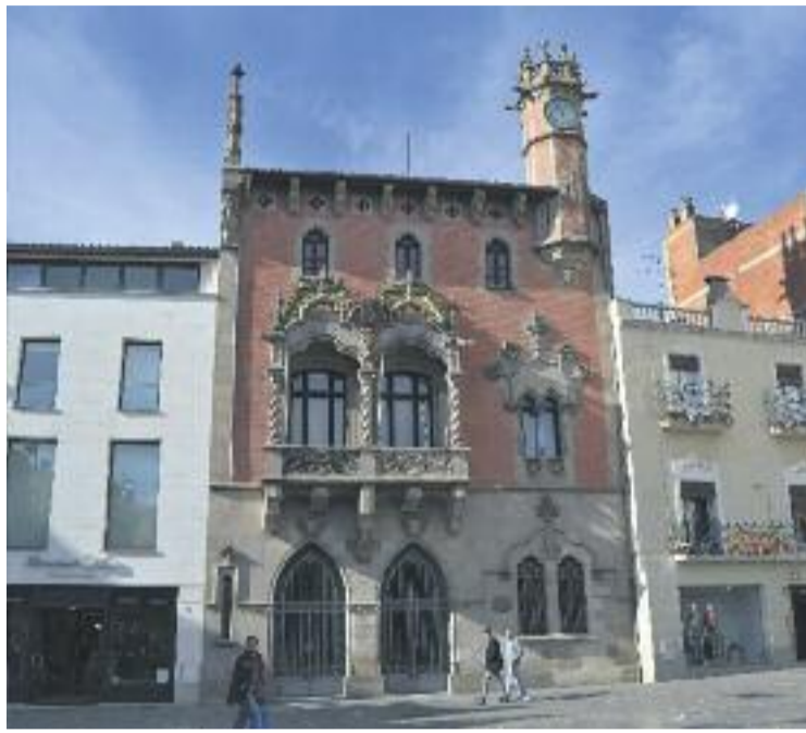
La mesura va ser aprovada pel Ple de l'Ajuntament.

La moció, presentada per la CUP, recorda que, "des de l'inici de la crisi, les rendes de les famílies catalanes han fet una caiguda que duplica la de la mitjana de la UE" i afegeix que "Catalunya és dels països on més han augmentat les desigualtats". La CUP també assenyala que "el poder adquisitiu d'un percentatge rellevant de granollerins s'ha vist reduït", conseqüència de la política de reducció de jornades i salaris i de l'increment dels imports dels serveis bàsics, "fins a xifres properes als límits imprescindibles per a la subsistència". Per aquest motiu, i conseqüència de la lògica de prioritat de despesa,