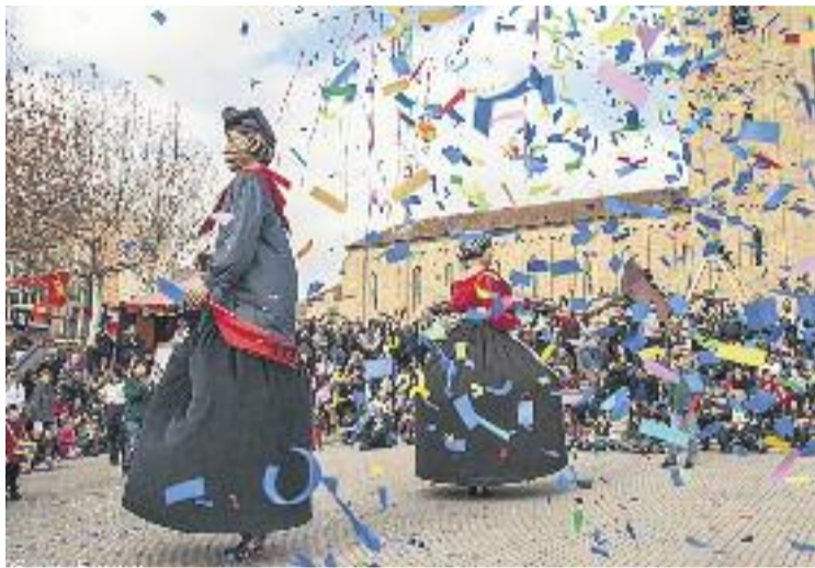
Enguany hi ha hagut més participació que l'any passat.

Entre les activitats amb més afluència de públic va destacar, sens dubte, el Mercat Medieval, que enguany ha incrementat el nombre de visitants tant en els espectacles dels diables i els gegants com en les exhibicions d'aus i cavallers. Altres activitats que també han comptat amb molta afluència de públic han estat el Canta Parets! , amb 900 assistents, la XIX Calçotada Popular, amb 700 comensals, i el Concert Jove, que a més dels prop de 600 assistents també va