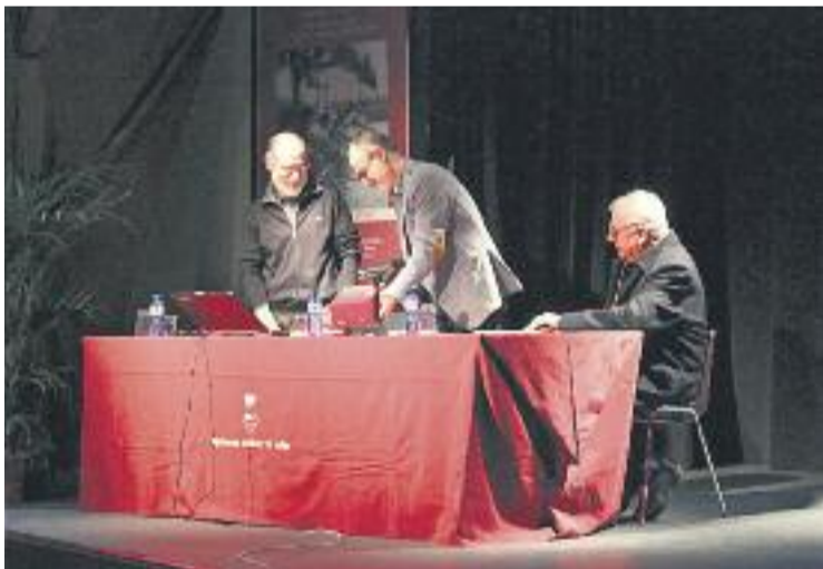
Fort s'acomiada després de quatre anys en el càrrec.