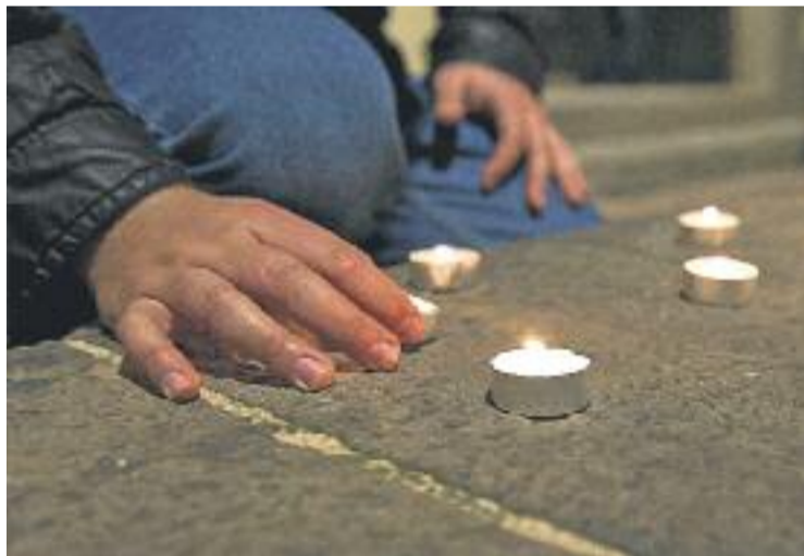
Els assistents van encendre espelmes en record de les víctimes.