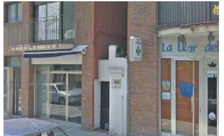
Els Bombers van necessitar gairebé una hora per apagar el foc.

En les tasques d'extinció de l'incendi hi van treballar sis dotacions dels Bombers de la Generalitat, que al voltant de dos quarts de set de la tarda van poder donar el foc per controlat.