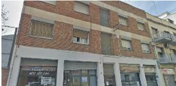
L'edifici del qual serà desnonada la dona de 87 anys.

Segons la sentència, l'impagament d'aquest rebut per part de la llogatera a la propietària del pis, que sí que ha fet el pagament a l'Ajuntament, "és causa més que suficient per trencar el contracte que hi ha entre ambdues parts". El tribunal interpreta que el pagament de la taxa de recollida d'escombraries "ha d'assumir-lo l'arrendatari, tant per tractar-se d'un servei en el seu benefici exclusiu com per mandat legal". D'aquesta manera, la Sala Civil del Tribunal Suprem ha dictat