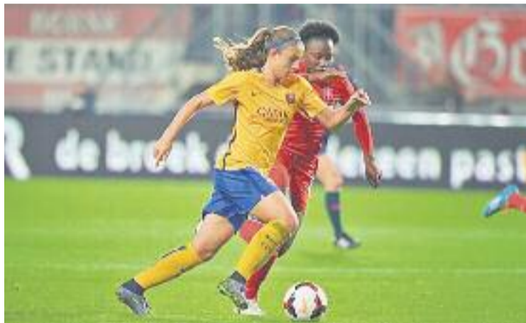
Alèxia Putellas ha estat la millor futbolista catalana de l'any.