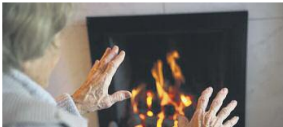
Moltes famílies no es poden permetre un gest tan senzill com prémer l'interruptor o encendre l'estufa.