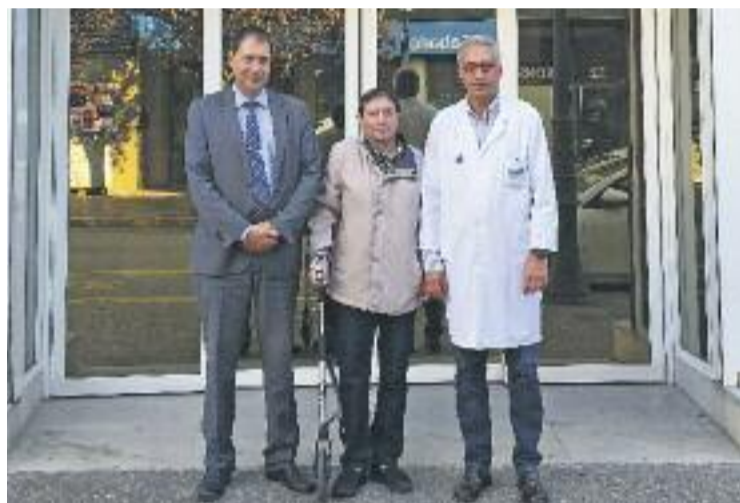
El treballador va caure d'una altura de vuit metres.

A Catalunya, durant el passat exercici, la Comissió de Prestacions Especials d'Asepeyo va atorgar 1.187 ajudes socials a treballadors que han patit un accident de treball o una malaltia professional. L'import total de les ajudes concedides l'any passat al país supera els 2,48 milions d'euros.