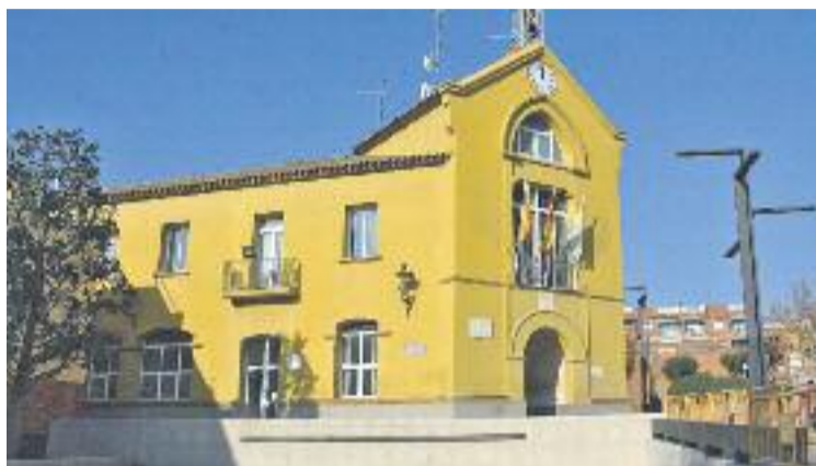
El pacte permet que el PSC deixi de governar en minoria.