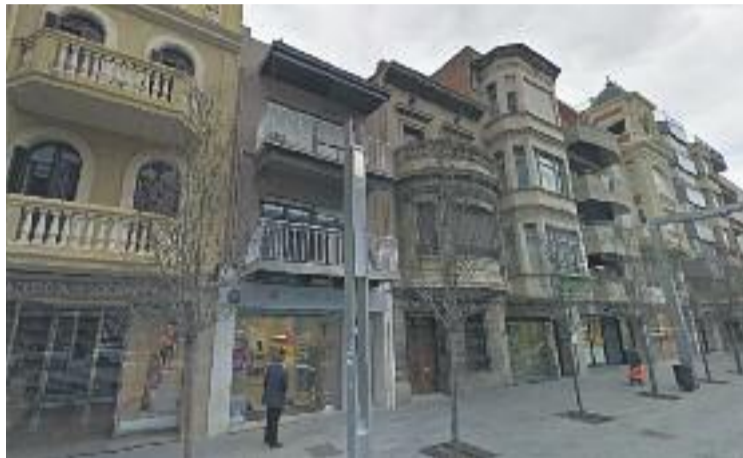
La nova norma canvia els colors per uns una mica més vius.

ERC, CiU, PP i C's s'han abstenut en l'aprovació de la normativa perquè creuen que el fet que sigui "tan restrictiva" fa necessari que s'hagi de separar de la resta de la llei i votar-se a banda. La Crida per Granollers-