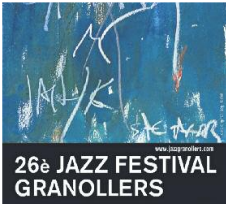
Fins al 4 de març s'han programat quatre concerts.