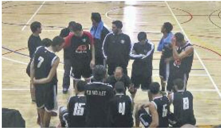
L'equip negre no va puntuar en la visita a Can Serra.

El Mollet va aconseguir obrir esclatxa en el marcador ben aviat, però els barberencs van retallar el parcial de 0-8 favorable per situar un 12-13 al final del primer quart. A poc a poc, els barberencs van