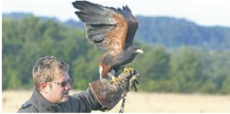
Els falconers han tornat a l'espai rural de Gallecs.

L'any 2012, arran de la presència intensiva de falconers a l'espai rural de Gallecs, l'Ajuntament va aprovar el Reglament d'Espais Verds i Zones Naturals que, entre altres, prohibia