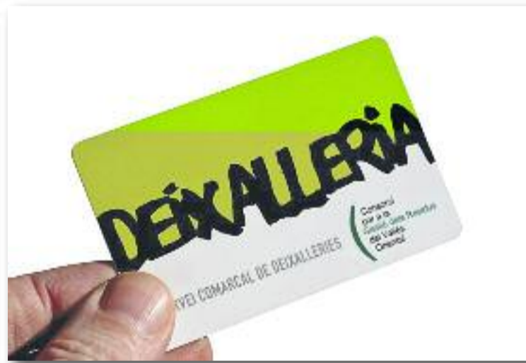
Per aconseguir bonificacions s'ha de tenir la targeta de la deixalleria.