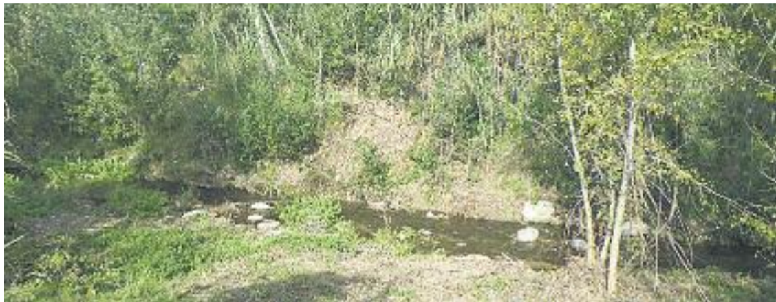
Els arranjaments s'han fet a Bigues i Riells i a Santa Eulàlia de Ronçana.