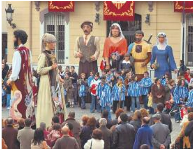
Els actes s'allargaran fins al 29 de gener.

A partir d'aquí, s'iniciarà un ampli programa d'activitats del qual formen part altres cites ineludibles com són els espectacles de l'Esbart Dansaire de Mollet, que acollirà el Teatre Can Gomà dissabte 16 i diumenge 17, el Correfoc (8 de Foc i el Ball del gegant Vicenç amb el Moll Fer i ball del Moll Fer acompanyat amb Ball de diables de Mollet) de dissabte 23 o la XXII Trobada de Gegants. El dia 24 es farà el Memorial Josep Pujol al Parc de les Pruneres amb la participació de les colles de Santa Perpètua de Mogoda, Montmeló, Piera, Varcariques, Les Borges Blanques,