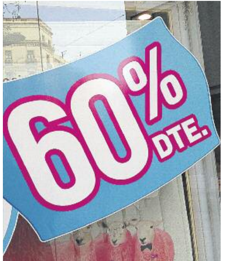
Els descomptes oscil·laran al voltant del 40%, tot i que alguns comerços en faran de més grans.