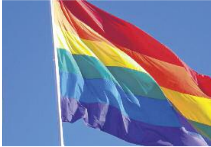
El Ple votarà la moció d'ERC el pròxim dijous.

Entre les demandes més destacades de la moció republicana hi ha la de declarar Parets municipi respectuós amb la diversitat sexual i amb la realitat de lesbianes, gais, transsexuals, bisexuals i intersexuals; informar a la ciutadania sobre la pluralitat afectiva-sexual i les famílies homoparentals; la redacció d'un Pla local contra l'homofòbia, la lesbofòbia, la bifòbia, la trans-