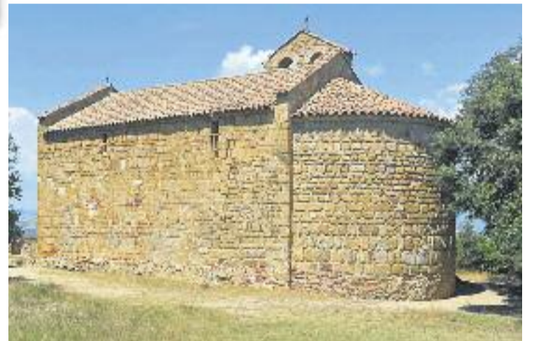
Es mantindrà la difusió de l'església de Sant Cebrià de Cabanyes.

Les darreres aportacions del CES-Amics de Cabanyes han estat la reproducció del retaule gòtic de Cabanyes que està al MNAC i la publicació del 18è "Campsentelles".