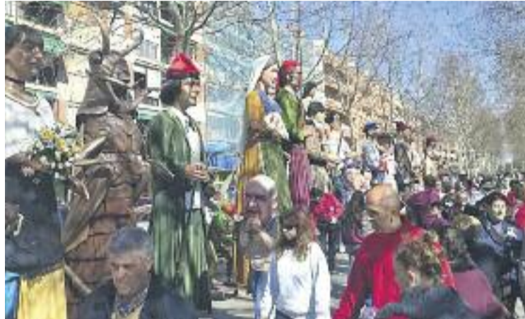
Els gegants en una trobada de l'any passat.

El 16 d'abril se celebrarà la segona Cursa de Gegants. En aquesta ocasió portaran els seus gegants, gegantons i capgrossos les