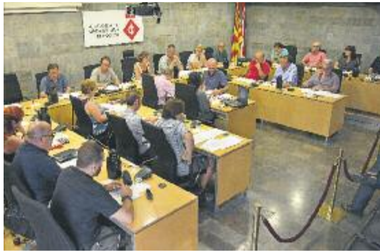
El Ple va aprovar la mesura en una sessió extraordinària.

Tots els grups municipals es van mostrar a favor de presentar l'EDUSI a la convocatòria FEDER 2015-2016, però la