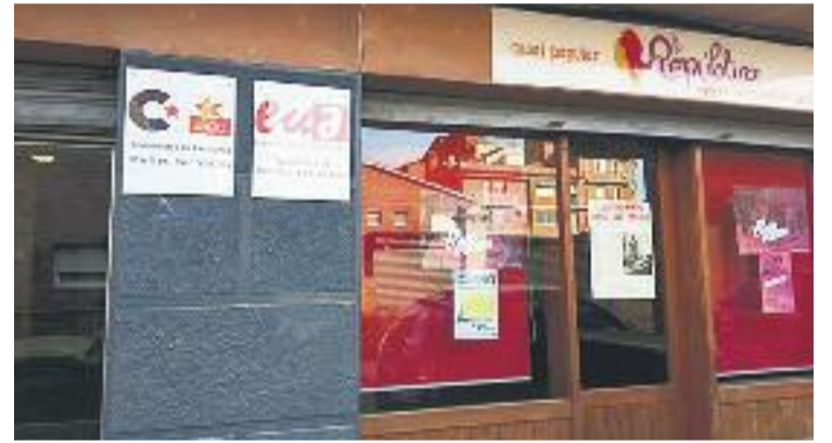
La nova seu també és un casal popular.

La sala Pere Ardiaca és propietat de Comunistes de Catalunya, cosa que ha permès que les diferents entitats de l'òrbita de l'esquerra puguin establir en aquest espai les seves seus i estalviar-se els lloguers que pagaven. El local, per tant, també serà la seu social de Comunistes de Catalunya de Mollet i de la Joventut Comunista del Vallès Oriental.