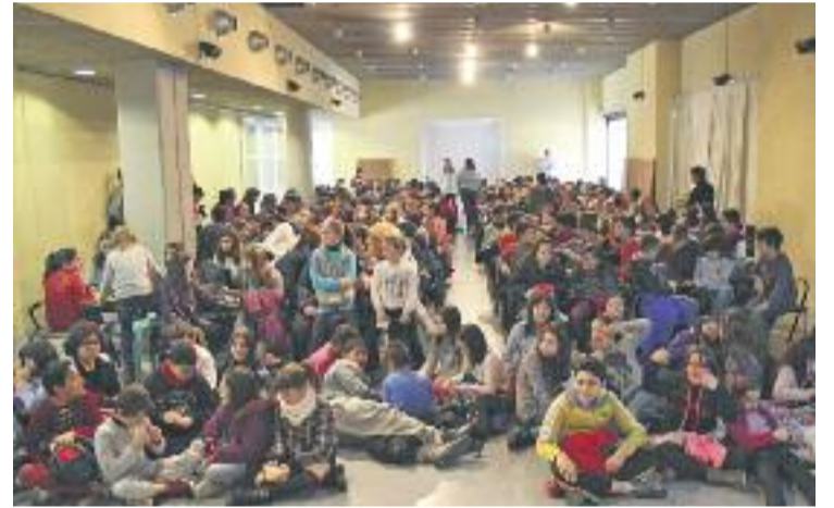
Enguany els alumnes han creat un total de set cooperatives.

La creació d'aquestes cooperatives s'emmarca en els programes Cultura Emprenedora a l'Escola , impulsat per la Diputació de Barcelona, i Aprendre a Emprendre , promogut per l'Ajuntament a través d'EMFO, amb els quals es pretén impulsar la cultura emprenedora mitjançant la creació de cooperatives escolars i transmetre als alumnes valors com ara l'esforç, l'autonomia i la responsabilitat, així com la capacitat de presa de decisions i aprenentatge d'errors.