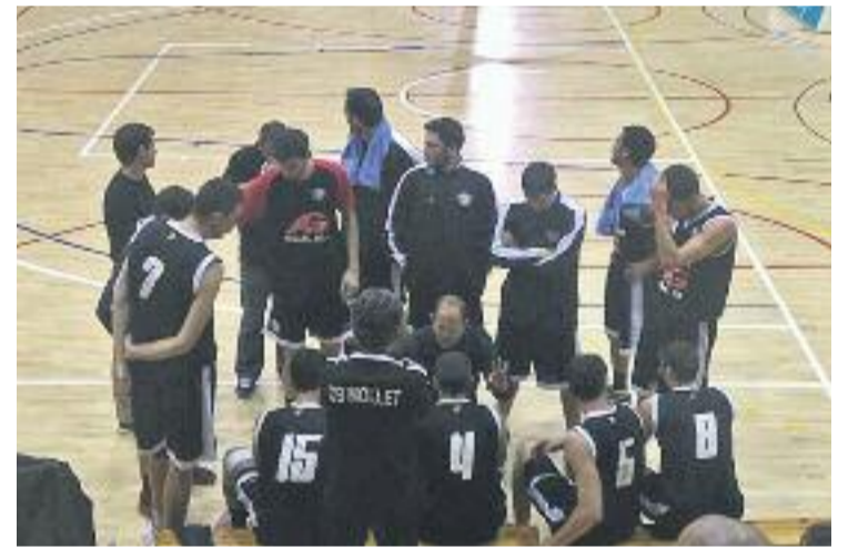
Els d'Àlex Coma estan realitzant una gran temporada.

La fase prèvia acabarà a mitjans de febrer i, després de dues setmanes de descans, començaran els partits classificatoris.