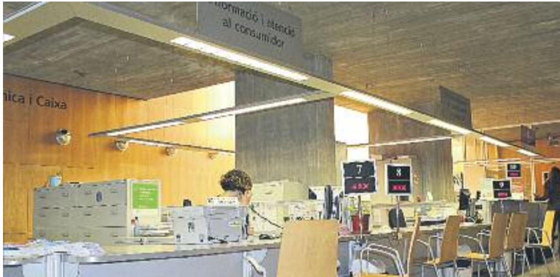
En els pròxims mesos es faran públiques les dades de l'OMIC de l'any 2015.