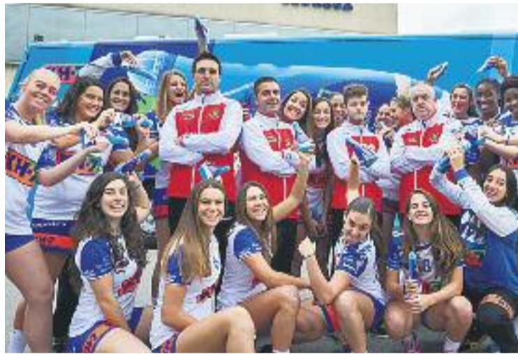
L'equip es va conjurar per créixer a la segona volta.