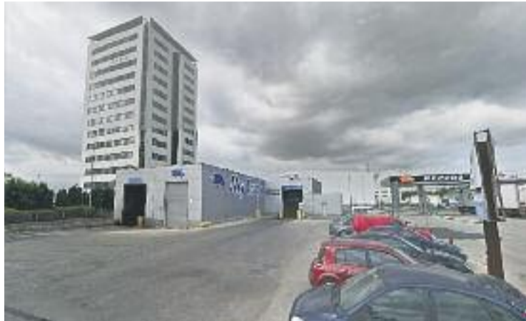
El projecte de desplegament ha començat al CIM Vallès.

preses del CIM la contractació de la fibra òptica, que consta de serveis per a microempreses, Pimes i serveis corporatius.