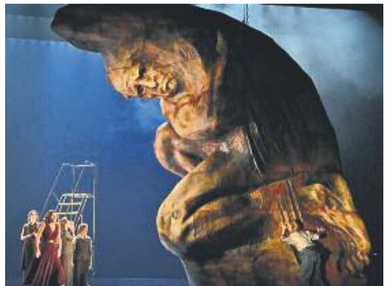
L'escultura fa set metres d'altura.

Durant la representació, els cantants passen per damunt de l'escultura, com un personatge més de l'obra. La figura penja de la seva part superior i, durant el transcurs de l'obra, el personatge d' Elektra va girant l'escultura i la mostra als espectadors des de tots els angles.