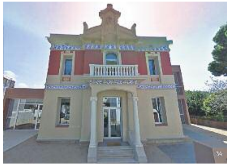
Gairebé totes les activitats seran al Casal Bastinos.

Per tal de formalitzar l'inscripció cal portar el DNI i el carnet de soci del Casal Bastinos en els casos en els quals l'activitat sigui exclusiva per als socis al Casal -carrer Sant Isidre, 34-.