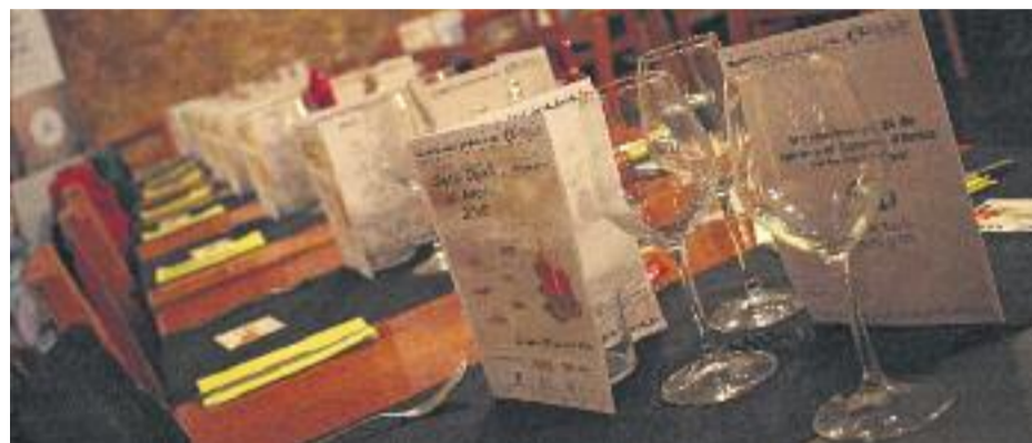
Nadal és l'època de l'any que la gent gran se sent més sola i per això Amics de la Gent Gran ha intensificat la seva tasca aquests dies i ha organitzat un gran dinar.