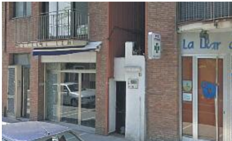
Una imatge d'arxiu del local on hi va haver l'incendi.

Segons els Bombers, l'incendi es va produir uns minuts després de les sis de la tarda per causes que encara es desconeixen i va cremar la totalitat de