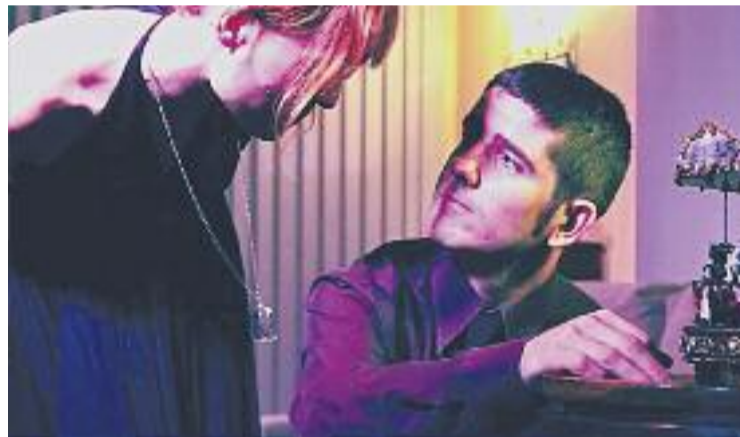
El curtmetratge s'estrenarà al febrer a Barcelona.

Tot i que als cineastes del film els agradaria poder-lo restrenar a Parets o Mollet, de moment només es podrà veure al febrer en una sala de Barcelona, ja que, segons els seus autors, "cap dels dos consistoris s'han mostrat interessats en el curtmetratge".