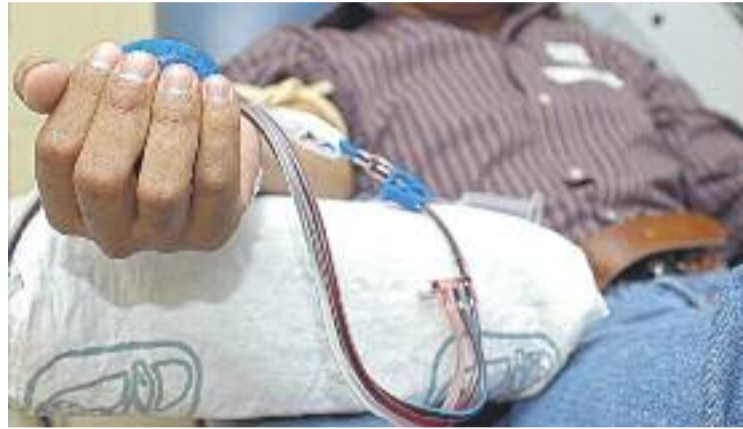
Les donacions de sang augmenten any rere any al municipi.

Només durant el 2013 es va registrar un descens en el nombre de donants de sang, quan 178 persones van visitar les unitats habilitades per a tal motiu a la ciutat. L'any anterior, el 2012, 279 llagostencs van donar sang, una xifra encara inferior a la registrada el 2011, quan ho van fer 308 ciutadans. Respecte a la gran remuntada de l'any