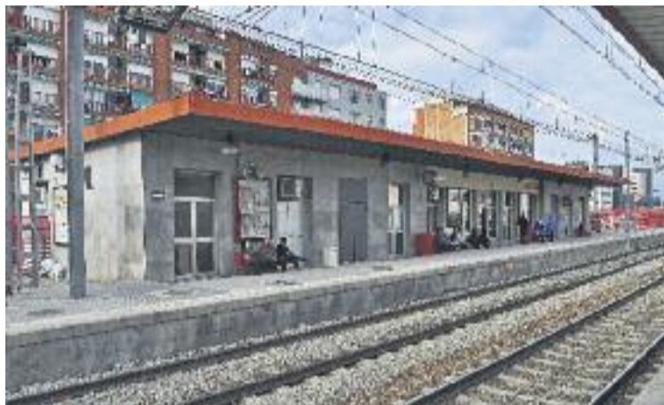
El robatori causant de les incidències va ser a Mollet-Sant Fost.

Segons informa Renfe, el servei de la R2 i la R11 quedarà restablert a partir de les sis del matí de dilluns. En el cas de la R8, de les vuit del matí a les vuit del vespre el servei es recuperarà entre Mollet-Sant Fost i Martorell, però els viatgers de Granollers Centre i Montmeló que utilitzen habitualment aquesta línia s'hauran de desplaçar fins a Mollet-Sant Fost,