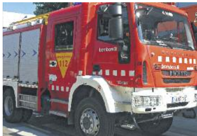
Els Bombers van treballar tot el matí al lloc dels fets.