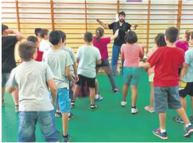
Un dels assajos de l'Òpera a l'escola.

Gràcies als diners recollits en aquesta campanya de micromecenatge, els escolars podran gaudir de l'assessorament de dos artistes professionals externs pro-