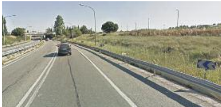
Els carrils passaran a tenir 3,5 metres d'amplada.

Actualment la incorporació a la C-17 (en direcció cap a Vic) dels vehicles procedents de les autopistes C-33 i AP-7 té problemes de congestió i formació de cues, so-