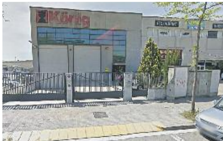
Feia poc que s'havia traslladat a aquesta nau.