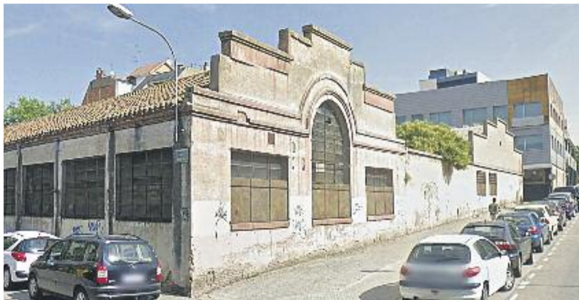
La zona també comptarà amb un plaça pública.