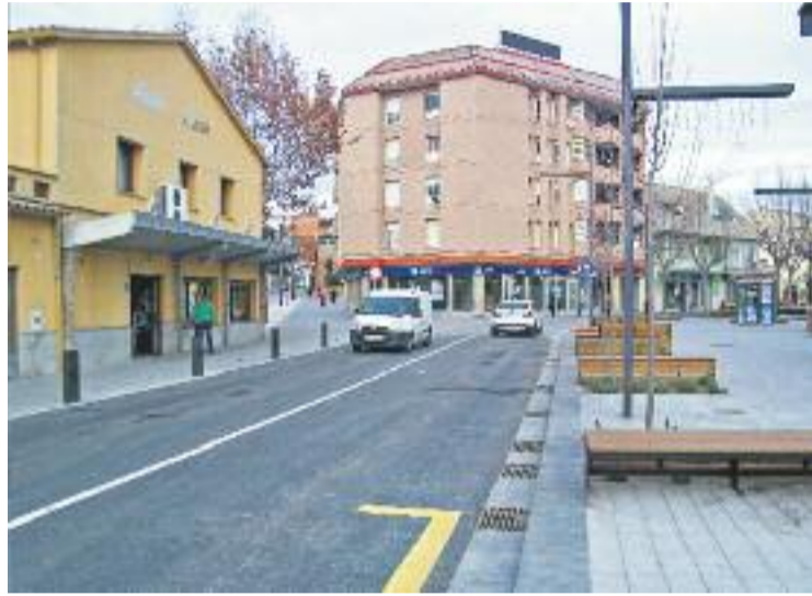
L'avinguda Pompeu Fabra un cop reoberta al trànsit.

Amb la reobertura d'aquest tram de l'avinguda Pompeu Fabra ja ha quedat restablerta la normalitat viària a tot el centre de la vila. Així doncs, des d'ahir el pas de vehicles per aquesta avinguda està limitat a 30 quilòmetres per hora amb l'objectiu de donar prioritat als vianants, mentre que el tram de Timbaler del Bruc entre Pompeu Fabra i Diputació ja és exclusivament per a vianants. En el cas del carrer de Vic també és totalment per a vianants amb l'excepció de vehicles autoritzats