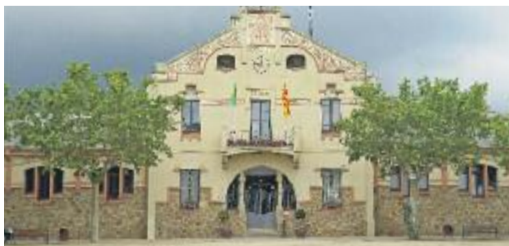
L'Ajuntament assegura que acatarà la sentència.

El jutjat Contenciós Administratiu 15 de Barcelona considera que el consistori vallesà va incomplir el seu deure de vigilància i control en relació amb els abocaments derivats de l'activitat industrial que es desenvolupa en aquest polígon i que, després de passar per l'estació de bombeig de Mas Fabrer, acabaven desembocant a la xarxa