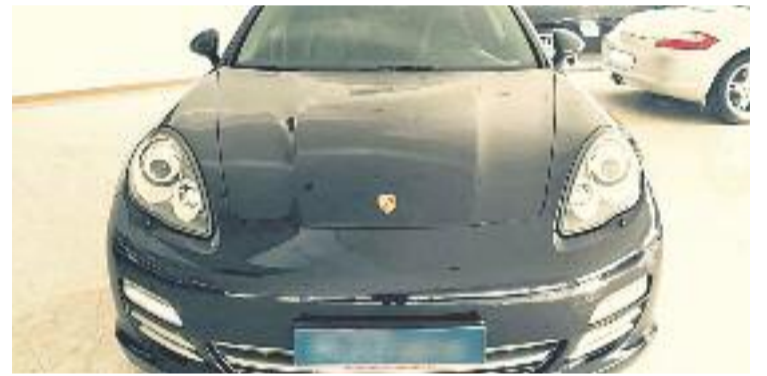
L'organització enviava els cotxes al Paraguai.

Fruit d'un minuciós estudi de documentació relativa a l'enviament dels contenidors així com de la informació relacionada amb la recepció d'aquests contenidors, es va acreditar l'existència d'aquesta organització criminal i es va procedir a les detencions.