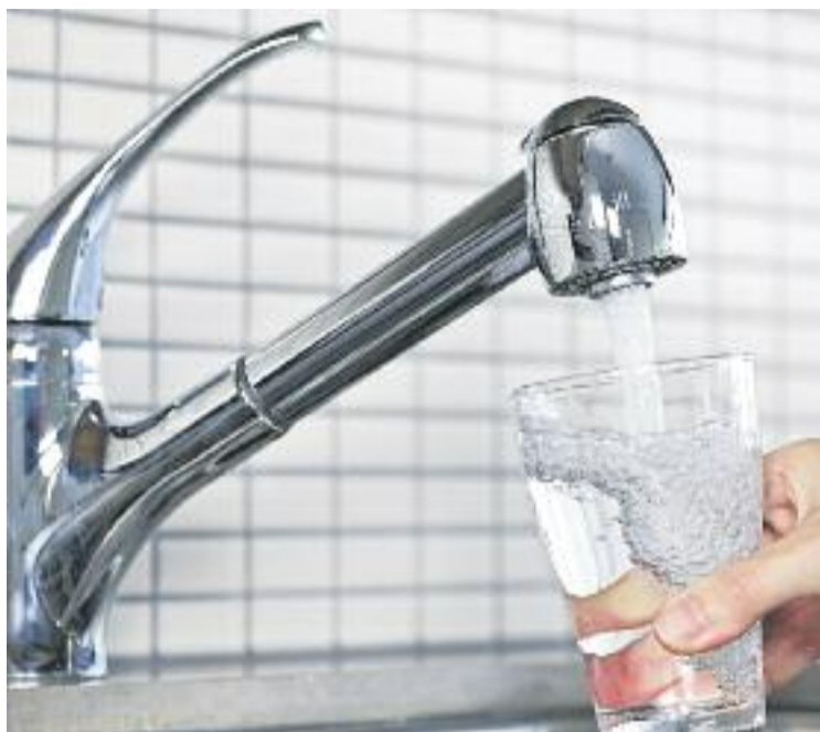
El protocol regula les actuacions que cal dur a terme.

En el protocol que han establert la companyia i l'administració local es regulen les actuacions que cal dur a terme per evitar talls en el subministrament. Davant la impossibilitat de fer front al pagament dels rebuts, Sorea negociarà ajornaments del pagament de rebuts o fraccionaments de les factures, sense aplicar-hi interessos. Si l'usuari aporta un informe dels serveis socials municipals, on s'acrediti que es troba en una situació de vulnerabilitat econòmica o de risc de perdre l'habitatge, se suspendran