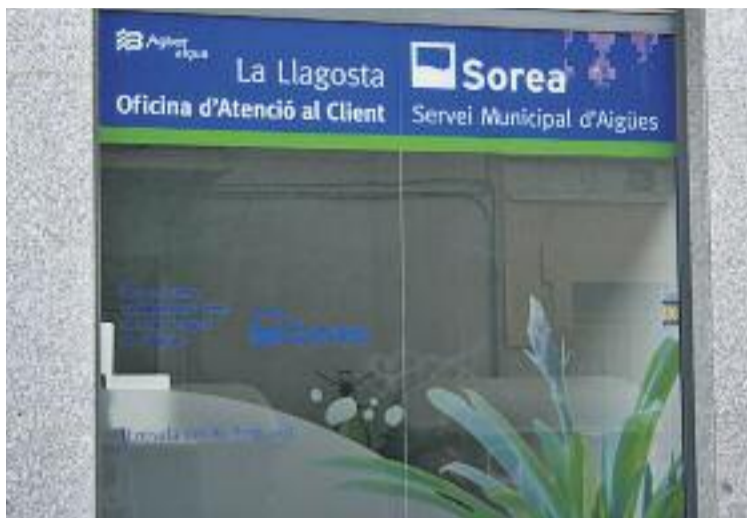
Actualment Sorea s'encarrega del subministrament d'aigua.

L'equip de govern encarregarà ara als Serveis Tècnics Muni-