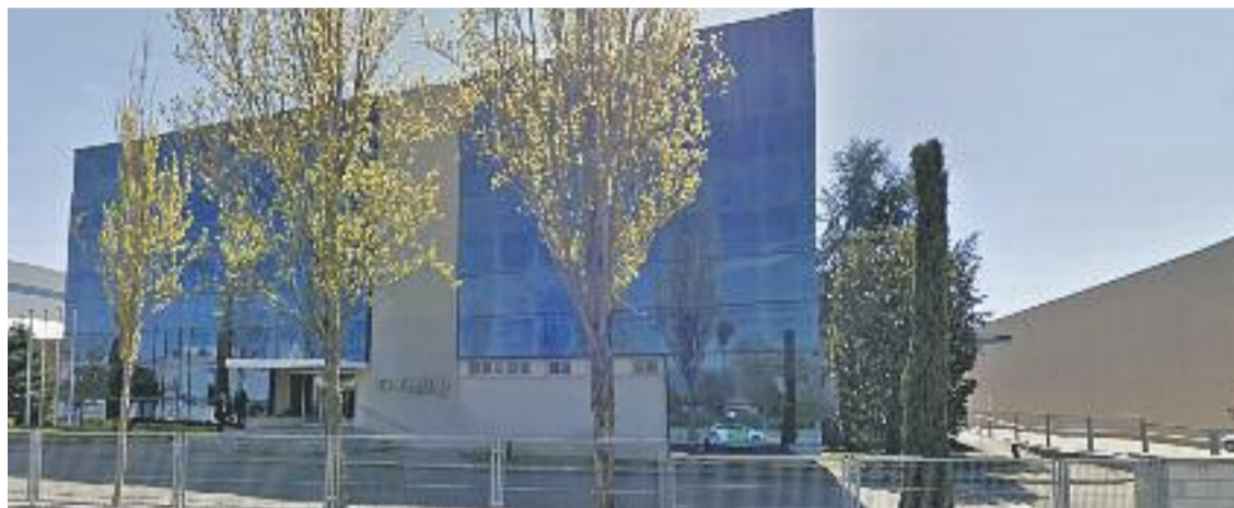
L'empresa adquirida va crear l'ara compradora l'any 1965.