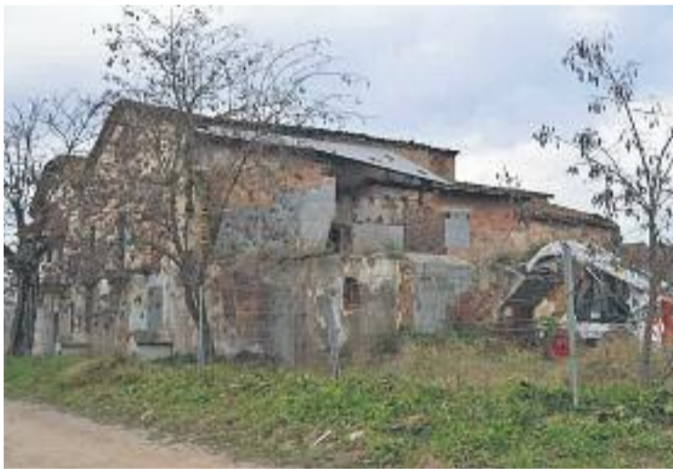
Ja s'han fet els primers passos per a la recuperació de la masia.