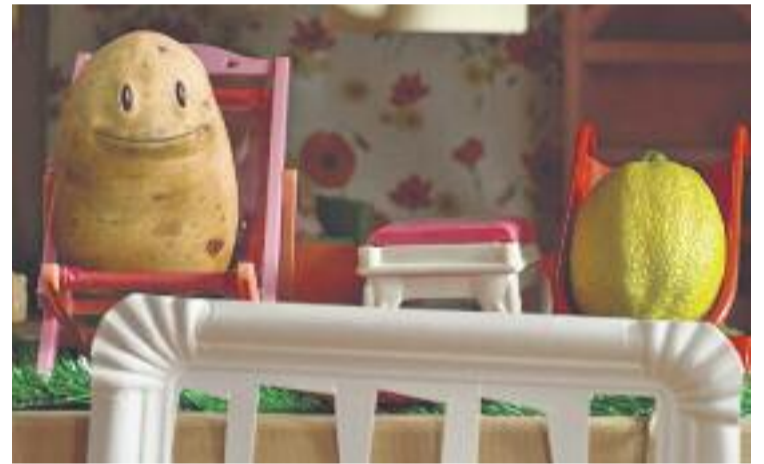
El protagonista del film s'assembla a una patata.

El Premi del Jurat per al millor curtmetratge +4 ha estat per a Les noves espècies , una història creada a la República Txeca que parla de tres nenes que troben un ós misteriós i busquen la criatura a la qual pertany.