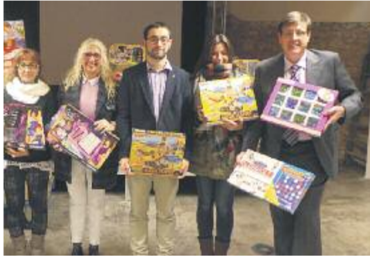
Els regals es repartiran el dia de la Cavalcada.

El lot de joguines es destinarà a unes 60 famílies del municipi. L'àrea de Serveis Socials serà l'encarregada de dir quins infants rebran aquestes joguines