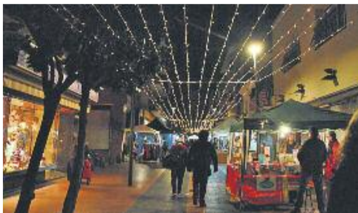
Una imatge de la Fira de Nadal de l'any passat.

Aprofitant aquesta mostra, totes les botigues que vulguin podran posar comerç al carrer , davant del seu establiment, de manera que hi hagi més ambient nadalenc i motivació de compra. A més, hi haurà la zona d'activitats, on es disposarà d'un inflable per als més petits, a més de tallers i actuacions d'entitats.