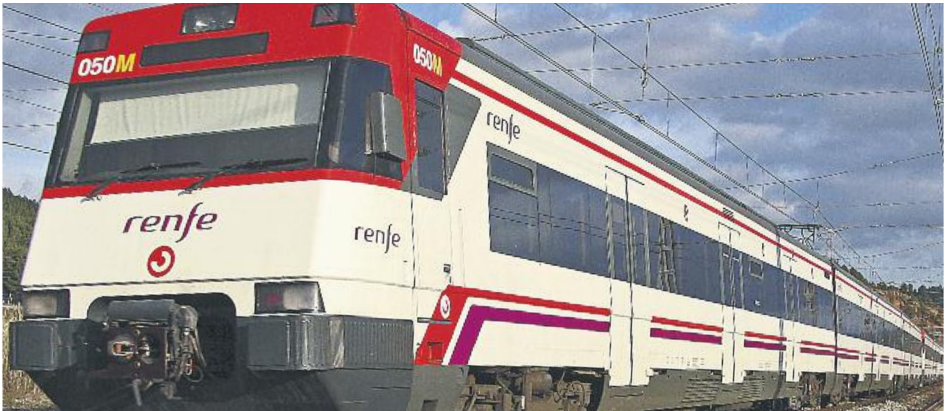
Per culpa del robatori, ara circulen la meitat de trens per les vies afectades.