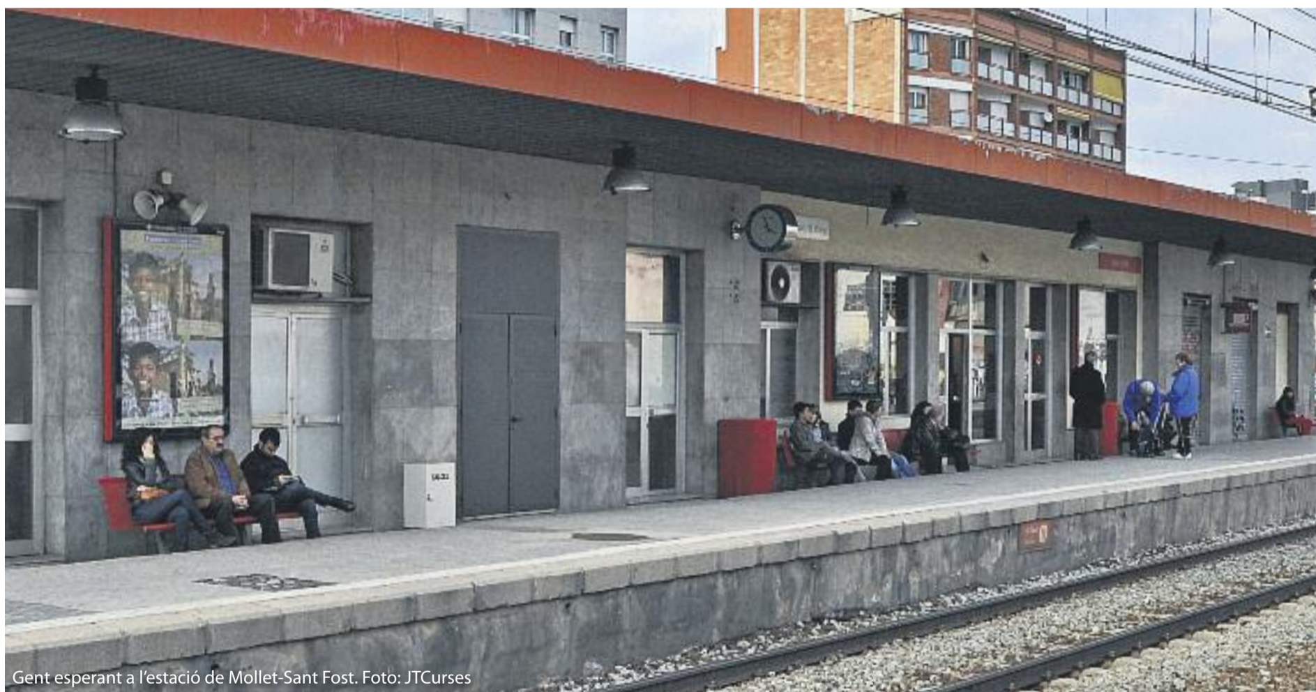
Gent esperant a l'estació de Mollet-Sant Fost.

► Desenes de milers de viatgers es veuen afectats encara ara per un servei reduït i lent pàg 3