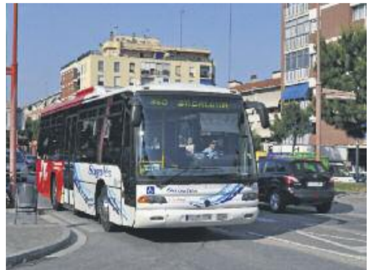
El bus farà 10 parades d'anada i 10 de tornada.

Amb aquest nou increment del servei, el barri de Lourdes estarà connectat amb el centre de la ciutat a través d'un total de quatre línies interurbanes i una línia urbana. En tots els casos, els autobusos es poden agafar amb la targeta urbana de Mollet o amb els títols de transport integrat.