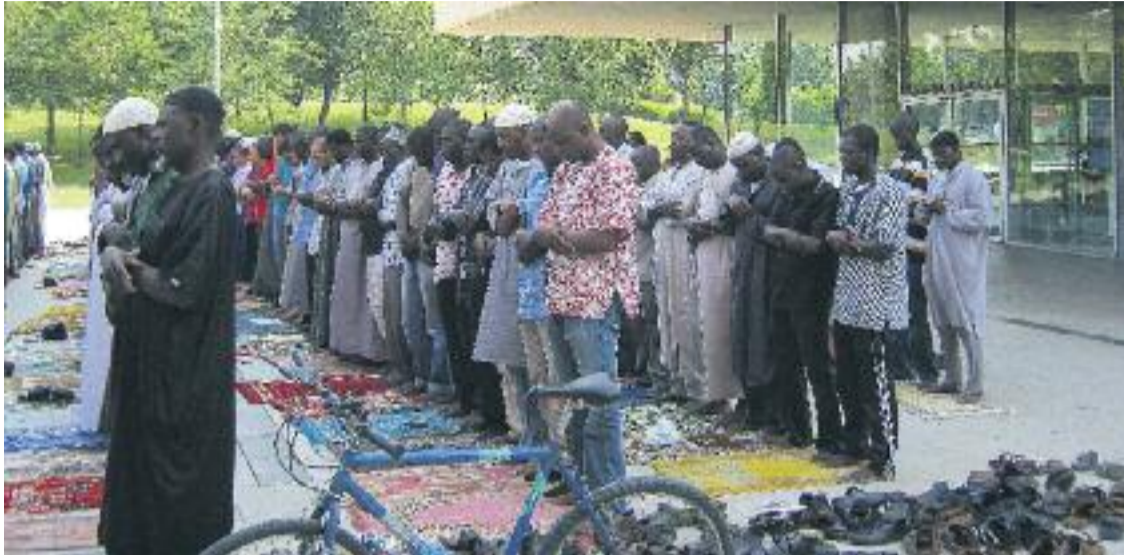
El conflicte entre Al-Huda i l'Ajuntament fa temps que dura.