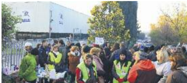
CCOO lamenta que no s'hagi evitat el tancament.

Així doncs, l'acord preveu prejubilacions per als treballadors que tinguin a partir de 55 anys a 31 de desembre de 2016, als quals l'empresa comple-