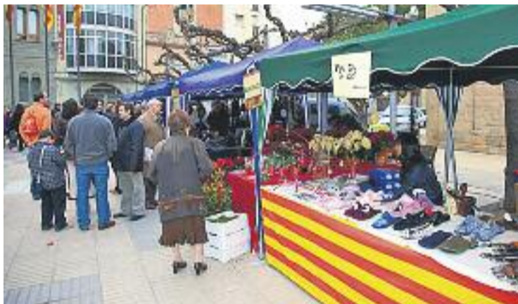
La fira se celebrarà aquest pròxim diumenge dia 20.

La Fira comptarà de nou amb la presència del carter reial, que serà l'encarregat de recollir les cartes amb les peticions del més petits, i l'arbre dels desitjos, on els paretans, les paretanes i visitants d'arreu podran penjar els seus anhels per al 2016.