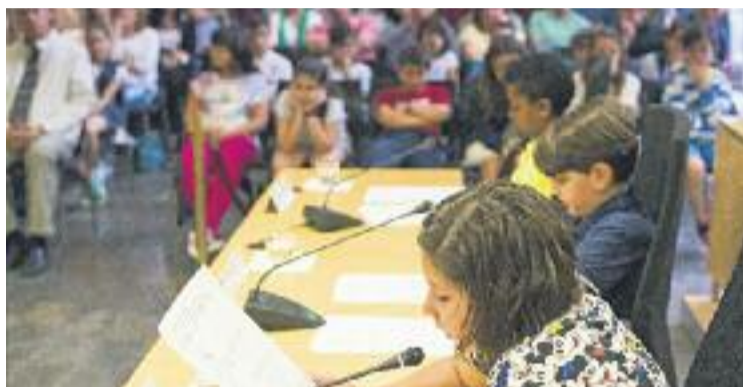
El CIM presentarà les seves propostes el 24 de maig.

Segons l'Ajuntament, l'objectiu del CIM serà reflexionar sobre el concepte de discapacitat, prendre consciència de les actituds que es tenen cap a les persones amb discapacitat i adoptar aquelles que responguin a una actitud de respecte i normalitat. El CIM també analitzarà els serveis i l'atenció que la ciutat presenta cap a aquestes persones i haurà de fer propostes per mi-