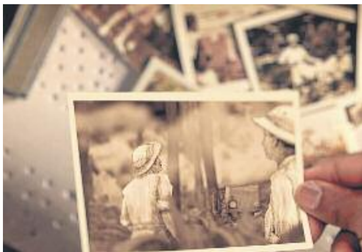
El documental es troba entre els 10 candidats al premi.