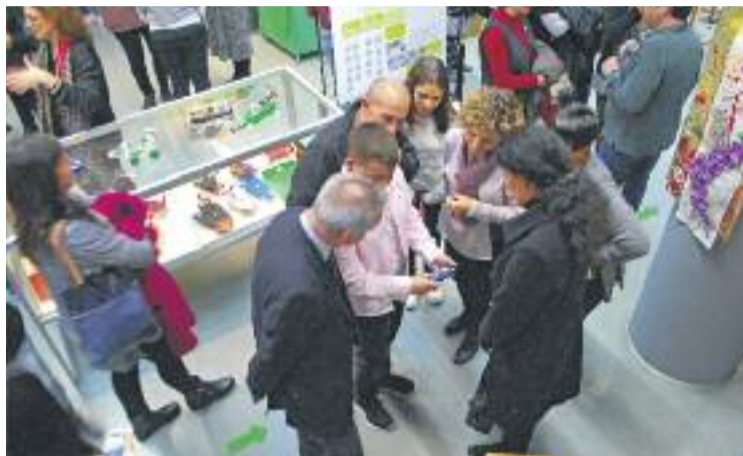
La Fundació Catalunya-La Pedrera subvenciona el projecte.

L'Institut Rovira-Forns va ser seleccionat l'any 2013 per formar part del projecte Escoles Tàndem de la Fundació Catalunya-La Pedrera, que fomenta la innovació educativa. A través d'aquesta iniciativa el centre s'ha especialitzat en les ciències i les