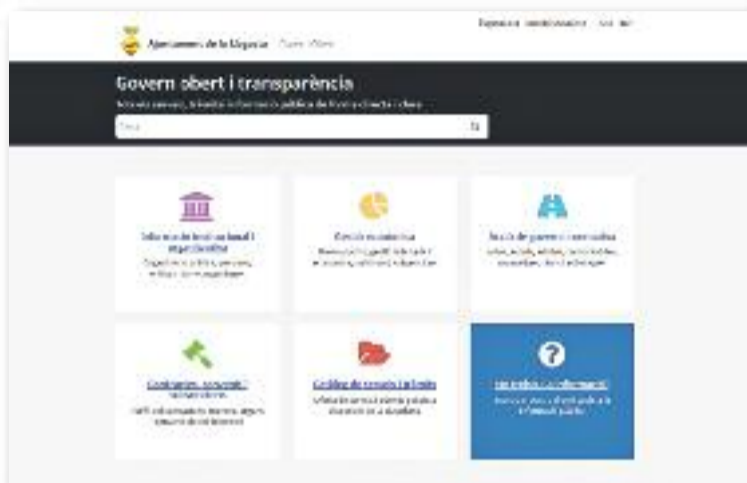
El nou web serà de més fàcil accés i més intuïtiu.

Pel que fa a la gestió econòmica, es podrà consultar el pressupost, el compte anual del consistori, l'execució del pressupost, l'endeutament municipal, el pe-