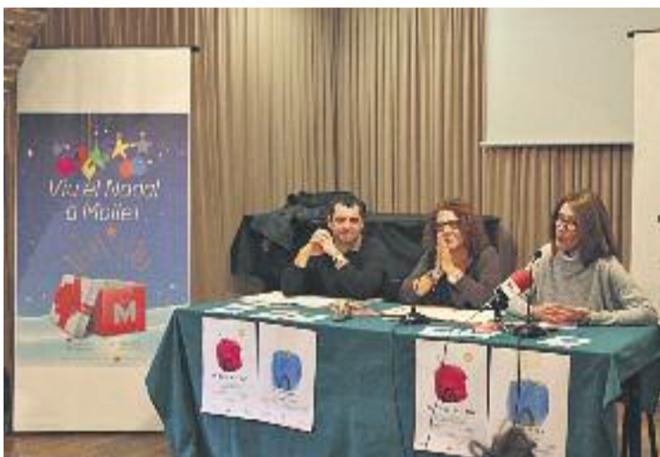
La llum, la cultura i la música seran els protagonistes.