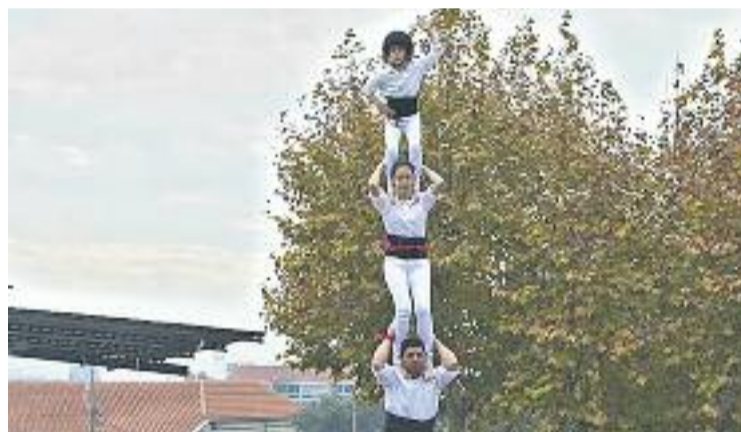
Actuació de divendres passat.

A hores d'ara, el seu principal objectiu és aglutinar més persones interessades en aquest projecte, que necessita un mínim de 90 membres per aconseguir fer un 3 de 5 i per anar pas a pas a construir castells més grans.