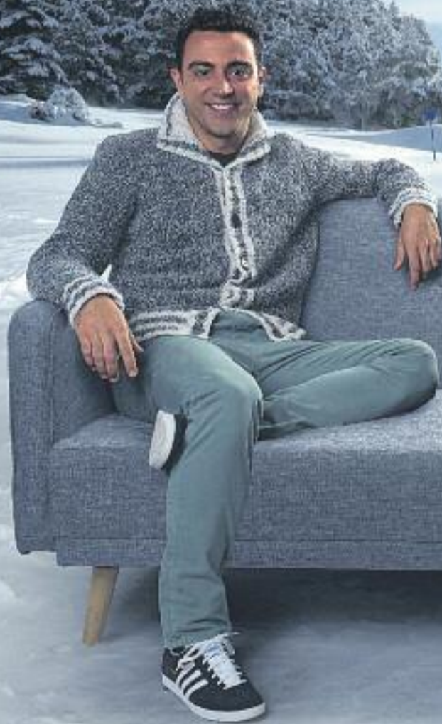
Xavi Hernández | Futbolista La Molina - Pirineus