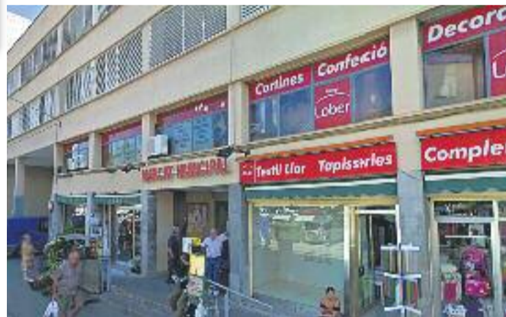
El Mercat vol fidelitzar els seus clients.

Per altra banda, el Mercat ha organitzat el primer concurs de pessebres infantils, en el qual han participat 190 nens. El premi es lliurarà avui amb la presència de l'alcalde Óscar Sierra.