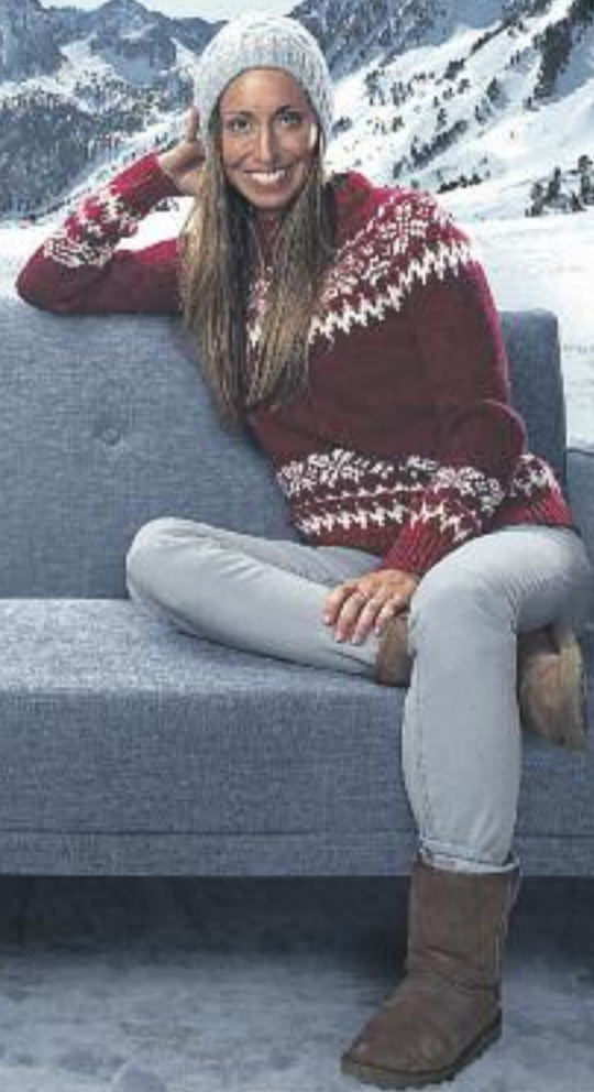
Gemma Mengual | Medallista olímpica en natació sincronitzada Baqueira Beret - Val d'Aran