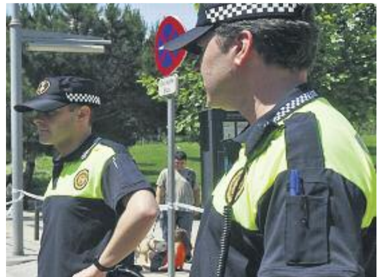
El dispositiu Grèvol ja es porta a terme en alguns barris.

L'estratègia policial d'aquest dispositiu Grèvol té com a finalitat augmentar les patrulles de visualització policial, intercanviar informació de manera personalitzada amb els agents policials que hi formen part i poder rebre consells de seguretat.