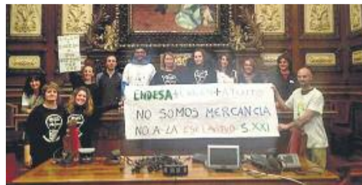
Una de les protestes de les treballadores d'Eulen.

Els sindicats han plantejat que l'ERO sigui obert i voluntari per a tots els treballadors per crear noves vacants per a aquells que es veuen afectats i volen continuar a l'empresa, i que els 362 treballadors siguin tractats de la mateixa manera, indistintament del tipus de contracte. Però, de moment, l'empresa no ha volgut seure a negociar.