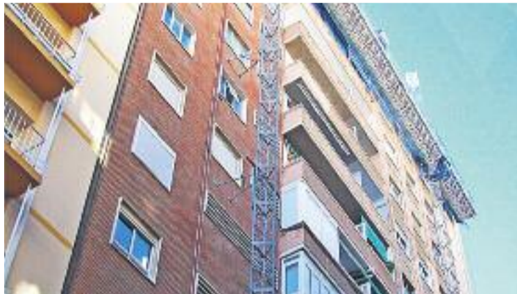
Les multes són de 5.000 euros cadascuna.

L'Ajuntament ja ha anunciat que destinarà l'import total, 25.000 euros, a polítiques d'habitatge que el consistori ja està desplegant (ajudes al lloguer o ajudes per sufragar els imports derivats dels consums de serveis bàsics com l'aigua, el gas i l'electricitat, entre altres). Així doncs, des de l'Ajuntament remarquen que, "si les entitats bancàries no fan que els habitatges siguin ocupats de manera immediata, ja sigui posant-los a disposició del consistori en