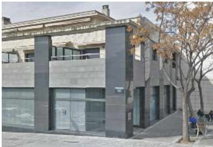
La seu se situarà al carrer Llevant.