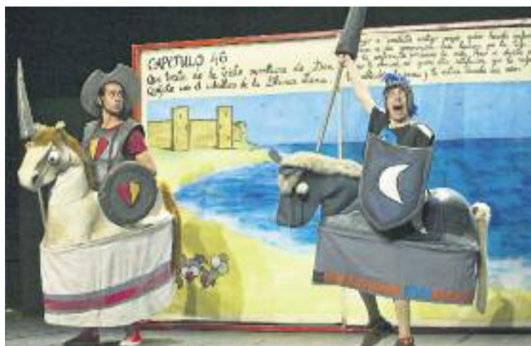
Diuen adéu després de 16 anys als escenaris.

Ot, el Quixot es va estrenar al Teatre de l'Agrupada de Montmeló el 22 de Maig de 1999 i, des de llavors, la companyia n'ha fet més de 550 representacions a diferents municipis de la geografia catalana. L'obra es basa en la història d'un noi a qui no li agrada gens llegir, que rep en herència una vella llibreria. Quan hi arriba coneix el Magí, un ra-