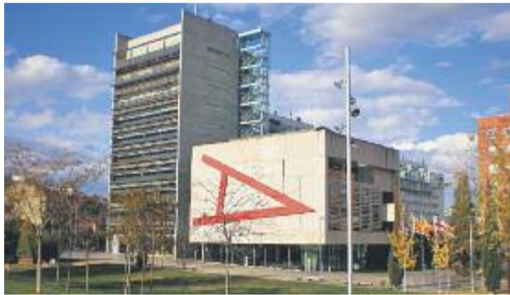
El PSC haurà d'aguditzar les negociacions per aprovar els comptes.

Tot plegat pot complicar que es tirin endavant els pressupostos, si es té en compte que Canviem i ERC ja han avançat que no hi donaran suport. El líder re-