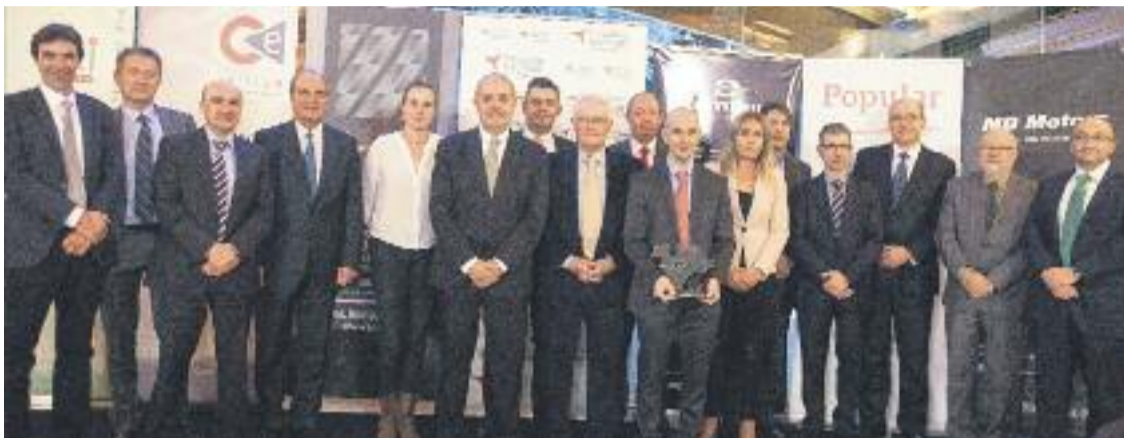
El premi l'atorga la Unió Empresarial Intersectorial.