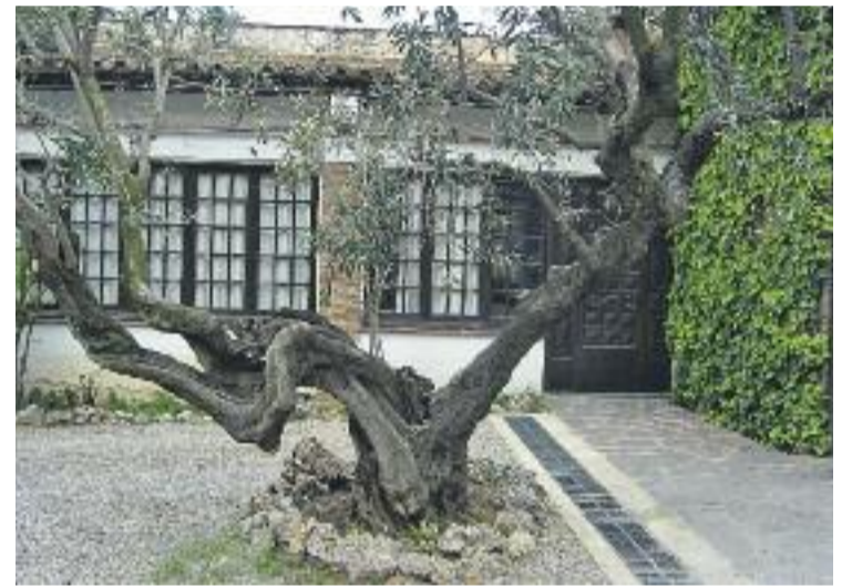
La decisió es va prendre a l'assemblea de dimarts passat.