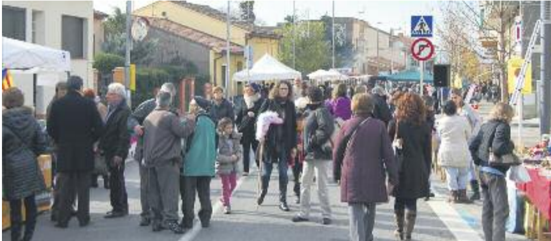
La Fira de l'any passat va aplegar un gran nombre de públic.