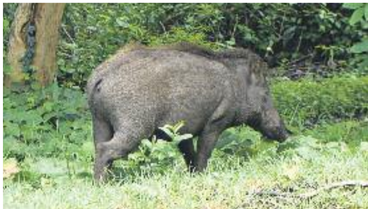
Les Franqueses reclama una coordinació d'àmbit comarcal.

banda, netejarà els vorals dels camins i carreteres per afavorir la visibilitat dels senglars i farà pedagogia entre els ciutadans per tal de fer-los saber que les batudes són un servei públic.