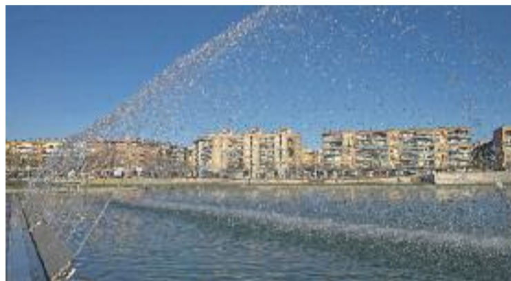
La Llei de Barris ha permès rehabilitar Can Folguera.

El consistori es va beneficiar de les convocatòries d'aquest ajut de la Generalitat corresponents als anys 2005 i 2006. Després de diverses pròrrogues, la fase 1 es tancarà a final d'aquest any. El projecte d'intervenció integral de Can Folguera ha comptat amb una subvenció de 5.201.905,63 euros, per a la fase 1, i de 8.545.346 euros, per a la fase 2.