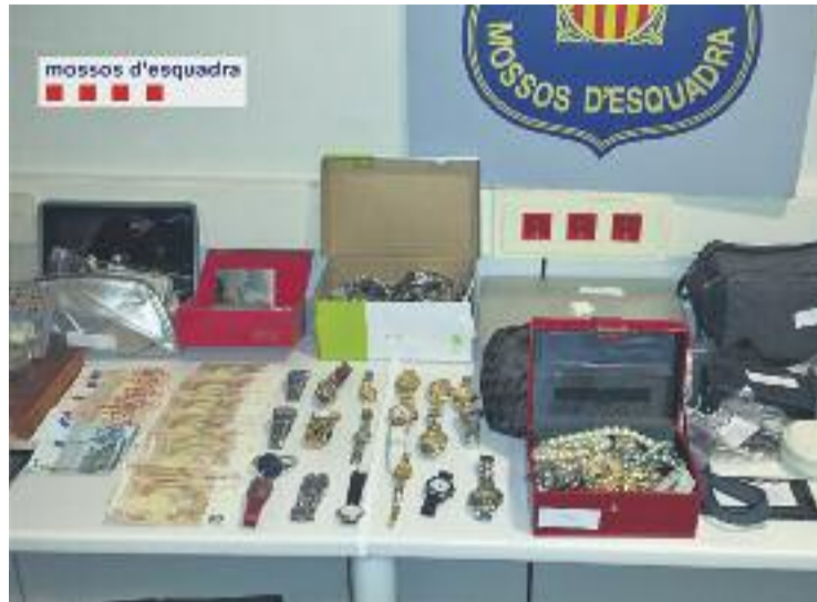
Els detinguts estaven a punt de marxar a Georgia.

A partir d'aquí, va començar la investigació policial amb l'objectiu de detenir-ne tots els integrants. Dies abans de cometre el robatori, es dedicaven a marcar els domicilis escollits per tal de saber si podrien entrar-hi i en quina