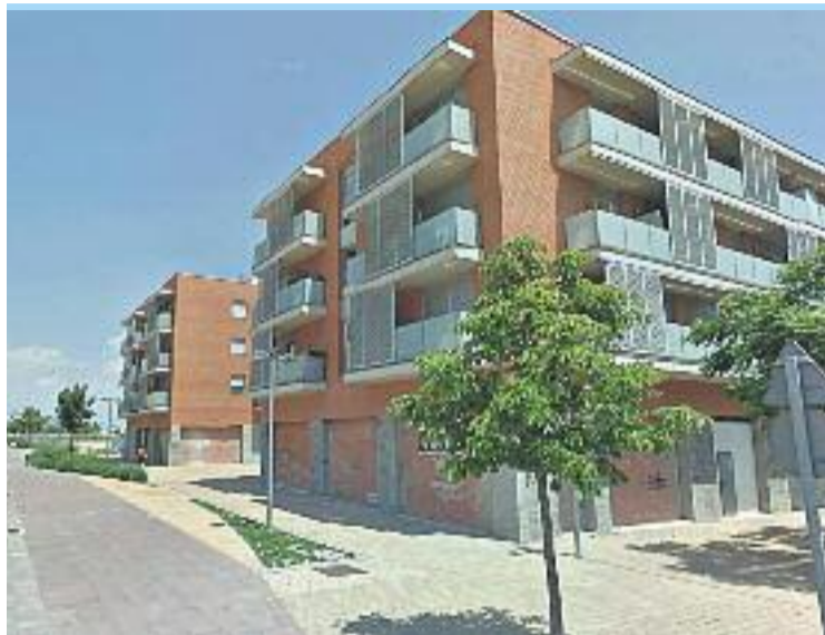
La sentència anul·la el POUM del 2001.