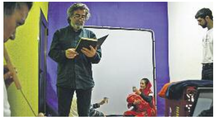
Cromossomos van fer un viatge de tres setmanes a Tindouff.

Durant la seva estada a Tindouff, els pallassos van fer representacions a diverses escoles amb la intenció de fer riure els infants dels campaments de refugiats. L'acte va ser organitzat per la secció local d'ICV, que ja és la sisena vegada que organitza un acte dedicat al Sàhara i a la situació que es viu allà.