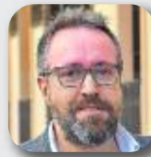
JUAN CARLOS GIRAUTA Ciutadans (C's)

"Som els hereus del catalanisme polític, a diferència dels que volen trencar Espanya"