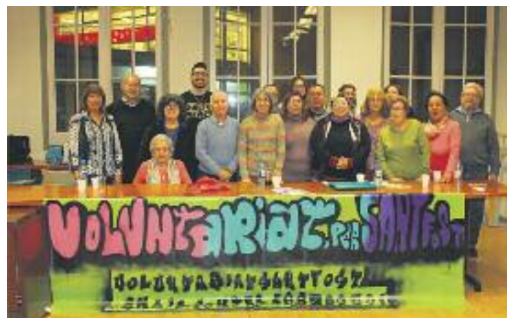
Durant la festa van donar a conèixer la seva tasca.

Voluntariat Social per Sant Fost és una entitat que fa acompanyament a les persones grans, alfabetització d'adults i col·laboracions amb el menjador social, entre altres. A més, també ha engegat una campanya de Nadal de recollida de joguines per a infants en risc de pobresa i volen impulsar, en un futur, el Banc del Temps de Sant Fost.