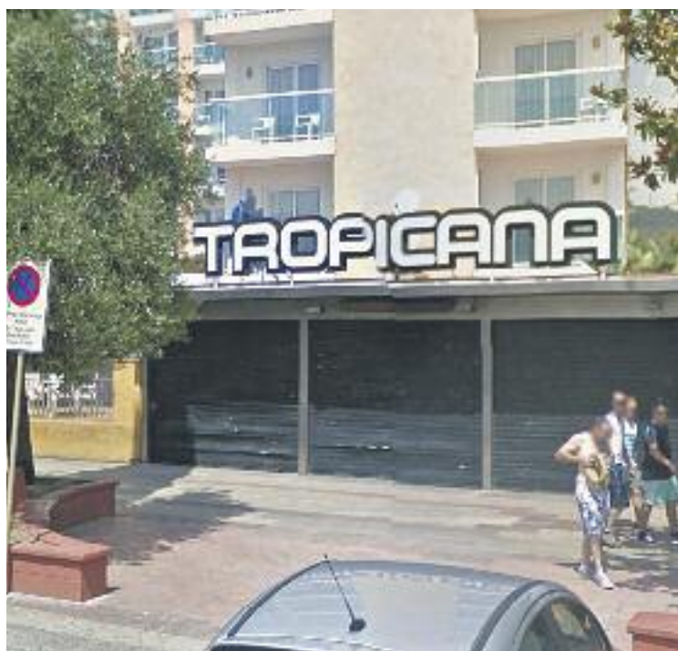
La discoteca estava tancada quan va haver-hi la baralla.