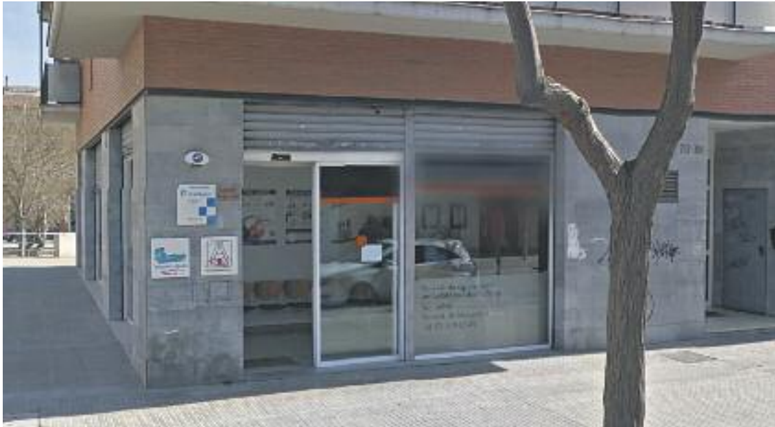
Segons la plataforma, els usuaris no urgents han d'esperar més de 8 mesos per a la primera visita.