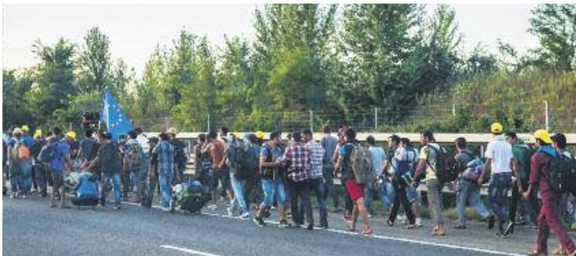
En total el municipi destinarà 4.783 euros als refugiats.