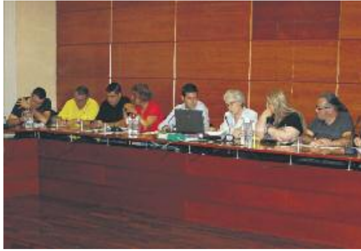
La mesura es va aprovar amb els vots en contra de tota l'oposició.

Des de l'Ajuntament asseguren que aquest canvi es produeix perquè "hi ha partides que no necessiten aquests diners i seran traspassades a altres que s'han quedat curtes". Així doncs, es dona de baixa del pressupost municipal una part de les partides dedicades al pagament d'interessos bancaris, despeses financeres, aportacions a l'empresa municipal Gestió de Sòl i Patrimoni, a l'Associació de Municipis de l'Eix de la Riera de Caldes, a convenis amb el Consorci de Normalització Lingüística i amb el Consell Comarcal, entre altres. La proposta aprovada incrementa partides dedicades a l'amortització de préstecs, al Servei d'Atenció Domiciliària, al Fons