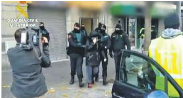
La noia ja havia intentat unir-se a DAEHS en una altra ocasió.

El Ministeri de l'Interior ha assegurat en un comunicat que la noia, de 24 anys i nascuda a Granollers, "havia experimentat un procés de radicalització que l'havia dut a compartir completament l'estratègia dels grups terroristes extremistes als quals pretenia unir-se en un imminent desplaçament". De fet, segons va afirmar dissabte el mi-