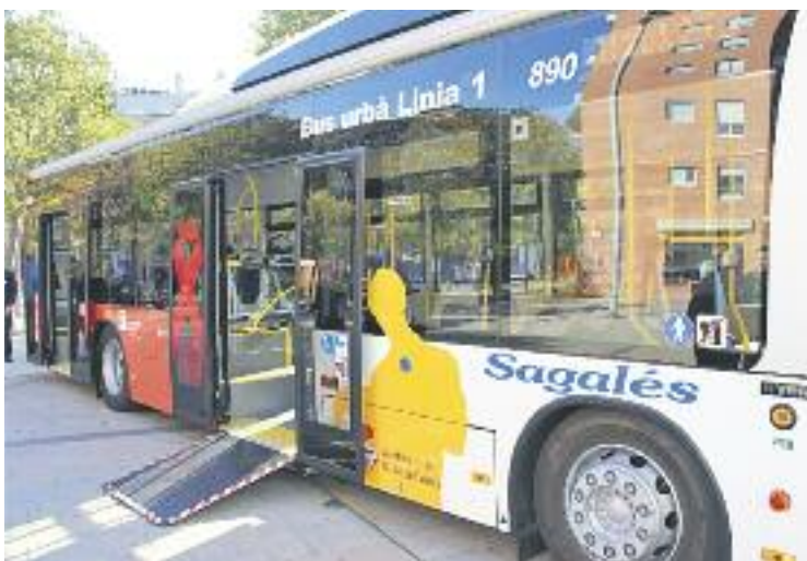
El nou bus genera un estalvi energètic d'entre el 28% i el 35%.