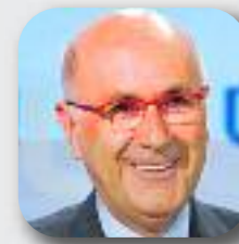
JOSEP A. DURAN I LLEIDA Unió Democràtica

"El 20 de desembre és el nostre gran moment pel canvi i ho hem de fer junts"