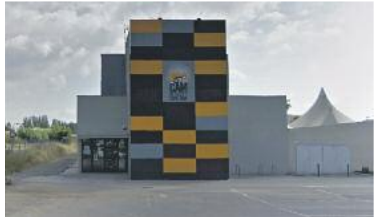
La gestora serviria per decidir la programació i el funcionament.

De moment, a partir del 2016, el CAM obrirà les portes dels bucs d'assaig musical dos dies a la setmana amb un conserge, ja que segons afirma Solà, "la idea inicial del nou projecte del CAM seria aconseguir com a mínim una activitat mensual".