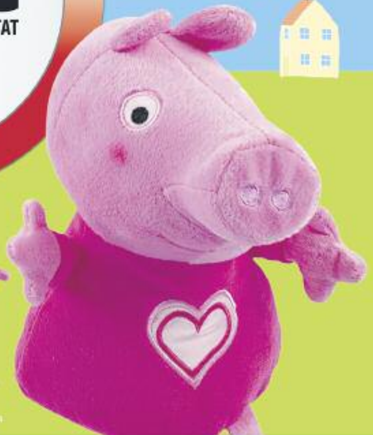
Peluixos assortits. Ref. 307000091. 3.350 unitats