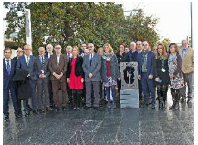
La nova Fundació es va presentar oficialment la setmana passada.

Per al 2016, la Fundació El Roure del Vallès s'ha proposat consolidar-se al territori i dur a terme diverses activitats de sensibilització amb els comerciants i les escoles, com concerts benèfics i conferències amb el teixit empresarial.