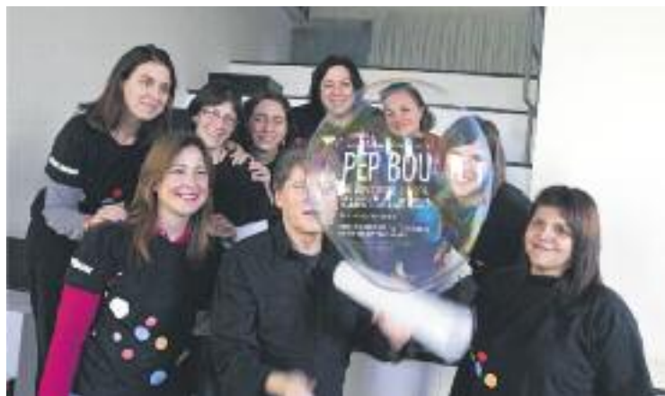
Els beneficis seran per investigar el càncer infantil.

El cinquè espectacle solidari per a infants fins a 99 anys és obert a la participació de tothom. L'entrada-donatiu té un cost anticipat de vuit euros per a infants de 3 a 10 anys i, a partir d'11 anys, de 12 euros.