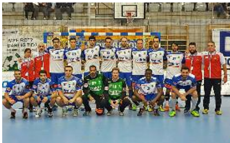
La foto de l'equip després de segellar la classificació a Noruega.

GRANOLLERS ▶ Diumenge passat el Fraikin Granollers va aconseguir la classificació per a la fase de grups de la Copa EHF tot i perdre a Noruega (28-26) i a principis d'aquesta setmana va conèixer quins seran els seus rivals a la fase de grups de la competició europea.