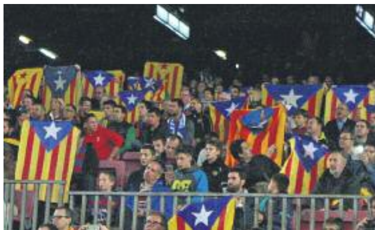
Guil afirma que no van provocar els aficionats madrilenys.

L'aficionat blaugrana va interposar una demanda contra la Delegació del govern madrileny i va recórrer la sanció. Finalment la