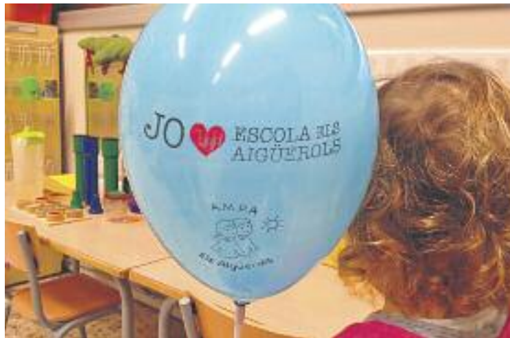
La Generalitat no en preveu la construcció a mitjà termini.

L'alcaldeessa, Isabel Garcia, afirma que amb aquesta propo-