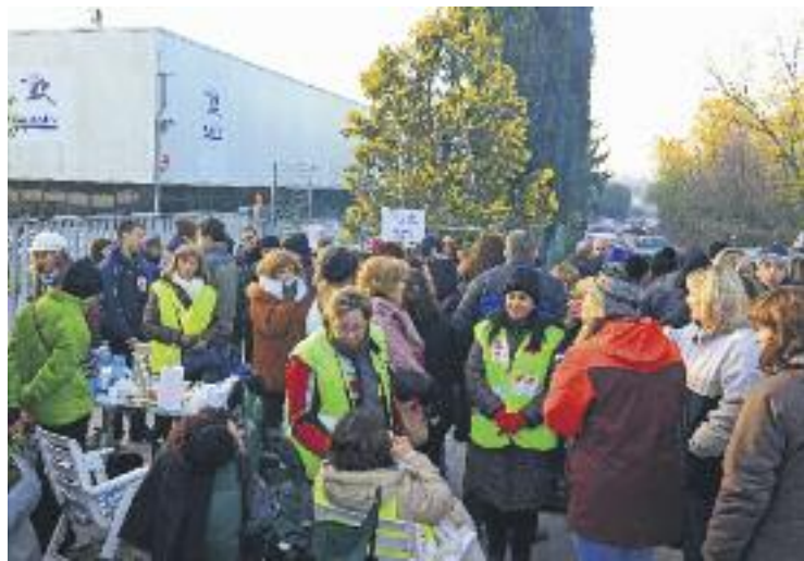
Els treballadors han convocat 11 jornades de vaga.