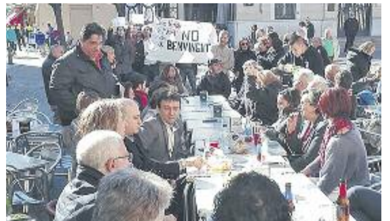
Vermut de Fernández Díaz amb militants del PP.

Durant l'acte, el ministre de l'Interior va remarcar que "la política econòmica del PP ha permès a Espanya passar de ser el malalt d'Europa fa quatre anys a convertir-se en un referent a Europa i al món per la política de reformes que s'han dut a terme", i va afegir que això li permetia donar "un missatge de confiança en el present i el futur de Catalunya i de tota Espanya".