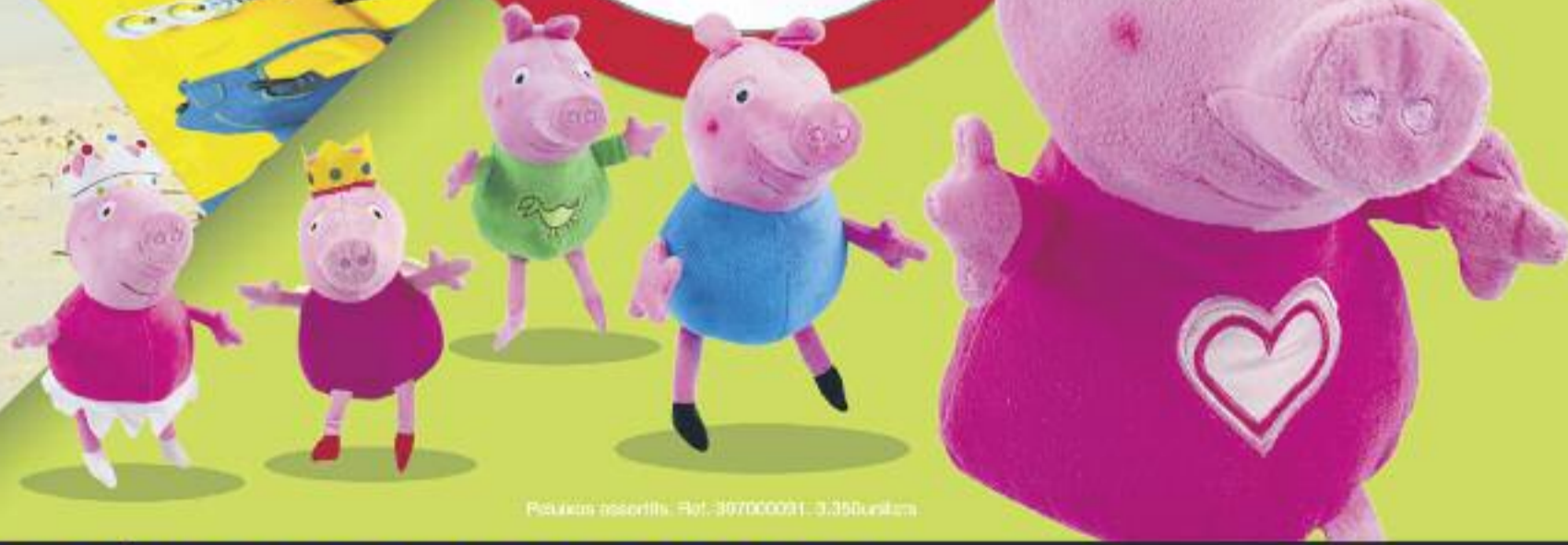
Peluixos assortits. Ref. 307000091. 3.350 unitats