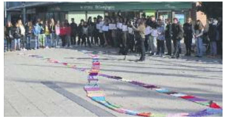
Amb motiu del 25 de novembre, els municipis de la comarca han fet diferents concentracions i actes en rebuig de la violència de gènere.