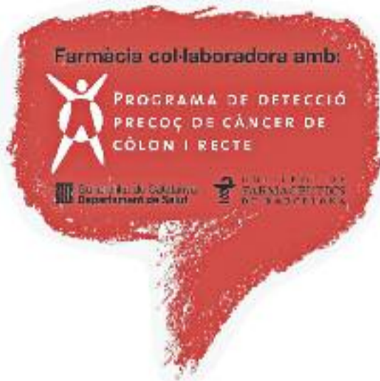
El programa té la col·laboració de les farmàcies.

El càncer de còlon i recte és el segon més freqüent entre les dones i el tercer entre els homes, i s'estima que se'n diagnostiquen 5.000 casos nous a Catalunya cada any. Aquesta malaltia pot desenvolupar-se durant mesos sense produir molèsties i sovint, quan aquestes apareixen, la malaltia ja està força avançada. Els programes de detecció precoç permeten detectar la malaltia en estadis inicials, la qual cosa fa