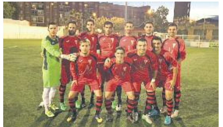
Els vallesans van caure al Municipal de les Grasses.