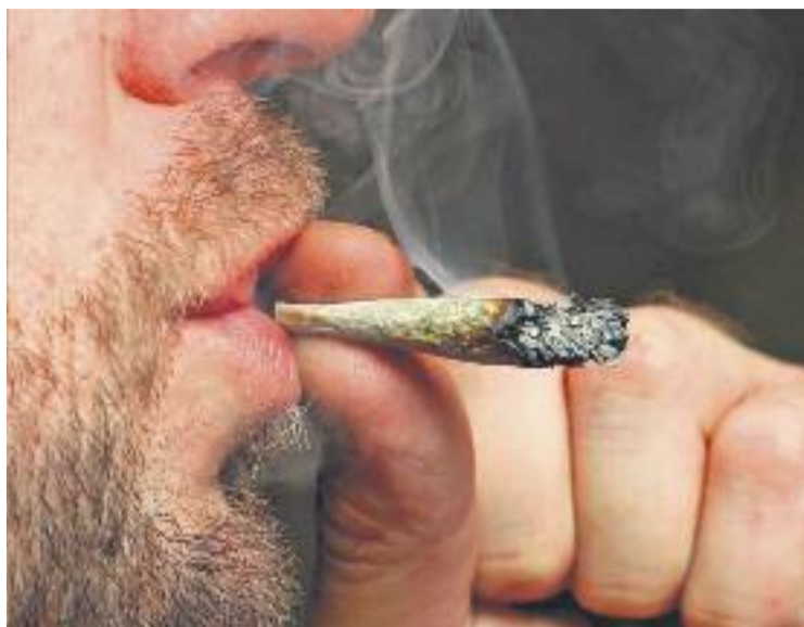
L'Ajuntament ha rebut quatre sol·licituds d'obertures de locals.

L'ordenança també vol assegurar que els locals compleixen