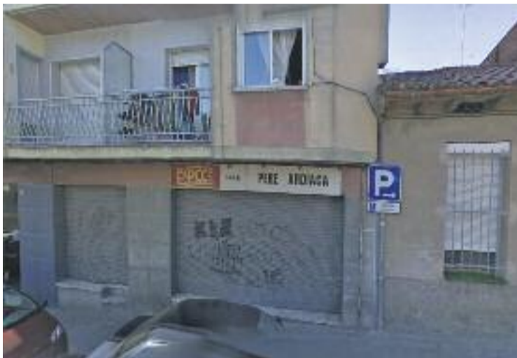
Al local també s'hi instal·larà la seu d'EUiA.