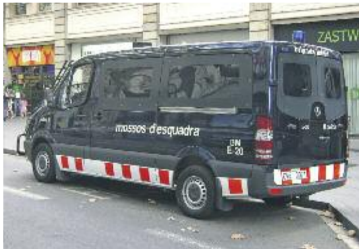
La intervenció s'ha fet a 19 municipis.