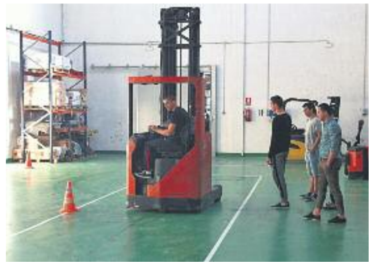
45 joves del programa han reprès els estudis.

Els joves participants han d'estar inscrits al sistema de Garantia Juvenil.