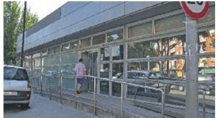
L'equip ha obtingut 94,2 punts sobre 100.

Per poder-se acreditar, cada equip ha de fer una autoavaluació del seu servei a partir de l'estudi de més de 300 ítems i, després, s'ha de sotmetre a una auditoria externa que duu a terme el Departament de Salut. Aquest sistema d'acreditació analitza en conjunt els aspectes de gestió i funcionament de l'equip com ara el lideratge, la política i l'estratègia, la gestió d'aliances o els recursos disponibles.