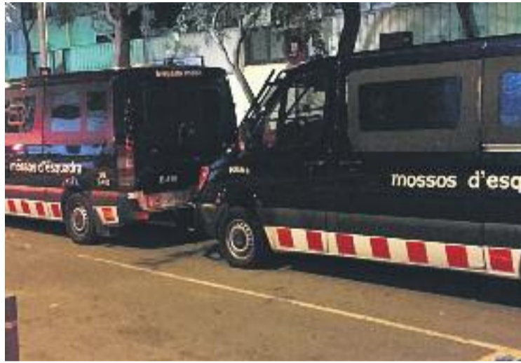
Els escorcolls es van fer a 14 poblacions.

La investigació es va iniciar a finals del 2014, quan la policia va detectar un increment de punts de venda de droga, sobretot de cocaïna i heroïna, als