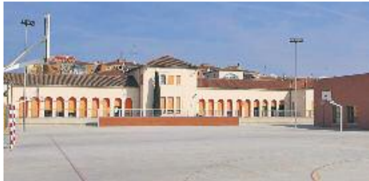
L'AMPA ha creat una comissió de pares per gestionar propostes.

El Consell Escolar del col·legi Lluís Piquer assegura, en un comunicat, que l'Ajuntament els ha notificat que, amb tota probabilitat, la seva serà l'escola que passarà de dues línies a una. El tancament d'aquesta aula provocarà que algunes famílies hagin de portar els seus fills a l'altre extrem del poble, que és on