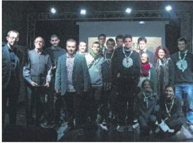
Premiats de la IV Nit de la Cultura.