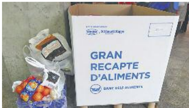
A la comarca, es volen recollir més de 270 tones d'aliments.

2.500 punts de recollida en mercats i supermercats de Catalunya, dels quals un centenar són de la comarca. Els organitzadors esperen superar les 270 tones d'aliments que es van recaptar l'any passat a la regió.