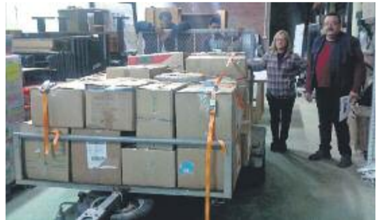
Encara es recull material per un segon enviament.

L'Ajuntament també es va solidaritzar fa unes setmanes amb aquests refugiats i va col·laborar-hi aportant un ajut d'emergència de 1.000 euros i fent la difusió de la campanya de recollida de material.