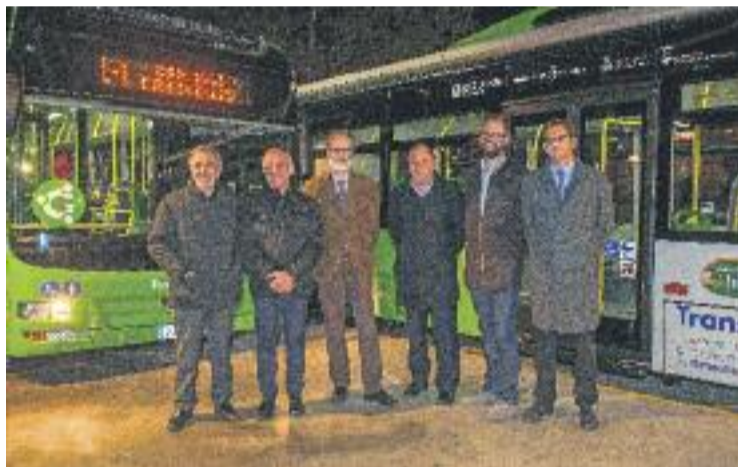
Els nous vehicles estalvien entre un 20 i 30% d'energia.

Actualment l'empresa concessionària que fa el transport públic de la conurbació de Granollers destina a aquest servei un total de 13 autobusos. L'adquisició i entrada en funcionament d'aquests nous dos vehicles representa un pas important per avançar en la substitució de l'actual flota d'autobusos per altres de nous que resultin menys contaminants.