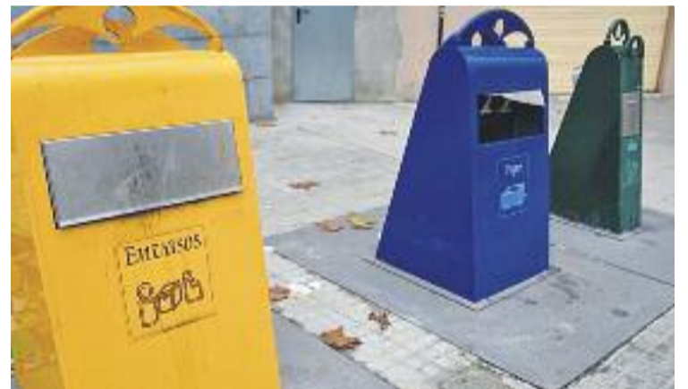
Un dels objectius és fomentar l'hàbit de reciclar.

Avui també es portaran a terme una visita a la planta de digestió anaeròbica i compostatge del Consell de Residus del Vallès Oriental, una xerrada sobre residus al Casal Sant Jordi i un taller de Natura en família, a l'Escola de la Natura.