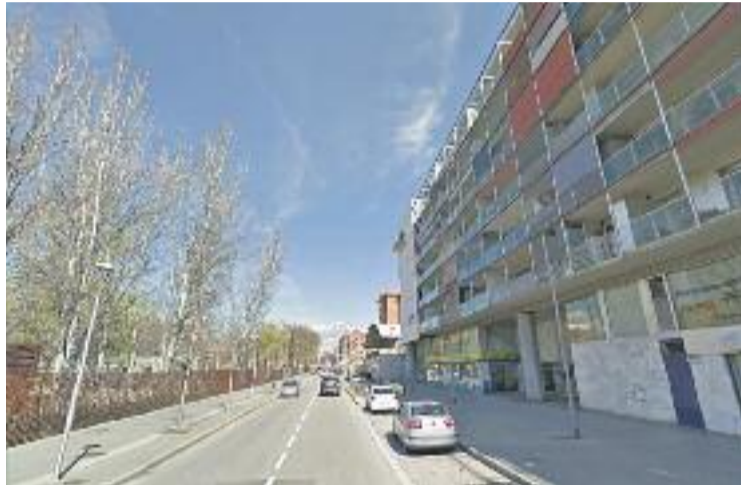
Ara Mollet ERC-MES no ha proposat, però, cap altre nom.

Des d'Ara Mollet-ERC asseguren que el nom de l'avinguda "no té cap relació amb la ciutat de Mollet ni té res a veure amb posicionaments demo-