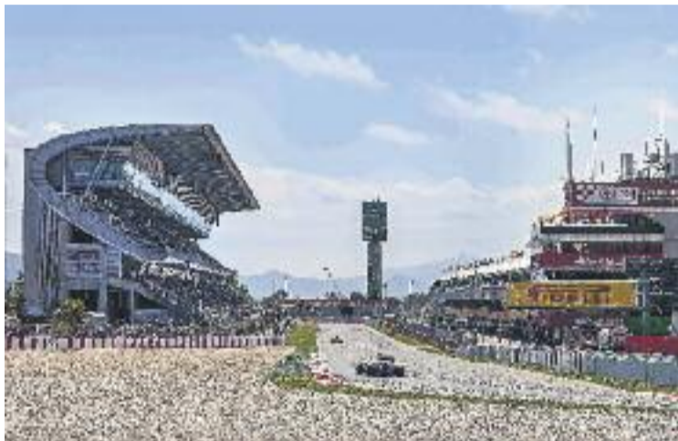
Al nou soci li correspon el 6,01% de les accions.

Aquesta incorporació coincideix en el temps i en la quantia amb les pèrdues registrades per Circuits de Catalunya durant l'últim any. Segons l'acord, publicat en el diari oficial de la Generalitat, les citades pèrdues van ser compensades amb la totalitat