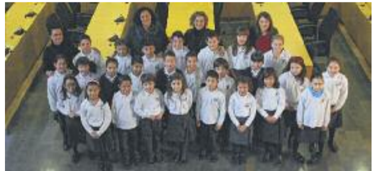
Visita dels infants de l'escola Sagrada Família.

Els objectius d'aquesta activitat són apropar l'Ajuntament als escolars, com a institució més propera a la ciutadania, donar a conèixer el funcionament de l'administració local i fomentar la participació.