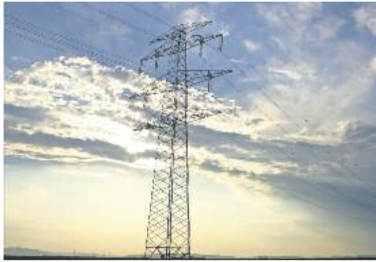
Red Elèctrica d'Espanya vol que la línia passi de 200 Kv a 400 Kv.

Des de l'Ajuntament ja han enviat un escrit al Ministeri en el qual els demanen que valorin la possibilitat de "processos de producció d'energia alternatius i renovables", a més de tenir en compte "l'alternativa del soterrament en els trams adjacents als nuclis urbans i als espais na-