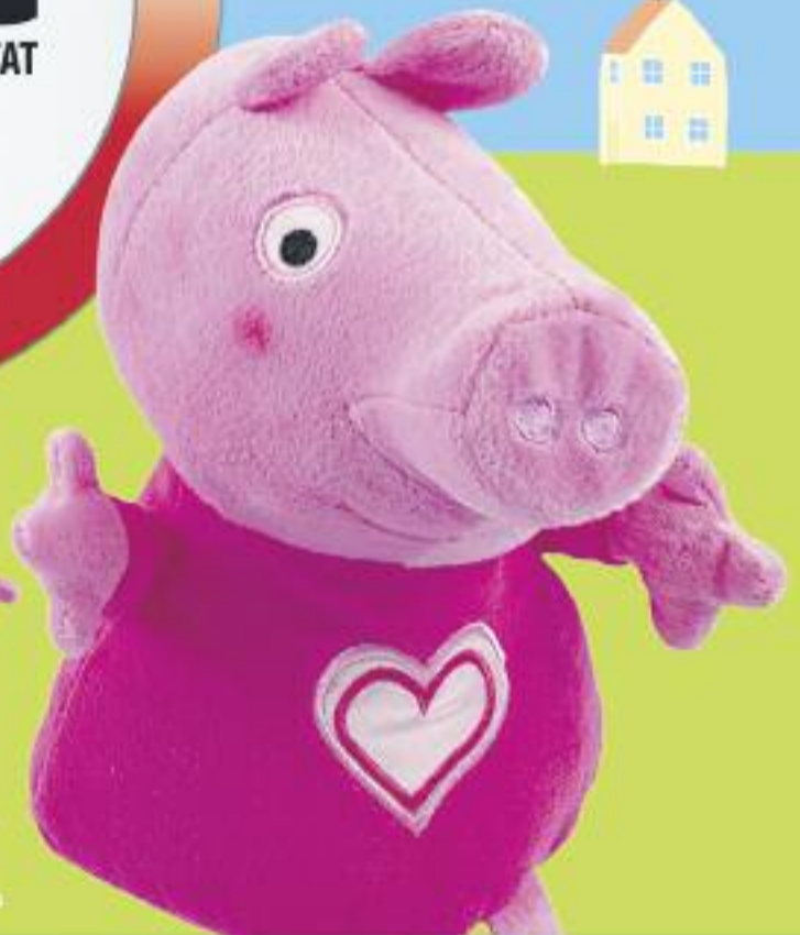
Peluixos assortits. Ref. 307000091. 3.350unitats