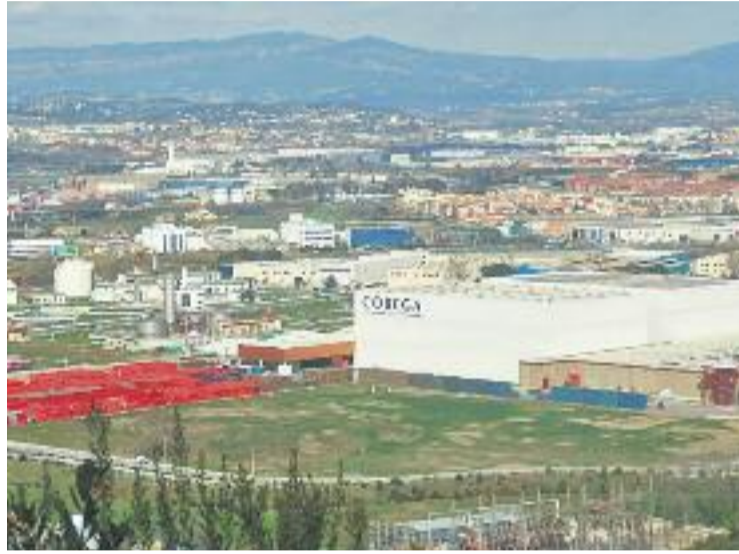
De moment Cobega pagarà una taxa de l'aigua reduïda.