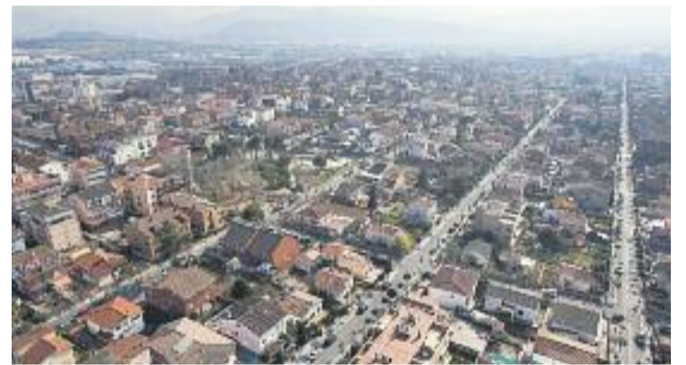
Els bombers diuen que s'han incendiat set contenidors.

Les investigacions s'han posat en marxa perquè l'any 2012 Parets ja va patir una onada d'incendis que van afectar, sobretot, vehicles però també contenidors d'aquesta mateixa zona del municipi. En aquella ocasió els Mossos van acabar detinent un home de 42 anys de Lliçà d'Amunt, al qual van acusar dels focs després d'una investigació i d'un dispositiu de vigilància amb la Policia Local.