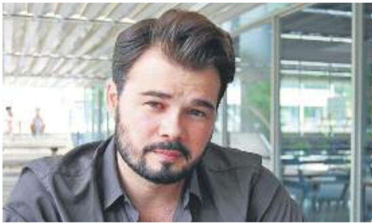
Rufián passejarà pels carrers del barri Plana Lledó.

Aquesta visita es fa amb motiu de l'inici de la precampanya electoral del 20 de desembre, durant la qual també passejaran per altres barris d'altres municipis de l'àrea metropolitana de Barcelona.