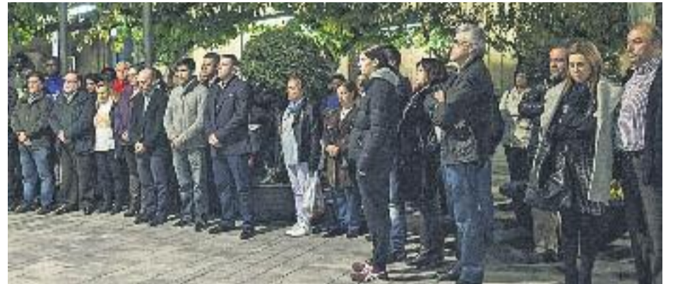
Tots els municipis vallesans han mostrat el seu rebuig als atemptats jihadistes de París.