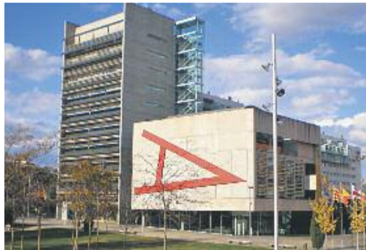
Els pressupostos es votaran en el Ple del 14 de desembre.

La formació de Buzón critica "la passivitat del govern, que no ha canviat la seva actitud en la negociació dels pressupostos" i lamenta "que sigui la tercera vegada que això succeeix", ja que, assegura, "hi va haver els mateixos impediments el passat mes d'octubre amb les ordenances fiscals i l'elecció del nou Síndic Personer".