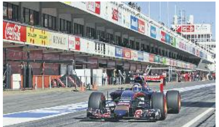
La pretemporada es disputarà al febrer i el març.

MONTMELÓ ▶ Un any més, l'organització de la Formula 1 ha tornat a confiar en el Circuit de Montmeló per ser l'escenari dels F1 Test Days, les jornades de pretemporada del campionat de monoplaques més important del món.