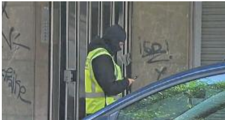
Els Mossos van escorcollar una casa de Plana Lledó.

La policia considera que s'ha escapat la trama que actuava a Barcelona i que controlava un centenar de dones que eren obligades a prostituir-se, sobretot, a la zona de les Rambles, a Barcelona. Els Mossos també asseguren que s'ha escapat la direcció