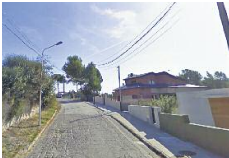
Molts carrers de la urbanització estan molt deteriorats.

La resolució judicial dona la raó a la promotora de Residencial Can Valls i confirma una sentència prèvia d'un jutjat contenciós de l'any 2012. Així doncs, el Tribunal Superior de Justícia de Catalunya (TSJC) considera que, després que l'empresa invertís 1,8 milions d'euros en les obres fetes l'any 2000, aquesta queda alliberada de les seves obligacions i que, a partir d'ara, serà l'Ajuntament qui s'hagi de fer càrrec de les obres que puguin quedar pendents. Tant el consistori com els veïns de la