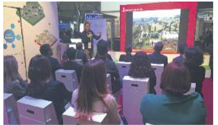
Mollet es una de les poques ciutats catalanes que hi han anat.

Amb l'assistència a aquesta cita internacional, l'Ajuntament també ha pogut intercanviar experiències en un congrés on participen 500 ciutats dels cinc continents com ara Nova York, Kioto, París, Singapur, Adelaide o Tel Aviv.