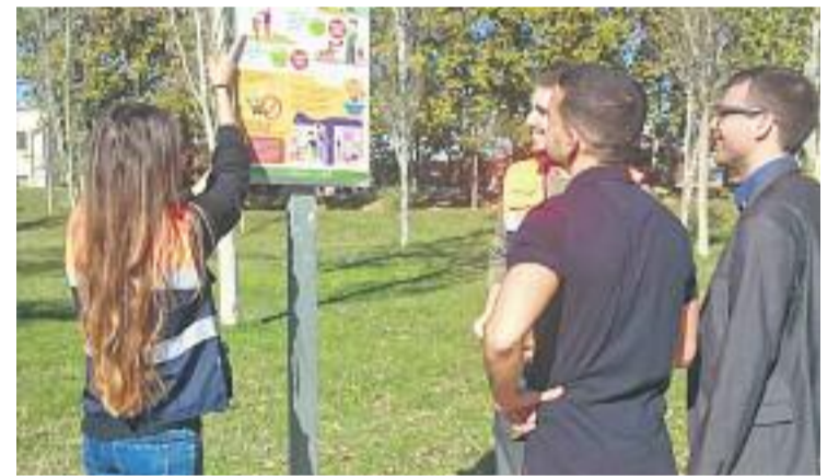
Els tècnics assessoren els veïns.

Des de l'Ajuntament asseguren que la intervenció d'aquests tècnics a peu de carrer, "suposa un tracte més proper amb la ciutadania i permet copsar tant l'opinió dels veïns com els temes sobre els quals cal incidir o millorar".