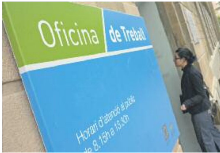
El 88,6% dels aturats només tenen els estudis de l'ESO.

D'altra banda, de les 76 persones que tenien estudis post-secondaris, és a dir, cicles formatius de grau superior, estudis universitaris de primer i segon