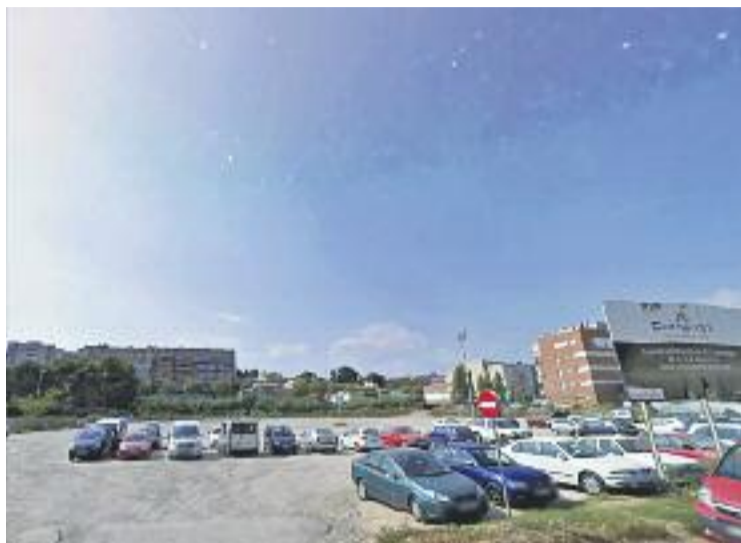
Espai on construiran 250 habitatges.

L'aprovació definitiva dels projectes d'urbanització i reparcel·lació, que es va fer en junta de govern, ha incorporat petits canvis tècnics proposats per l'Administrador d'Infraestructures