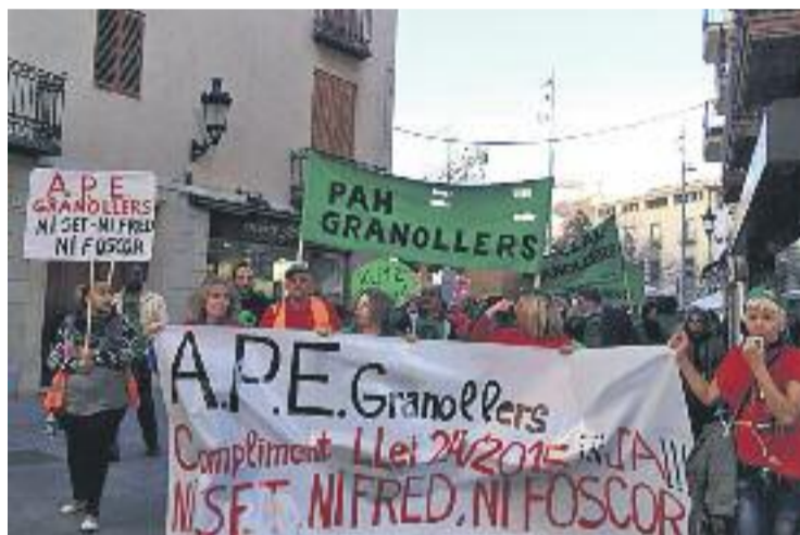
Dotzenes de famílies vallesanes no poden pagar l'aigua i la llum.