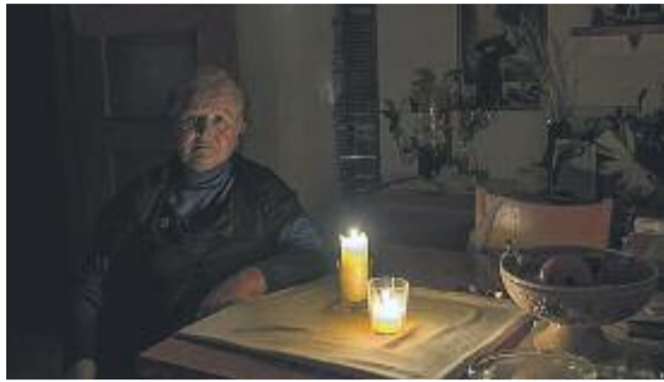
Presumpte veïna sense llum des de fa un any.

Des de la PAH asseguren que la companyia de la llum va comprovar que aquesta persona tenia el comptador manipulat, li va treure i li va posar una multa de 1.700 euros. Fa un any, algú li va punxar la llum, perquè pogués tenir el subministrament mentre se solucionava la seva situació i els membres de la PAH li van recomanar que anés als Serveis Socials perquè li donessin un ajut que li permetés pagar el submi-