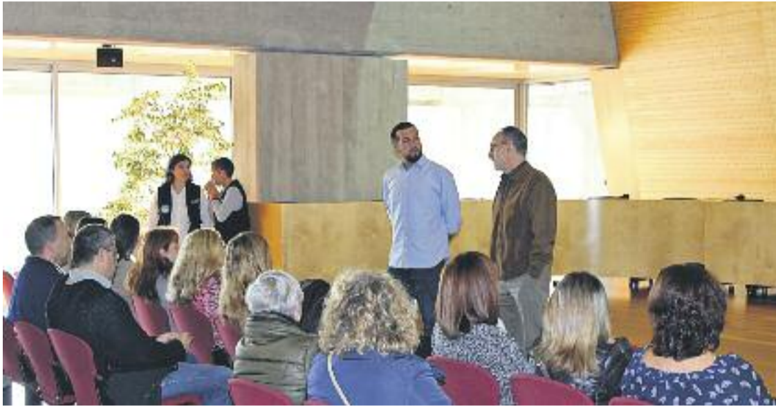
Aquest programa ja ha donat feina a 62 persones.