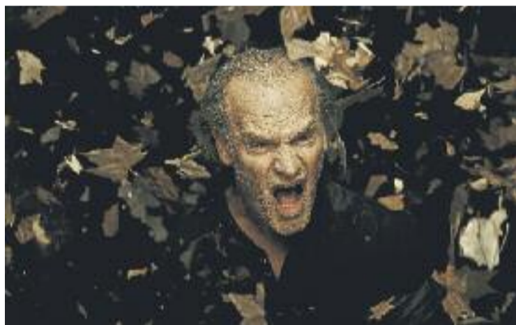
Lluís Homar actua aquesta nit al Teatre Auditori de Granollers.