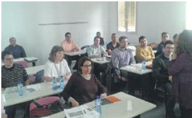
La iniciativa ofereix assessorament empresarial en diferents àrees.

L'Associació de Municipis de l'Eix de la Riera de Caldes subvencionarà les primeres 25 empreses seleccionades que, després d'una entrevista de diagnòstic, se'ls donarà suport i acom-