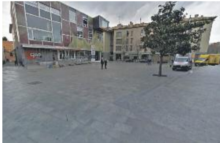
La plaça Manuel Montañà serà un espai de la plaça de la Porxada.

D'aquesta manera es posa fi a la polèmica originada fa setmanes quan la CUP va exigir aquest canvi de nom "com a acte obligat de justícia cap a les víctimes del franquisme i de restitució de la memòria històrica", una petició a la qual es va afegir el coordinador de la Co-