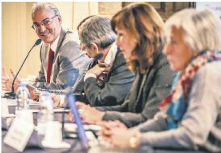
En la primera fase del projecte ja s'ha atès 35 afectats.