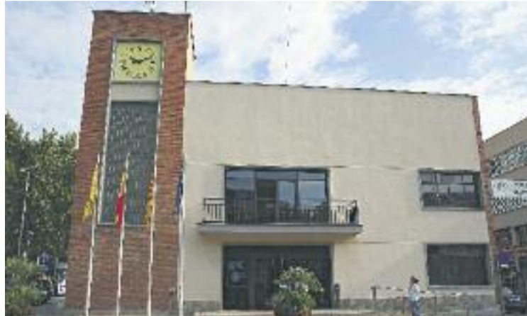
Les ordenances fiscals per al 2016 es van aprovar dilluns.

Tot i aquests canvis, els llagostencs encara no poden conèixer quina serà la seva factu-