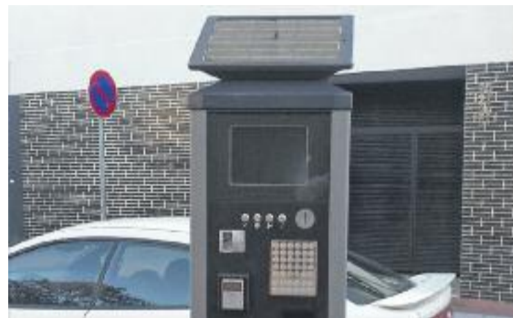
S'instal·laran 16 nous parquímetres més fàcils d'utilitzar.

Aquesta setmana, l'Ajuntament també ha començat la substitució de 16 parquímetres per uns aparells de més fàcil funcionament, amb una pantalla tàctil més gran, visible, fins i tot, quan es fa fosc. Els aparells s'estan instal·lant a la plaça de la Corona i en els carrers compresos entre Sant Jaume i Princesa.