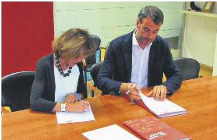
El Circuit i el CIRE s'uneixen per ajudar en la reinserció dels presos.

Fruit d'aquesta col·laboració, el Circuit de Barcelona-Catalunya fomentarà l'organització d'accions destinades a facilitar la integració professional amb la realització de diferents actuacions de conservació, millora i protecció de l'entorn del Circuit, així com amb la fabricació i gestió de béns i serveis necessaris en l'activitat diària de la instal·lació.