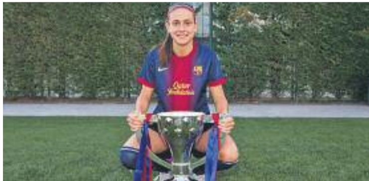
Putellas, amb una de les lligues que ha guanyat amb el Barça.

Putellas va superar en les votacions de 'Millor Jugadora' a Marta Torrejón, companya seva al Barça, i a l'exblaugrana Marta Corredera, que actualment juga a l'Arsenal. Després de conèixer el resultat de la votació, la molletana va mostrar la seva satisfacció: "Em fa molta il·lusió. Ho veig com un premi in-