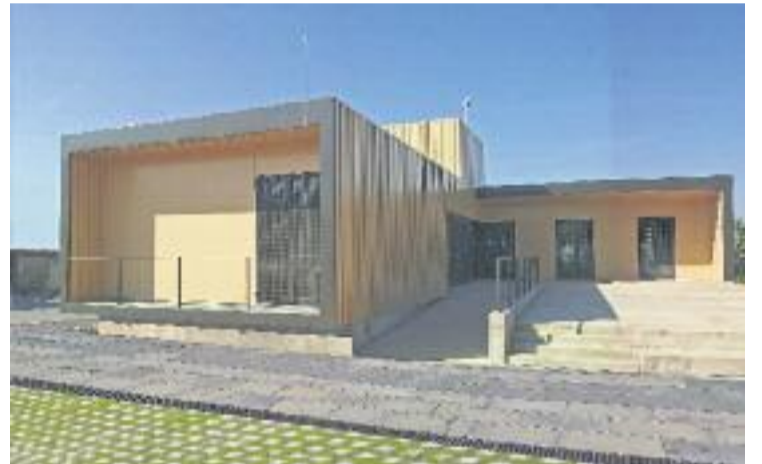
Els cursos de formació es faran a La Serradora.

Segons informa l'organització, "la iniciativa es posa en marxa d'acord amb el compromís amb el territori d'influència". El centre oferirà cursos subvencionats dirigits a treballadors en actiu, tant en empreses agremiades com a les que no estiguin associades a l'AIBV. En concret s'oferirà formació en temàtiques relacionades amb el comerç internacional, la generació de talent, les habilitats directives, la gestió d'equips i els idiomes.