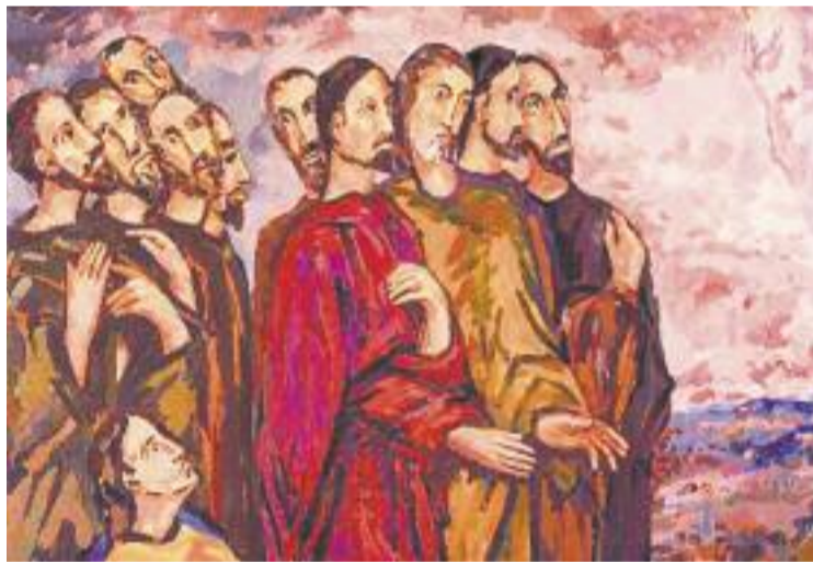
El fresc està a l'església de Sant Vicenç.