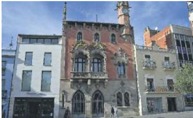
L'Ajuntament assegura que les contractacions s'ajusten a dret.

Segons la CUP, aquestes places de nova creació tenen per funció realitzar tasques de gestió i de direcció d'àrees i departaments concrets i, per tant, són places que "no poden ser cobertes per personal eventual, ja