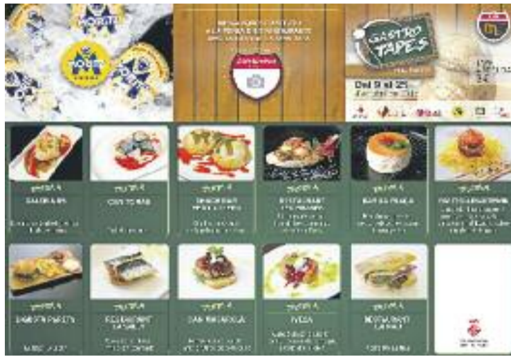
El GastroTapes és una iniciativa importada de Granollers.

Dilluns a les cinc de la tarda es donaran a conèixer els restaurants que han fet la tapa més popular i la millor tapa de la ruta, així com els tres guanyadors dels premis d'un sopar per a dues persones a un dels restaurants participants, un val de compra a les botigues de Parets i un curs de cuina.