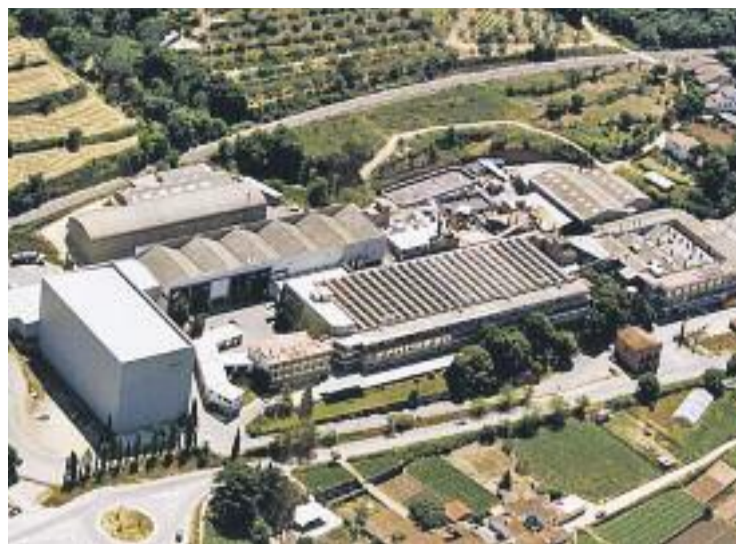
Els treballadors de Sati van ser acomiadats fa vuit mesos.