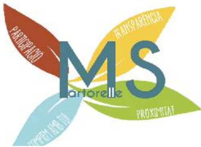
El PAM vol fomentar la participació ciutadana.

Una de les accions que ha de concretar el Pla d'Actuació és la seva imatge institucional, que ha d'incorporar conceptes transversals entre l'Ajuntament i la ciutadania com "la transparència, la participació i la proximi-