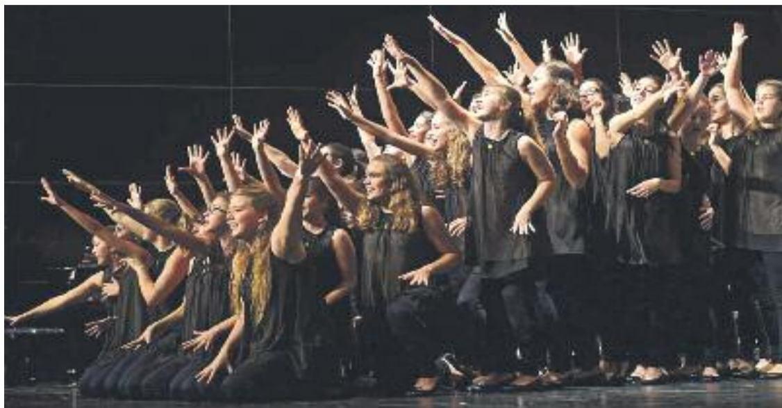
És la primera vegada que un cor de l'Estat espanyol aconsegueix aquest reconeixement.