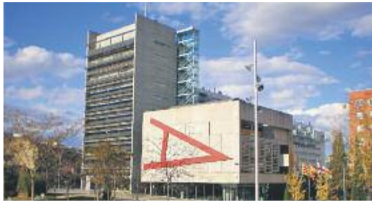
CM demana al govern que valori la voluntat de la ciutadania.

Segons CM, "la transparència es demostra posant a l'abast de la ciutadania la informació completa i suficient per poder incloure propostes en els pressupostos", cosa que asseguren que