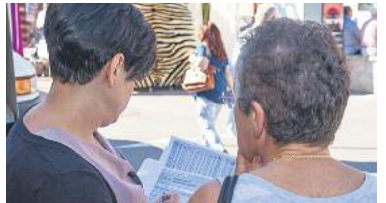
790 persones han opinat sobre els pressupostos.

El procés de participació es plantejava, com en edicions anteriors, en dos blocs. D'una banda, en la prioritització d'accions i de l'altra, en l'aportació de propostes obertes.