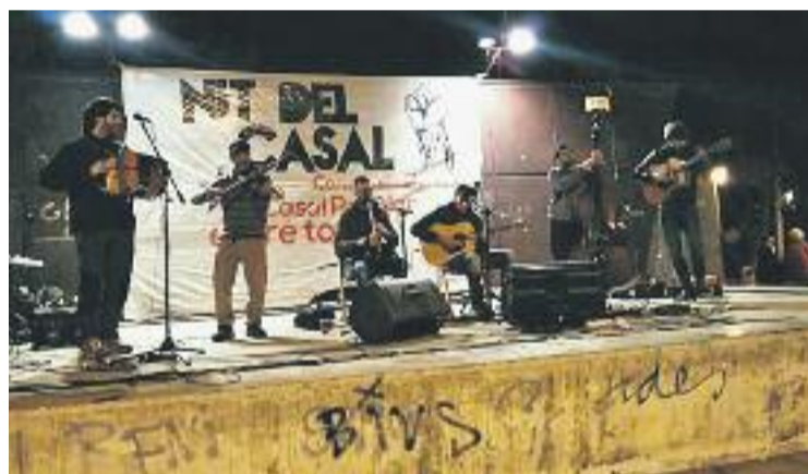
Els trets es van fer amb un arma d'aire comprimit.

Des del Casal Popular s'han mostrat molt sorpresos per l'actitud d'aquesta persona i lamenten els fets. En el mateix sentit, l'Ajuntament critica el succés i remarca que aquestes actuacions "són contràries a la convivència i a la cohesió social que es busca al municipi".