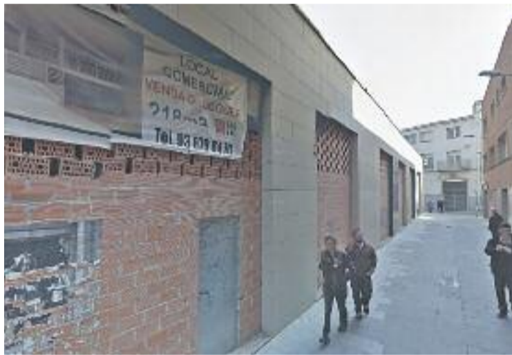
L'Ajuntament vol que aquest local sigui un espai cultural.