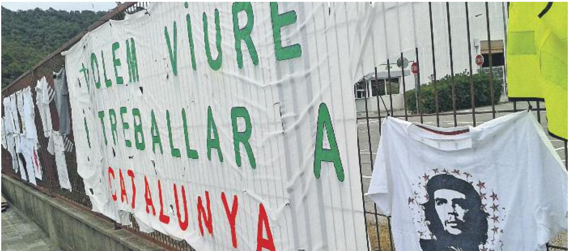
Els treballadors de Valeo han arribat a un acord amb l'empresa després d'una reunió maratoniana de 14 hores.