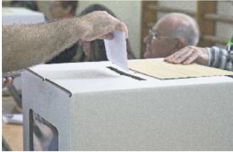
L'abstenció del PSC permet aprovar l'acord.