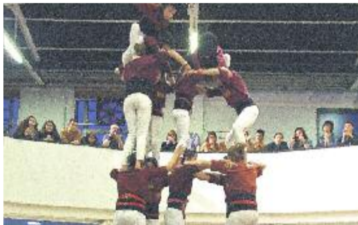
Els Xics celebren la seva Diada amb una trentena d'actes.

Per promocionar aquesta cita, els Xics han fet un vídeo on la canalla és la protagonista i amb l'eslògan Estan preparats. I tu? . A través d'aquest vídeo la colla ha volgut mostrar, amb música de Carmina Burana, com els joves castellers es preparen per fer castells.