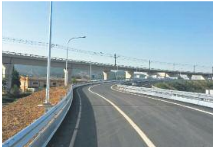
Enllaç entre la C-33 i la C-17.

L'alcalde de Mollet ha mostrat la seva satisfacció davant "l'entrada en servei d'aquest enllaç, reivindicat des de fa temps perquè millora les condicions de mobilitat interna i de contaminació a la ciutat, ja que estalvia el pas de transport pesat per dins del nucli