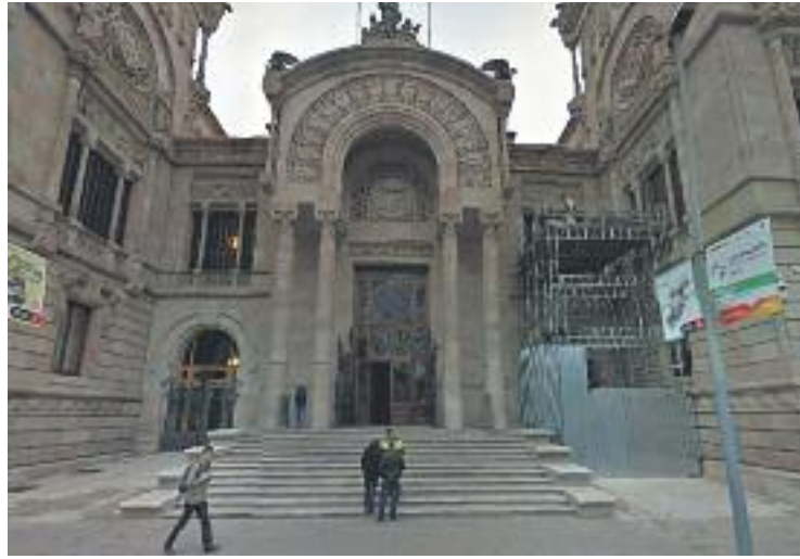
El judici es fa a la Secció 10 de l'Audiència de Barcelona.

El passat 15 de juliol, en una compareixença a la Sala 10 de l'Audiència de Barcelona, es va sentir la declaració gravada que uns psicòlegs van prendre a la menor, en la qual relatava els fets. Els psicòlegs van afirmar que el seu