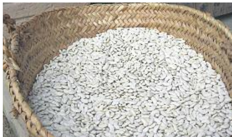
Mongeta de ganxet, un dels productes que surten a la guia.