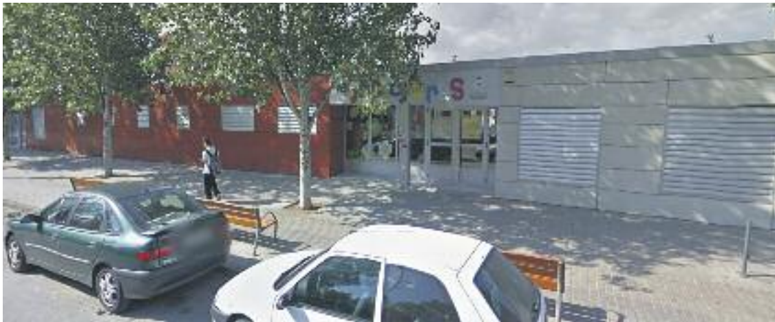
L'Ajuntament ha demanat una subvenció per reduir el cost de l'escola bressol municipal Cucutras.