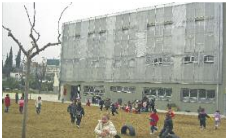
S'instal·laran nous barracons als Aigüerols i al Rovira-Forns.

El cost de l'actuació és de 41.306 euros. La Generalitat ja va anunciar al mes de febrer a l'Ajuntament que assumiria el cost del barracó d'Els Aigüerols per tal de garantir la seva conti-