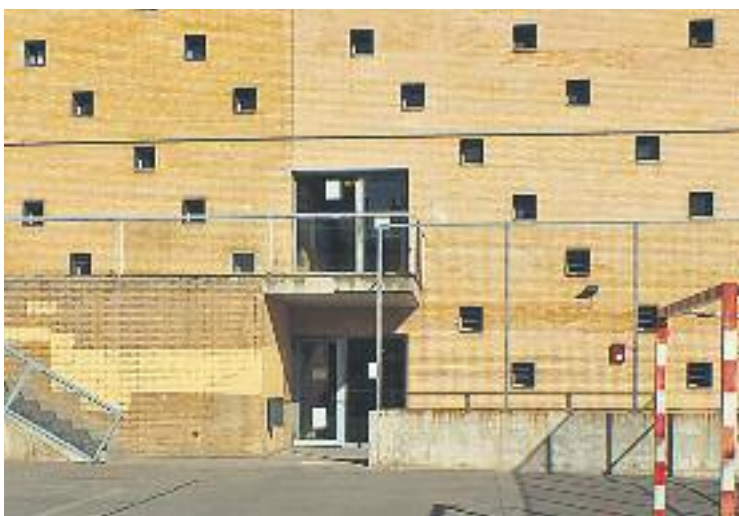
Institut Gallecs on es fa la formació dual.