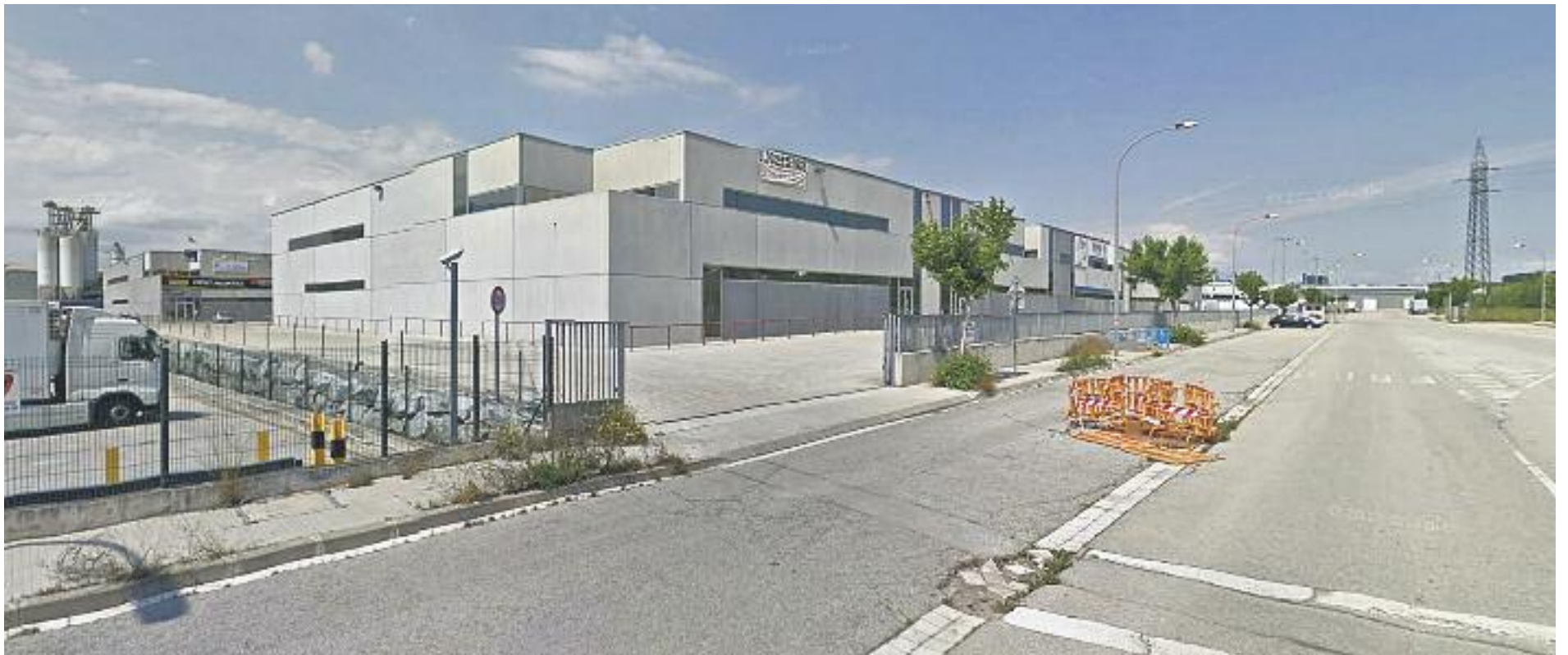
El retrocés en la qualitat de les infraestructures, la taxa d'atur i la manca de recursos per a l'educació han estat els factors que han fet perdre competitivitat a la comarca.