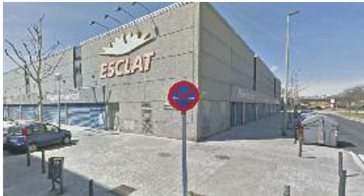
Supermercat on es va produir l'homicidi.