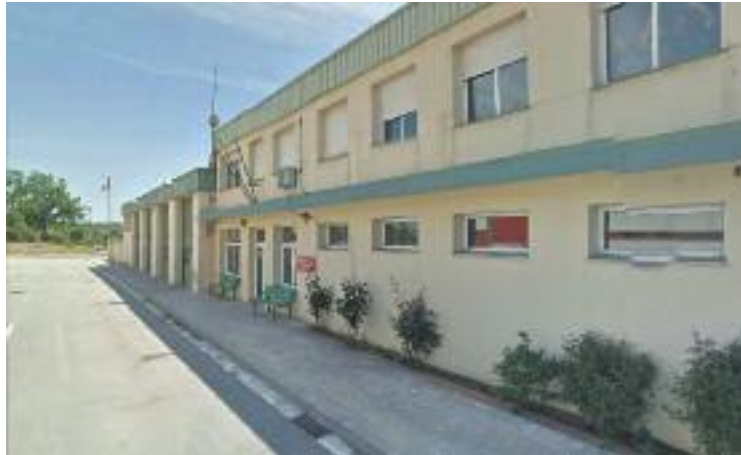
La Generalitat reformarà el Parc de Bombers de la Generalitat.

serviran per habilitar i condicionar l'exterior del parc, amb una nova porta d'entrada de camions i també per crear sales noves i remodelar els espais que només utilitzen els bombers, com poden ser el menjador i els vestidors.