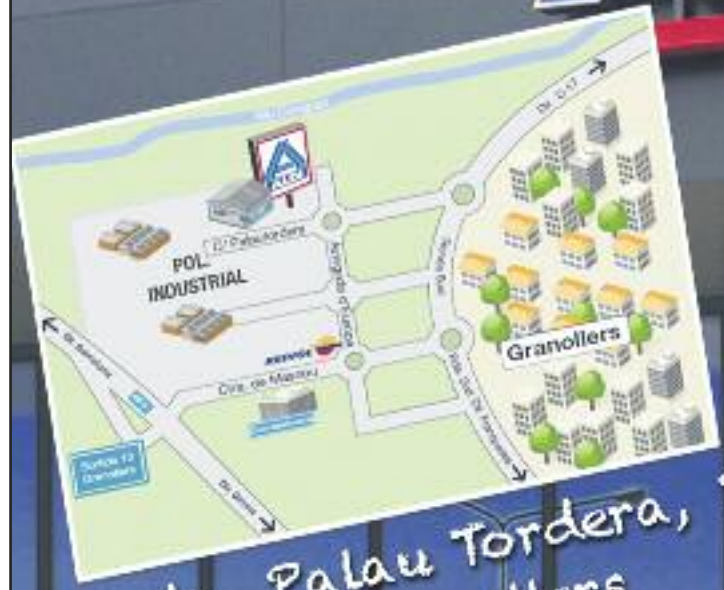
Avda. Palau Tordera, 8-12 08400 Granollers