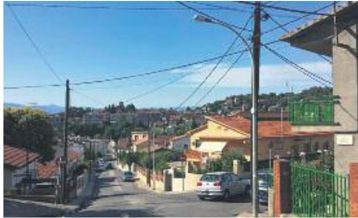
Reprendran la urbanització de Can Sunyer.

Segons l'Ajuntament, "es preveu que aquest soterrament es realitzi en el mateix termini