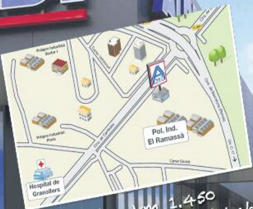
Ctra Cardedeu km 1.450 08521 Les Franqueses del Vallès