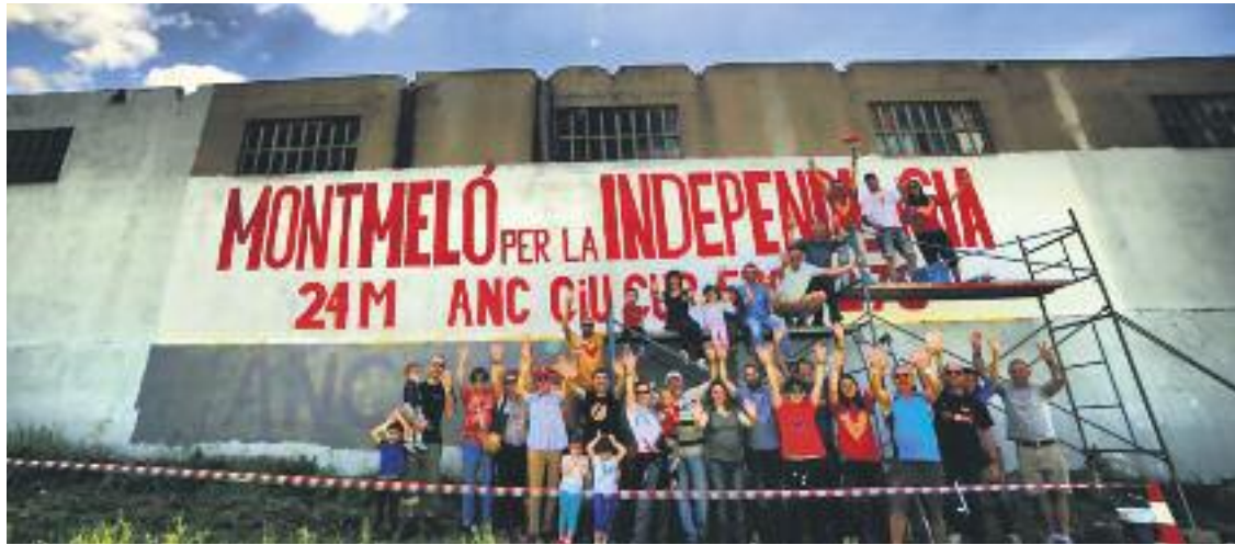
Pintada d'un mural per la independència a Montmeló. Foto: 27S Montmeló