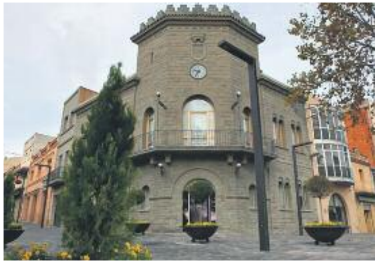
Rebaixen els sous de l'alcalde i els regidors a dedicació completa.

Aquesta rebaixa dels sous només ha rebut el vot favorable del PSC i C's. Sumem Parets hi ha vo-