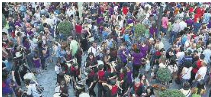
Festa Major d'Estiu de l'any passat.

Com en edicions anteriors, es faran les batalles entre els cavallers del Pla i el Serradal i una seixantena d'activitats lúdiques i culturals.