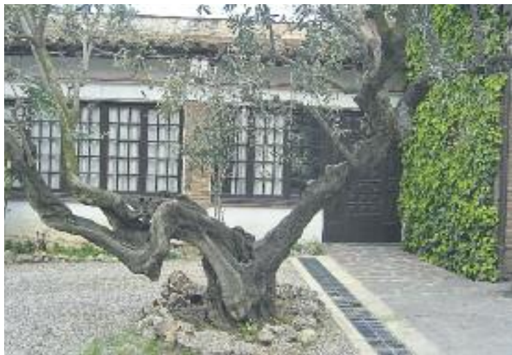
El Xiprer passa a ser una Fundació.