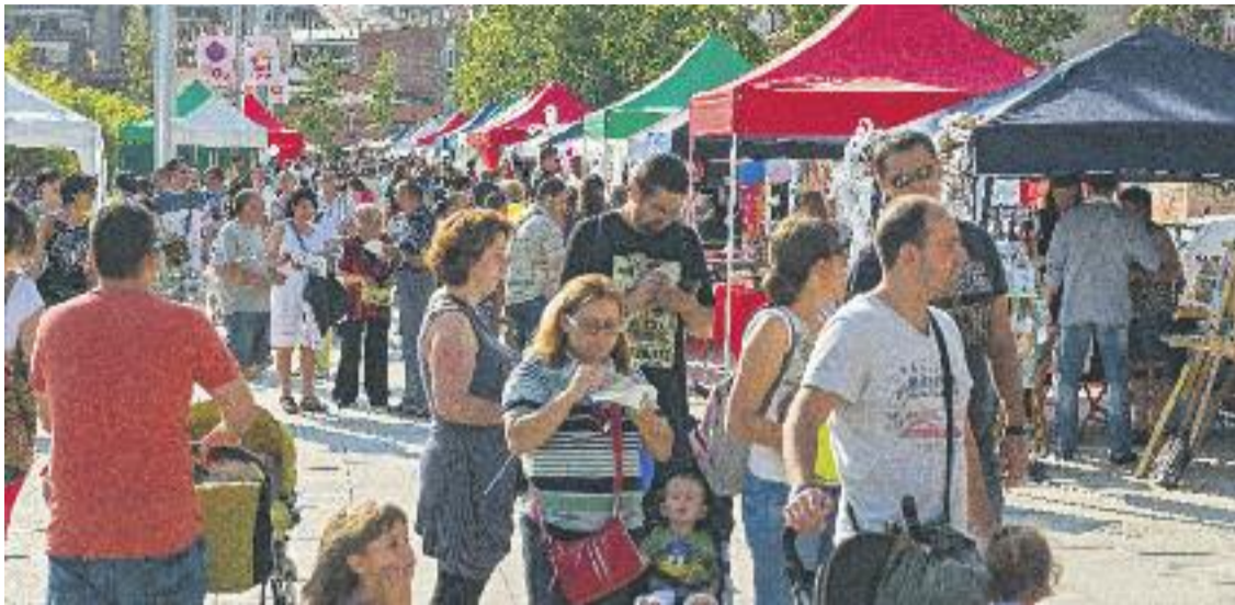
La Fira Comerç i Qualitat de Vida comptarà amb un augment del 25% de la participació.