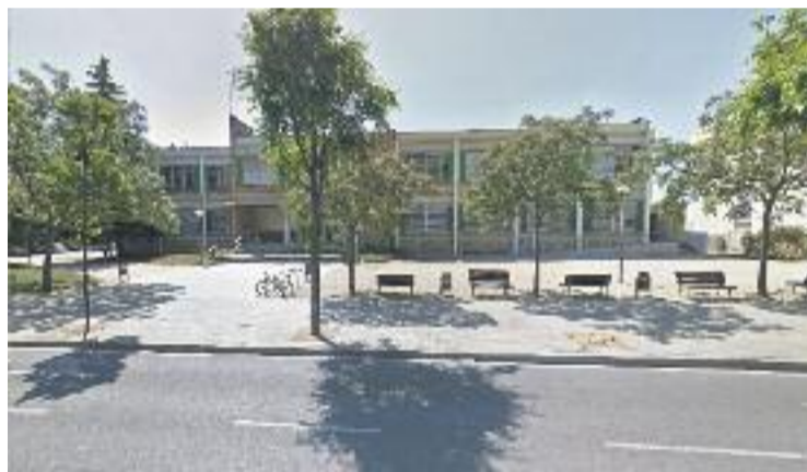
Una de les escoles que faran jornada compactada.

Tot i voler fer la jornada contínua, els tres instituts han acordat mantenir i potenciar les activitats extraescolars que ja organitzen a les tardes. A més, es coordinaran de manera que els alumnes d'un centre puguin optar a les que s'organitzin en un altre institut i recorden que el servei de menjador seguirà a disposició dels alumnes que ho necessitin.