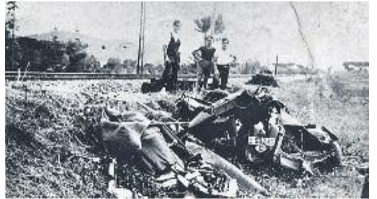
Un fotograma del documental.

L'antiga fàbrica Cucuruny va passar a anomenar-se "Fàbrica M" i es va convertir en una companyia col·lectivitzada que subministrava totxos refractaris als alts forns del país.