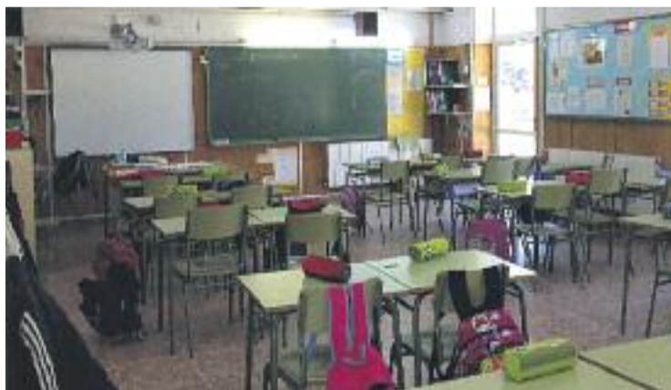
Una de les aules de primària de l'escola.

La ruta va començar a la Font del Camp, on la Lolita Milà els va explicar la importància de l'aigua i la història d'aquest antic safareig, que en el passat va ser un important punt de trobada per a les dones del municipi.