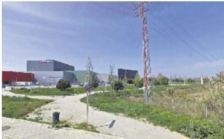
Zona de Can Milans on es troba l'empresa Valentine.

"Això suposa, de fet, la requalificació de la zona verda de Can Milans en zona industrial, tot i que hi ha dues sentències