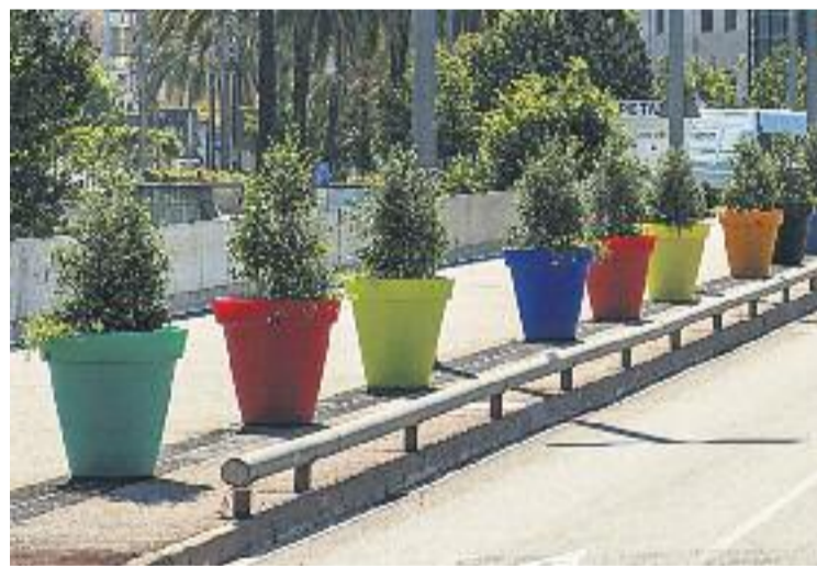
Alguns dels testos que s'han col·locat al pont.