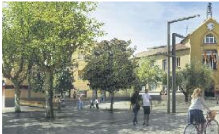
Les obres suposaran una inversió d'1,3 milions d'euros.

A mesura que el procés avanci s'aniran modificant aquests accessos provisionals. Està pre-