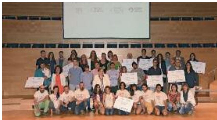
La foto de família després del lliurament de premis.

L'acte de lliurament dels premis es va celebrar el passat 12 de juny a l'Auditori de Girona i va tenir com a madrina la nedadora Ona Carbonell.