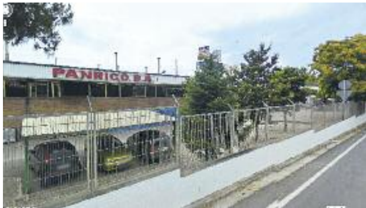
Una imatge de la fàbrica de Panrico de la ciutat.

Amb la compra, Bimbo veurà com els seus beneficis augmenten en uns 700 milions d'euros,