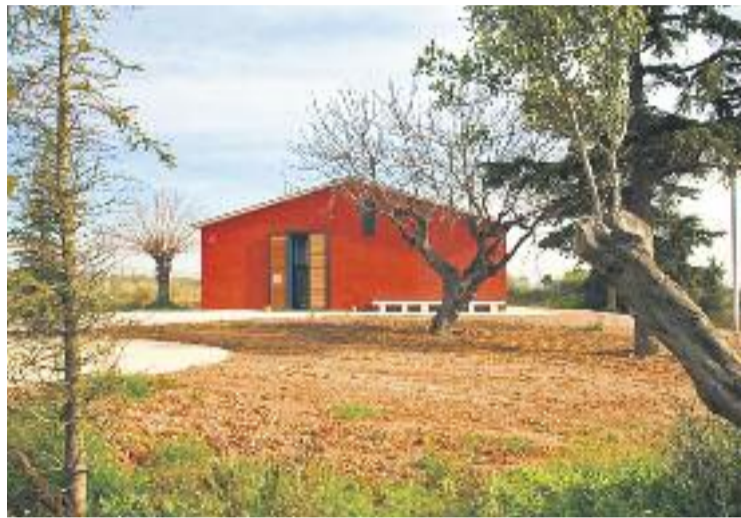
La ubicació de la futura pista d'skate.

L'Ajuntament havia impulsat el procés participatiu Digues la teva sobre Cal Jardiner , en el qual hi van participar uns 650 joves del municipi, que van triar en primer lloc una pista poliesportiva (que ja està