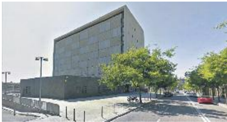
S'impulsaran dos jutjats de reforç a la ciutat.

Per la seva banda, el Departament de Justícia de la Generalitat de Catalunya adequarà dos espais específics que podrien situar-se a la primera i sisena planta de l'edifici judicial de