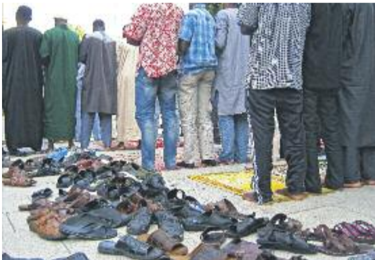
La comunitat musulmana en una imatge d'arxiu.