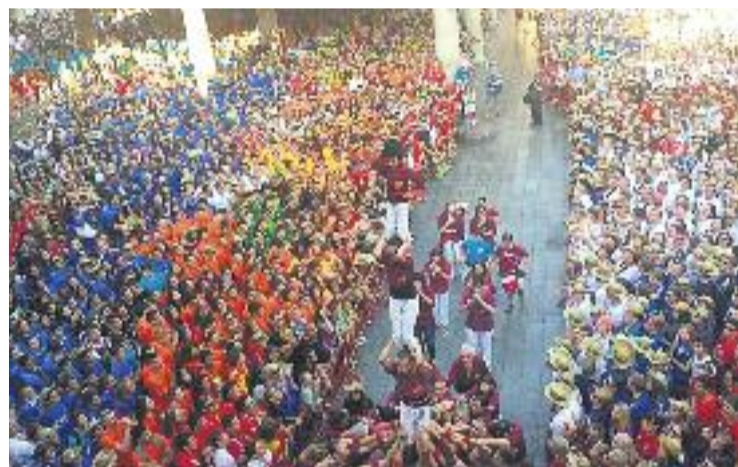
Una imatge de la cerimònia d'inauguració del campionat.

Les finals de les 10 categories s'oferiran en directe per televisió.