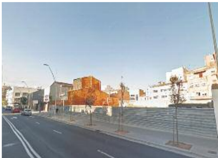
Solar on es construirà el nou centre de salut.

La Generalitat calcula que el nou centre de salut de Granollers, que s'ubicarà al solar on hi havia l'antiga Policlínica, tindrà un