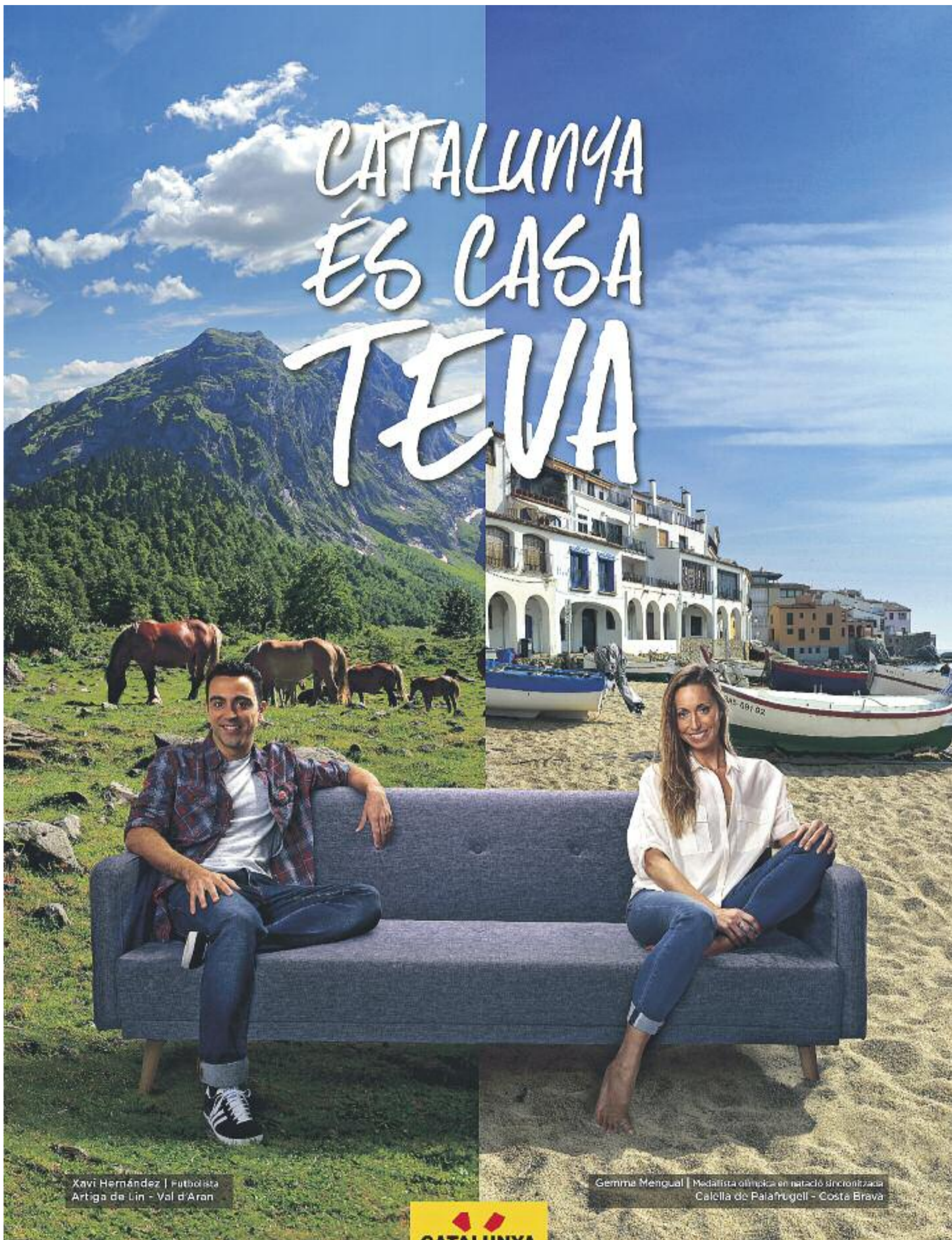
Xavi Hernández | Futbolista Artiga de Lin - Val d'Aran