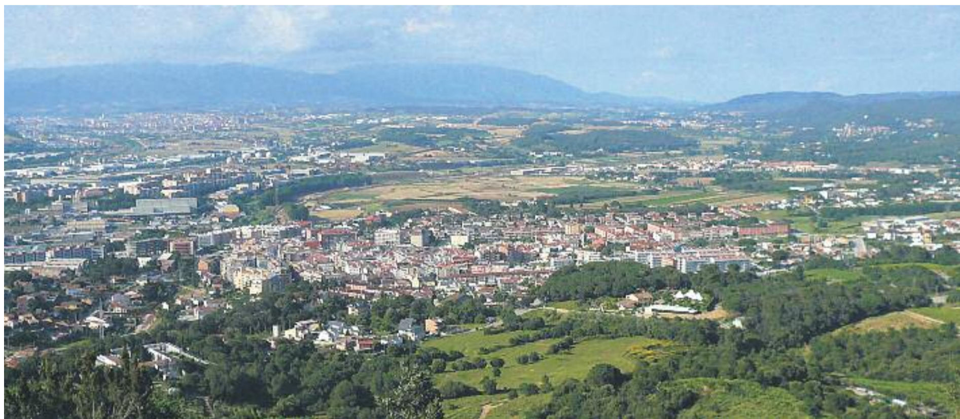
El Vallès Oriental és la comarca de la regió metropolitana de Barcelona que més creix en nombre de població.