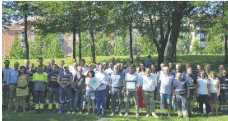
Equip municipal que ha contribuït a guanyar el premi.

Mollet ha guanyat aquest reconeixement europeu conjuntament amb la ciutat portuguesa de Torres Vedras, després que fos preseleccionada d'entre un total de 15 ciutats europees. Els guanyadors del premi es van donar a conèixer a una cerimònia celebrada dijous passat a l'actual Capital Verda Europea, Bristol (Regne Unit). És el primer any que la