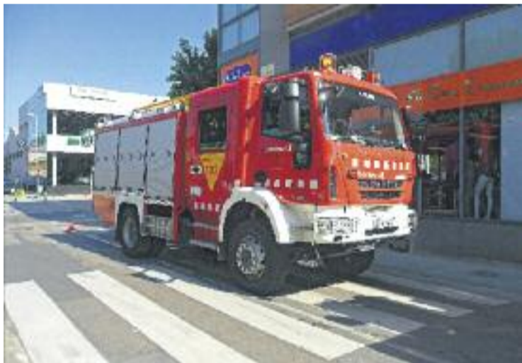
Els Bombers de Mollet comptaran amb sis efectius més.