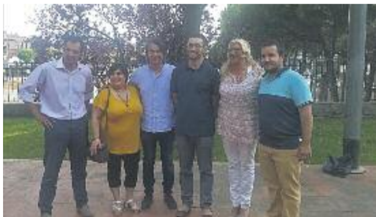
ERC governarà amb PSC, MApM i ICV-EUiA.

ERC va ser la força més votada el passat 24 de maig, però empatada a tres regidors amb UxM. Els dos partits van descartar formar un govern de coalició, així com pactar amb CiU, i durant tota la setmana passada es van reunir amb la resta de partits per arribar a possibles acords. Candela ha tingut més capacitat de negociació i ha aconseguit que durant la pròxima legislatura les forces d'esquerres governin al municipi. Segons Candela, arribar a un acord entre les quatre forces "ha estat fàcil perquè