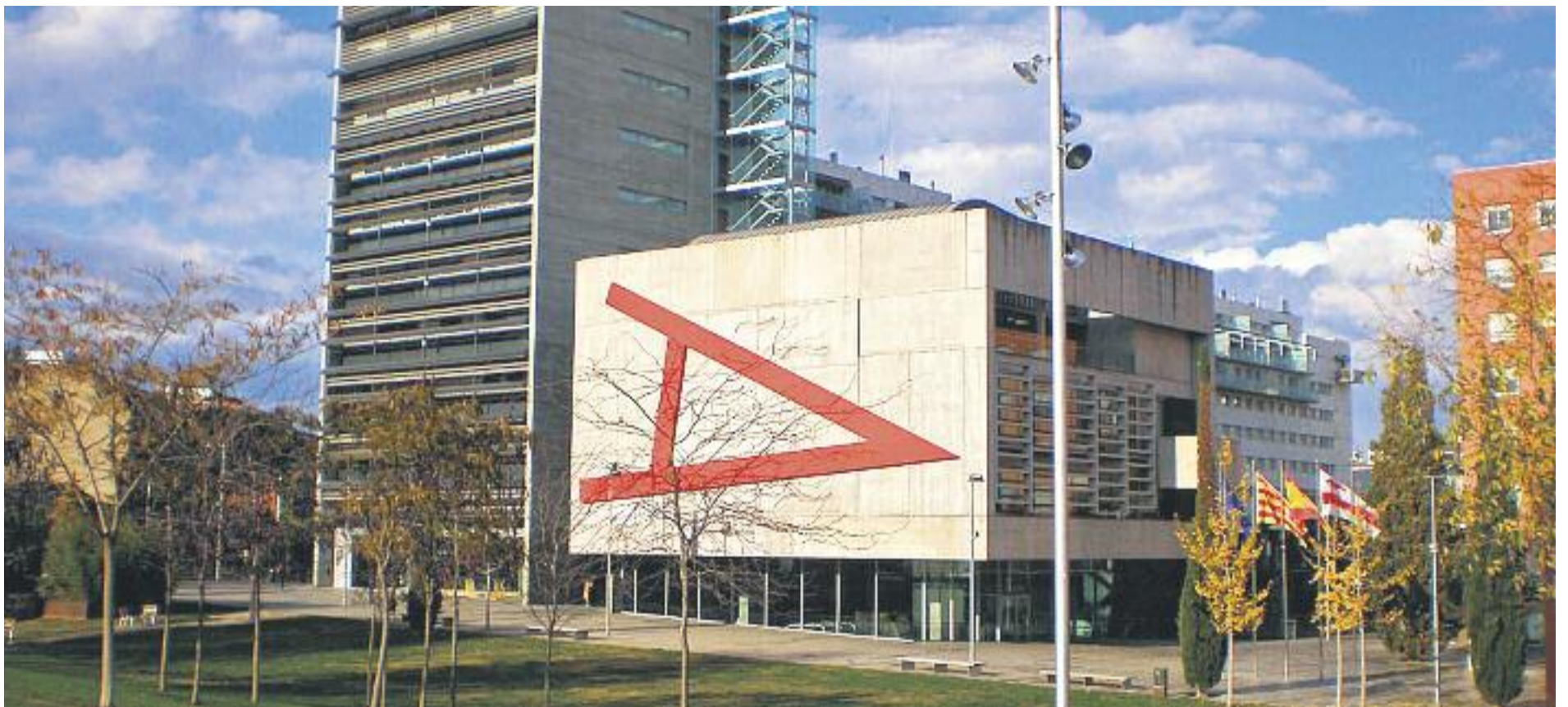
Sembla que el canvi finalment no arribarà a l'Ajuntament de Mollet.