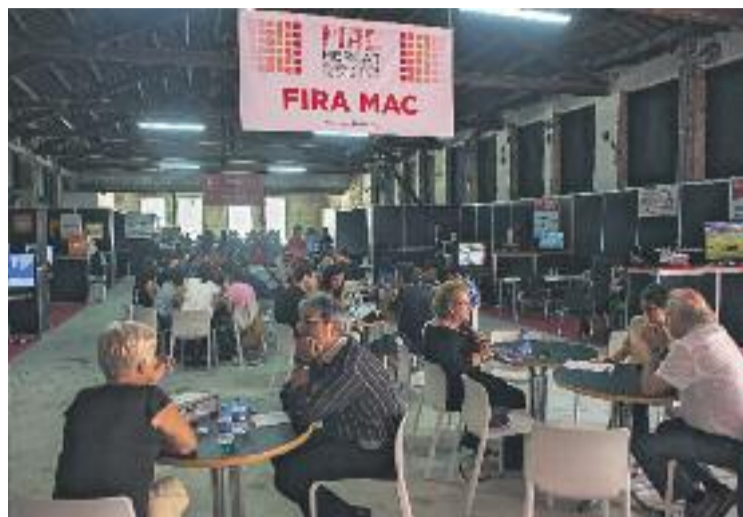
Reunions de professionals al Mercat Audiovisual de Catalunya.