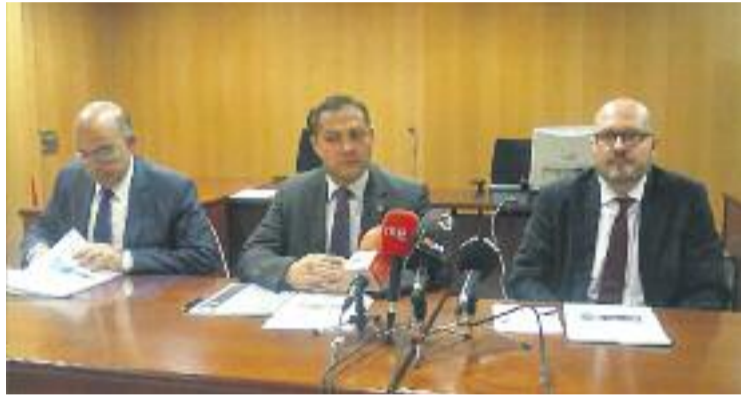
Els magistrats reclamen solucions.

Els magistrats denuncien la "situació dramàtica" que viuen perquè no disposen de la infraestructura ni el personal suficient per assumir la càrrega laboral que tenen. "Estem anunciant judicis perquè se celebrin al cap de dos anys, i quan mires als ulls la persona que tens davant i li ho comuniquem, se't cau la cara de ver-