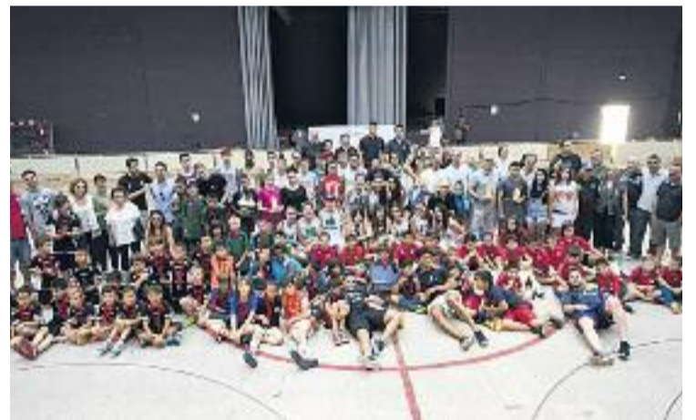
Participants de la Festa de l'Esport de la ciutat.

SANTA PERPÈTUA ▶ Durant el passat cap de setmana del 6 i el 7 de juny, la ciutat va celebrar la divuitena edició de la Festa de l'Esport.