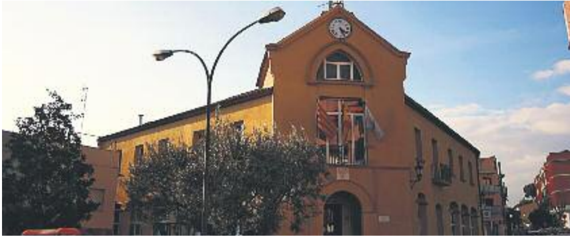
ERC té la clau per decidir qui governarà el municipi.