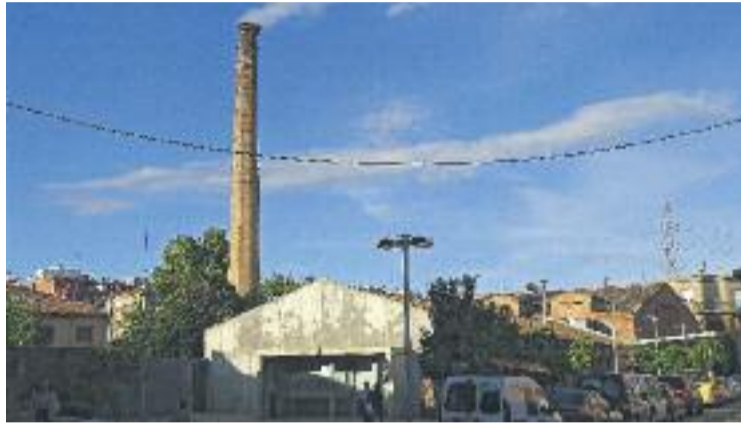
La rehabilitació es fa per evitar possibles desprendiments.

La rehabilitació de la xemeneia del Vapor suposarà una in-