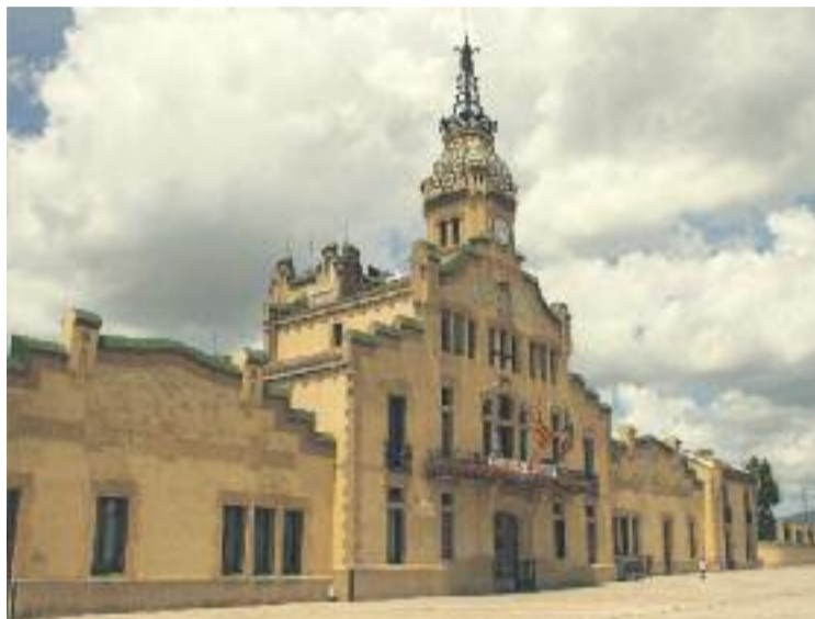
Un tripartit podria governar les Franqueses aquesta legislatura.

amb 3 regidors i el 15,4% dels sufragis. ERC, al seu torn, és la quarta força amb 2 regidors el 12% dels suports. La suma d'aquests tres partits, llavors, seria suficient per formar una majoria absoluta per nomenar un nou alcalde i formar un nou govern per al municipi.