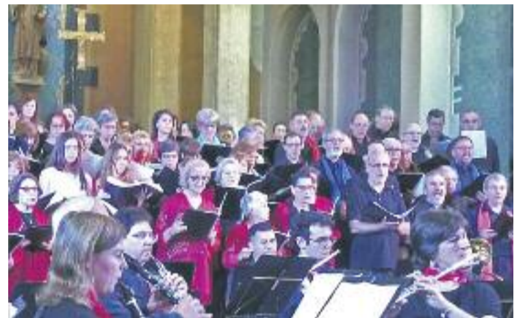
Un dels concerts del cicle Mollet Canta.

El projecte es va iniciar el desembre passat amb el propòsit d'iniciar un cicle de concerts estable i que permetessin unificar dates, així com aglutinar totes les corals de Mollet. Els concerts s'han anat fent cada últim diumenge de mes a l'Església de Sant Vicenç. El colofó final va ser el 31 de maig amb un concert conjunt en el qual també va participar l'Associació Musical Pau Casal i en el qual l'església va omplir-se de gom a gom.