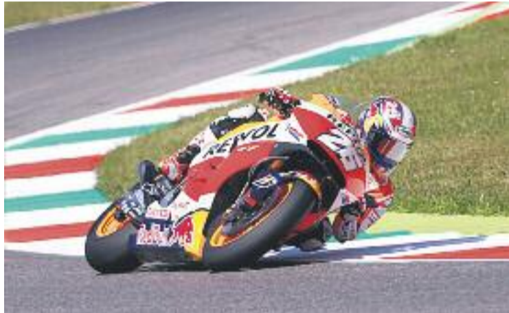
El vallesà Dani Pedrosa buscarà guanyar a casa.

La ciutat ja olora a benzina. I és que aquest diumenge, el Circuit de Barcelona-Catalunya torna a convertir-se en l'escenari on els millors pilots de motos del moment buscaran seguir lluitant pel títol mundial. Valentino Rossi, Johann Zarco i Danny Kent arriben com a líders de MotoGP, Moto2 i Moto3, respectivament.