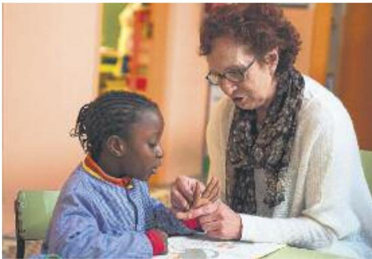
Granollers serà seu de l'Escola d'Estiu del Voluntariat.

SOCIETAT ▶ Granollers serà seu de l'Escola d'Estiu del Voluntariat entre els dies 2 de juliol i 19 de setembre. Així doncs, per primer any, juntament amb Barcelona, Lleida, Tarragona o Sabadell, la ciutat formarà persones en l'àmbit del voluntariat, en dos cursos que es faran a Can Jonch.