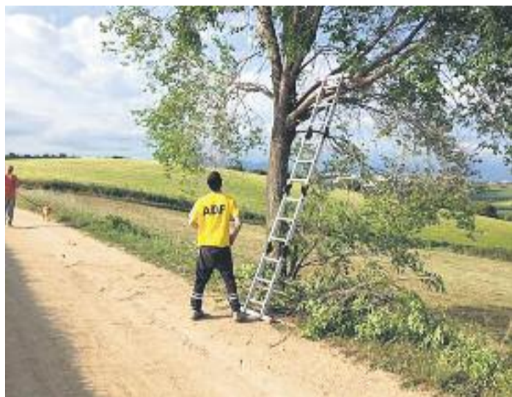
Una de les actuacions fetes per l'ADF Gallecs.

L'ADF Gallecs està formada per sis voluntaris, una xifra que minva any rere any. Fins ara, l'ADF Gallecs ha fet un parell de sortides cada any, sempre per apagar petits focs en conreus o petites superfícies de bosc o matolls i enguany es preveu que