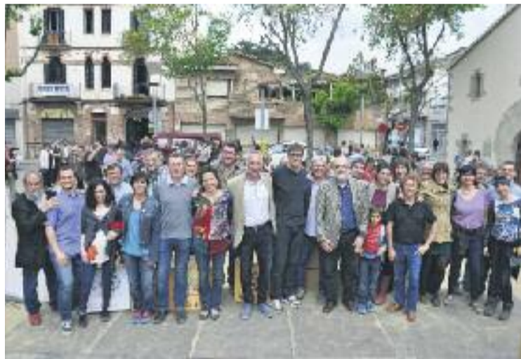
Les assemblees de la CUP i ERC van aprovar les negociacions.