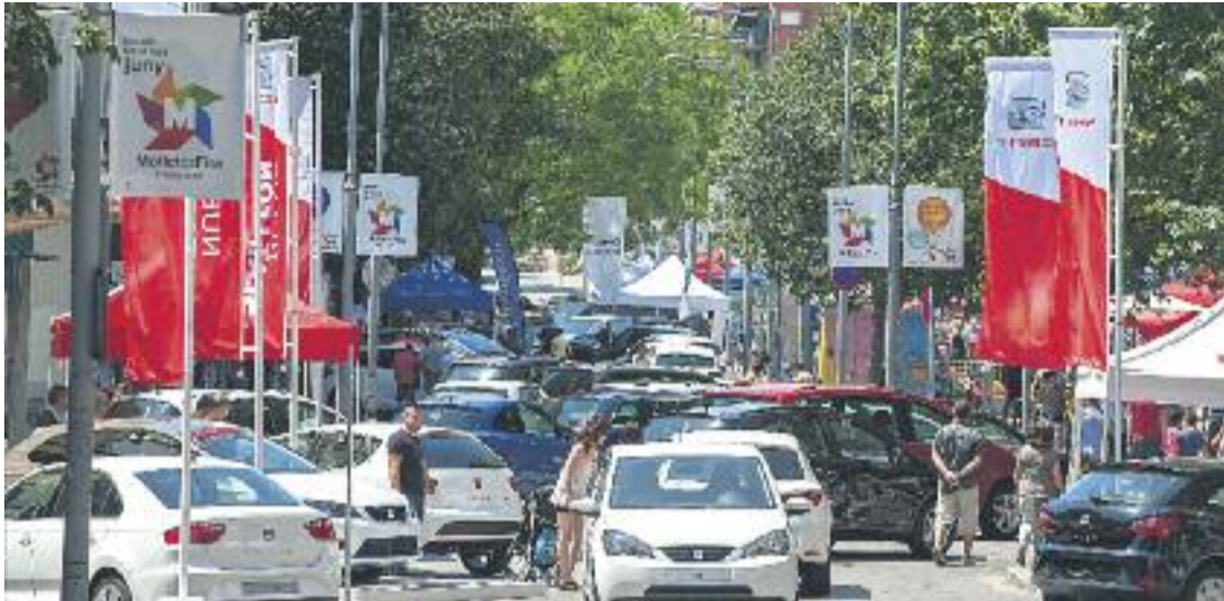
Mollet és Motor comptarà amb la segona edició de la Llotja del vehicle clàssic.