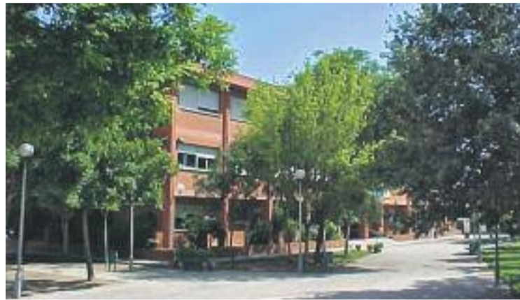
Condemnen tres monitors externs de l'escola Montseny.

Segons recull la sentència, els monitors van burlar-se dels alum-