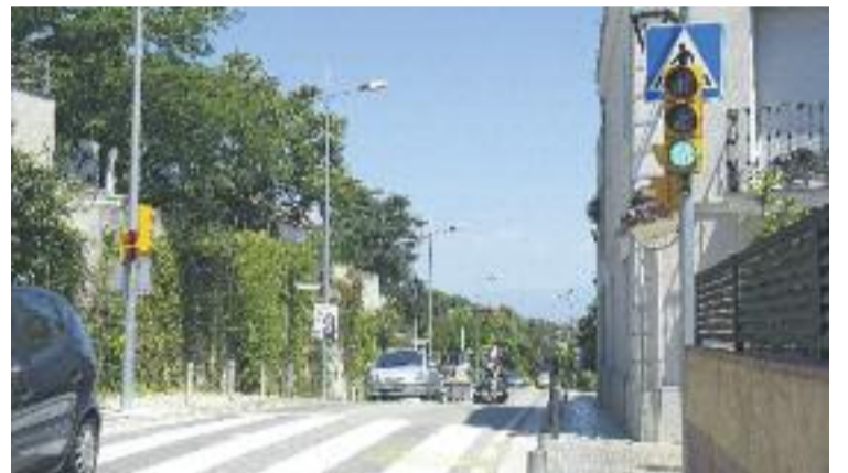
El semàfor era una mesura llargament reivindicada.

Amb aquesta mesura es reforça la seguretat de vehicles i vianants en aquest tram, on fa uns mesos una dona va patir un atropellament, cosa que va provocar que es reclamés a la Generalitat alguna mesura de control en aquesta zona de la via. Tot i això, tant la Comissió com l'Ajuntament continuen treballant per aconseguir el desviament provisional de la carretera.