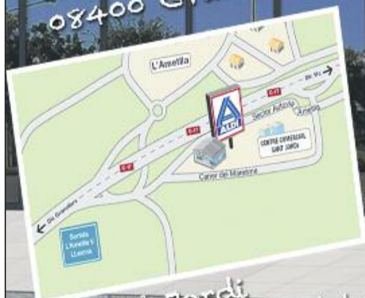
CC Sant Jordi 08480 L'Ametlla del Vallès