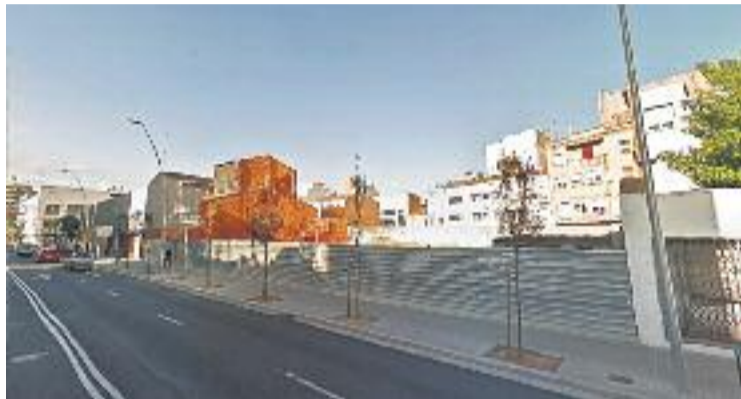
El nou centre es construirà al solar de l'antiga Policlínica.

Segons el pla funcional al qual ha tingut accés El 9 Nou, el centre sanitari disposarà d'una unitat d'urgències ambulatories compartida amb l'Hospital General de Granollers, una de serveis d'atenció a la salut sexual i reproductiva (ASSIR), una d'atenció quirúrgica ambulatoria i una de consultes externes. Segons el mateix pla, Salut té la intenció d'inte-