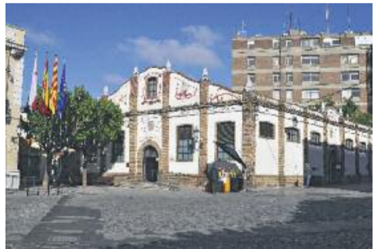
Mercat Vell, un dels nous equipaments lliure de fum.

vençió del tabaquisme i destinades, principalment, a la infància i l'adolescència. Les actuacions han inclòs l'adhesió a un manifest dels 22 centres educatius i 15 entitats esportives, la implantació de projectes educatius de prevenció del tabaquisme en els centres educatius, així com la transformació en espais sense fum dels centres esportius municipals i els accessos exteriors dels centres educatius de Mollet. La retolació d'Entorn Saludable, al voltant d'escoles i centres esportius, llocs on hi ha molta població infantil i juvenil, ha aconseguit que un 40% dels adults deixin de fumar en aquestes zones.