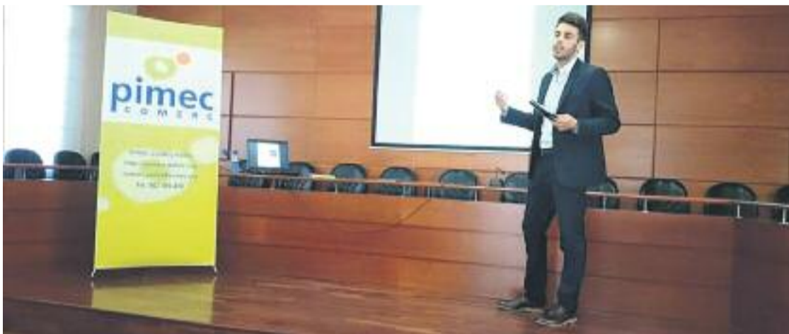
Els comerciants de la Llagosta organitzen fires i cursos per potenciar les seves capacitats.