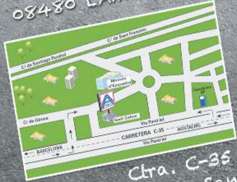
Ctra. C-35 cant. c/ Girona 08470 Sant Celoni