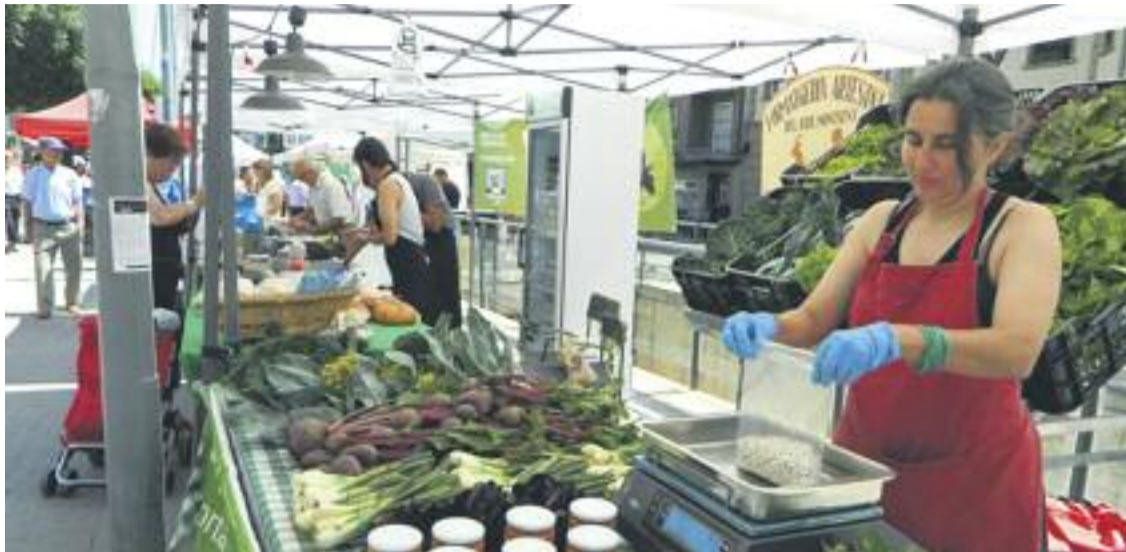
La Fira Mollet és Gourmet es va centrar en els productes de proximitat.