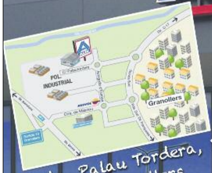
Avda. Palau Tordera, 8-12 08400 Granollers