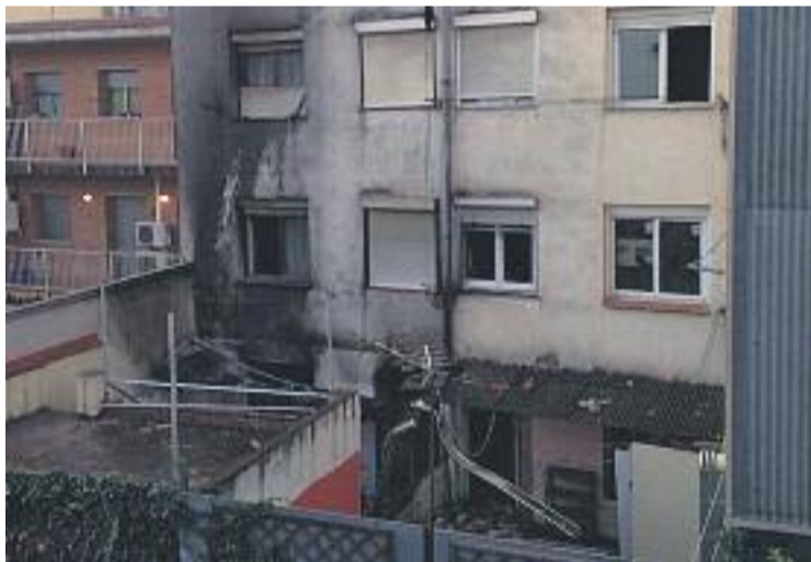
Edifici on es va produir l'explosió al desembre.