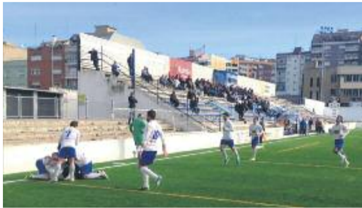
El club vol que l'estadi presenti el millor aspecte possible.

El club ja ha fet una crida a l'afició per omplir l'estadi granollerí, ja que esperen tornar a Tercera Divisió després de 3 temporades consecutives a Primera Catalana, mostrant una progressió espectacular, que ha donat fruits aquesta temporada en la qual han acabat en segona posició, per darrere del Júpiter. Tot i que ja ha