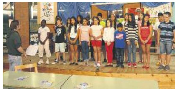
Presentació del projecte musical Cantània 2015.

La cantata d'enguany compartirà amb una novetat que consisteix en la retransmissió a la Sala Petita de l'Auditori del concert en directe per a tots aquells familiars i amics dels infants que es quedin fora per falta d'espai a la Sala Gran.