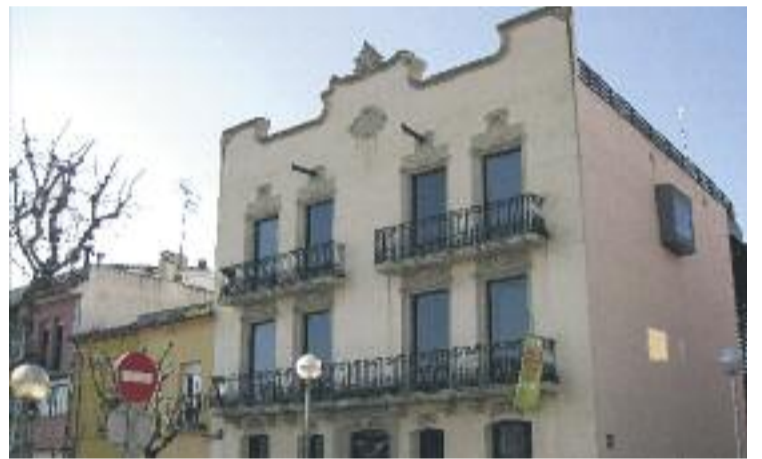
El Museu Abelló s'adhereix a la xarxa de Museus d'art de Catalunya.

El fons del Museu Abelló té prop de 10.000 registres d'objectes. El gruix d'aquesta col·lecció d'art és sobretot pintura i escultura catalana del s. XIX i part del XX fins als anys 70, però també hi ha col·leccions de vidre, tauromàquia, agulles de barret i vestits de teatre, entre altres.