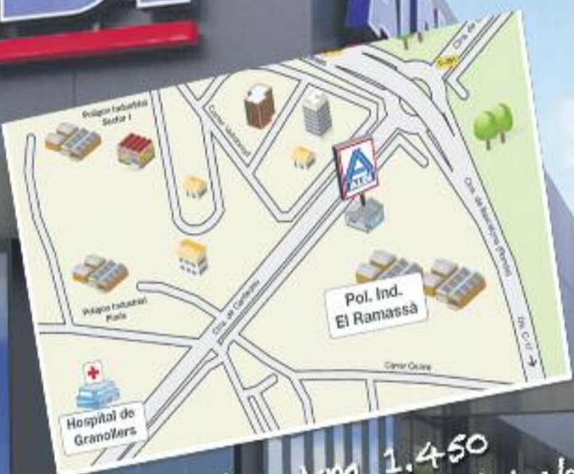
Ctra Cardedeu km 1.450 08521 Les Franqueses del Vallès