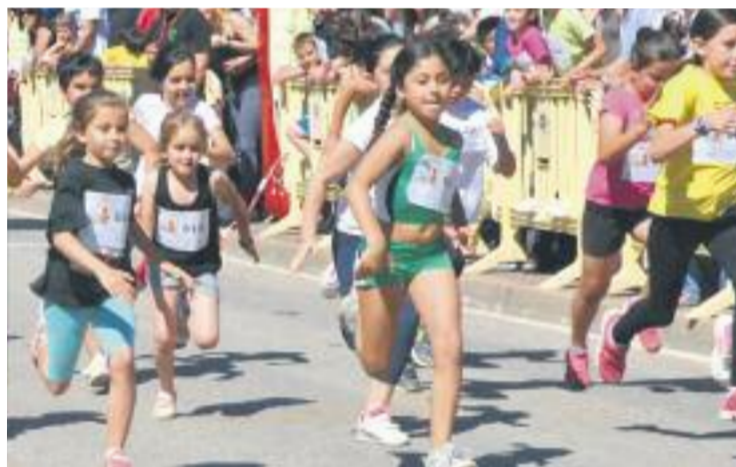
Els joves atletes montmelonins podran lluir-se diumenge.

MONTMELÓ ▶ Un any més, i ja en són 26. Aquest diumenge, la plaça de la Quintana serà l'escenari d'una nova edició de la Minimarató escolar, una jornada esportiva en la qual els protagonistes són els més petits.