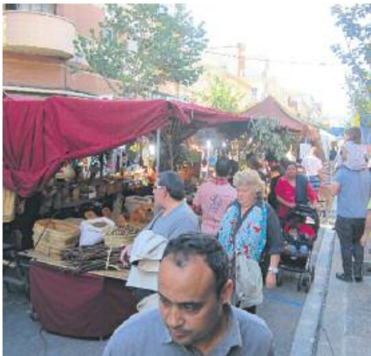
Fira EcoGrà de l'any passat.