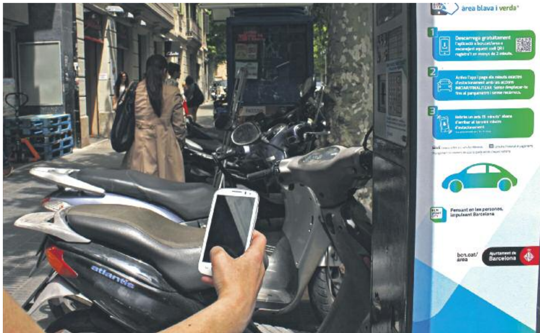
Els usuaris de vehicles de l'Àrea Metropolitana de Barcelona també podran fer servir l' apparkB .

» Els usuaris de vehicles de les comarques barcelonines podran descarregar l'aplicació apparkB » La Diputació de Barcelona, amb el suport de l'Ajuntament, desenvoluparà i gestionarà la nova app