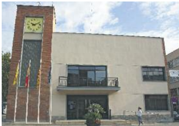
Continuen les converses entre els partits per formar govern.