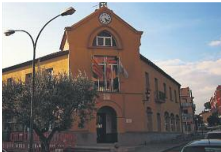
ERC és l'encarregada de decidir qui governa al municipi.

Antoni Guil assegura que els socialistes seguiran intentant posar-se d'acord amb totes les