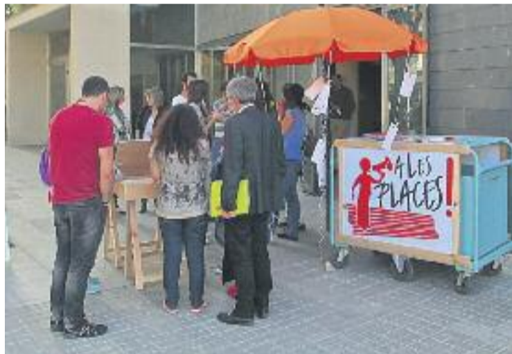
Presentació del projecte Alesplaces!. Foto: Ajuntament de Granollers