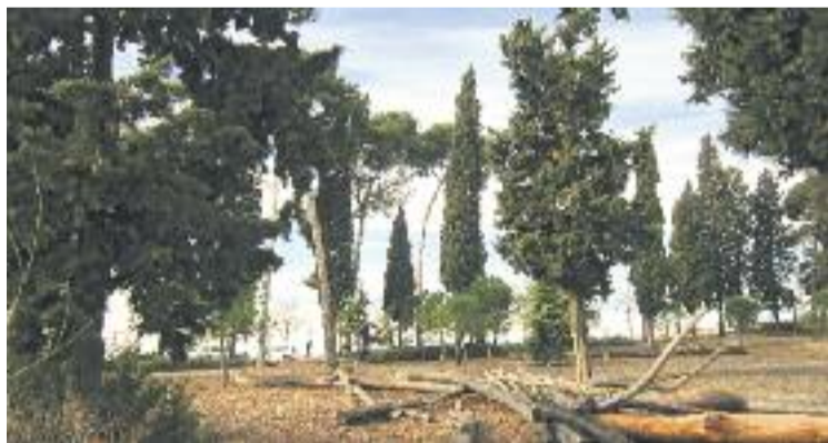
Bosc Soldevilla, catalogat d'interès local.

L'aprovació i posada en marxa d'aquesta ordenança és fonamental per a la preservació del patrimoni natural del municipi,