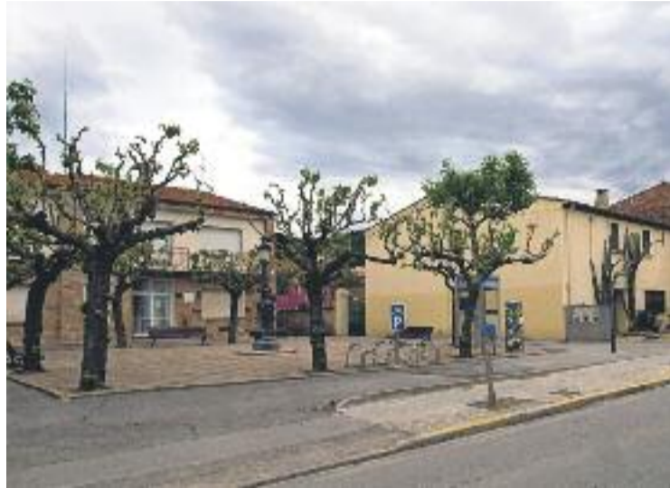
Els pactes se centren en PSC, MAPM i ICV-EUiA.