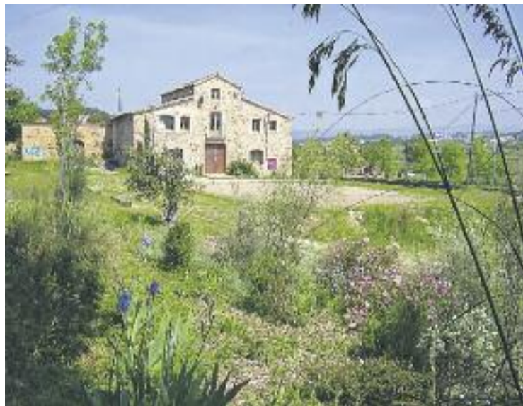
Es comencen a adequar els horts socials de Can Jornet.

L'espai estarà delimitat i comptarà amb un pou per a l'extracció d'aigües subterrà-