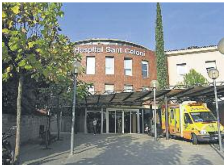
Hospital de Sant Celoni, un dels centres afectats pel conveni.

Aquest conveni recupera, en part, els acords laborals que havien estat vigents dins de la Xarxa Hospitalària d'Utilitat Pública (XHUP). El pacte laboral en aquest sector havia deixat d'estar vigent fa mig any, per la impossibilitat legal de prorrogar-lo i pel desacord entre els diferents agents negociadors. Així doncs, el Servei Català de la Salut s'ha compromès a incrementar en un 3,6% les tarifes