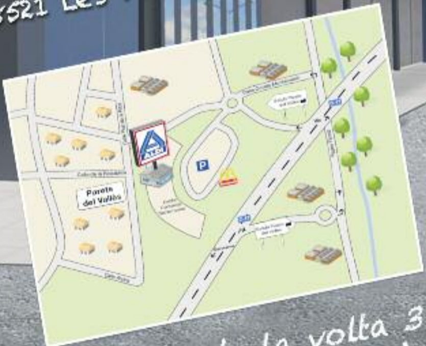
Carrer de la volta 3 08150 Parets del Vallès