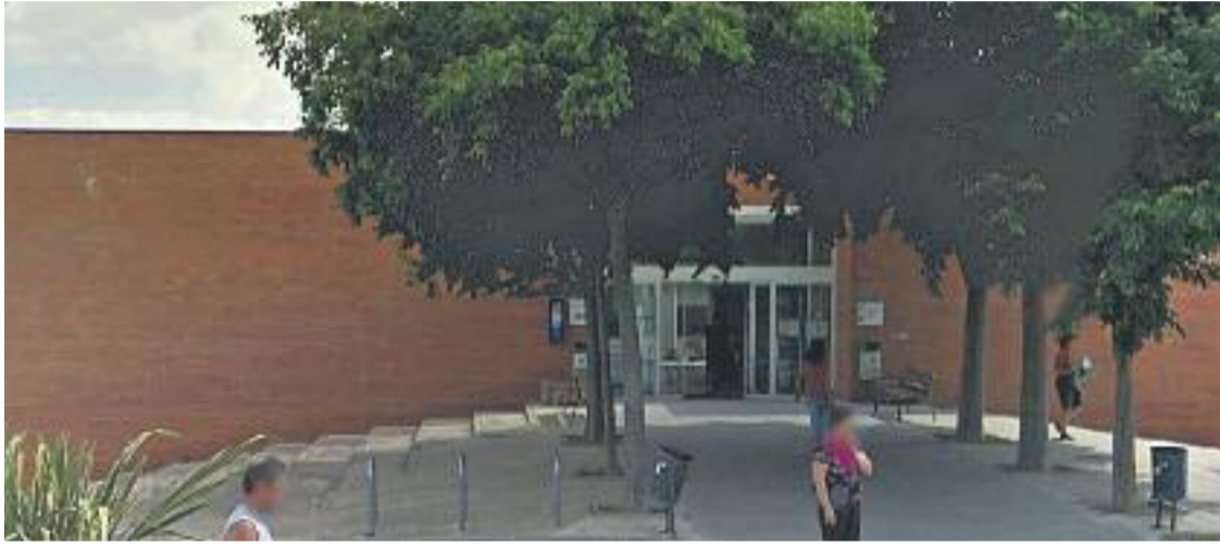
El CAP de Santa Perpètua fa quatre mesos que no té pediatria de guàrdia els dissabtes.