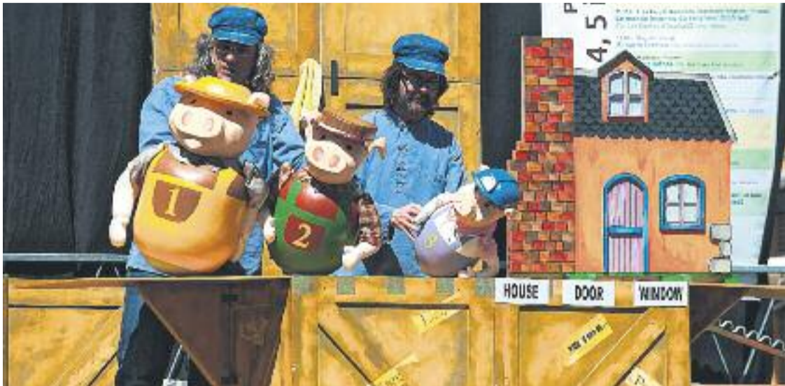
A partir d'avui i durant tot el cap de setmana se celebra la Mostra Internacional de Titelles a Mollet.