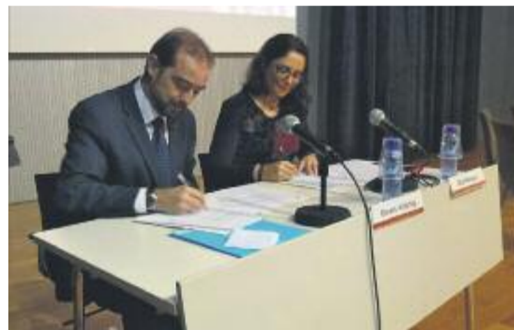
Signatura de la creació de la Xarxa.

Les escoles de formació d'adults aporten valor en l'àmbit local i generen oportunitats per a les persones. No obstant això, la fragmentació de les actuacions pot acabar restant capacitat de resposta a les accions dels municipis i per això s'ha posat en marxa aquesta Xarxa d'Escoles Municipals per a Persones Adultes.