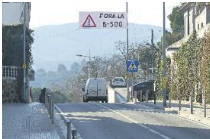
Pancartes reivindicatives contra la B-500.

A més, CiU proposa "estudiar la possibilitat de pacificació de la travessera de la B-500 al