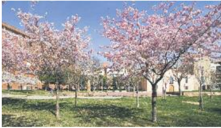
Mollet és l'única candidata estatal al guardó europeu.

Mollet competirà amb set ciutats europees més per rebre aquest reconeixement europeu, que mostra els esforços de la ciutat per assolir uns millors resultats mediambientals i les línies de treball que es duen a terme per aconseguir els objectius. Les altres ciutats europees participants són Inverness (Escòcia), Lappeenranta (Finlàndia), Ludwigsburg (Alemanya), Mikkeli (Finlàndia), Siena (Itàlia), Strovolos (Xipre) i Torres Vedras (Portugal).