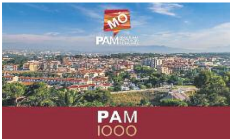
El govern diu que ha complert el 60% de les accions previstes.

L'alcalde també recorda que "hi ha accions que no estaven contemplades al PAM, però que les circumstàncies han fet que les gestionéssim per la seva transcendència pel futur del municipi", i destaca el cas de la transformació de la BV5003.