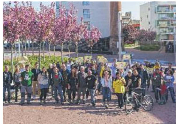
Presentació de la Crida Granollers-CUP.

Des de la Crida també destaquen que una de les característiques de la candidatura és el seu caràcter intergeneracional (19 i 20 anys les persones més joves, i 60 i 65 les més adultes) i el seu caràcter totalment igualitari de gènere, conegut com a model cremallera i que "va ser un dels criteris més importants a l'hora de confeccionar la candidatura".