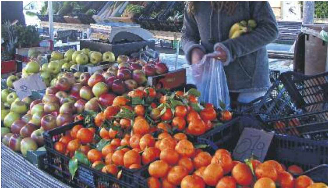
Les parades de proximitat del mercat dels dijous seguiran obertes a la tarda.