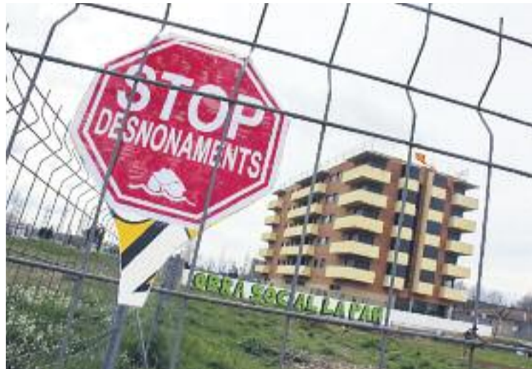
Demanen la retirada dels judicis per ocupar pisos buits.

En els darrers mesos la Plataforma d'Afectats per la Hipoteca de Granollers (PAH) ha ocupat diferents pisos buits propietat d'entitats financeres i fruit de desnonaments, cosa que ha provocat que el BBVA i la Sareb hagin presentat recursos judicials en cinc casos, un dels quals ja va tenir la primera vista judicial a principis d'aquest mes.