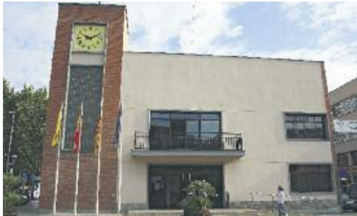
S'amplia l'assessorament a autònoms i pimes.

Aquesta ampliació de les tasques es deu a l'entrada en vigor de la modificació del Codi de Consum de Catalunya. Aquesta normativa estableix que des de l'1 d'abril els drets i obligacions del Codi de Consum són aplicables a les relacions entre els prestadors de serveis bàsics i els treballadors autònoms i les microempreses (menys de 10 treballadors i que facturin menys d'un milió d'euros anuals) d'acord