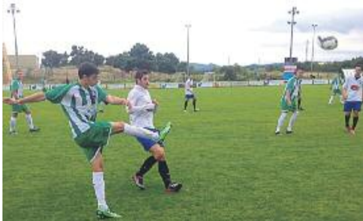
El Granollers va tornar de la Jonquera amb els tres punts.

VALLÈS ORIENTAL ▶ La victòria del Granollers a la Jonquera (1-2) combinada amb l'empat de la Molletense al Municipal Nou Congost de Manresa (0-0) ha aconseguit que els granollerins recuperin la primera posició al grup 1 de Primera Catalana, empatats a punts amb els del Bages, però amb el goal average particular a favor. A més, el Júpiter no va fallar a casa contra el Girona, i ja és a dos punts dels colíders.