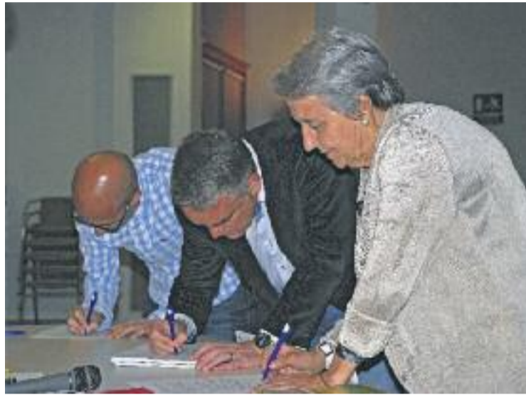
Signatura dels candidats de NOPP, CiU i ERC.

ments per la Independència consisteix a aconseguir que el màxim nombre de candidatures es comprometin a implicar-se en el procés independentista, incorporant als seus programes electorals uns compromisos explícits per a l'impuls del procés d'emancipació nacional des dels consistoris.