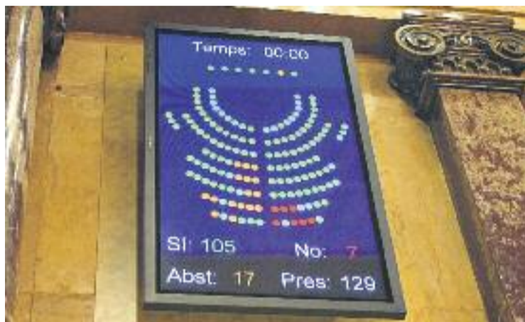
Marcador de la votació.

El Moianès és un territori que fa temps que reivindica poder-se constituir com a comarca. L'any 2010, els ajuntaments concernits van començar els tràmits per aconseguir-ho. El darrer pas que van haver de fer, a peti-