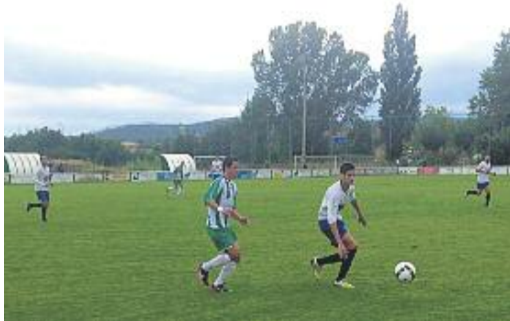
Els equips vallesans tornen a jugar després de l'aturada per les festes.

Però els granollerins no depenen d'ells mateixos, sinó que necessiten un cop de mà de la UD Molletense, que visita l'estadi del líder, el Nou Estadi Municipal Congost. Els homes d'Antoni Filgaira són catorzens, en posició de