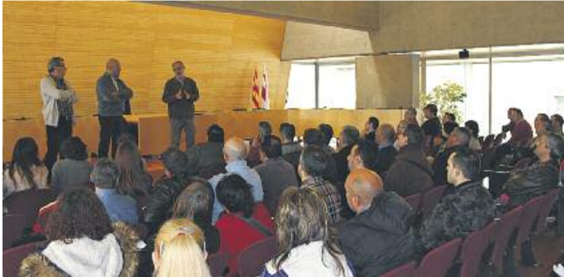
Acte de recepció dels Plans d'Ocupació.