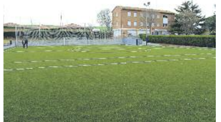
El nou aspecte del camp de l'EEE Can Vila.