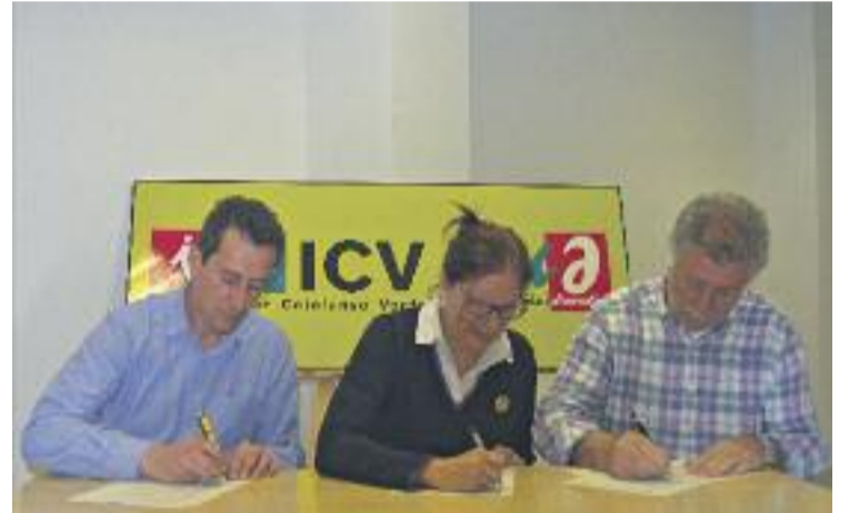
Signatura de l'acord entre ICV i EUiA.