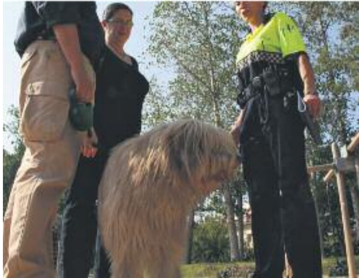
Montmeló ja té una nova ordenança sobre tinença d'animals.

Fons de l'Ajuntament asseguren que, per promoure de manera adequada aquesta ordenança, "és necessari que els propietaris d'animals de companyia (gossos, gats i fures) compleixin amb les seves obligacions" i es demana que "els tinguin correctament identificats i censats, els portin lligats de manera adequada per la via pública, recullin les deposicions dels seus animals,