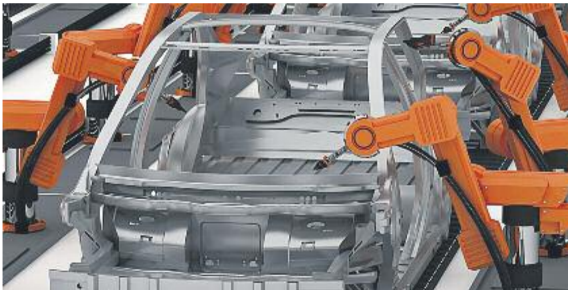
La indústria automobilística és una de les més importants al territori (a baix).