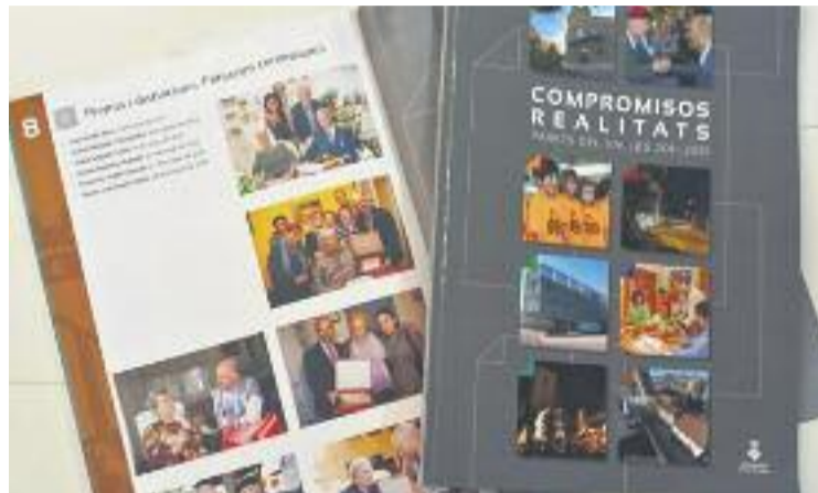
Memòria de mandat publicada per l'Ajuntament.

posició afirmen que hi troben "a faltar el més mínim sentit d'autocrítica i participació de tot el consistori", asseguren que "en cap moment la resta de grups hem estat consultats, ni tan sols per l'ús de la imatge dels regidors de l'oposició" i assenyalen que "el contingut de la publicació es correspon més a un publireportatge de l'actual alcalde i a un element de propaganda electoral de la seva per-