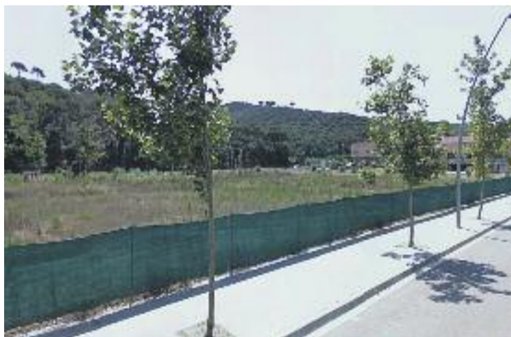
L'Ajuntament desestima la construcció del Mercat Municipal.

L'any 2010 la Generalitat va modificar la regulació de superfícies comercials i la normativa que obliga a delimitar la Trama Urbana Consolidada (TUC). "L'any 2009, el contracte licitat disposava d'un model que funcionava, amb un supermercat de proximitat dins el mercat, però les modificacions legislatives que ha portat a terme la Generalitat ara el fan inviable", justifica l'alcalde