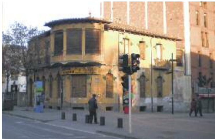
L'edifici de l'antiga Acadèmia Viñas que es reformarà.

El projecte, llargament reivindicat pels veïns, preveu la rehabilitació de l'edifici, juntament amb la construcció de dos habitatges i un local comercial. L'edifici, que va ser la primera seu de l'Acadèmia Mollet, es troba inclòs dins el catàleg de pa-