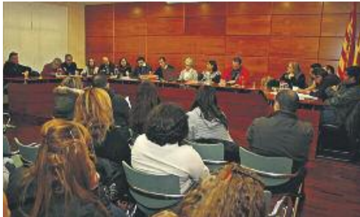
Ple ordinari de l'Ajuntament de la Llagosta.

El crèdit de la Diputació, que és sense cap tipus d'interès, també es farà servir per a la instal·lació d'un espai per a gossos al Parc Popular, la substitució de mobiliari urbà i gronxadors, la compra de material