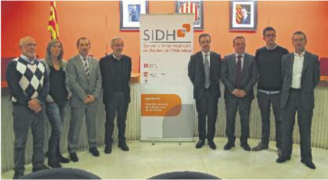
Presentació del SIDH de Granollers.