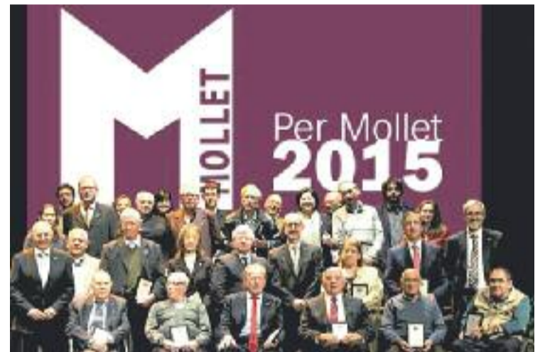
Portada del butlletí municipal.