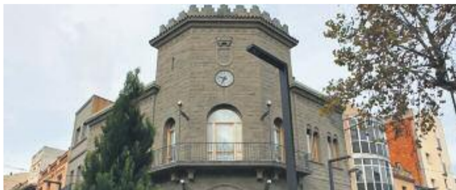
Alguns dels ajuntaments que paguen tard els seus proveïdors.