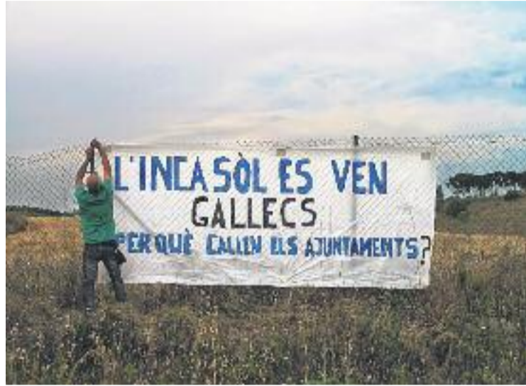
Denúncia de la Plataforma Salvem Gallecs.

Can Banús II és un solar propietat de l'Institut Català del Sòl (INCASÒL) de la Generalitat que pretén vendre a l'empresa TransWences per a la construcció d'un centre de distribució logística internacional. La Plataforma Salvem Gallecs assegura que hi ha diversos informes tècnics, que van entregar al Síndic, que avalen que la construcció d'aquest centre comportaria un greu deteriora-