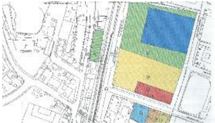
Projecte de les obres al barri del Congost.

La proposta, que s'exposarà al públic durant un mes, abasta un total de 19.979 metres quadrats, dels quals 14.000 es destinaran a espais públics, equipaments i vials i prop de 6.000 a sòl privat. Així doncs, el projecte preveu el perllongament dels carrers de l'entorn amb espais per a vianants, la construcció de 250 habitatges, dels quals 85 seran de protecció