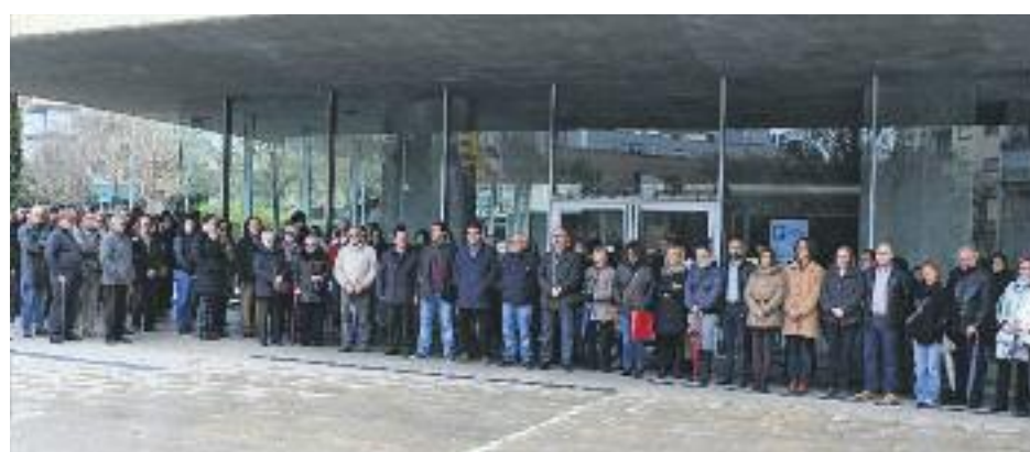
Minuts de silenci fets a diferents municipis de la comarca i banderes a mig pal.