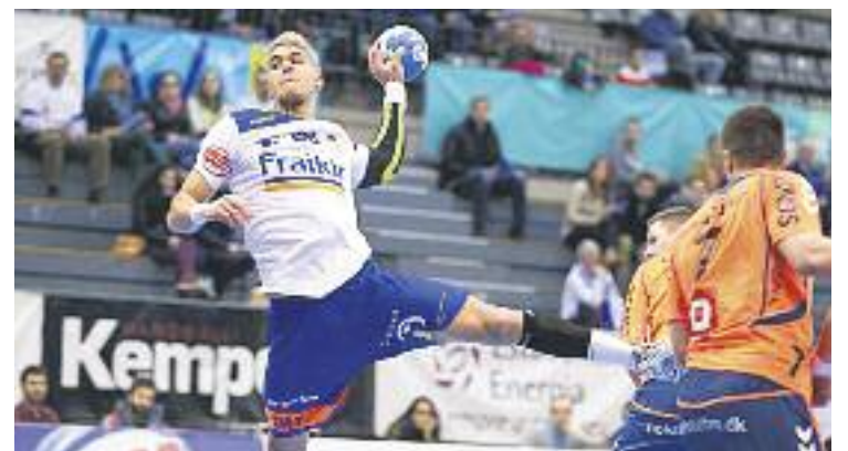
La segona posició a l'ASOBAL i la Copa, els reptes del Fraikin.

GRANOLLERS ► Amb el somni europeu acabat, el BM Granollers té dos fronts oberts en la recta final de la present temporada.