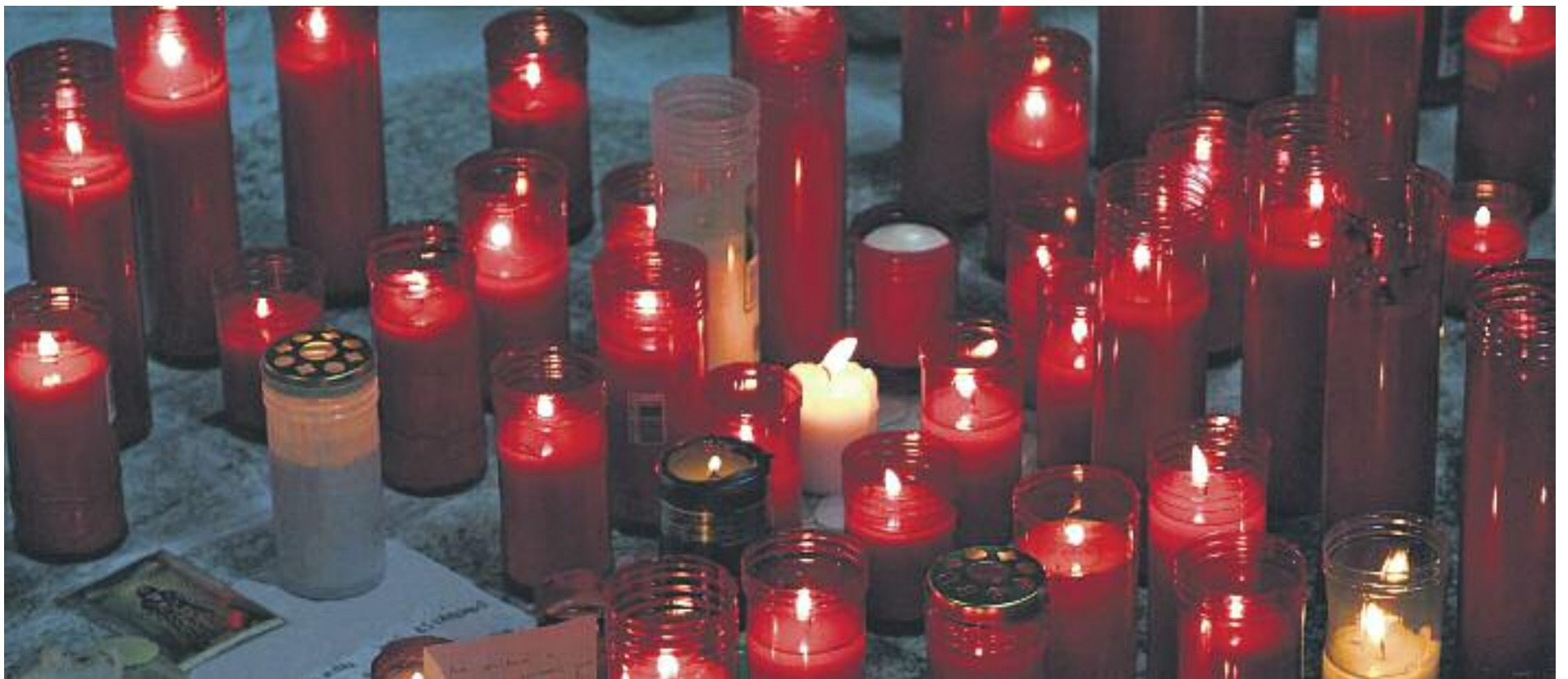
A l'avió accidentat hi viatjaven 16 estudiants alemanys i dues professores que havien fet un intercanvi a Llinars del Vallès.