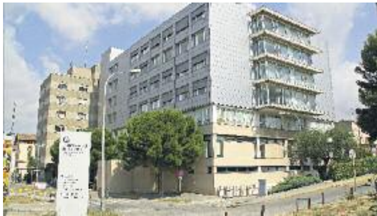
A partir d'ara es faran hospitalitzacions a domicili.

Així doncs, els pacients que voluntàriament poden ser atesos per aquest equip són aquells que han estat visitats al Servei d'Urgències o bé ja estan ingressats a un servei d'hospitalització i poden continuar el tractament al seu domicili, sempre que l'especialista que l'atén ho consideri oportú. Els requisits per acollir-