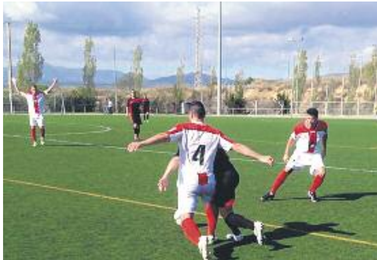
Molletans i granollerins van empatar a un gol.

Aquest resultat ha servit per estrènyer encara més les primeres posicions al grup 1 de Primera Catalana, ja que el Manresa ha empatat a punts amb els vallesans al capdavant de la classificació. A més, el pròxim partit dels homes de Raul Matito serà una visita del Júpiter, tercer classificat amb dos punts menys que els granollerins. Per la seva banda, el Mo-