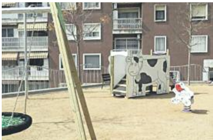
El Parc Joan Miró després de la reforma.

Es tracta del primer parc per a espais públics del municipi que té un vessant lúdic, artístic i de difusió de la cultura tradicional i del país. Aquest indret està pensat perquè els avis puguin explicar aquests contes als seus néts i els pares als seus fills d'una forma fàcil i divertida. El parc està format per un panell de dos metres d'alçada per 75 cm d'amplada on s'explica el conte amb il·lustracions, dos jocs de molla amb els dibuixos d'En Patufet i El Dineret, un tobogan amb el dibuix del Bou, un gron-