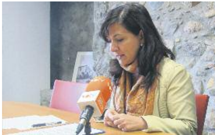
Presentació de les subvencions.

Des de l'any 2012, Can Muntanyola s'ha convertit en l'equipament de referència de la ciutat. En total, 2.095 persones s'han donat d'alta al servei d'emprenedoria i s'han constituït 252 empreses. En aquests moments, el servei d'allotjament de projectes de Can Muntanyola ha arribat al 100% d'ocupació, amb 16 empreses allotjades. D'altra banda, en aquests dos anys i mig, les sessions formatives, les jornades i les conferències han acostat l'equipament a més de 6.000 assistents.