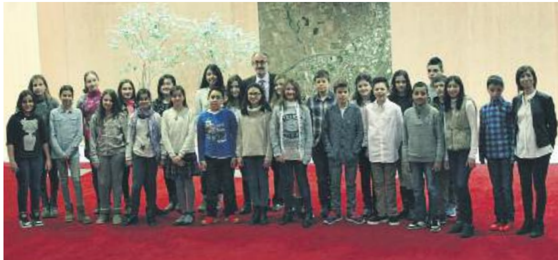
Els membres del Consell dels Infants que han presentat la llista de les 10 meravelles de Mollet.