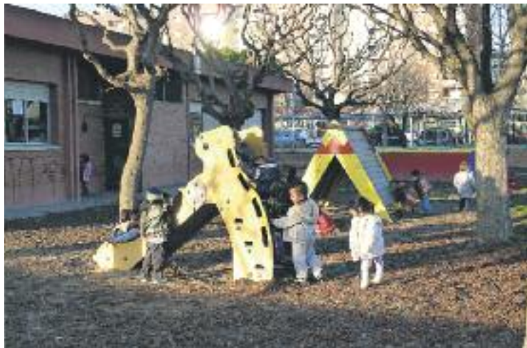
Demanen que no treguin un grup de P3.

Els grups municipals molletans, a més, demanen que es mantinguin els 24 grups de P3 que hi ha al municipi. Ensenyament argumenta el tancament