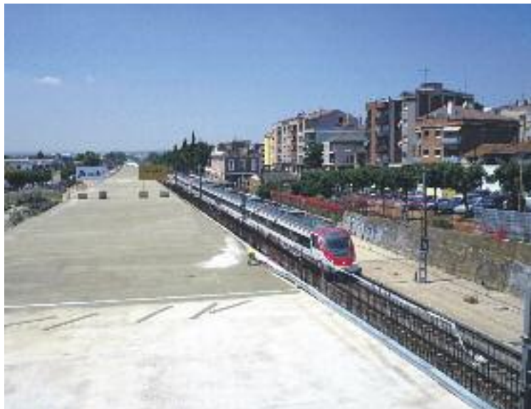
El túnel ferroviari costarà 2,6 milions d'euros.

En aquesta primera fase, la llosa del túnel es convertirà en un gran espai de vianants. El carrer Primer de Maig farà de ca-