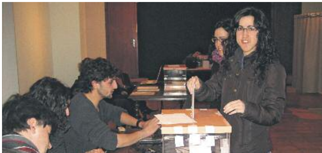
Un moment de les votacions del diumenge passat.

Sobre la votació del Parlament, el batlle de Moià assegura