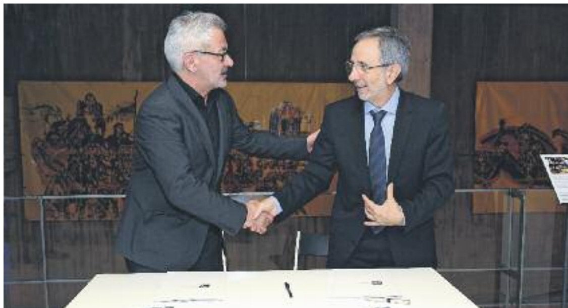
El Fons Benito està custodiat pel Centre d'Estudis i Documentació del MACBA.