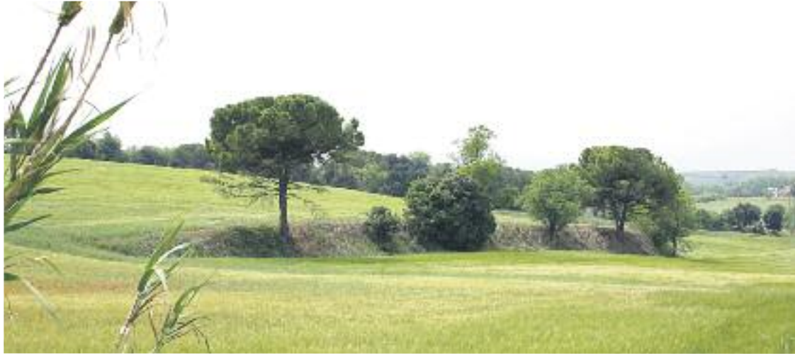
Demanen que es protegeixi Can Riera, Can Merengues i l'enclavament de Can Vila-Rosal.