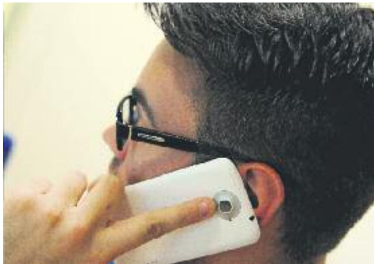
La majoria de les queixes de l'OMIC són contra la telefonia mòbil.

Un 9% de les reclamacions van ser sobre productes i serveis bancaris, i poc més d'un 8% es van centrar en l'activitat comercial de grans superfícies, comerç especialitzat i petit comerç. Només un 4% de les consultes ateses per l'OMIC del municipi van acabar en denúncia davant de l'Agència Catalana del Consum i poc més d'un 3% estan actualment pendents