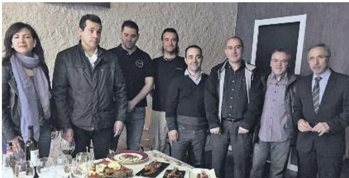
Presentació de la Segona edició de la ruta Gastrotapes.