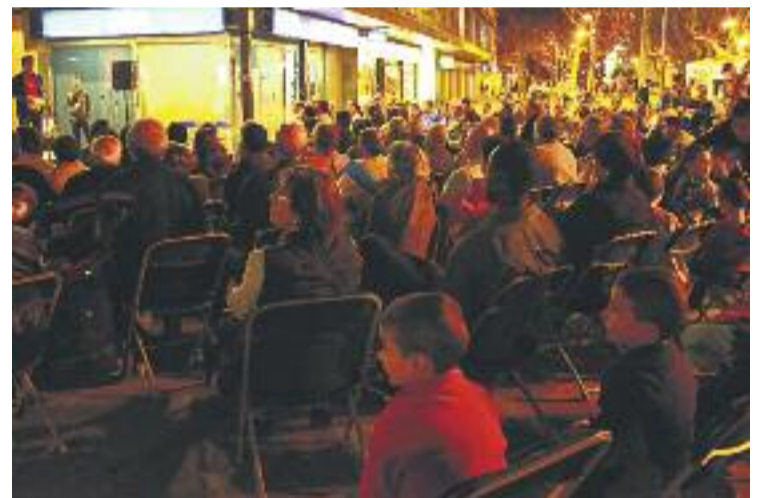
Un dels actes de la Crida per Mollet.

La Crida per Mollet també assegura que redissenarà el seu paper a la ciutat, perquè creuen en "la necessitat de seguir endavant amb un projecte que contribueixi al foment d'una nova forma de fer política basada en l'ètica, la transparència i la participació, al servei de la justícia social, l'apoderament popular i de la radicalitat democràtica".