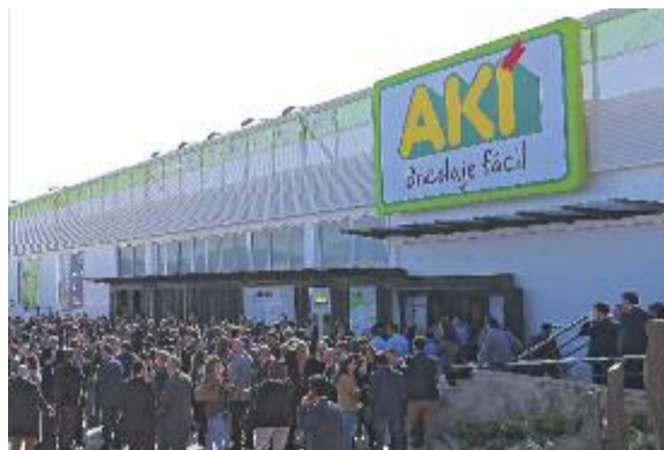
Inauguració del centre AKÍ a Granollers.

Segons explica l'empresa, es van rebre més de 6.000 demandes de feina i la tramitació dels llocs de treball per a l'equip del centre s'ha portat a terme amb l'ajuda del departament d'Ocupació de l'Ajuntament de Granollers i diverses associacions de discapacitats. D'aquesta manera, asseguren, "donem suport a la integració de persones amb discapacitat".