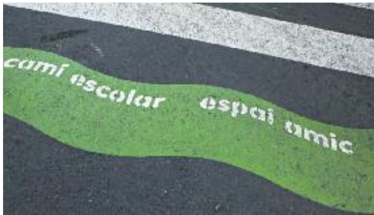
L'Ajuntament vol crear camins escolars.

“per millorar la seguretat a les entrades i sortides de les escoles, cal la coresponsabilització de tots els col·lectius implicats: les famílies, les institucions i el conjunt de la comunitat educativa” i recorda que “tenir actituds positives, dialogants i de col·laboració amb la ciutadania per part de tothom és la millor forma per avançar en el camí de fer