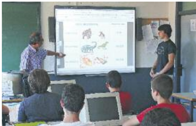
Una prova pilot permetrà als directors vallesans escollir els substituïts.

Així doncs, a través d'una aplicació dissenyada per la Generalitat, els directors de les escoles públiques fixaran les seves necessitats i es farà una recerca entre els aspirants tenint en compte aspectes qualitius i objectius, com la nota mitjana de la titulació superior, l'exercici de la docència o l'acreditació del coneixement de l'anglès o d'un altre idioma estranger, entre altres aspectes rellevants. Com a mínim els tres candidats amb millor puntuació seran entre-