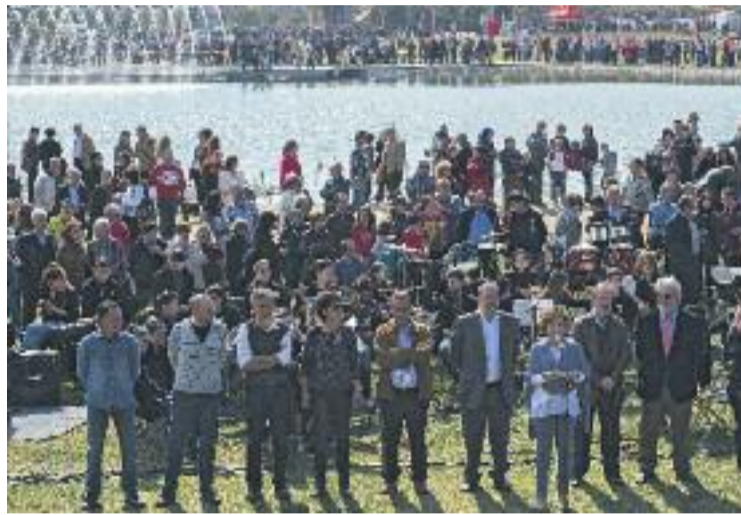
Inauguració del Parc Central.

La nova zona disposa de diversos espais, com una zona de jocs infantils, un amfiteatre, un circuit d'educació viària amb una aula de formació i la bassa naturalitzada. Aquesta bassa ofereix una imatge paisatgística i lúdica i alhora serveix per al rec