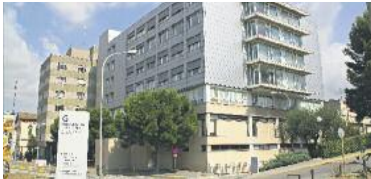
Polèmica entre CiU i PSC per la situació sanitària de l'Hospital.

nollers ha perdut pistonada en l'àmbit sanitari" i reclama a l'alcalde que "prengui mesures des del patronat de l'Hospital".