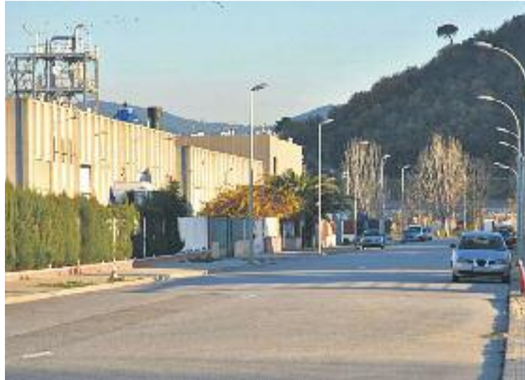
Les obres tindran una durada de cinc mesos.

Entre les principals actuacions que es portaran a terme al polígon destaquen la reforma del servei d'aigua potable (actualment amb nombroses avaries de les canonades de fibrociment), la implantació d'una infraestructura per donar servei de fibra òptica, l'adequació de guals i vo-