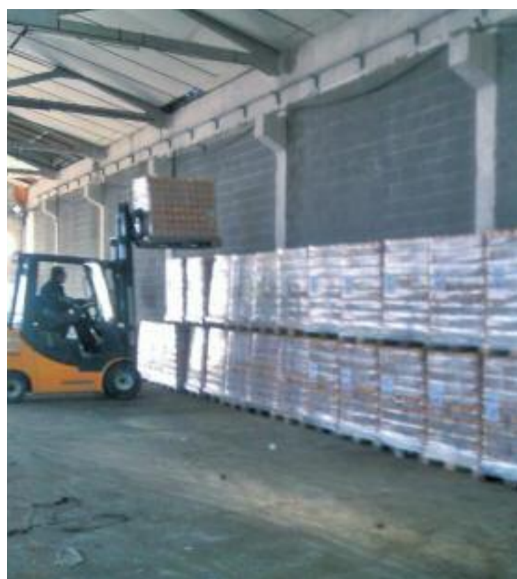
Imatges del Gran Recapte d'Aliments (a l'esquerra) i interior de la nau cedida a la comarca (a la dreta).