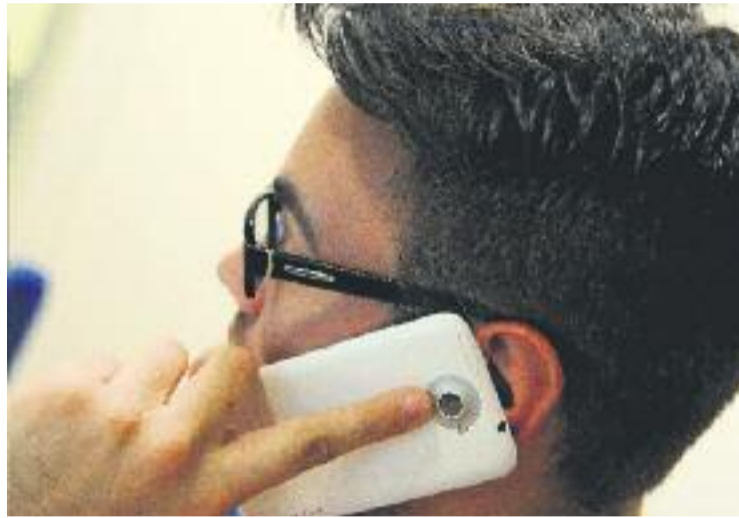
La telefonia és el principal motiu de queixa entre els paretans.

Els serveis bancaris han rebut el 12% de les reclamacions dels paretans. Els principals motius de queixa en aquest sector han estat les clàusules sòl i els tipus d'interès IRPH, però també han hagut reclamacions amb el cobrament de despeses