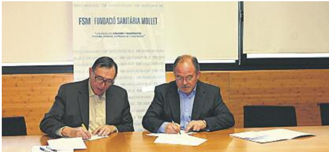
Signatura del conveni entre l'Hospital de Mollet i l'Escola Pia de Caldes.