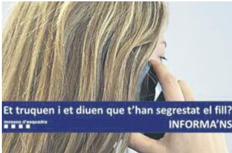
Cartell sobre els segrestos virtuals.

El mateix va passar la setmana passada a Canovelles, quan una dona va ser avisada que la seva filla estava segrestada. De