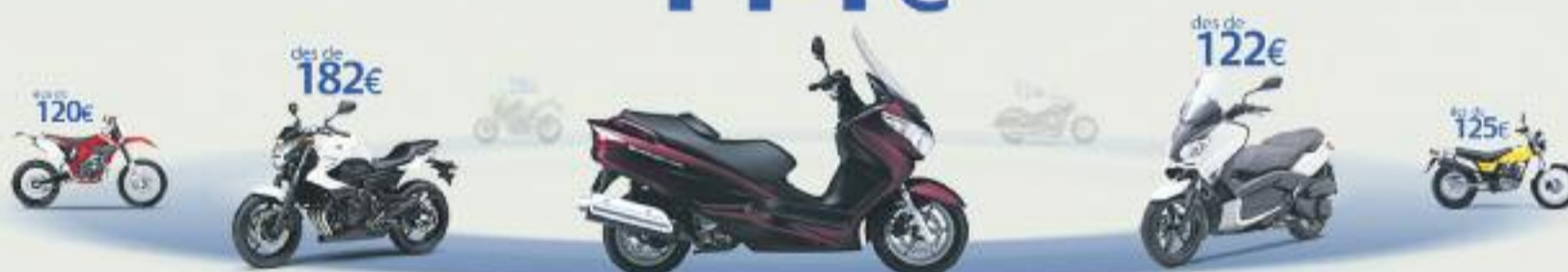
Suzuki Burgman 200. Preu anual orientatiu amb bonificació.

TERCERS AMB ASSISTÈNCIA EN VIATGE des de 114€