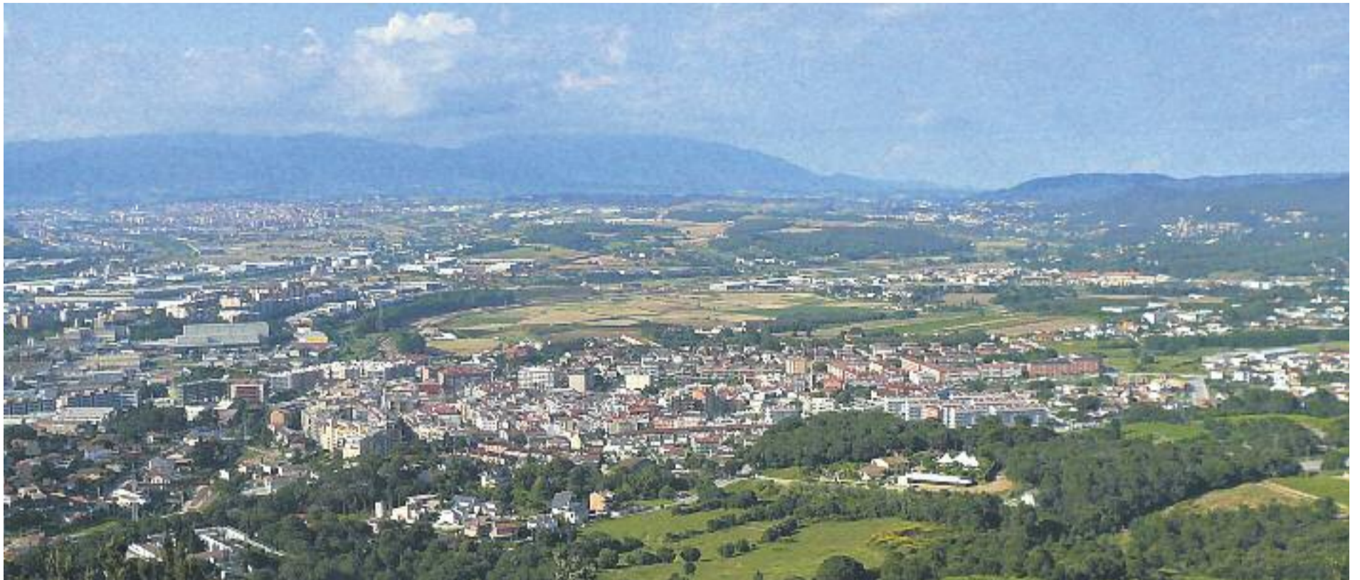
La Plataforma Fem Vallès proposa unificar el Vallès Oriental i l'Occidental en una sola comarca que es digui Àrea Vallès.