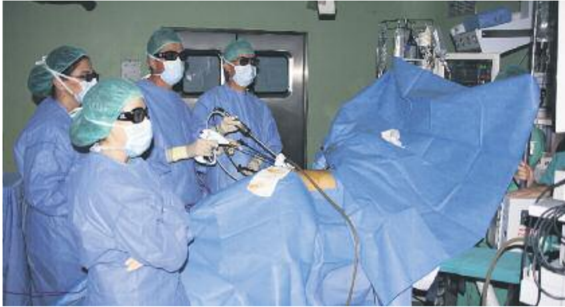
La tecnologia 3D permet una intervenció més ràpida i acurada.