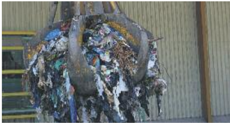
Sancionen una empresa de reciclatge de la ciutat.

La CNMC considera que entre els anys 2000 i 2013 "aquestes empreses es van repartir el mercat, amb acords per espec-