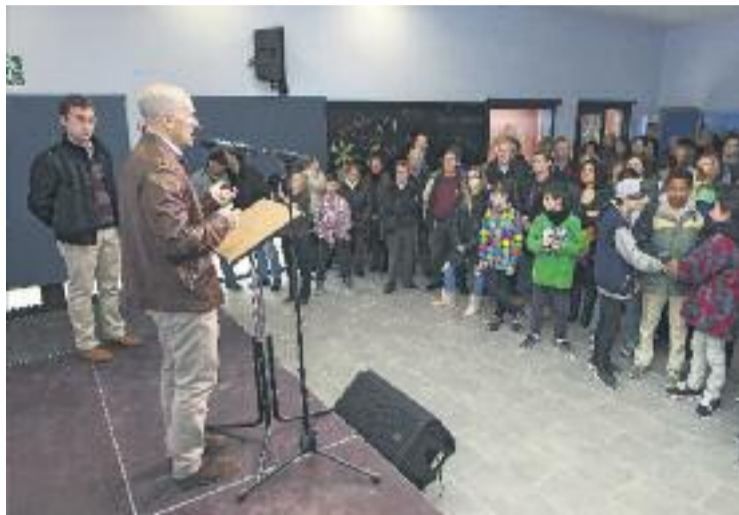
Inauguració del Casal de Cal Jardiner.

La secció local d'ERC ja ha manifestat, a través d'un comunicat, el seu suport al posicionament de l'Assemblea de