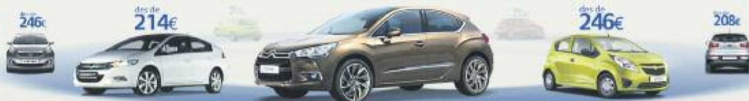
Citroën DS4-1.6 VTI 120 Design SP 120CV. Preu anual orientatiu amb bonificació.

TERCERS AMB ASSISTÈNCIA EN VIATGE des de 114€