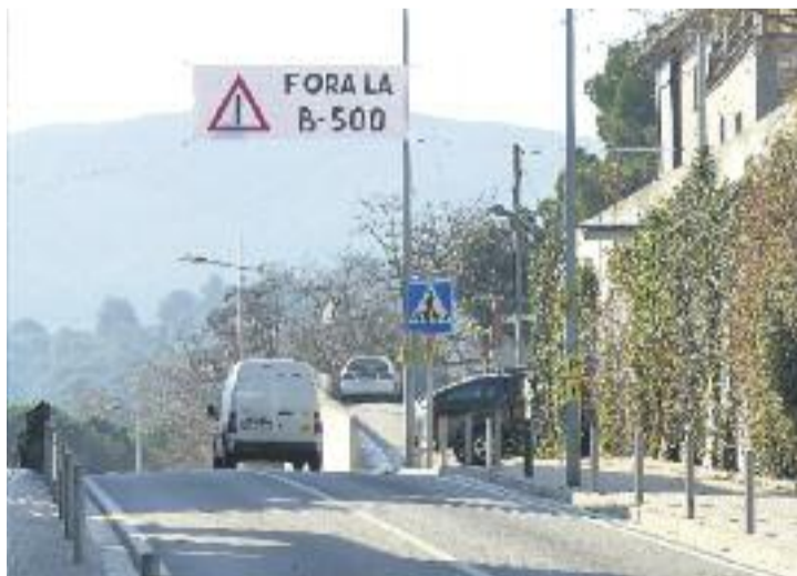
Una de les pancartes col·locades a la B-500.

Per altra banda, el grup parlamentari d'ICV-EUiA ha presentat una Proposta de Resolució per tal d'instar la Generali-