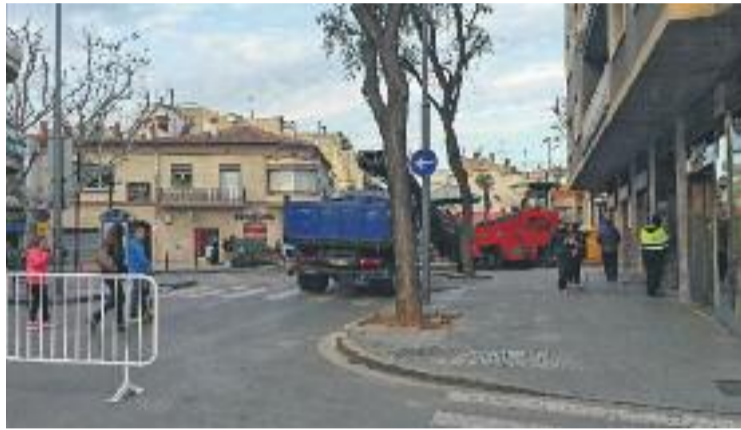
L'oposició critica les obres engegades a la ciutat.