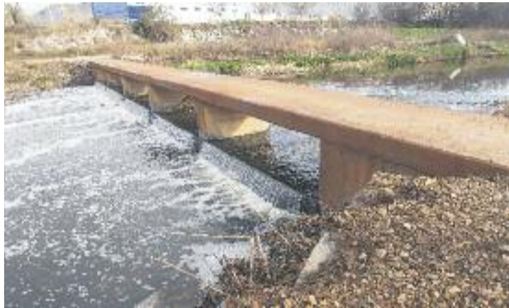
La passera serà semblant a la de Montmeló.

Segons l'alcalde, els tècnics municipals treballen amb la idea de fer una passarel·la com la que hi ha a la confluència dels rius Mogent i Congost, al terme mu-