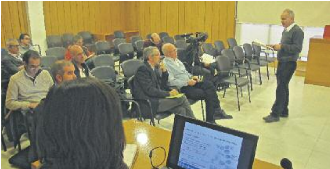
Presentació de les diferents eines ambientals a Internet.