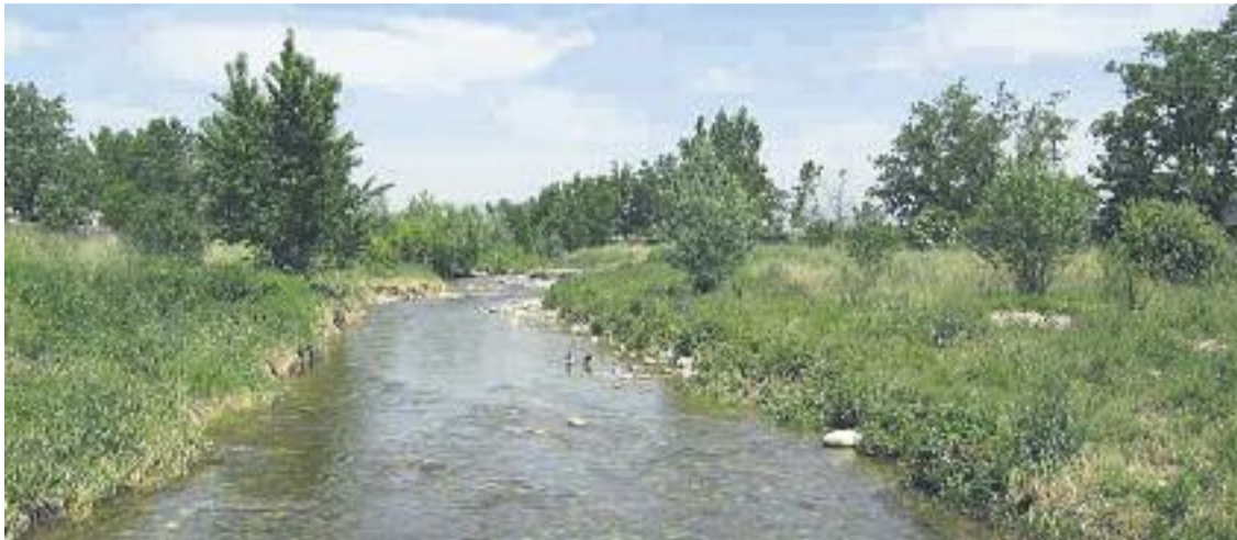
La Mina analitzada travessa Montmeló des del riu Congost fins al riu Tenes.