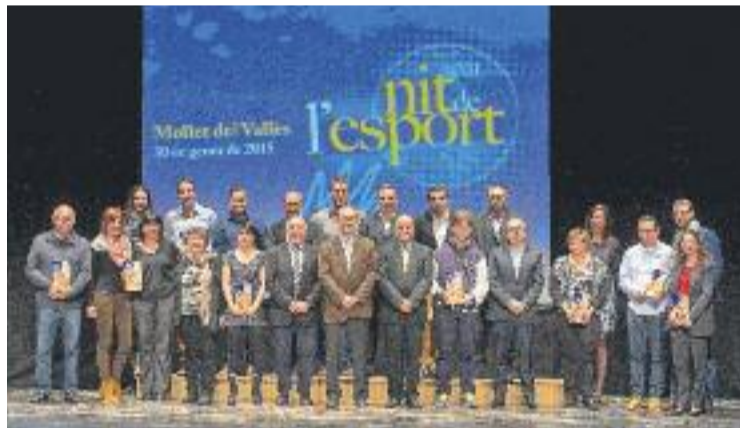
Foto de família dels premiats de l'edició d'enguany.

MOLLET ▶ El passat divendres 30 de gener es va celebrar la 22a edició de la Nit de l'Esport al Teatre Can Gomà de Mollet. La gala va servir com a colofó dels actes de la Festa Major de Sant Vicenç.