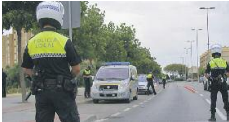
Els sindicats denuncien discriminació a un policia local.

Segons el relat dels sindicats, i tal com es detalla en la instància, l'agent afectat per la presumpta situació discriminatòria es va reincorporar al cos de la Policia Local de Granollers el 16 de setembre per resolució judicial, després de guanyar un llarg procés judicial de més de cinc anys contra l'Ajuntament de Granollers per la vulneració dels seus drets laborals durant el