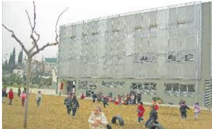
La Generalitat pagarà el cost dels mòduls de l'escola Els Aigüerols.

La secció local d'ERC, per la seva banda, reconeix que "l'a-