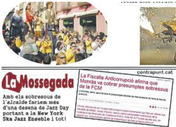
La informació que ha generat la polèmica.

Segons el mateix document, aquest comentari no hauria agradat a l'Ajuntament, que considera que "no és apropiat que el consistori aparegui a la primera pàgina del butlletí en-