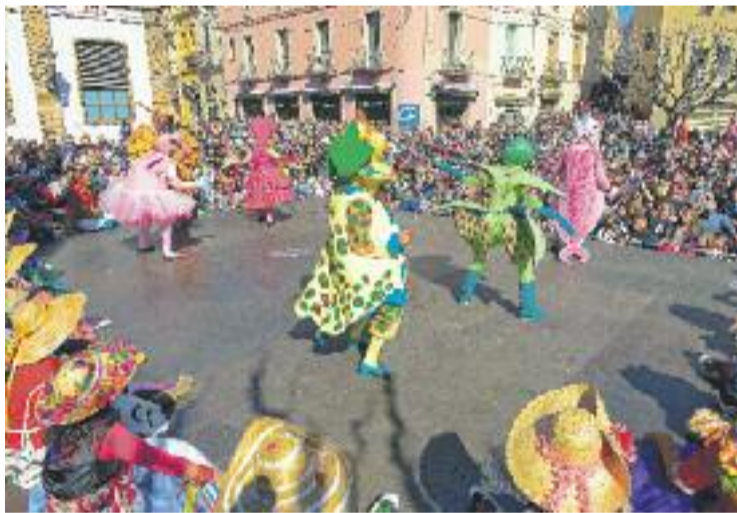
Ball del Barraló de l'any passat.