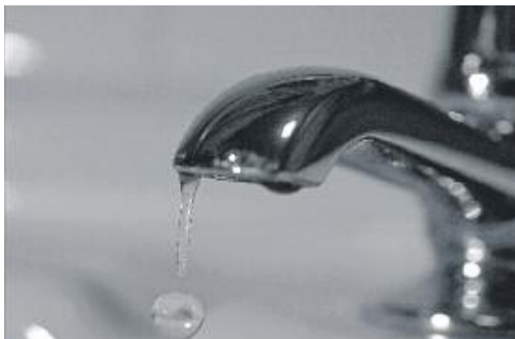
L'ajuntament estudia gestionar el servei de l'aigua del municipi.

L'aigua és un dels pocs serveis que, en cas que les famílies no puguin pagar el subministrament, l'Ajuntament se'n fa càrrec. Des del consistori asseguren que abans de prendre cap decisió, primer han d'esperar el