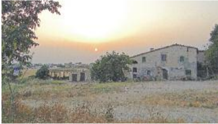
Actualment, la masia de Can Serra està molt deteriorada.