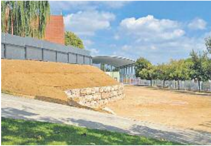
Zona de l'escola Pau Casals on es fa la remodelació.

L'empresa Naturalea ha definit una sèrie d'actuacions que, en principi, permetran solucionar els problemes existents actualment als dos centres educatius i, a més, serà una oportunitat per acostar els alumnes de les