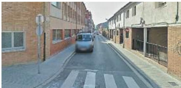
Les cases dels mestres seguiran sent equipaments educatius.

Tot i que aquesta mesura ha generat algun debat, tots els grups municipals coincideixen en la importància d'atendre tant les necessitats d'habitatge social com les d'ensenyament. L'alcalde remarca que "la intenció