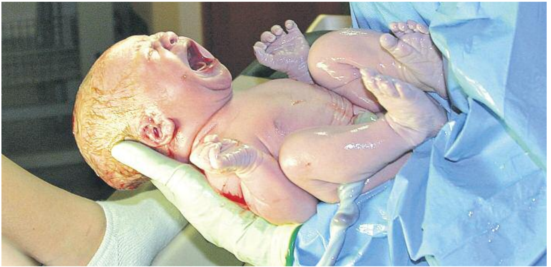
El Vallès Oriental és la quarta comarca on més es redueix el nombre de naixements.