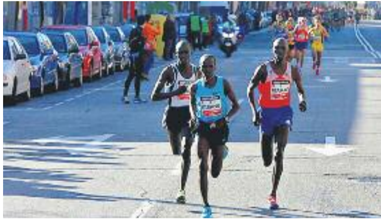
Tres atletes durant la cursa del passat 2014.