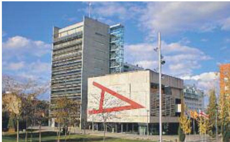
Mollet s'estalviarà més d'un milió d'euros de despesa financera.

Concretament en el cas de Mollet, el consistori s'estalviarà