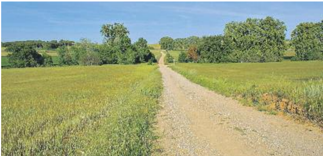
Les persones que circulin per Gallecs sense autorització podran rebre multes d'entre 300 i mil euros.