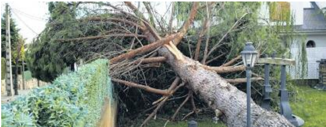
Els ajuts de la Diputació no cobriran el 100% de les despeses i no es concretaran fins a finals de març.