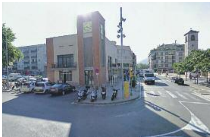
Desestimen les al·legacions d'UPyD i aproven el pressupost.

UPyD proposava en la seva al·legació poder executar un expedient parcial de regulació del personal de l'Ajuntament i d'aquesta manera reduir diverses partides. La regidora d'Econo-