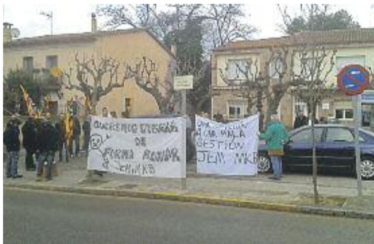
Una de les concentracions dels treballadors davant l'Ajuntament.

Els sindicats també han explicat que una vegada que se superin els 430.000 euros de facturació, es pagarà el 25% del deute pendent; quan es realitzin entre 400.000 i 420.000 euros