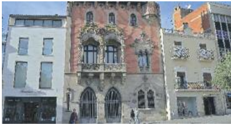
Granollers tindrà una nova llei sobre els usos del paisatge.

carta de colors, que fixarà recomanacions -però no obligacions- a l'hora de definir el color de les façanes dels edificis del centre històric i del primer eixample, on s'inclouen carrers com Corró, Barcelona o Ricomà.