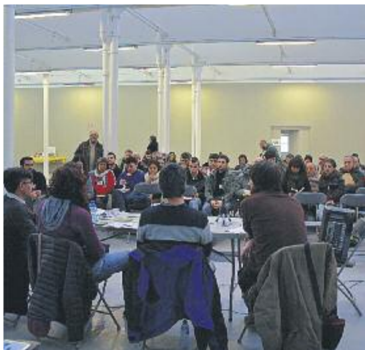
Jornada La Crida per Granollers de dissabte passat.