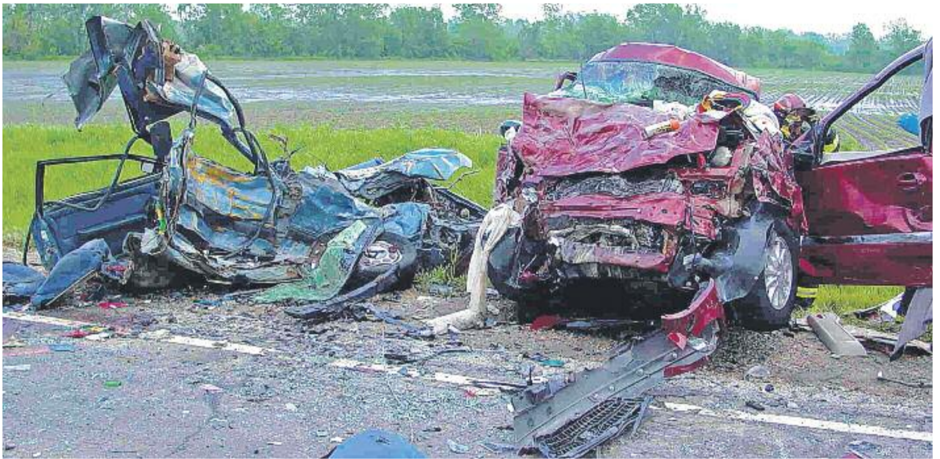
Durant el 2014 nou persones van morir a les carreteres de la comarca, sis menys que el 2013.