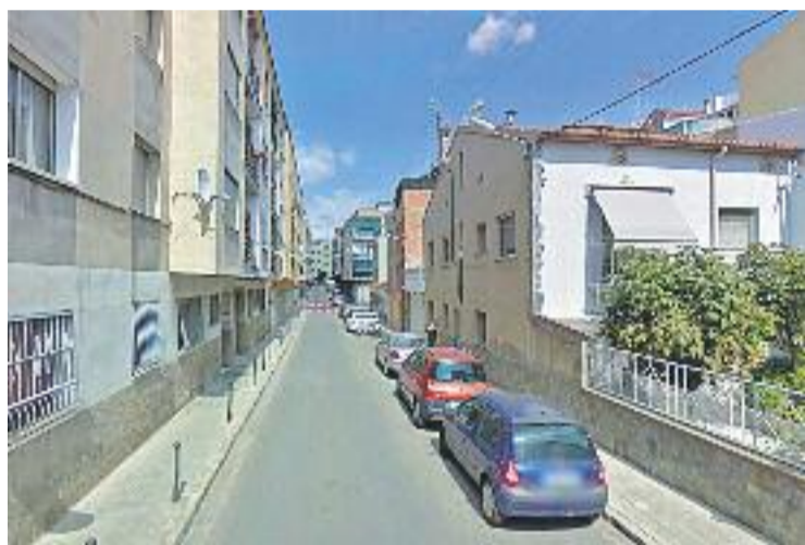
Carrer on va ser detingut el presumpte traficant.

Segons l'Ajuntament, "aquests fets posen en relleu la coordinació i col·laboració que existeix entre els dos cossos de seguretat en la feina del dia a dia, no tan sols en temes diaris de seguretat ciutadana, sinó també pel que fa a la convivència als barris".