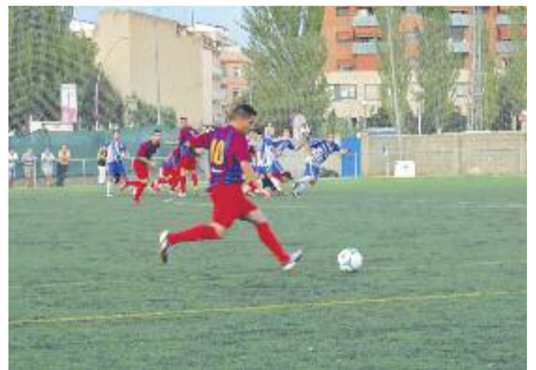
La Molletense es va imposar al partit de la primera volta.

Per últim, el Granollers tanca la jornada dels vallesans rebent la Unió Atlètica Horta.