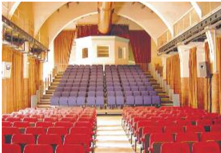
Can Gomà, l'escenari de l'entrega dels premis.