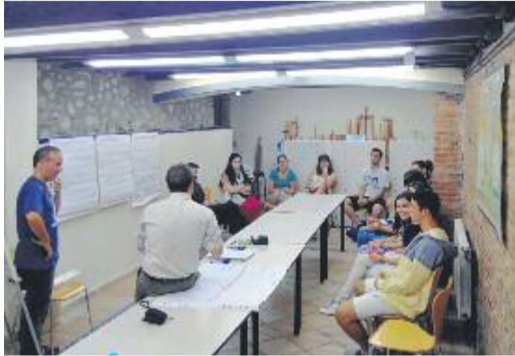
Primera reunió amb els joves a partir de 14 anys.

Fons de l'Ajuntament asseguren que "aquesta primera presa de contacte va servir per