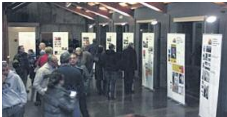
Un dels moments de la inauguració de l'exposició.

mateixa manera i acusen l'equip de govern d'atacar la llibertat d'expressió amb la seva decisió.