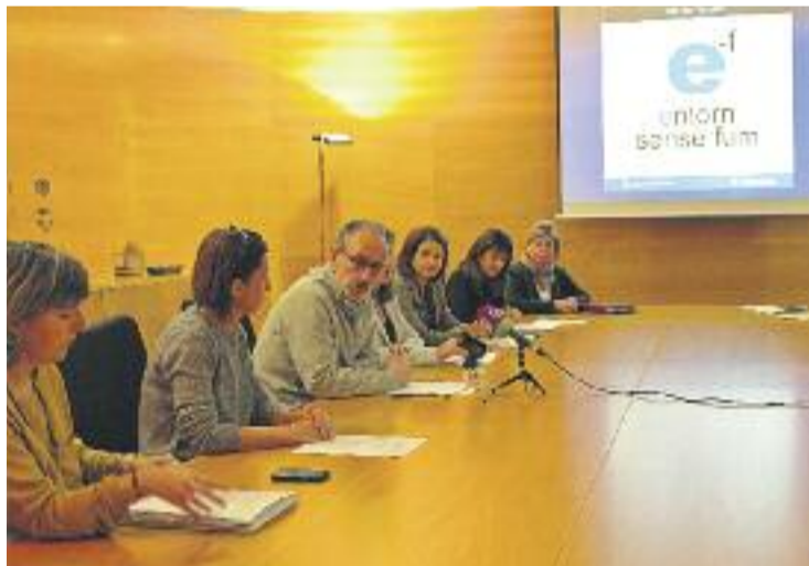
Presentació dels resultats del projecte Entorn sense fum.