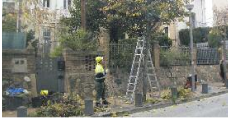
El municipi rep una subvenció per fomentar l'ocupació.