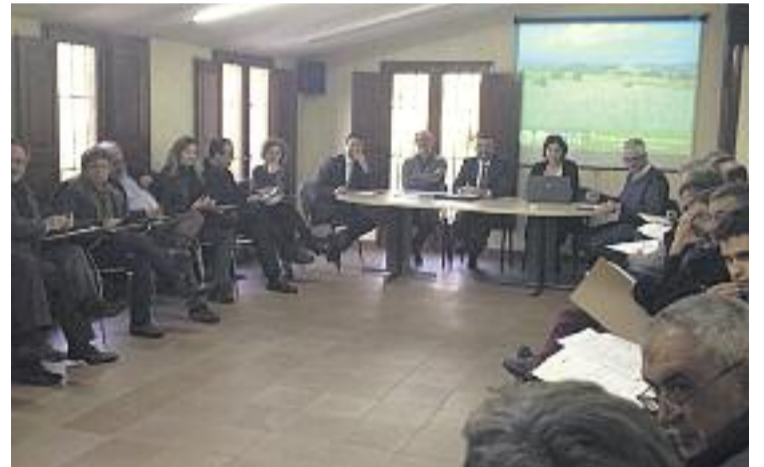
Acte de constitució del Consell de Participació.

L'òrgan està integrat per dos representants de la Generalitat; un de cadascun dels ajuntaments de Mollet del Vallès, Santa Perpètua de la Moguda, Palau-Solità i Plegamans, Paret del Vallès, Montcada i Reixac i Lliçà de Vall; i representants, actualment, de tretze d'entitats i associacions vinculades al territori de Gallecs que es pot ampliar fins a 35.