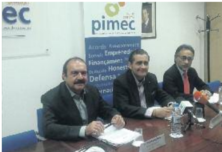
Presentació de les dades anuals de PIMEC.

Des de PIMEC afirmen que la comarca també ha crescut en l'afiliació d'autònoms fins a superar els 30.000 professionals censats. Aquesta xifra se situa molt a prop dels 32.000 que va ser la millor dada registrada l'any 2008. La mida de l'empresa ubicada a la comarca és en un