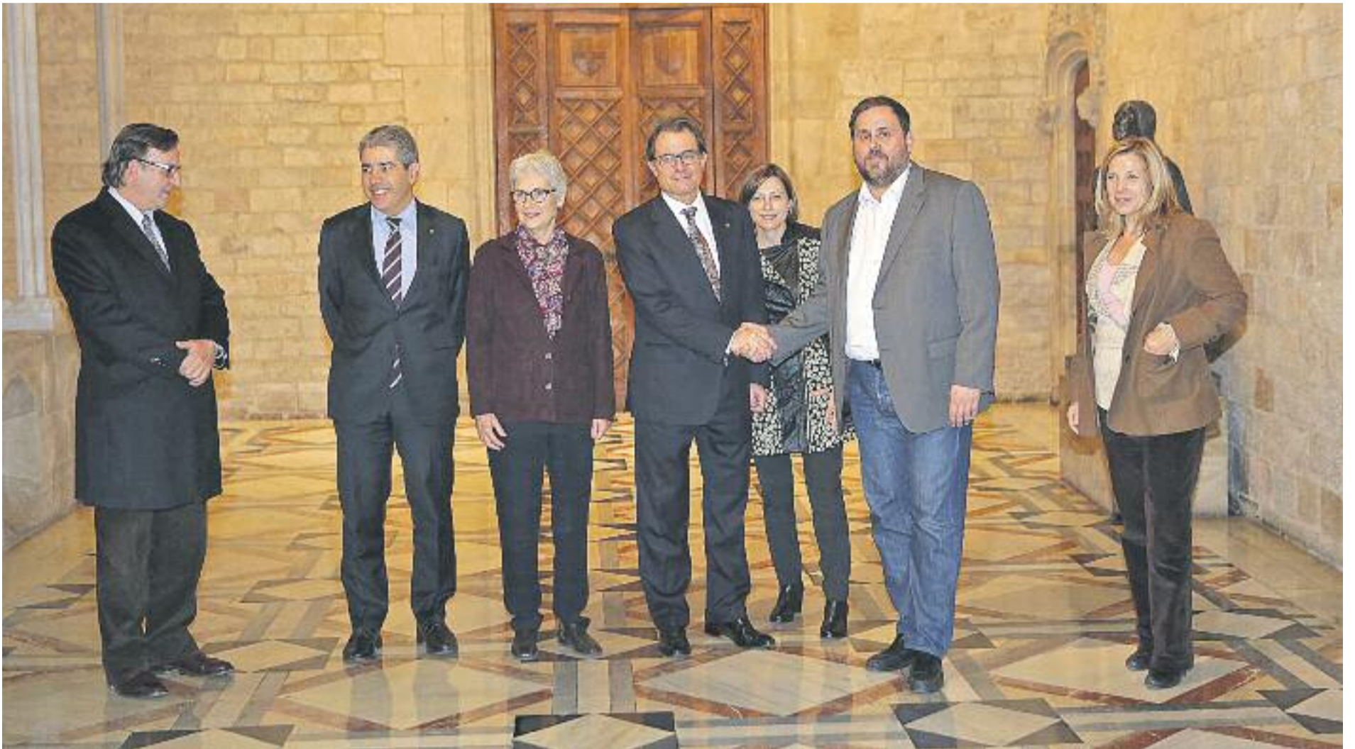
Mas i Junqueras van tornar a protagonitzar una imatge d’entesa el passat dimecres 14 de gener.

» Mas i Junqueras refan la unitat “per portar el procés de transició nacional fins a la victòria” » L’acord prioritza la creació d’estructures d’Estat des d’ara fins a les eleccions del 27 de setembre