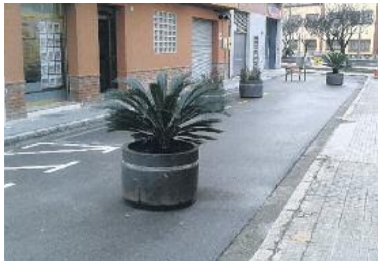
El carrer Pamplona serà una zona per a vianants.