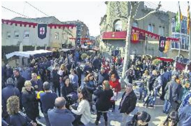
Una de les representacions del Mercat Medieval.

A més, per segon any consecutiu, la plaça de la Vila i els carrers de l'entorn es convertiran en un mercat medieval, en el qual els visitants es transportaran a l'Edat Mitjana. Al mercat es podran adquirir productes artesanals, viandes variades i gaudir d'activitats com un combat cos a cos entre cavallers, re-