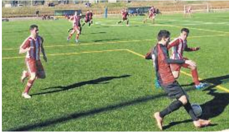
Amb l'empat a Avià, el Granollers consolida el seu lideratge.

Per la seva banda, la UD Molletense encadena la tercera derrota consecutiva i està empatada a punts amb la UE La Jon-