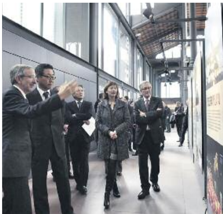
Inauguració de l'exposició a Barcelona.