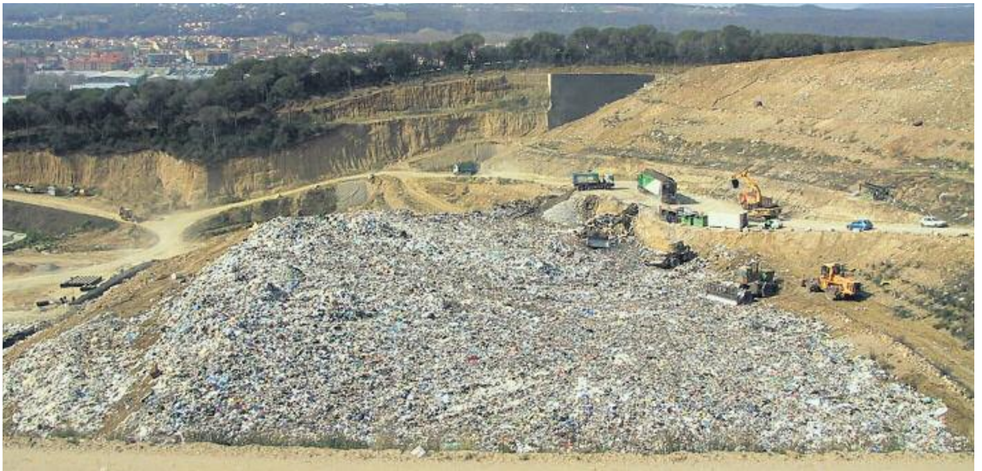
L'abocador de les Valls de Santa Maria de Palautordera ha tancat les seves portes després de 28 anys d'activitat.