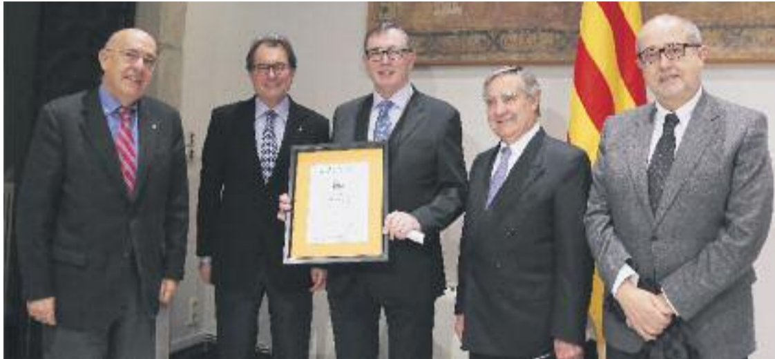
Un dels moments del lliurament de la certificació IQNet SR10.