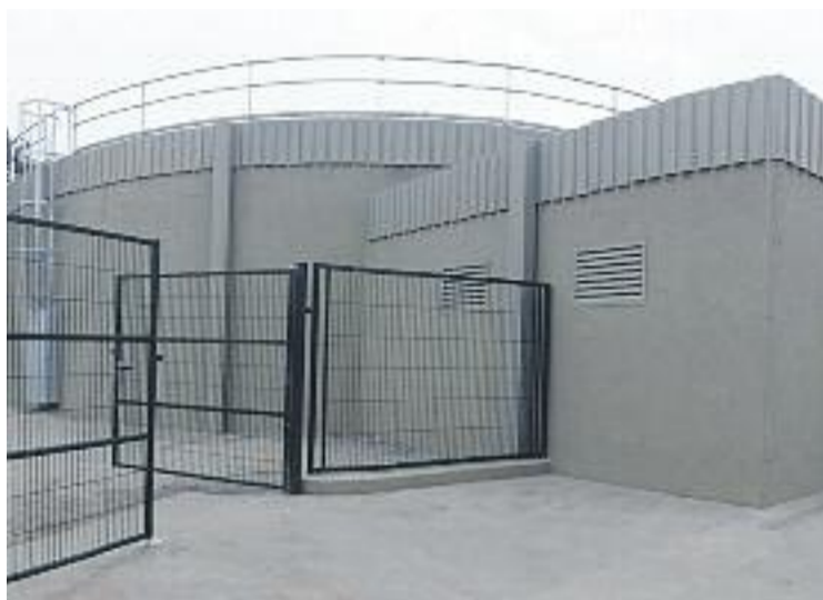
Nou dipòsit del Turó de la Bandera.

tegrament per Aigües Ter-Llobregat, concessionària de la Generalitat de Catalunya dins del marc del Pla d'Inversions del seu contracte de concessió, formarà part de la xarxa municipal d'abastament d'aigua i suposarà un nou punt de subministrament de la xarxa en alta gestionada per l'ens. El cost de les