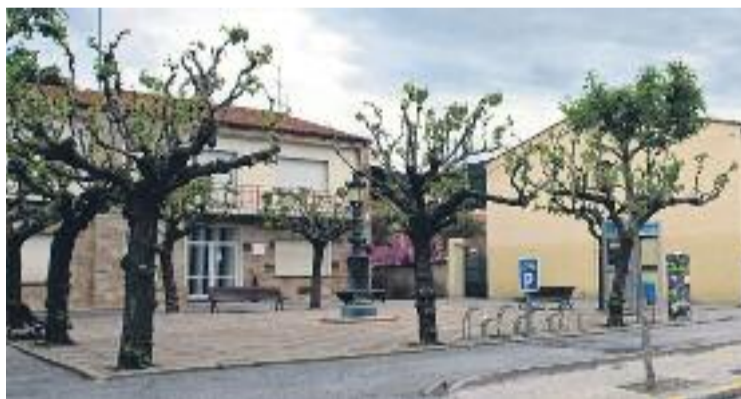
Façana de l'Ajuntament de Martorelles.