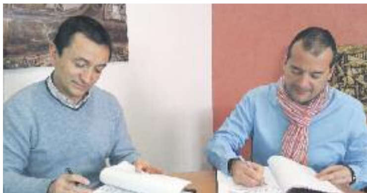
Moment de la signatura del conveni.

El servei de poda es contractava anualment a diferents empreses capacitades del sector, però a partir d'ara es fa per períodes de dos anys amb l'objectiu d'assolir una major eficàcia dels treballs i un estalvi econòmic per a l'Ajuntament. Els treballs d'esporga es faran en dies feiners durant l'època d'atur vegetatiu dels arbres, la qual té lloc per a la majoria d'espècies autòctones