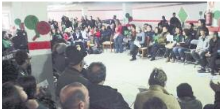
Una de les reunions de la PAH de Granollers.

Actualment no se sap quantes famílies han passat per aquesta situació, ja que la PAH remarca que quan aquestes persones acudeixen a la plataforma "no se'ls pregunta com han accedit a l'habitatge". "Per nosaltres tots els afectats són iguals i tenen els mateixos drets: els ajudem sense preguntar", diuen des de la PAH, però calculen que n'hi podrien haver un mínim de 10.