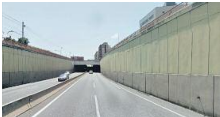
Túnel de la C17 al seu pas per Mollet.

Segons va informar el conseller Santi Vila, la Generalitat ac-