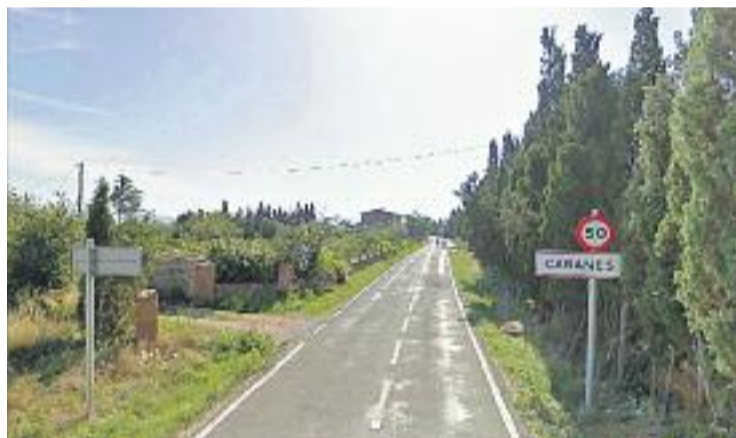
Zona on van trobar morta la dona assassinada.

El març de l'any passat, Neus Juanola Juan, una dona de 75 anys, moria després de ser trobada lligada i malferida en un camp molt proper a casa seva, al municipi de Cabanes. Un veí la va trobar en estat de semiinconsciència. Va ser traslladada a l'hospital, on la seva salut va empitjorar i va ser portada a un coma induït del qual no es va poder recuperar com a conseqüència de les lesions sofertes per l'agressió i el posterior abandonament.