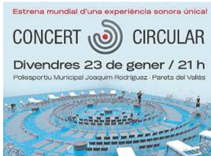
Detall del cartell del concert.

En aquest concert, la disposició dels músics canvia per distribuir-se en quatre anells sonors: en el nucli es trobarà el so pur, amb instruments amb una qualitat tímbrica molt especial com el didgeridú , el hang i la tabla índia , que estaran interpretats pel trio TaHaDi. En el segon anell se situaran quatre petits escenaris amb la veu humana, que anirà a càrrec d'intèrprets del grup vocal VoxAlba. En el tercer, hi haurà ubicat un quartet de