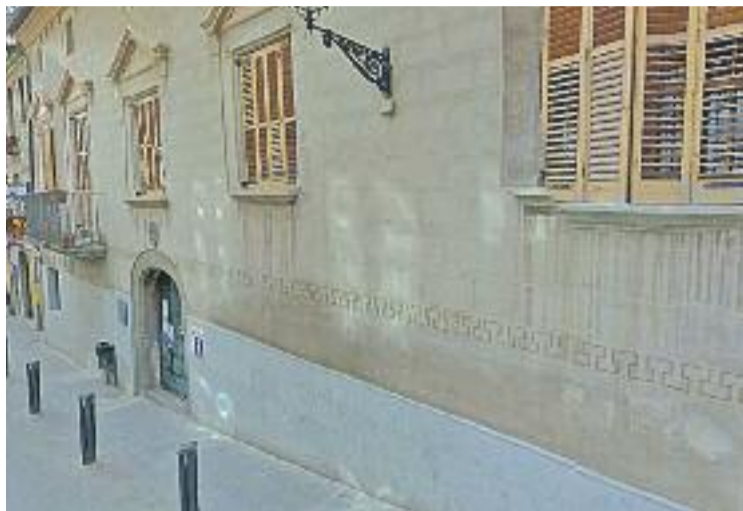
Seu del Consorci del Moianès, ara tancada.

El Consorci del Moianès podria haver continuat la seva activitat com a organisme adscrit