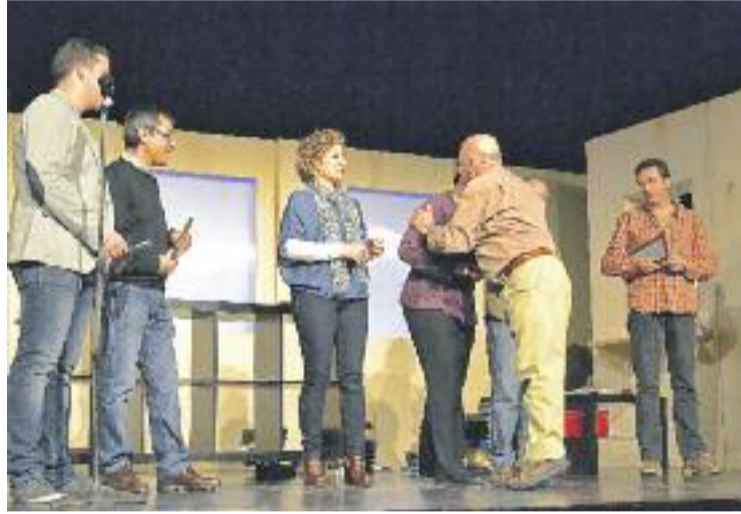
Cloenda de la 23a Mostra de Teatre Amateur.

El programa de la mostra es completa amb l'obra A les fosques , el dia 25 de gener del grup Attrezzo de Vilafranca del Penedès; 25 de Gener , l'1 de febrer de la mà del grup Punt i seguit de Terrassa; Un esperit