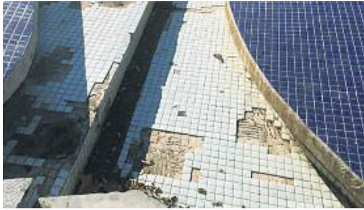
Un dels espais amb manca de manteniment de la ciutat.

L'Ajuntament, en canvi, manifesta que "el servei municipal