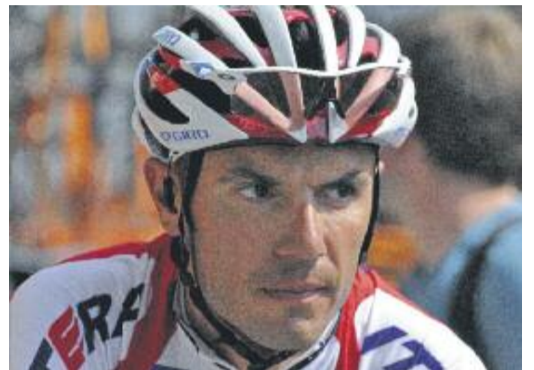
Joaquim Rodríguez rebrà un nou homenatge dels seus.

El museu dedicat a Joaquim Rodríguez estarà ubicat al pavelló municipal de Parets, que també porta el seu nom i que actualment es troba en obres per reformar l'aparcament i el seu entorn. Aquestes reformes aprofitaran el paviment actual, cercant-lo amb rigoles i vorades per millorar el drenatge, i incorporaran una xarxa de reg per a l'arbrat viari.