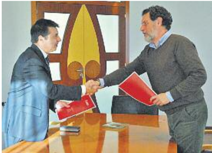
Un dels moments de la signatura del conveni.

Després de la instal·lació de la fàbrica de Bultaco a Montmeló, l'any passat, i l'inici de les activitats que permetran la producció, el 2015, de les noves Bultaco Brinco i Rapitan, complint amb els plans presentats a Londres el 17 de maig del 2014, durant les properes fases de desenvolupament es necessitarà incorporar diversos llocs de treball, per a la qual cosa l'Ajuntament posa a disposició de Bultaco els serveis del seu departament de Promoció econòmica. Des del consistori asseguren que amb la seva col·laboració,