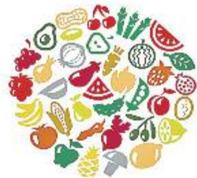
EL REBOT DELS ALIMENTS FRESCOS DE MONTMELÓ

tensió de treballar per una banda la conscienciació i capacitació entre la ciutadania del greu problema que suposa el malbaratament d'aliments, tot incidint en la prevenció, mitjançant campanyes de comunicació, xerrades informatives i cursos de cuina per prevenir el malbaratament alimentari i, per una altra banda, treballar per tal de poder recuperar els aliments i repartir-los entre la població que es troba en situacions socials de vulnerabilitat i que són ateses pel departament de Serveis Socials.