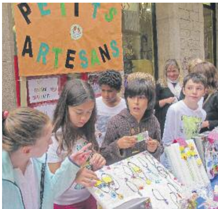
Quatre escoles de la ciutat crearan les seves cooperatives.