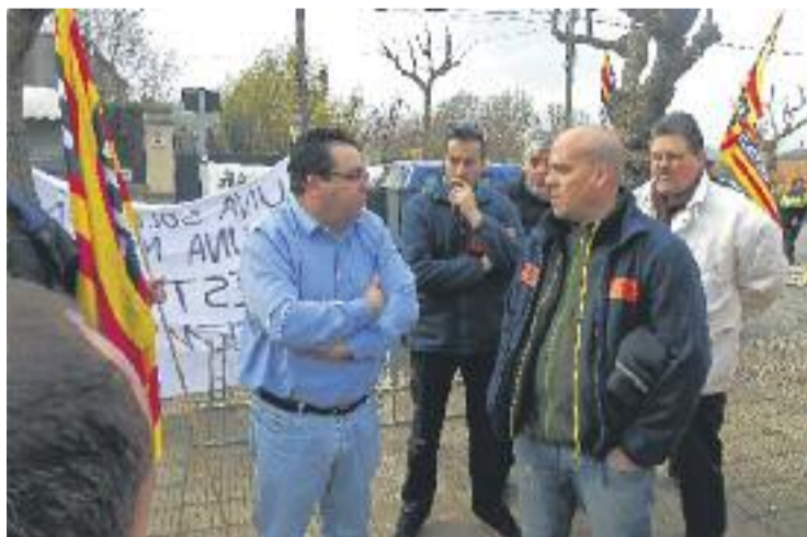
Trobada entre l'alcalde i els treballadors de JEM i MKB.

La direcció de JEM i MKB, de la família Morell, manté un conflicte amb els seus empleats perquè es nega a fer efectius els pagaments pendents, fet que ha