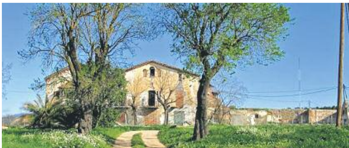
Masia de Can Cruz que actualment està sent rahabilitada.