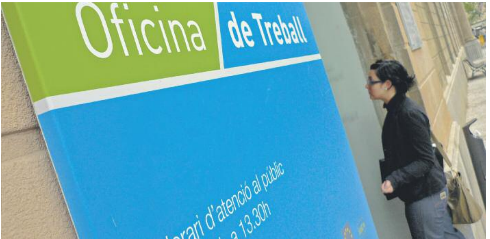
Gairebé 10.000 joves vallesans d'entre 16 i 34 anys no tenen feina.