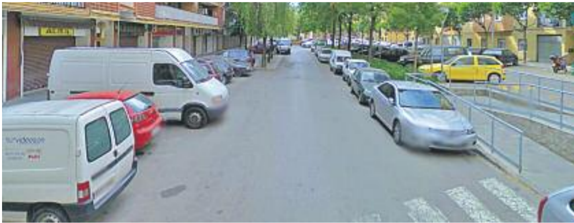
Les obres del carrer Progrés tindran una duració de dos mesos.