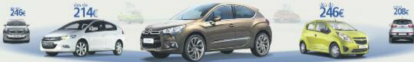
Citroën DS4 1.6 VTI 120 Design SP 120CV Preu anual orientatiu amb bonificació.