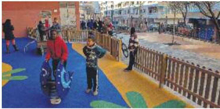
Un dels espais dels renovats jardins de Can Guitart.

a terme en una superfície total de 3.550 m 2 , dels quals 2.025 m 2 corresponen a paviments i 1.336 m 2 a parterres vegetals. L'obra, pressupostada en 350.000 euros, amb IVA inclòs, ha rebut l'aportació de 300.000 euros de la Diputació de Barcelona.