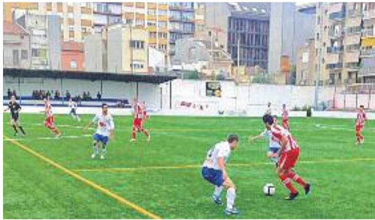
El Granollers ha convertit el seu estadi en un fortí.

En canvi, la UE Mollet va veure com s'interrompia la seva bona ratxa després de caure contra L'Escala FC en un dels