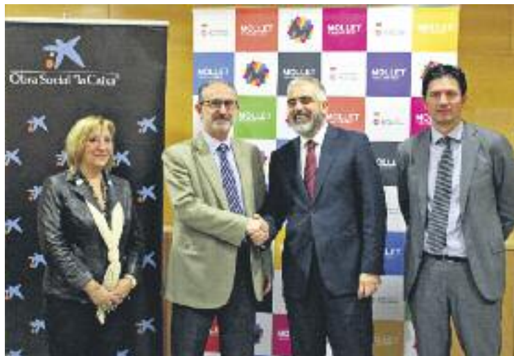
L'Obra Social La Caixa dona 12.000 euros per als infants.