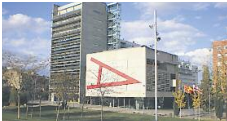
Els funcionaris rebutgen els pressupostos del 2015.

Així doncs, des de la UGT remarquen que l'endeutament econòmic que pateix Mollet ha provocat que els treballadors de l'Ajuntament i d'altres empreses