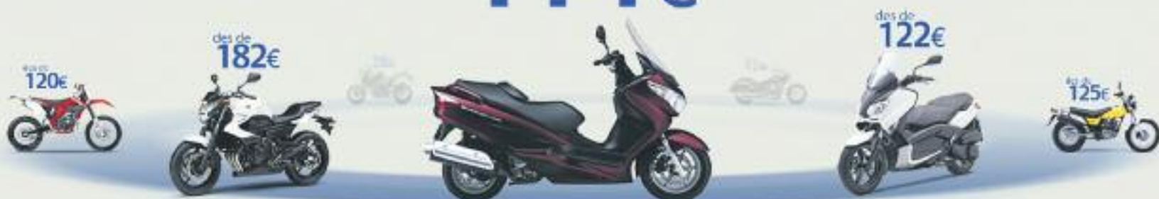
Suzuki Burgman 200. Preu anual orientatiu amb bonificació.

TERCERS AMB ASSISTÈNCIA EN VIATGE des de 114€