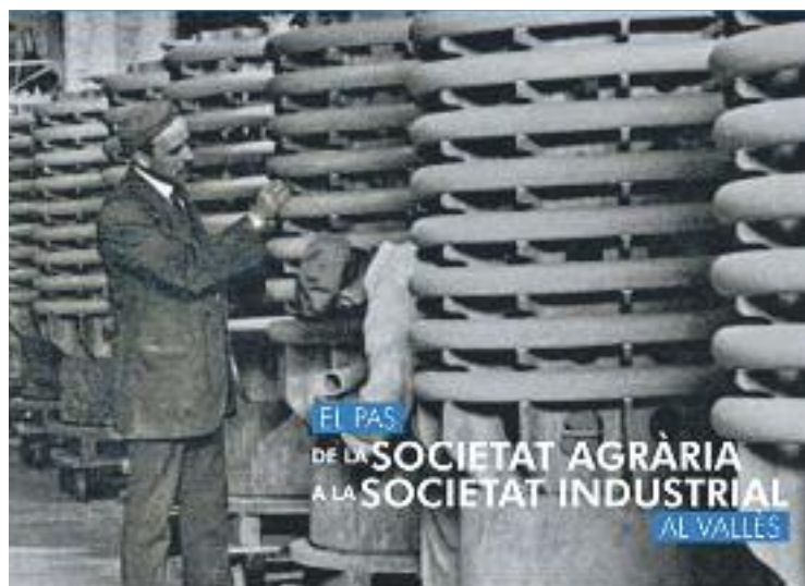
Cartell de la trobada.

El Vallès ha estat una de les comarques on el paisatge agrari ha canviat més al llarg del se-