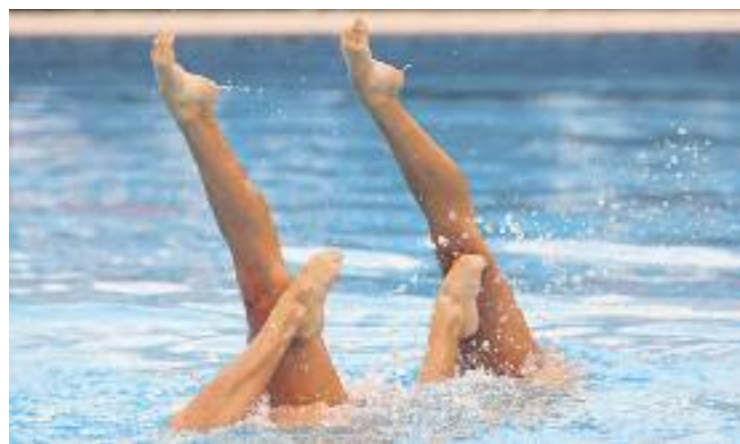
El campionat estatal es va disputar a Madrid.

Per altra banda, el Campus de Tecnificació de Natació Sincronitzada del CN Granollers, que tindrà lloc del 28 al 30 de desembre, ja ha rebut més de 20 inscripcions.