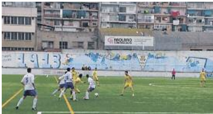
El Granollers és líder en solitari amb 29 punts.

Pel que fa als seus veïns de Mollet, els dos equips de la ciutat necessiten guanyar per enlairar-se en la classificació i poder sortir de les últimes places