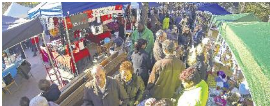
Fira de Santa Llúcia del 2013.