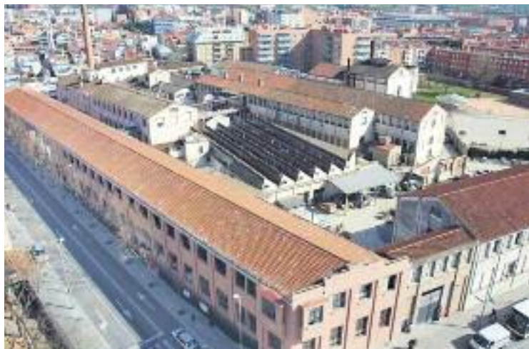
Vista aèria del recinte Roca Umbert.

El pressupost previst per portar a terme aquesta actuació és de 7.865 euros i el termini que tenen les empreses per presentar les seves propostes és fins al 16 de gener. Des de l'Ajuntament ja han avançat que volen que el projecte escollit "s'encarregui d'homogeneïtzar el cromatis-