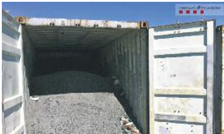
Un dels contenidors carregats amb sorra i pedres.

La investigació es va iniciar arran de la denúncia d'un empresari xinès que va explicar als Mossos que la seva empresa havia comprat 76 contenidors carregats de metall (coure i llautó) a una empresa ubicada a Barcelona. L'enviament d'aquests contenidors s'havia de fer via marítima sortint del port de Barcelona amb destí al port de Hong Kong. Ara bé, quan els primers