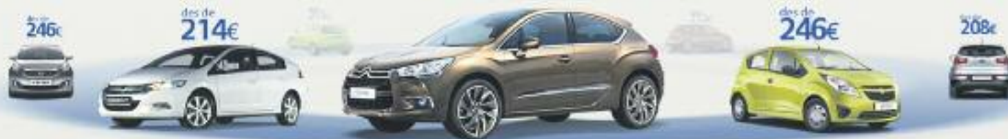
Citroën DS4-1.6 VTI 120 Design SP 120CV. Preu anual orientatiu amb bonificació.

TERCERS AMB ASSISTÈNCIA EN VIATGE des de 114€