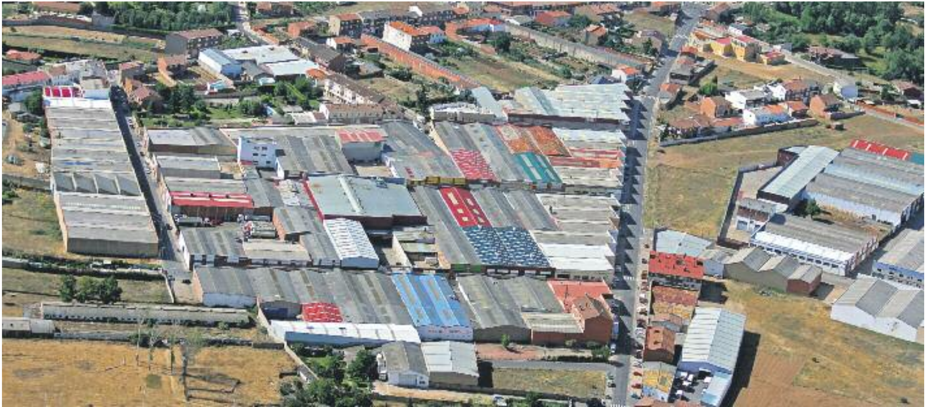
El PIB del Vallès Oriental és el que evoluciona menys desfavorablement de tot el país gràcies a la indústria.