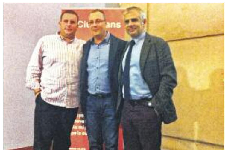
Presentació de C's Mollet.

Una vegada que s'hagi decidit si hi ha candidatura a Mollet, l'agrupació escollirà el candidat que serà cap de llista. A hores d'ara, C's Mollet té deu militants i una vintena de simpatitzants.