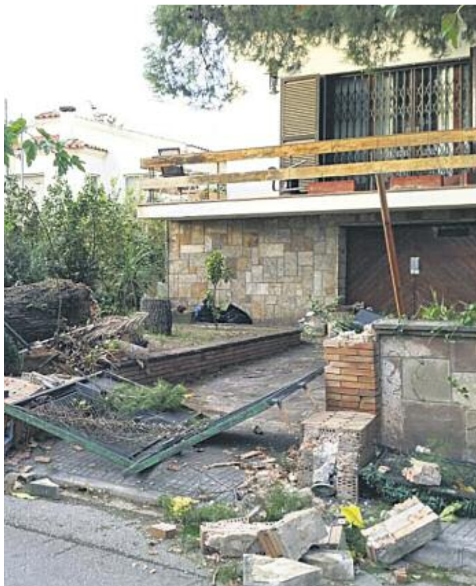
La llevantada va provocar destrosses arreu de la comarca.