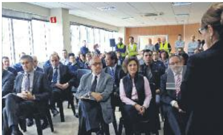
Inauguració de les noves instal·lacions d'AGC.

AGC ha creat 16 llocs de treball, que se sumen als 40 que ja tenia, a la unitat AVO de Santa Perpètua amb l'objectiu de fer front a la demanda dels fabricants d'automòbils de l'estat espanyol que s'ha duplicat respecte al 2013, el primer any de producció de la unitat. Aquest projecte ha rebut el suport d' Invest in Catalonia , l'àrea d'atracció d'inversions estrangeres de la Generalitat, que ha col·laborat també amb AGC en la cerca de proveïdors locals