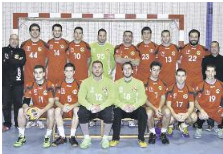
El sènior masculí rebrà un homenatge durant la presentació.