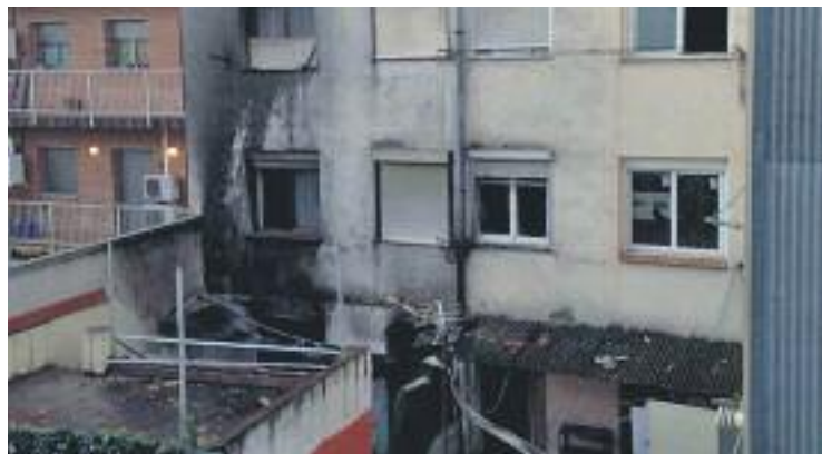
Un home mor en una explosió de gas en un pis.

Fonts de l'Ajuntament asseguren que les sis famílies desallotjades van ser evacuades a un hotel de la ciutat.