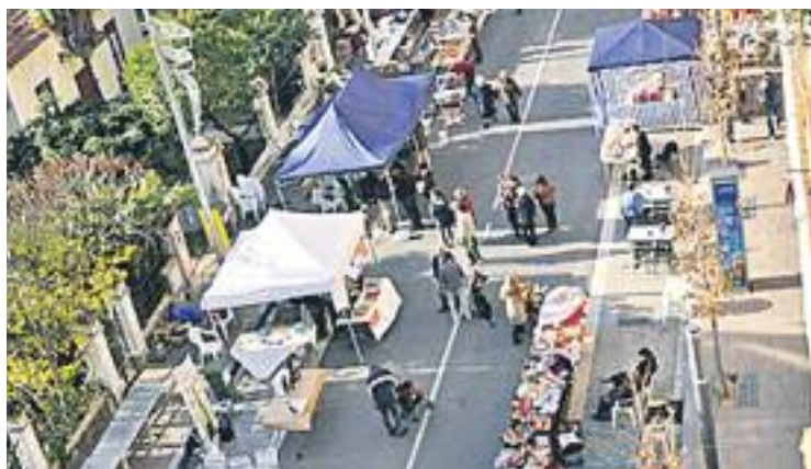
Fira de Nadal de l'any passat.

Entre les novetats d'enguany, també destaquen el Circuit de karts ecològics, que tindrà sessions al matí i a la tarda, el Lindy Hop de l'Escola de Dansa Pas a Pas o la Masterclass de Zumba a càrrec dels alumnes del