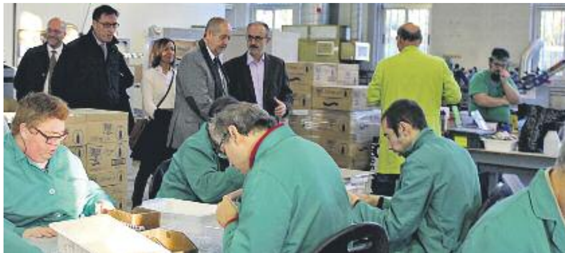
Visita del conseller Felip Puig al Taller Alborada.