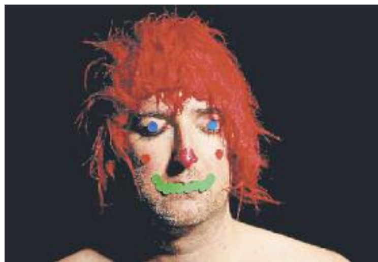
Un dels moments de l'obra Nens de paper.