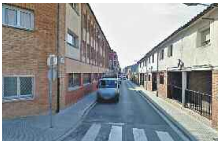
Cases dels mestres del carrer Florida.