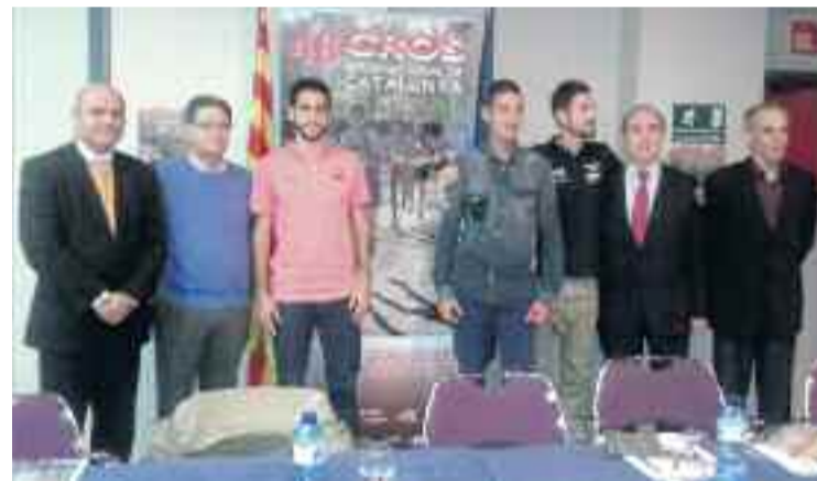
Acte de presentació de dimarts passat.

La matinal atlètica començarà a partir de dos quarts de 10 del matí amb les curses de veterans seguides de les categories de promoció, fins a arribar al migdia, quan es realitzaran les curses internacionals sènior masculina i femenina. El recorregut començarà i finalitzarà a les pistes esportives municipals.