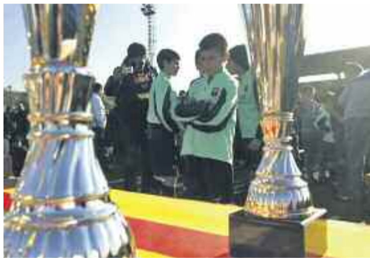
Més de 65 equips participaran en la Golden Cup.

COMARCA ▶ Les Franqueses i la Garriga acolliran a partir de demà, i fins dilluns, la tercera edició de la International Golden Cup, una competició de futbol base on participen més de 65 equips, entre els quals destaquen el FC Barcelona, l'Espanyol, el Vila-real, la Damm, el Cornellà, equips de la comarca com el Bellavista Milan, el CF les Franqueses, el Canovelles o el Granollers, a més de la Roma, l'Ajax o el Benfica, entre altres.