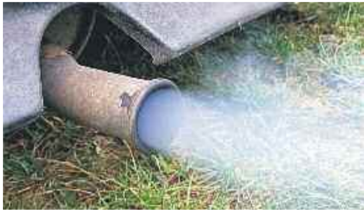
Granollers supera els límits de contaminació permesos per la UE.

Malgrat aquestes informacions, el secretari general de Medi Ambient de la Generalitat, Josep Enric Llebot, admet que hi ha aquest problema, però puntualitza que "només se superen els límits màxims de contamina-