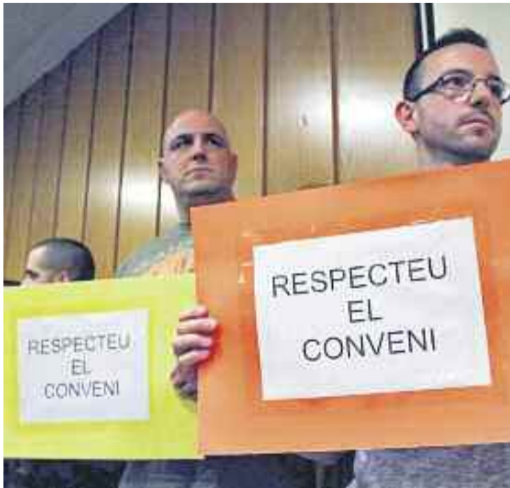
Protesta al ple municipal dels treballadors de l'Ajuntament.