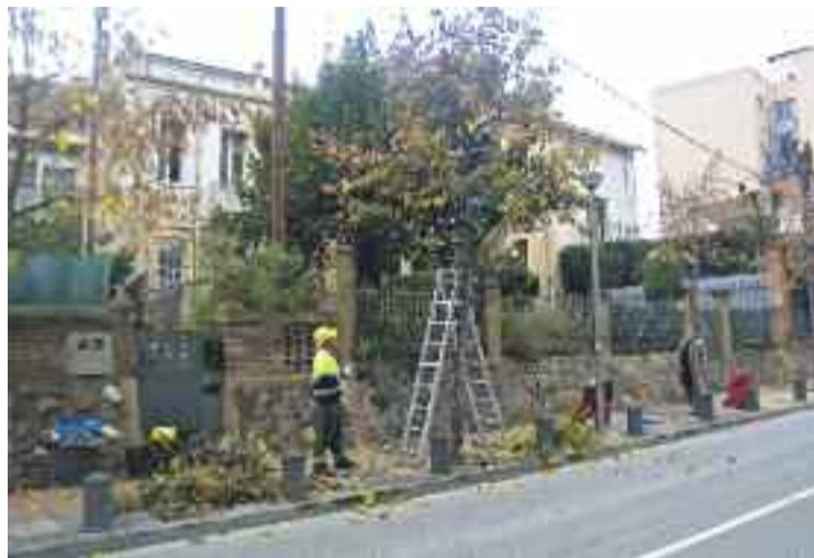
Dos dels treballadors contractats pel Consell Comarcal.

Aquest nou programa integra accions formatives i d'experiència laboral i s'adreça a persones en situació d'atur no perceptores, que hagin exhaurit la prestació per desocupació i el subsidi. Els diferents projectes municipals que es duran a ter-