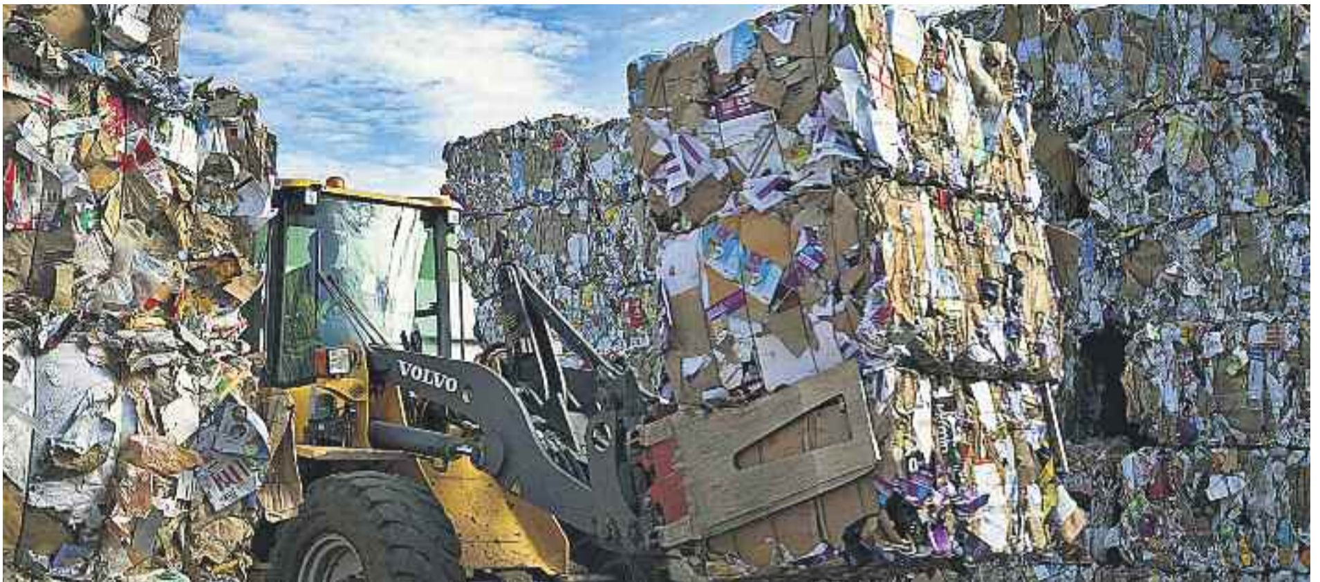
El Vallès Oriental, referent en la recollida selectiva neta.