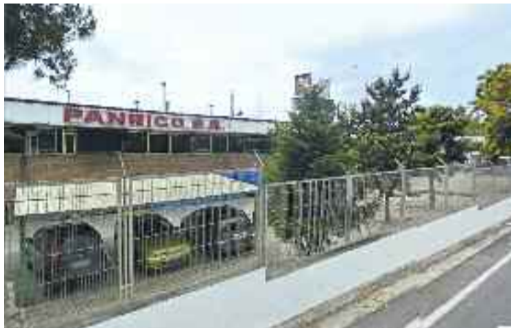
Planta de Panrico a Santa Perpètua.