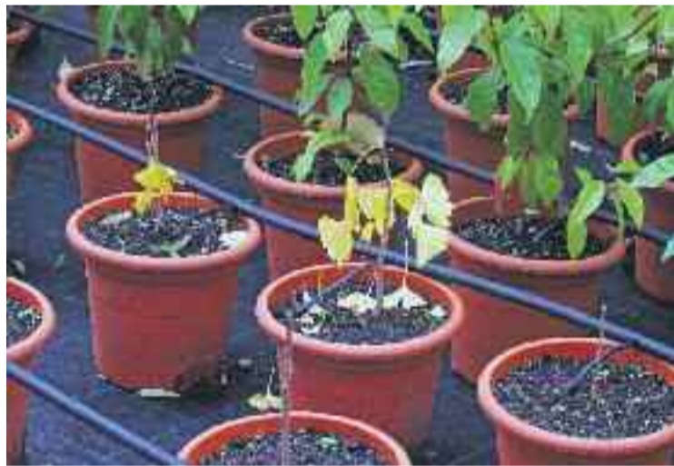
Plançons de Ginkgo biloba dels Viviers Bell-Lloc.

MEDI AMBIENT ▶ Granollers vol sensibilitzar sobre el dany causat per les armes nuclears i la necessitat d'eliminar-les. Per fer-ho, l'Ajuntament de Granollers, ciutat membre de l'Executiva de la Xarxa Internacional Alcaldes per la Pau ( Mayors for Peace ), s'ha compromès a plantar i nodrir diferents llavors dels arbres supervivents al bombardeig atòmic d'Hiroshima.