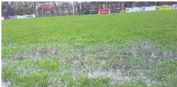
Estat de la gespa poc abans de començar el partit a la Jonquera.

Tot i l'empat a l'Empordà, el Granollers segueix liderant la classificació amb 29 punts. L'enfrontament contra l'Escala, que fins al minut 80 semblava que cauria a favor dels vallesans, no va acabar bé pel Granollers. Fins