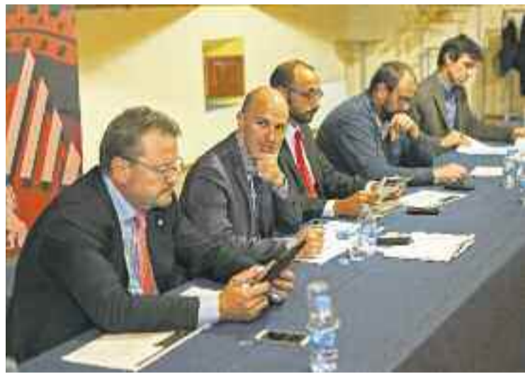
Reunió de la Junta local de Seguretat.

Pel que fa a les actuacions portades a terme per la Policia Local, els agents van realitzar 198 controls d'alcoholèmia i van cursar 1.145 denúncies per infraccions de les Ordenances Municipals o del Reglament General de Circulació, en les quals, en més de la meitat dels casos,