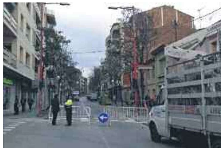
Carrer on es troba la casa esfondrada.

De manera provisional es va tallar la circulació de vehicles a l'avinguda Jaume I. A hores d'ara ja s'ha reobert el trànsit a la zona.