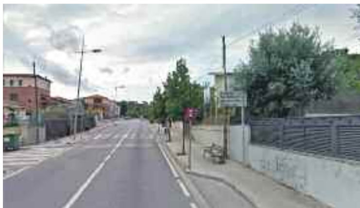
Carretera B-500 al seu pas per Sant Fost.

guren que el govern municipal s'ha reunit amb el Director General de Carreteres per traslladar-li les dades, fer-lo coneixedor del problema i plantejar-li la necessitat d'adoptar mesures, encara que siguin provisionals, per treure el trànsit del mig del poble. Una reunió que valoren de manera molt positiva i destaquen que des de la Generalitat "s'han mostrat receptius amb la qüestió. De fet, tècnics del de-