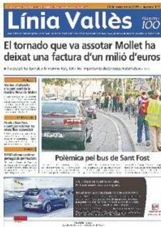
Número 100 · 16 setembre de 2005