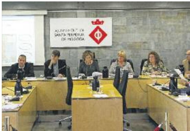
Reunió de l'AMERC a Santa Perpètua.

GUALBA ▶ L'Ajuntament de Gualba ha enllestit els treballs de construcció d'un edifici funerari dins del recinte del cementiri municipal que servirà per a cerimònies civils de comiat dels difunts i també per a l'acolliment de les persones que visitin els seus familiars morts. L'edifici està format per una sala d'uns 30 m2 amb una taula baixa, cadires, lavabos i un magatzem.