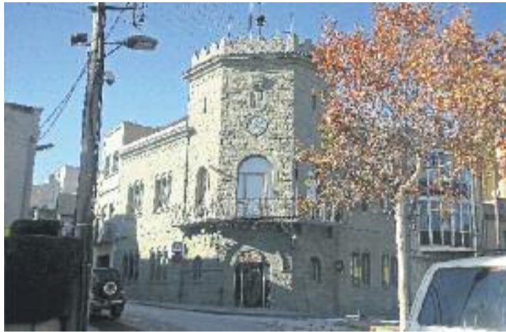
L'Ajuntament col·laborarà amb el Senegal.

ció Youbari aportarà la seva experiència per a la gestió integral del desenvolupament de les activitats acordades, l'expedició del material, la coordinació per a la realització de campanyes sobre la salut o el seguiment i valoració de les actuacions que estimin oportunes.