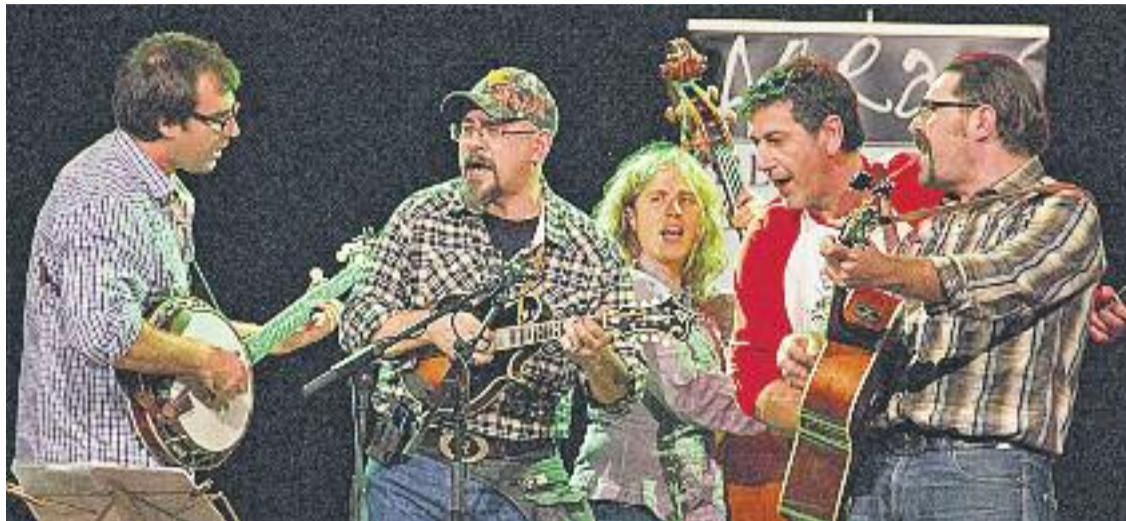
El Festival Al Ras torna a portar la música bluegrass a Mollet.