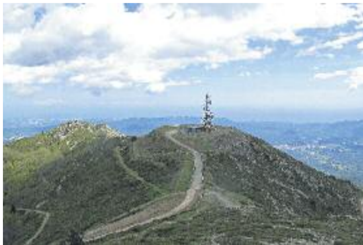
Lloc on s'instal·larà el centre meteorològic.

Així mateix, la Diputació també remarca que es realitzarà un informe jurídic relatiu al règim urbanístic aplicable a les edificacions que conformaven l'Observatori meteorològic del Turó de l'Home, d'acord amb el Pla especial de protecció del