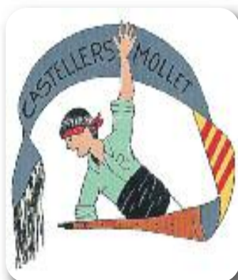
Castellers de Mollet Colla castellera

“ENHORABONA pel número 500, i a tots els que feu possible que un periòdic com Línia Vallès pugui seguir sortint al carrer i actualitzant-se de manera online , que és a l'abast de tots els vallesans, i que explica les històries i notícies més properes, que més ens interessin. I GRÀCIES per seguir fent periodisme de proximitat, amb rigor i qualitat, i amb el qual es dona suport l'esport local”.