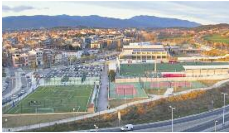
El Corró d'Avall serà un dels escenaris del torneig.

Els enfrontaments del torneig tindran una durada aproximada