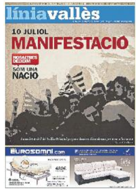
Número 313 · 9 de juliol de 2010