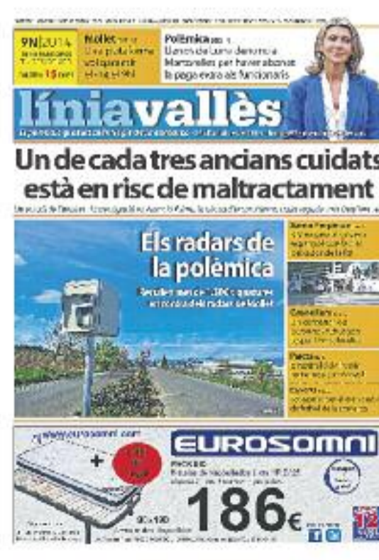
Número 497 · 24 d'octubre de 2014