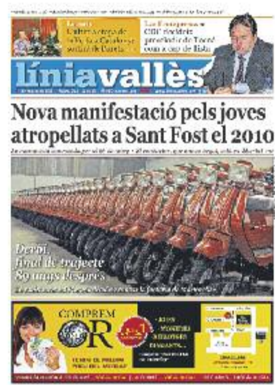
Número 344 · 11 de març de 2011