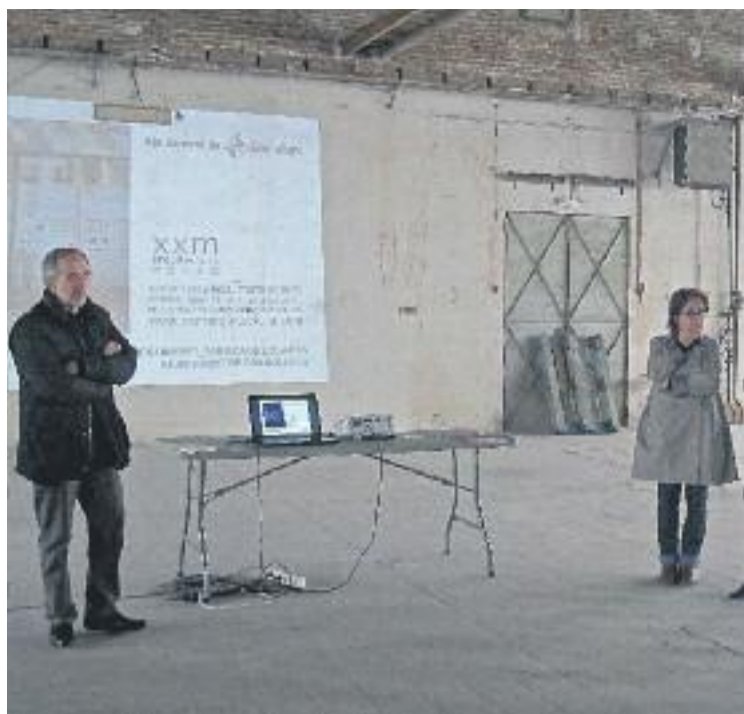
Presentació de la primera fase de les obres de l'espai.