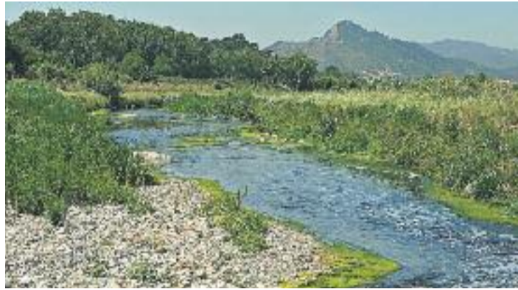
Riu Besòs al seu pas per la Llagosta.

Ja queda menys perquè els viants i els ciclistes de la Llagosta puguin tornar a creuar el riu Besòs. La Junta de govern local de l'Ajuntament ha adjudicat les obres de construcció de la passarel·la del riu Besòs a l'empresa Gonzalo García SA, cosa que permetrà la recuperació del pas per travessar el riu i poder accedir a la Serralada de Marina, sense haver de desplaçar-se a Montcada o Mollet. Les obres tindran un cost de prop de 24.800 euros i haurien d'estar enllestides abans de finals d'any. Al mes de setembre, l'Ajuntament va rebre oficialment el permís de l'Agència Catalana de l'Aigua per construir la nova passarel·la que substituirà a la que va enderrocar Adif al març