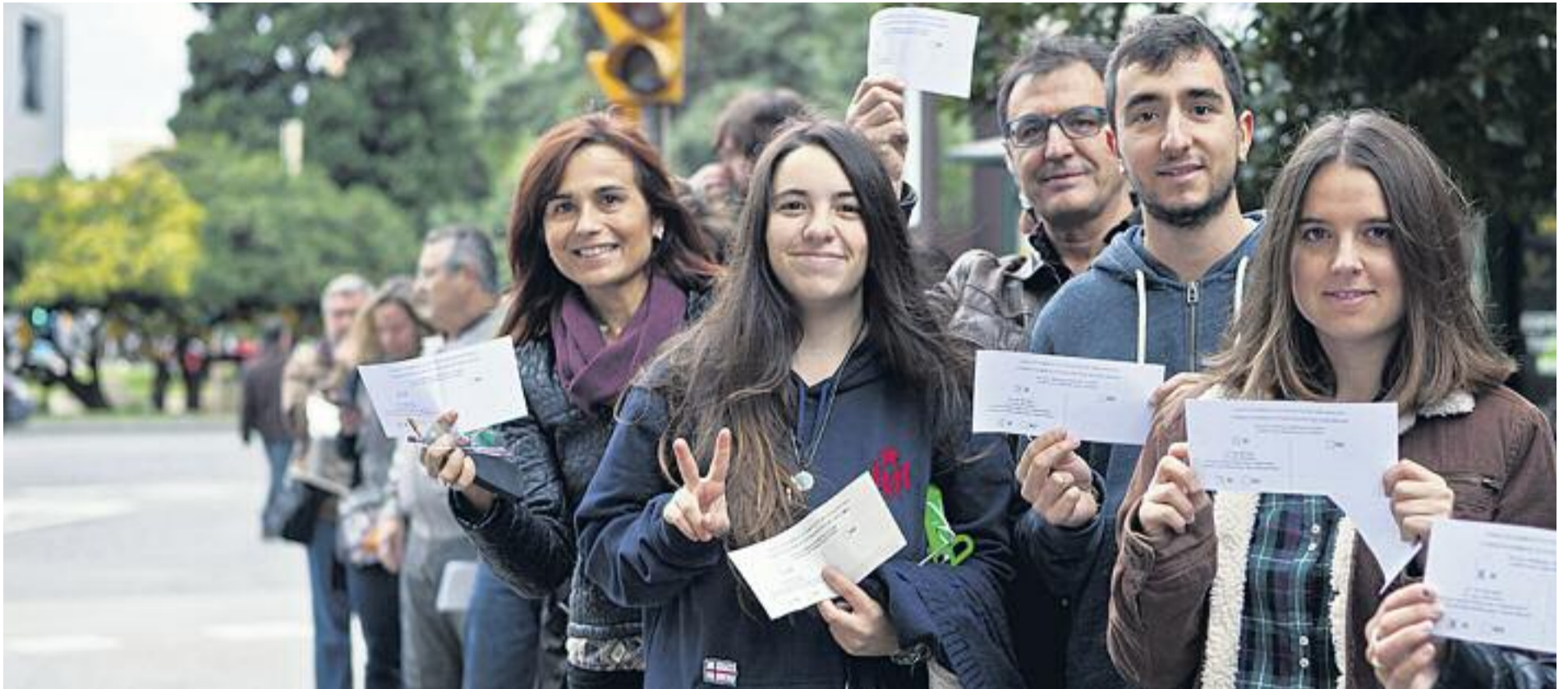
Més de 2,3 milions de catalans van participar en el 9N.