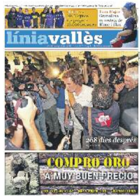
Número 317 · 26 d'agost de 2010