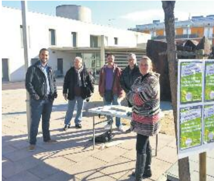
L'equip d'ICV davant del CAP de Montmeló.