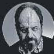
Josep Maria Pou