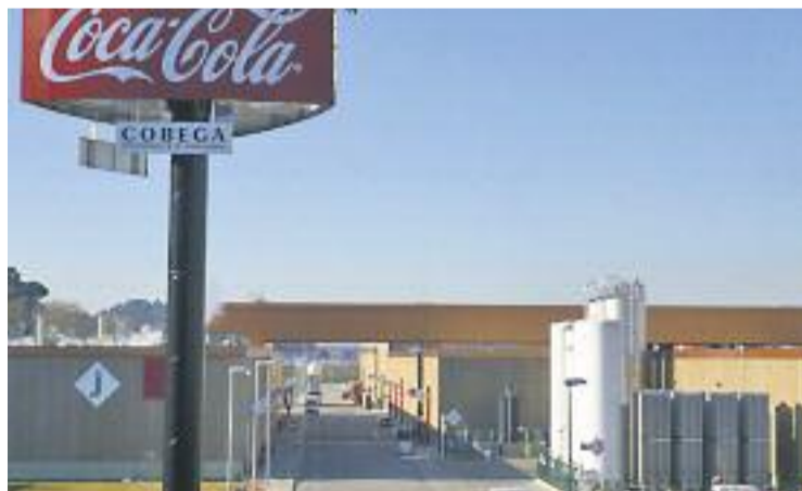
Planta de Cobega a Martorelles.

Dijous passat, l'Ajuntament va convocar un ple extraordinari per parlar sobre aquestes acusacions i va assegurar que "el