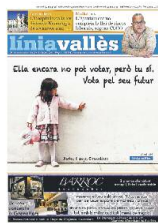
Número 330 · 26 de novembre de 2010