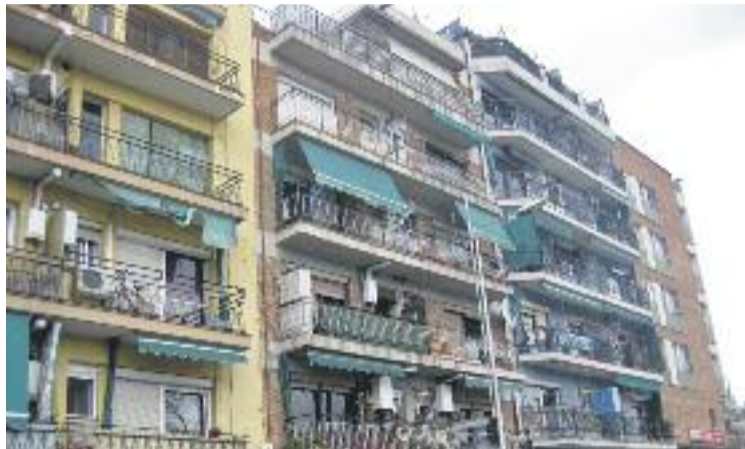
Els bancs seran sancionats si tenen pisos buits sense justificar.