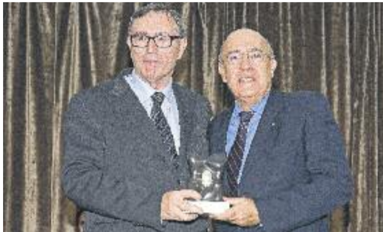
L'Hospital de Mollet rep el premi Top 20.

D'entre els 52 hospitals avaluats en aquesta categoria, només els quatre primers han rebut el premi, entre els quals hi