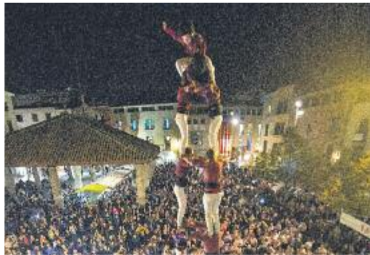
El cinc de vuit dels Xics haurà d'esperar.