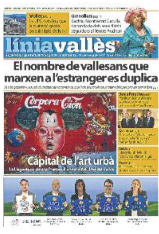
Número 479 · 16 de maig de 2014