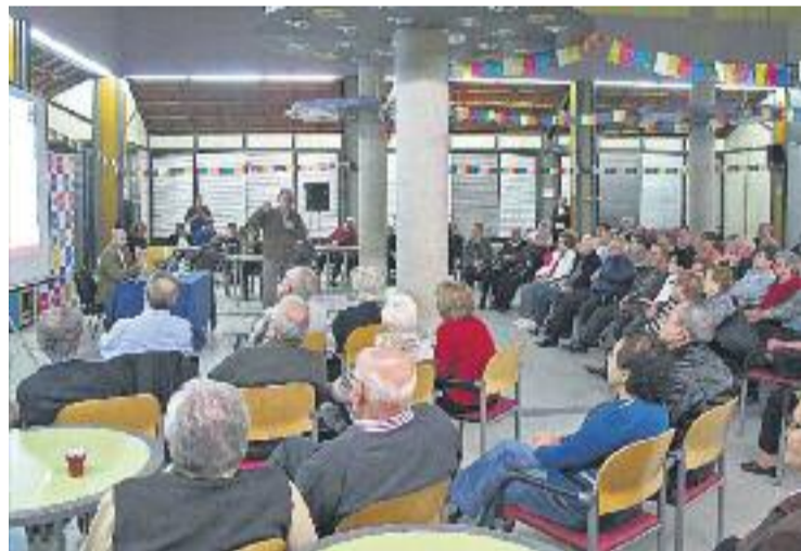
Reunió de l'alcalde amb la ciutadania.