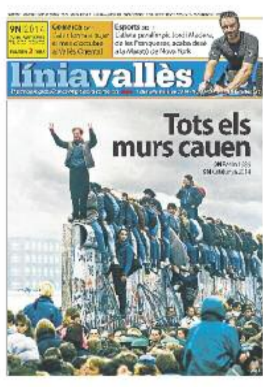
Número 499 · 7 de novembre de 2014