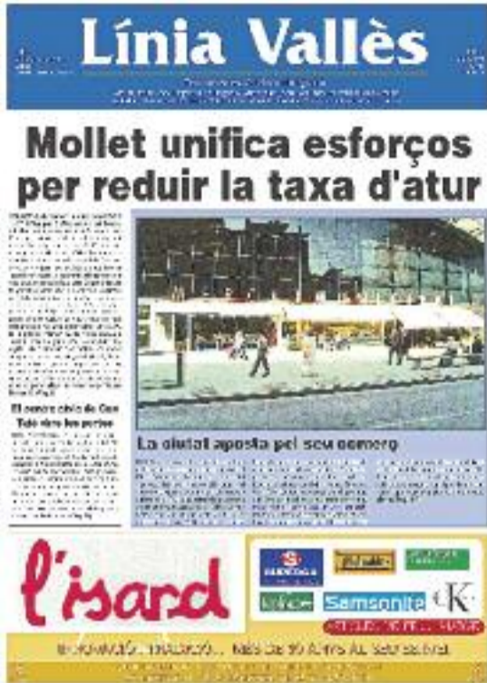
Número 1 · Abril 2001 de 2001