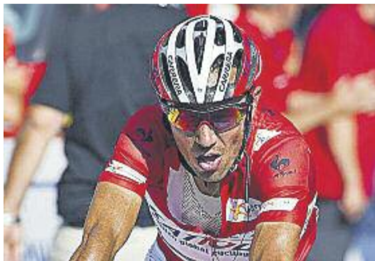
El Tour 2015 només comptarà amb una contrarellotge.