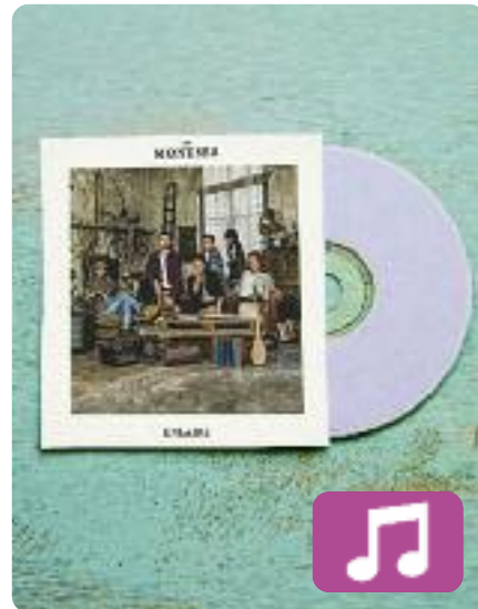
Enlaire Les Montses