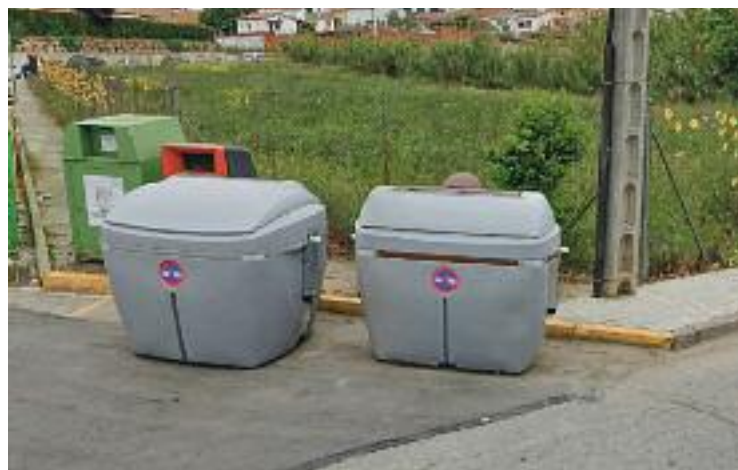
Contenidors de matèria orgànica en un carrer del poble.

Així, els dimarts es desinfecta l'interior dels recipients, mentre que els dimecres s'intensifica el treball de neteja als carrers.