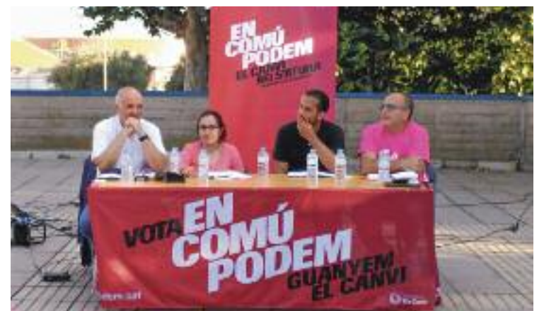
Un acte del partit abans d'entrar a la coalició.

Des de l'organització de Sumem Esquerres a Parets han transmès "el màxim agraïment per tot aquest temps i el màxim respecte cap a la decisió presa". Però, encara que els seus camins se separin, han assegurat que continuaran treballant per Parets. "Des del govern complirem els compromisos pels quals ens vam presentar a les eleccions municipals del 2019", conclouen.