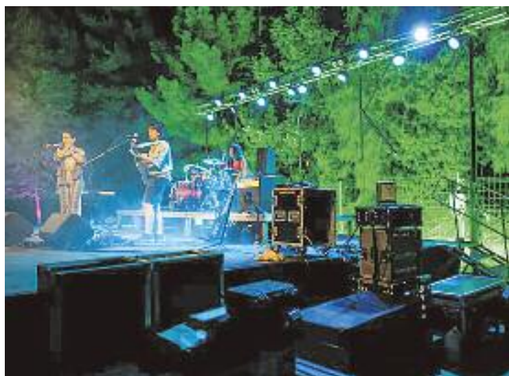
El concert de Ketekalles va inaugurar el cicle.

Però la música no és l'única protagonista de la Moguda Escènica; de fet, l'endemà de l'estrena, la companyia Mortadelo & Manzaní va posar sobre l'escenari Filibusters , una proposta de circ i pallaso, amb tècniques de circ (funambulisme) i