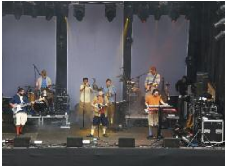
Oques Grasses actuarà demà a la Festa Major.

Com a novetat, aquesta Festa Major estrena l'aparcament del camp de futbol com a nou escenari per a aquest i per a la resta de concerts. Un espai que substituirà al Parc de la Linera com