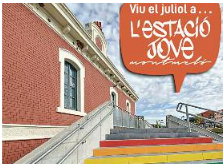
Un detall del cartell promocional.

torneig de tennis taula i un taller de percussió, mentre que avui el calendari presenta, per primer cop, una doble proposta. A dos quarts de set de la tarda, a l'Estació Jove, es posarà en marxa un taller de customització de roba, mentre que una hora i mitja