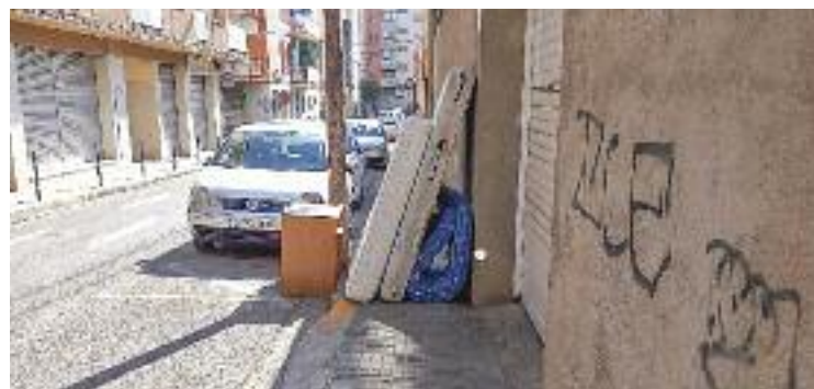
Aquests són alguns dels obstacles que hi ha als carrers.

ACCESSIBILITAT ▶ Ja fa temps que des de la plataforma ciutadana Mollet Opina es demana que els carrers del municipi siguin més accessibles. I és que les persones amb mobilitat reduïda es troben sovint amb alguns obstacles que els impedeixen moure's amb facilitat. Des de panots trencats i aixecats, passos de zebra sense voreres accessibles o pals de llum al mig del carrer, fins a mobles vells que s'acumulen davant d'algunes cases.