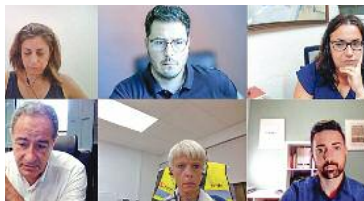
La reunió es va fer per videoconferència.

La trobada telemàtica també va servir perquè la Llagosta demanés alternatives per reduir el nombre de vehicles de particulars que arriben a la vila per agafar els trens de la línia R2 i per posar sobre la taula l'opció de desviament de la línia R3 per la R8 com a alternativa al desdoblament.