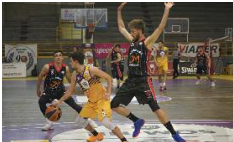
Els molletans perseguien l'ascens des de feia cursos.

ser en la nova categoria va acabar dividint-se i, de fet, el club ja coneix quins seran els seus rivals en el grup est (es mantindrà la divisió geogràfica vigent des d'aquest curs 2020-21). Es tracta del Menorca, el Bàsquet Sant Antoni, els filials de Valencia Basket i CB Gran Canaria, el CB Villarrobledo, el Canoe, el CB Cartagena,