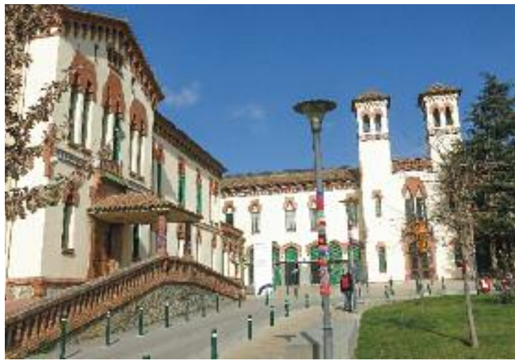
L'Hospital de Granollers ha comunicat una defunció recentment.

Igualment, després de més d'un mes sense que cap dels tres centres anunciés cap mort, a la capital de la comarca es va notificar la defunció d'un dels seus pacients. A hores d'ara, el centre del