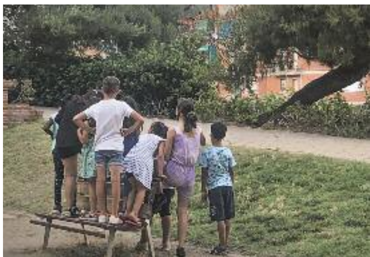
Tant nens com joves passen el temps al parc.

Tot i que des del Punt Jove de l'Ajuntament s'estan fent activitats, tallers i cursos durant tot el juliol en el marc del programa Estiu Jove, i des de la regidoria de Cultura han posat en marxa la programació cultural del Refresc'Art amb teatre i música, els joves pensen que això no és suficient. “Estaria bé que tornessin a posar els cinemes, que fessin alguna sala de concerts o algun local per reunir-nos, perquè hi ha espai per fer-ho”, diu una de les joves que apareix als clips, totes elles veus anònimes. “El pro-