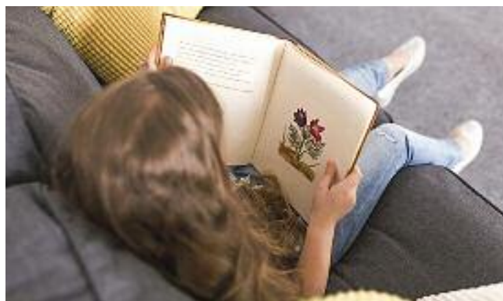
Una nena llegeix un conte.

L'activitat està pensada per a infants i joves, que tinguin entre 8 i 16 anys, usuaris de la xarxa de biblioteques públiques. Després de llegir algun dels 600 títols disponibles, han de respondre unes preguntes disponibles al web del concurs.