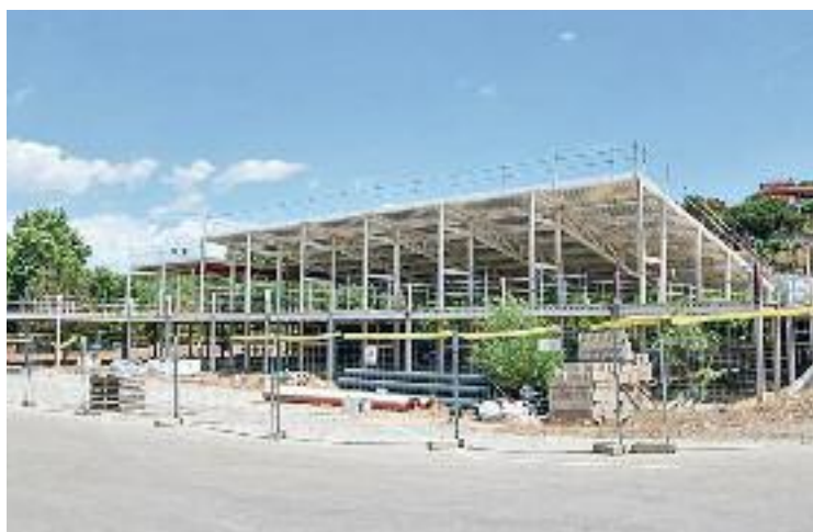
L'estat actual de les obres.

Això, segons es va explicar, significa un sobrecost del 20%, de manera que els regidors del