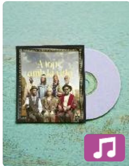
A tope amb la vida Oques Grasses

"Hem après a no posar-nos límits i fer el que ens ve més de gust", ha dit recentment el cantant i compositor d'Oques Grasses, Josep Montero, en una entrevista amb l'ACN sobre el nou disc del grup. A tope amb la vida és el cinquè àlbum de la banda osonenca, que l'any 2019 va publicar el que seria el disc més venut d'aquests últims, Fans del sol .