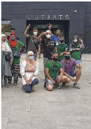
Suport als jutjats.

Tot i que la PAH denuncia aquestes irregularitats, després del judici respiren més tranquils perquè “Endesa, ahir, es va mostrar oberta a dialogar i a acordar una solució amb la família”, sentència Ramón.