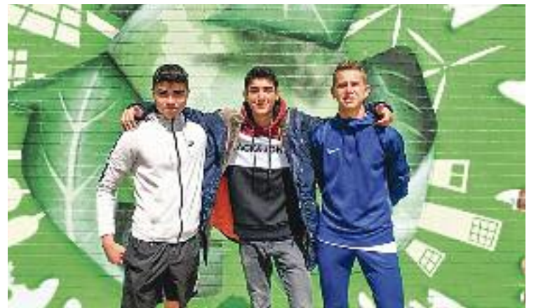
Els joves autors del projecte.

Tot i que hi ha un jurat que decidirà quin considera que és el millor dels 10 projectes, un 20% de la decisió està oberta al vot popular a través del portal web voting.audicrea.com . L'últim dia per votar serà el pròxim divendres 18 de juny.