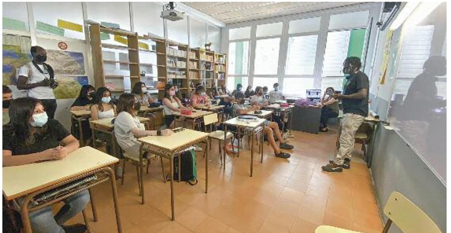
Un moment de la xerrada que es va fer ahir a l'Escola Municipal del Treball de Granollers.

"Em va semblar interessant contactar amb els manters per-