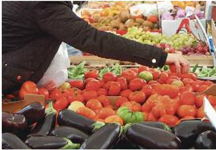
Una imatge d'arxiu del mercat, Foto: Aj. de Martorelles

Des d'abans-d'ahir, aquesta consulta es pot respondre al portal web municipal ( martorelles.cat/enquestacomerc ), tot i que també existeix la possibilitat d'emplenar-la en format físic, ja que les butlletes estan en-