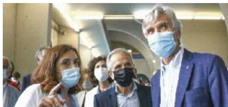
Una sanitària, l'alcalde i Argimon al Palau d'Esports.

SALUT ▶ El nou punt de vacunació massiva del Palau d'Esports de Granollers ja ha obert les portes. Ho va fer dimarts amb la visita del conseller de Salut, Josep Maria Argimon.