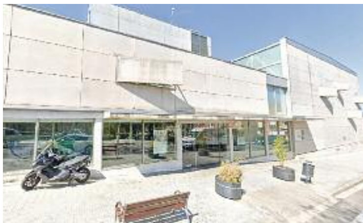
L'equipament esportiu, en una imatge d'arxiu.

mençar l'any 2014, i que en totes les instàncies judicials prèvies al