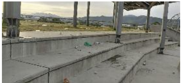
Així és com els veïns es troben el parc cada matí.

ESPAI PÚBLIC ▶ Els actes incívics segueixen sent un problema a Mollet. Primer, al Parc de la Plana Lledó i ara, a Ca l'Estrada. “Cada dia Mollet es desperta brut i en mal estat”, explica Nurria Flores, portaveu de Mollet Opina. Ampolles, vidres, plàstics, vòmits o excrements són algunes de les restes a les quals han de fer front els veïns cada matí.