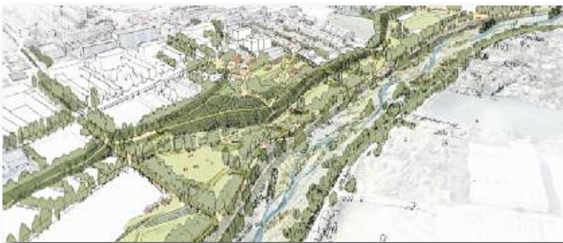
El projecte de recuperació de la llera del Tenes convertirà l'espai en un gran paratge natural i social.