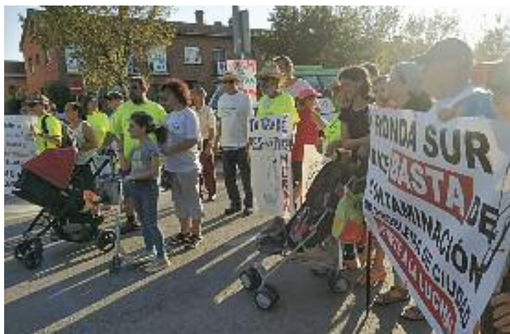
Una de les protestes contra la contaminació.

Segons informa l'Institut de Salut Global de Barcelona, "més de la meitat dels contaminants diaris que respiren els nens