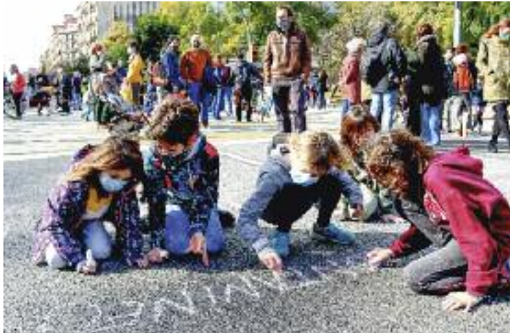
La Revolta Escolar va començar a Barcelona.

“No volem una ciutat envoltada de fum i soroll per als nostres fills, però ja és hora de queixar-se perquè Mollet, des del 2010, supera els límits de contaminació establerts per la UE”,