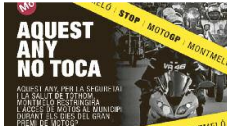
Un detall del cartell que ha distribuït el consistori.

Tot i que inicialment es previa una inversió de 400.000 euros, finalment caldrà una xifra que superarà per poc els 443.000 per fer-lo realitat.