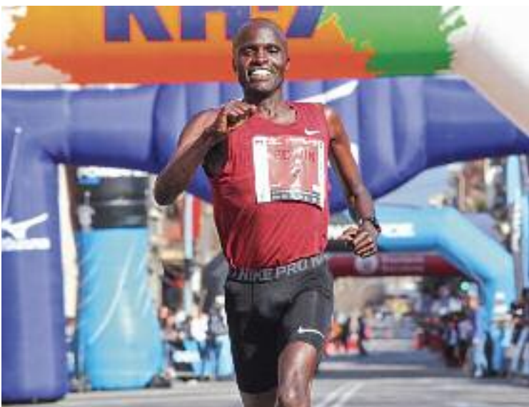
La cursa torna després d'un any d'absència.

"Tornarem i tornarem més forts. Fa mal, però són molts punts i és molta experiència per a mi en una de les primeres carreres d'oval. Espero que l'any vinent pugui guanyar", va assegurar el jove pilot després de la prova.