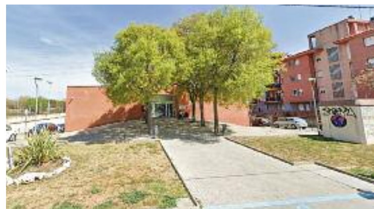
El centre no tancarà mentre es facin les obres.

Encara hi ha un altre contenciós judicial obert entre l'Ajuntament i Geafe, iniciat el 2012, sobre la rescissió del contracte per la gestió del CEM El Turó.