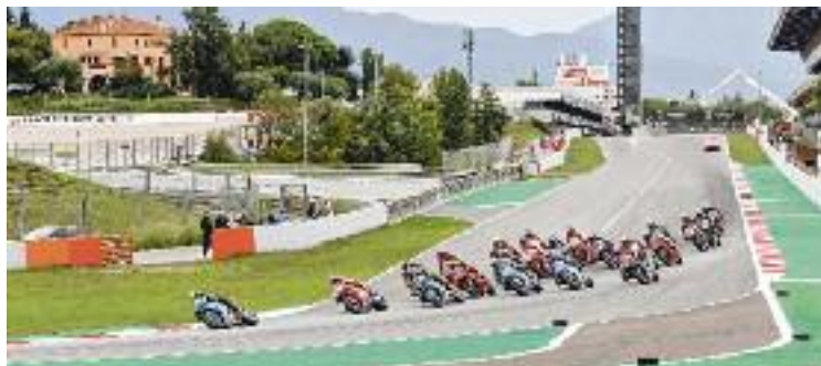
Diumenge tornarà a ser dia de curses.

Enguany, els organitzadors de la competició han decidit canviar l'ordre de les curses, perquè