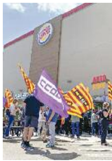
La protesta de dimecres.

Aquest problema encara no l'han tractat amb l'Ajuntament, però sí que els han informat a través de les xarxes.