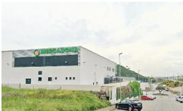
L'equipament es construirà a tocar de l'actual Mercadona.

Segons ha publicat Som Montornès , l'equipament tin-