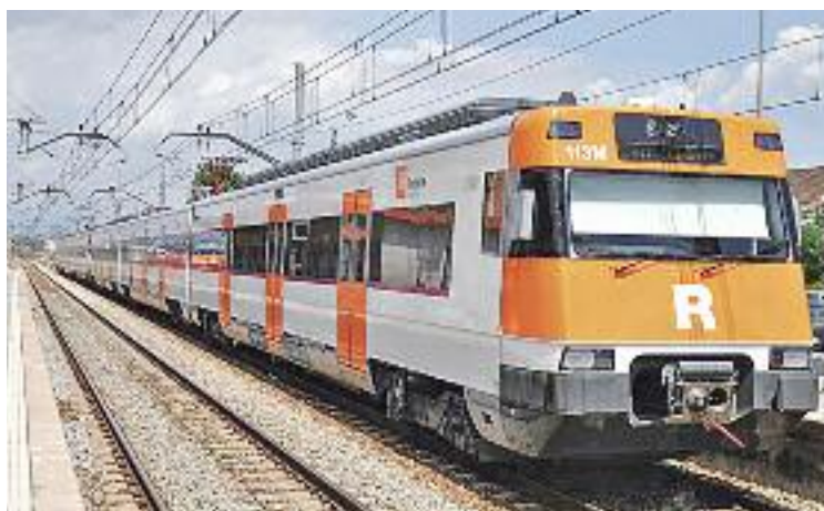
La mobilitat és una de les assignatures pendents de la comarca.

De fet, en un comunicat publicat divendres passat, FEM-