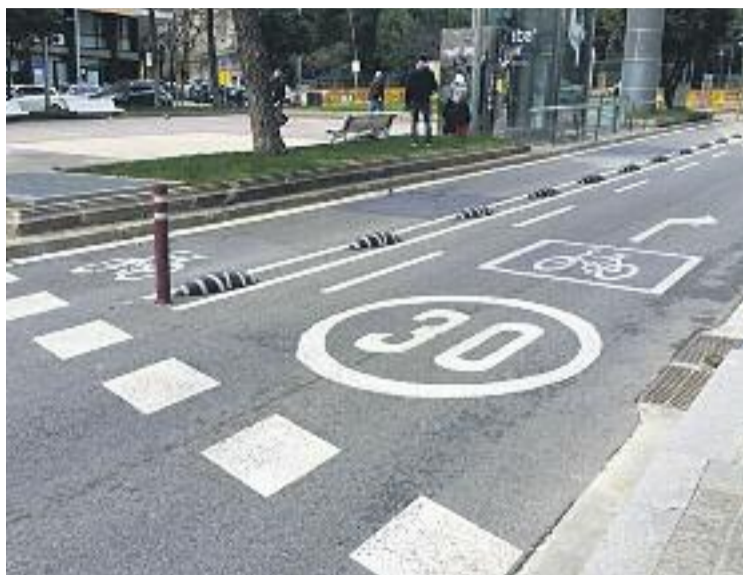
Els carrils bici del Turó Park, font de polèmica.