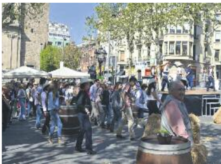
Una imatge de l'edició de la Sarrià BBQ de l'any passat.

A banda de l'esperit gastronòmic, la jornada també tindrà diferents activitats per tal que els veïns, molts d'ells es vestiran amb la indumentària cowboy , s'ho passin d'allò més bé. Els amants del ball podran gaudir de la música country , mentre que els més petits tindran ponis per poder muntar. També hi haurà un brau mecànic per als més atrevits i diferents paradetes d'a-