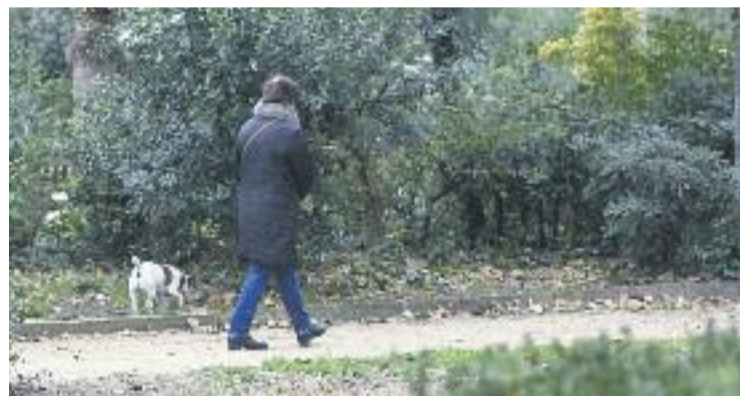
Els gossos ja no poden entrar al Turó Park.