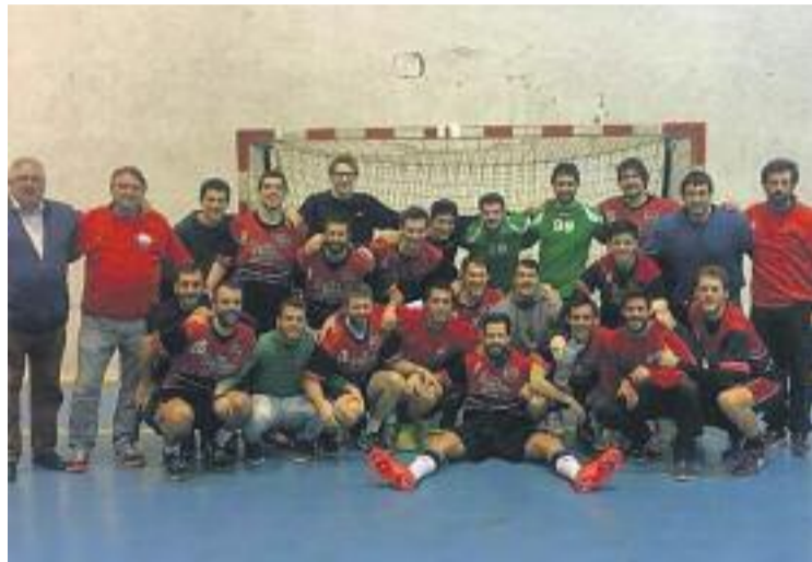
La plantilla i el cos tècnic del conjunt vermell.

Després del partidàs que va enfrontar l'equip contra l'Handbol Poblenou (els dos equips que han obtingut el bitllet per lluitar per l'ascens a Catalunya), l'equip tancarà la fase regular de la Lliga Catalana sènior Antonio Lázaro amb un partit al pavelló municipal Pau Gasol contra l'Handbol Cooperativa Sant Boi el pròxim diumenge 14 a partir de les vuit del vespre.