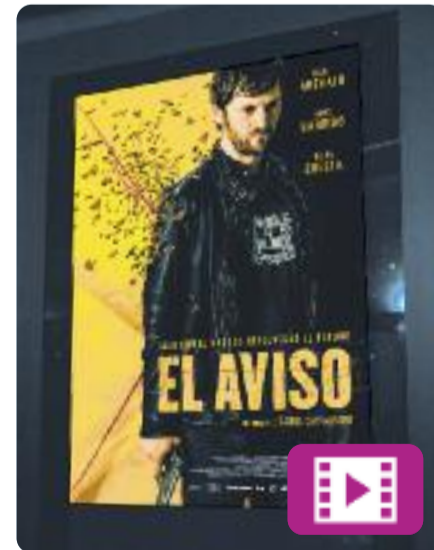
El aviso Daniel Calparsoro

Raúl Arévalo, Aura Garrido i Belén Cuesta protagonitzen un trepidant thriller que barreja gèneres com l'emoció i la intriga.