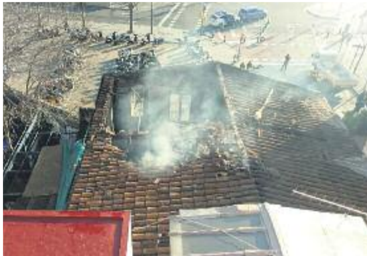
L'edifici va quedar en molt mal estat.

Des de l'Ateneu, la resposta a aquest atac va ser ràpida i contundent. "Volem deixar clar que l'Ateneu Popular de Sarrià no és només un espai, és un projecte col·lectiu dels i les joves del barri. Nosaltres continuem. Així que l'Ateneu segueix, i més antifeixista que mai", van afirmar en un comunicat fet a través de Twitter. A banda, el col·lectiu juvenil va apuntar a qui, segons