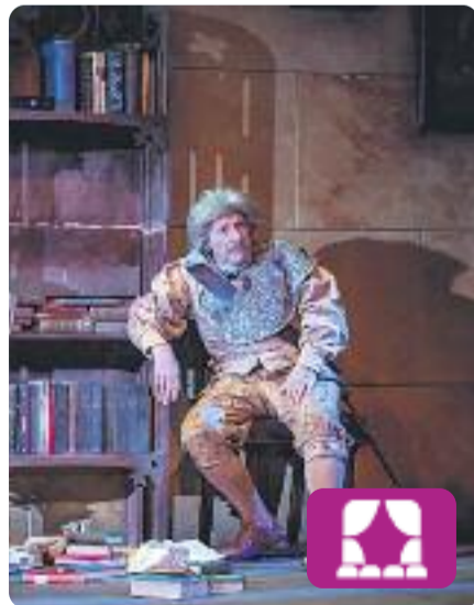
El fantasma de Canterville Oscar Wilde

Lord Canterville convida una família americana a passar el cap de setmana al seu antic castell d'Anglaterra. Ara bé, abans adverteix als nous habitants que el fantasma d'un avantpassat familiar vaga per la casa. Però els inquilins no fan cas de l'avertència, sinó que es burlen constantment d'ell.