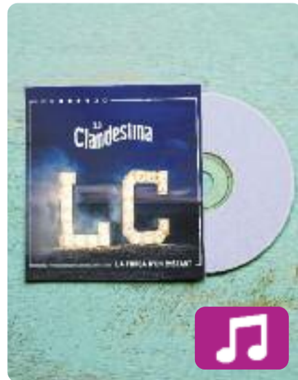
La força d'un instant La Clandestina

La Clandestina va presentar el passat 23 de març el seu primer llarga durada.