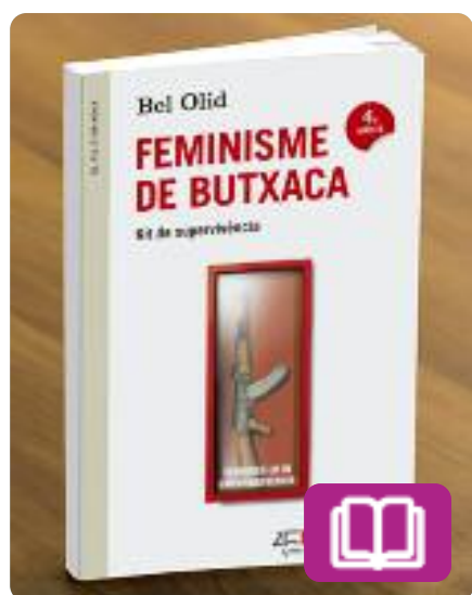
Feminisme de butxaca Bel Olid

El 8 de març es commemora el Dia Internacional de la Dona Treballadora i és un bon moment per llegir Feminisme de butxaca: kit de supervivència de Bel Olid.