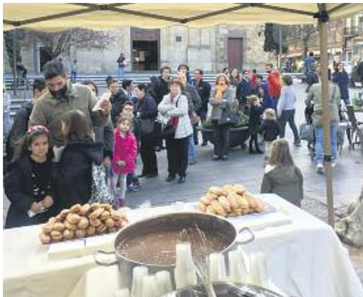
Cua de veïns esperant per tastar els melindros amb xocolata.

La segona xocolatada es va fer quatre dies més tard. En aquesta ocasió el lloc escollit va ser la plaça de Sarrià, on es van tornar a servir 400 racions més. La xocolata i els melindros van fer les delícies de petits i grans, que van fer cua a davant de la parada on servia la xocolata i els melindros per poder degustar el millor berenar possible.