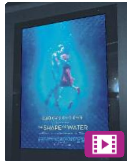
The shape of water Guillermo del Toro

La darrera guanyadora de l'Oscar a la millor pel·lícula és The shape of water . Explica la història de l'Elisa, una jove muda que treballa netejant un laboratori d'un projecte secret del govern nord-americà durant la Guerra Freda.