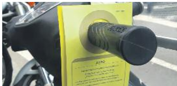
La policia va avisar durant setmanes els motoristes.

MOBILITAT ▶ Aparcar la moto a la vorera es pot considerar una tradició barcelonina. Molts motoristes ho porten fent des de fa molts anys i la imatge és un clàssic de la ciutat. En alguns districtes, Sarrià-Sant Gervasi n'és un, l'afluència de motos a les voreres és molt alta. Des de fa uns dies, però, s'ha acabat la tolerància municipal amb aquest fenomen.