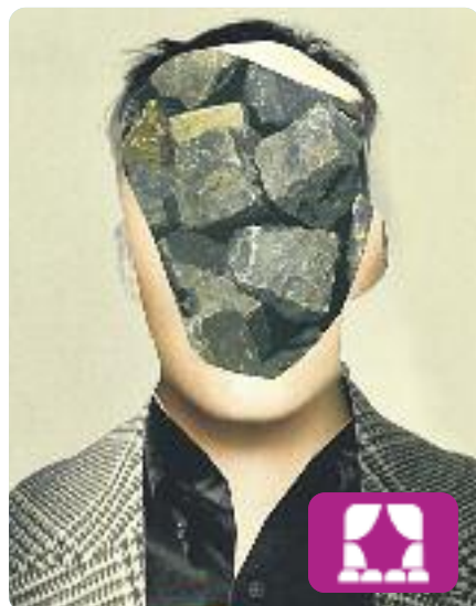
Sopa de pollastre amb ordi Arnold Wesker

Ambientada a Londres i abastant més de vint anys, de 1936 a 1956, Sopa de pollastre amb ordi explica la història d'una família de classe obrera, els Kahn, en un món que canvia a tota velocitat. L'obra mostra diferents posicionaments davant la vida, alhora que construeix un fresc familiar emocionant i colpidor.