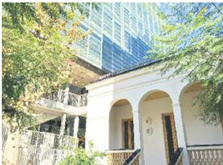
Una imatge actual de la vil·la antiga i de l'edifici nou.

El jurat va considerar positivament les noves característiques del centre, que després de molts anys esperant ser remodelat, s'ha convertit en un edifici referent pel que fa a l'eficiència energètica. De fet, consideren que el consum energètic és gairebé nul, perquè diferents sistemes que s'hi han instal·lat (una