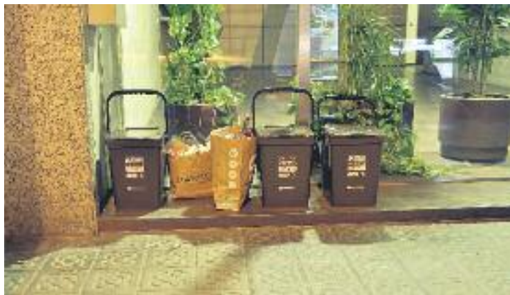
Aquesta imatge ja és habitual al nucli antic de Sarrià.