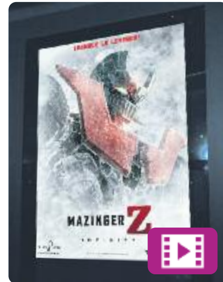
Mazinger Z: Infinity Junji Shimizu

10 anys després de l'última vegada que va pilotar el Mazinger Z, Koji Kabuto ha canviat de vida i és científic, com el seu pare.