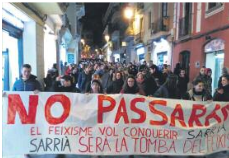
La manifestació va recórrer diversos carrers del barri.

Més enllà dels danys materials, fonts de l'Ateneu expliquen a Línia Sarrià que tenen constància