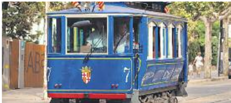
El Tramvia Blau estarà aturat, com a mínim, dos anys.