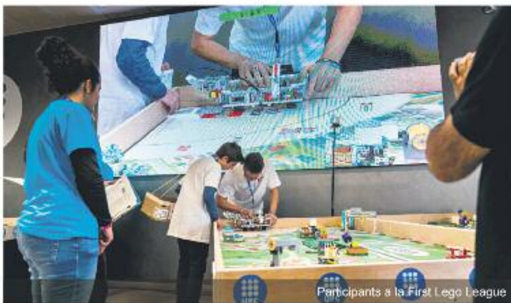
Participants a la First Lego League

Hi ha diferents premis i guardons per als concursants de les diferents fases. Aigües de Barcelona hi col·labora amb el guardó 1r premi al Projecte Científic com a agent coneixedor i impulsor de la gestió eficient del cicle integral de l'aigua. També