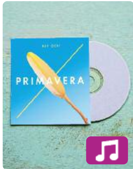
El gir Est Oest

Com el títol del disc indica, amb El gir , Est Oest vira cap al pop electrònic sense cap mania però amb molta feina al darrere. El nou treball s'ha centrat en una bona producció per obrir-se a una etapa més moderna.