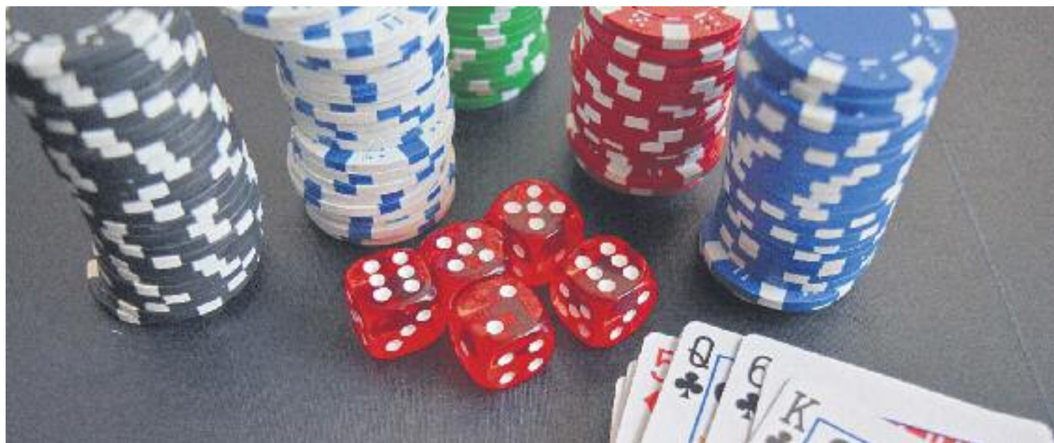
Jugadors Anònims fa trobades amb persones que pateixen ludopatia per ajudar-los a frenar la malaltia.