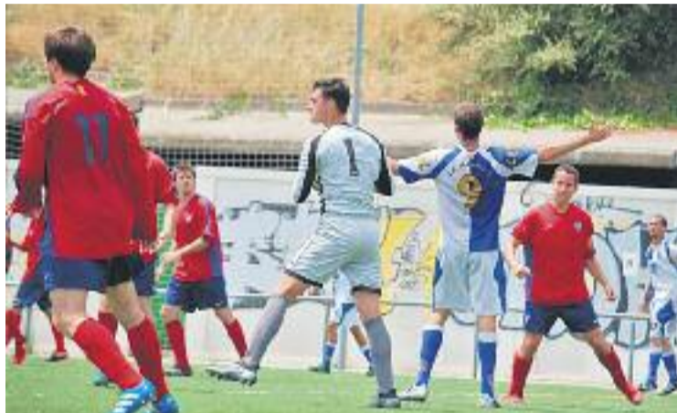
L'equip ocupa una de les posicions de la meitat de la taula.

L'equip ha començat aquest 2018 amb dos empats consecutius (sense gols a casa contra el Besòs Barón de Viver, i a un en la visita a Argentona), de manera que ara, un cop superat l'enfrontament contra l'Atlètic Sant Pol, els sarrianeus tancaran els partits