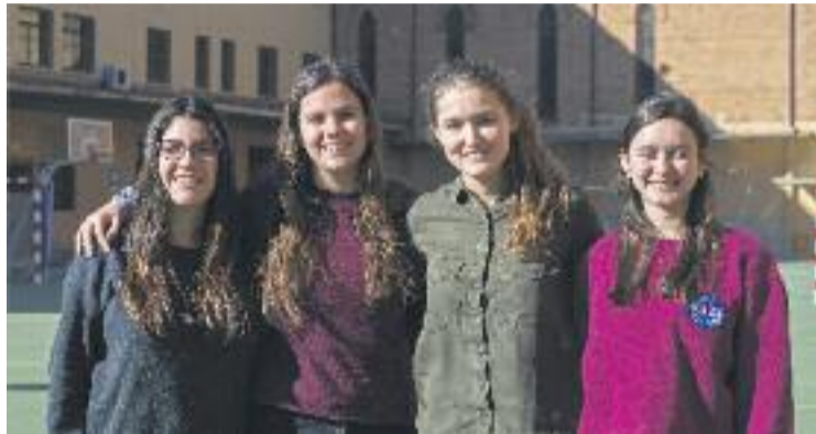
Les quatre noies que han creat el prototip de l'aplicació.

Un dels aspectes més destacats de 'Take This Way' és que permetria compartir els bitllets