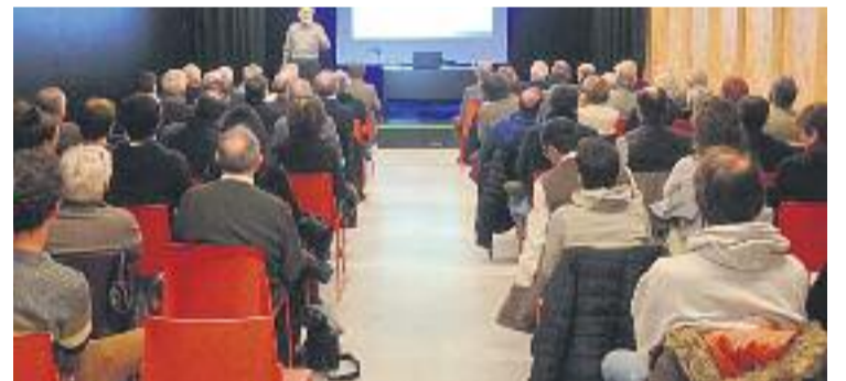
La conferència sobre astronomia del 10 de gener.

EQUIPAMENTS ▶ L'obertura del Centre Cívic Vil·la Urània era molt esperada entre els veïns després de gairebé dos anys i mig de retard en les obres de reforma de l'antiga casa i observatori de l'astrònom Josep Comas i Solà. L'espai manté les activitats del Centre Cívic Casa Sagnier, que s'hi va traslladar oficialment a principis d'aquest gener.