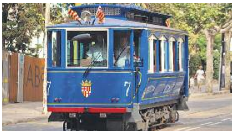
El tramvia blau és un clàssic del districte i de la ciutat.