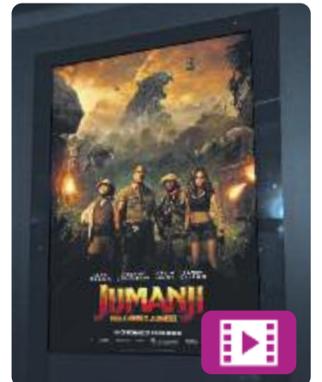
Jumanji: Benvinguts a la jungla

Rentat de cara a un dels clàssics del cinema d'aventures de finals del segle passat. A Jumanji: Benvinguts a la jungla , quatre joves amics són absorbits per un videojoc i es converteixen en personatges amb habilitats úniques.