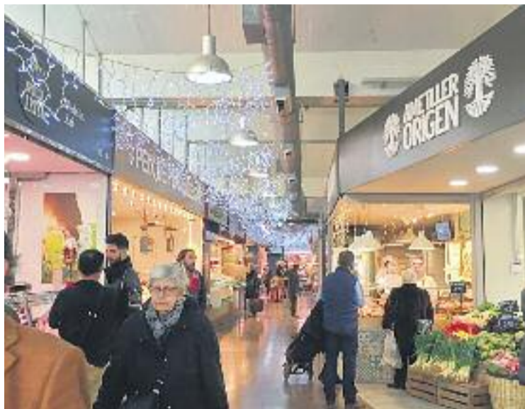
A la dreta, el nou supermercat del Mercat de Sant Gervasi.

Per tal que es pogués fer l'obertura d'aquest espai, abans es va fer un procés de reestructuració dels espais del mercat amb el trasllat de tres paradetes.