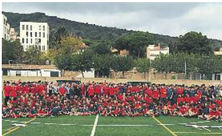
La presentació es va fer el passat dia 12.

El dia de la presentació no hi va haver futbol, cosa que sí va passar tres dies després per al primer equip, que va empatar sense gols al Fort Pienc contra la UD Parc. De fet, el conjunt de Marc