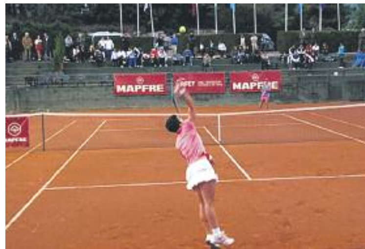
El Barcino defensarà el títol que va guanyar l'any passat.