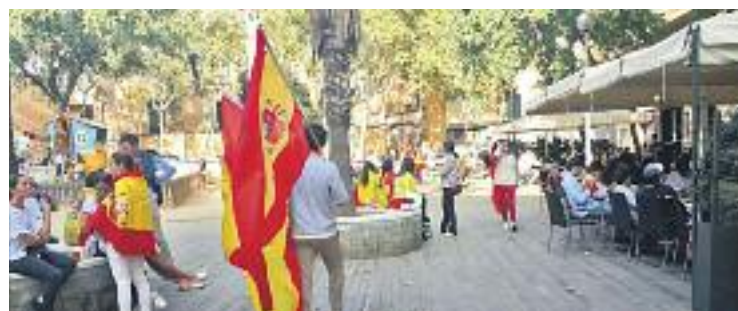
La plaça Artós, un dels punts de reunió de l'espanyolisme.