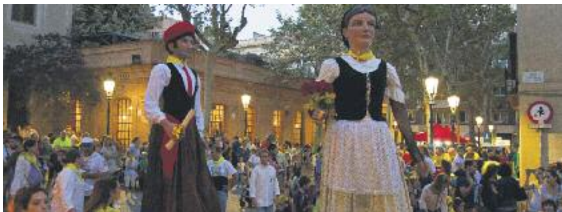
La cultura popular, sempre present a la Festa Major.

TRADICIÓ ▶ Sarrià es va acomiadar el passat 8 d'octubre d'una nova edició d'una Festa Major que va tenir una gran participació popular. La celebració també va estar marcada pel referèndum de l'1-O i l'aturada general de dos dies més tard.