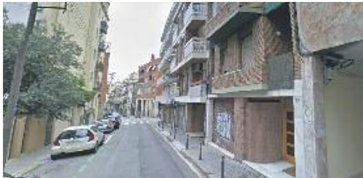
Els veïns volen unes voreres més amples.