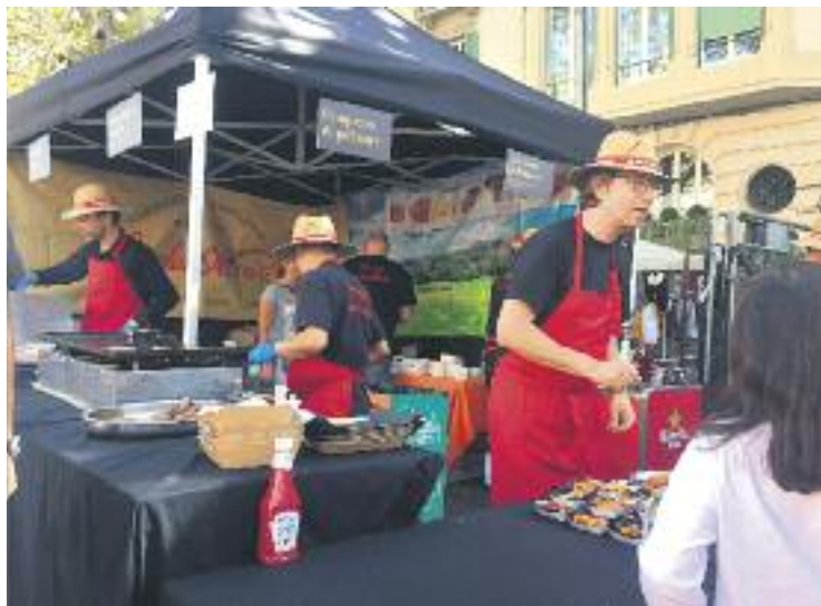
La gastronomia, una de les protagonistes.

D'altra banda, qui va decidir no celebrar la seva Mostra van ser les entitats de Sant Gervasi. Barna-