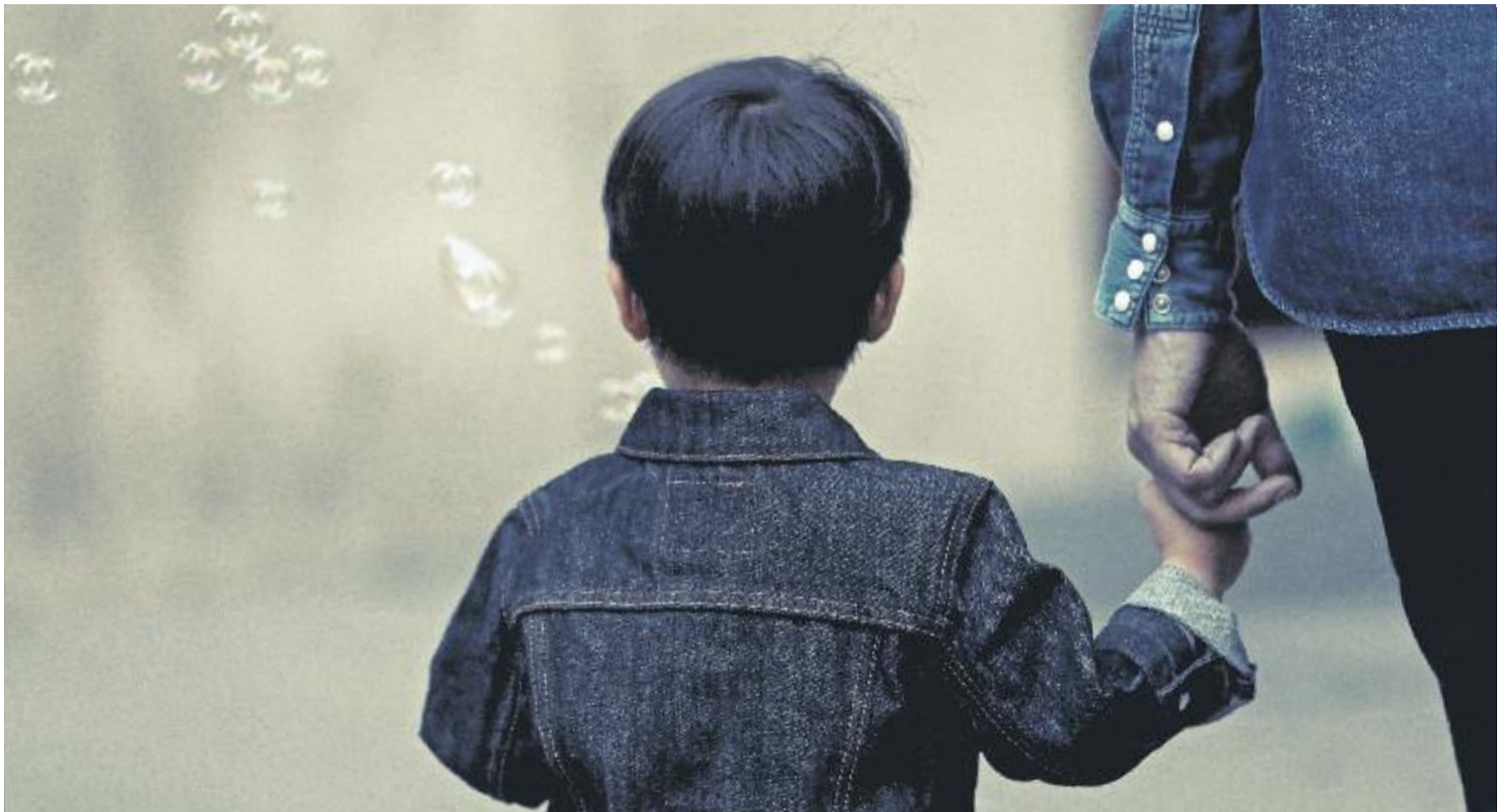
El Departament de Treball, Afers Socials i Famílies ha dissenyat un pla per aconseguir més famílies d'acollida.

» La Generalitat busca un centenar de famílies acollidores per a nens i nenes d'entre 0 i 6 anys