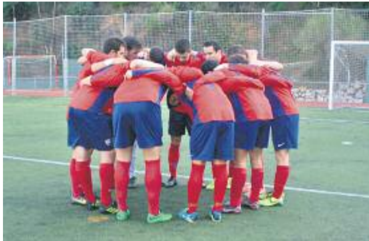
L'equip està a punt de tancar una gran temporada.

I és que tot i que només queda un partit perquè es tanqui el curs, l'equip té una altra jornada pendent, que recuperarà el pròxim dimecres 24 a les 9 de la nit. Aquest partit enfrontarà els sarriàncs contra un dels equips que, gairebé fins al final, han lluitat per poder tenir opcions de pujar de categoria, la Unificació Llefià. El partit de la primera volta, que es va jugar a Badalona, va ser una bogeria i va acabar en empat (4-4). Els locals van dominar totalment el matx fins al