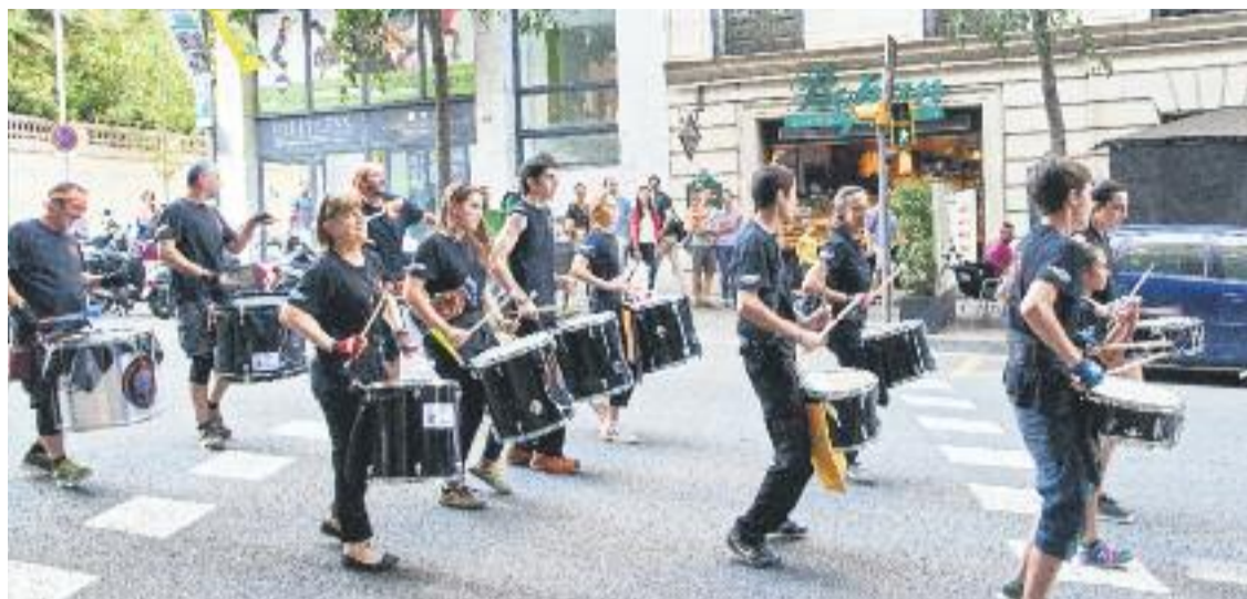
Una imatge de la Festa Major de l'any passat de Sant Gervasi.

CELEBRACIONS ▶ L'arribada del bon temps i la calor és sinònim d'inici de la temporada de Festes Majors en alguns dels barris del districte.