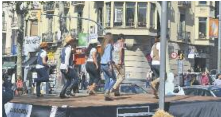
L'associació celebra l'èxit de la Sarrià BBQ.

Aquesta jornada de comerç al carrer comptarà amb la participació de 60 botigues que oferiran els seus productes als visitants. De la mateixa manera, els comerciants acomiadaràn la primavera i donaran la benvinguda a la temporada d'estiu. L'estació preferida dels més petits de la casa, que s'acomiaden del curs escolar i afronten tres mesos de merescudes vacances. En aquest sentit, la Fira d'Estiu de l'Eix Sarrià tornarà a acollir un parc infantil perquè vagin escalfen motors de cara als tres mesos de descans.