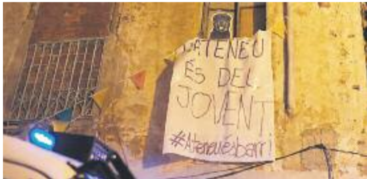
L'Ateneu està situat al número 29 d'Hort de la Vila.

Després d'aquests retrets entre les dues parts, la situació es va embolicar més el dia 3 de febrer. Aquell dia hi havia programada la presentació de l'aliança entre els col·lectius juvenils Arran Sarrià i Esberla. La cinquantena de persones que hi havia concentrades per assistir a l'acte no ho van poder fer, ja que dues unitats d'antiavalots i dues patrulles de la Guàrdia Urbana van bloquejar l'entrada de l'edifici. Tres hores