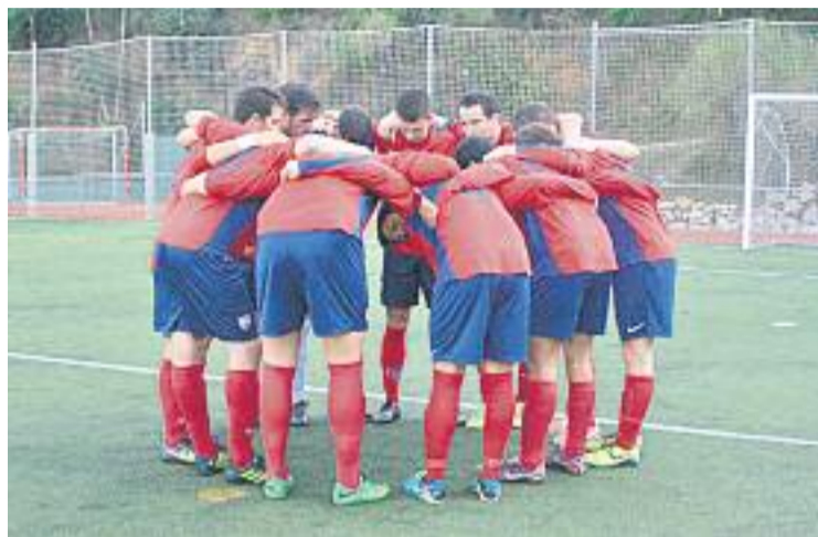
Els sarriàncs viuen un moment dolç de forma.

Fins ara, l'equip ha aconseguit mostrar una regularitat enorme i ha obtingut els matei-