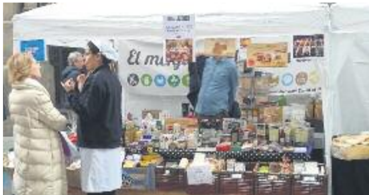
Barnavasi ja prepara una nova sortida al carrer.

Per altra banda, aquesta mostra també donarà l'oportunitat de fer ofertes especials de rematada de les rebaixes i per