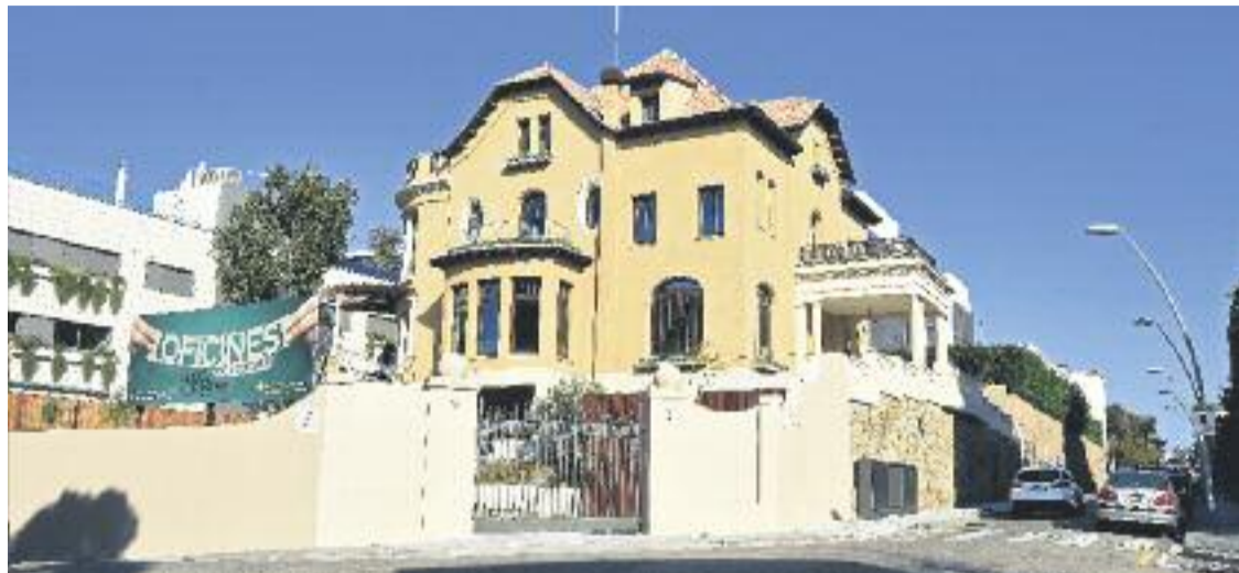
La torre acollirà a partir d'ara oficines.