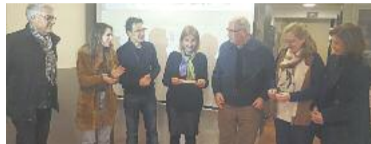
Moment de l'entrega del xec solidari.

SOLIDARITAT ▶ La Fundació Barcelona Comerç va lliurar el passat divendres 3 de febrer la recaptació de la campanya solidària del concurs de curtmètrages BCN Shopping&Shooting a dos menjadors socials.