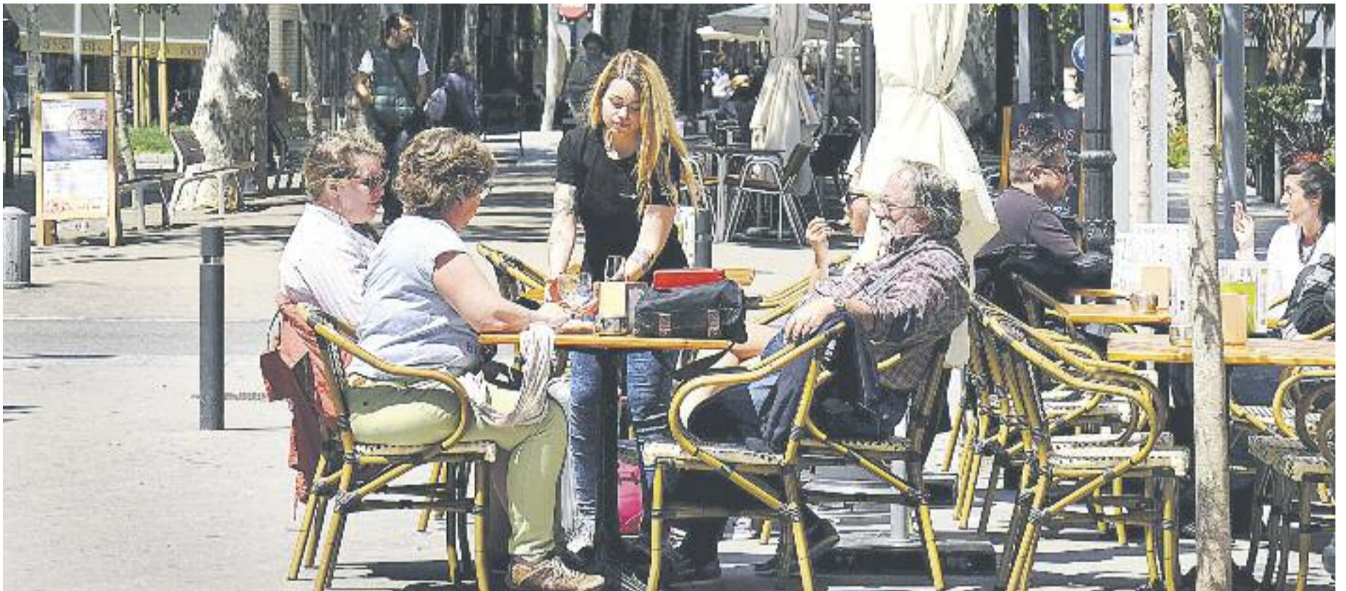
El Gremi de Restauració vol flexibilitat horària en períodes de l'any d'especial afluència a les terrasses, com ara a l'estiu.