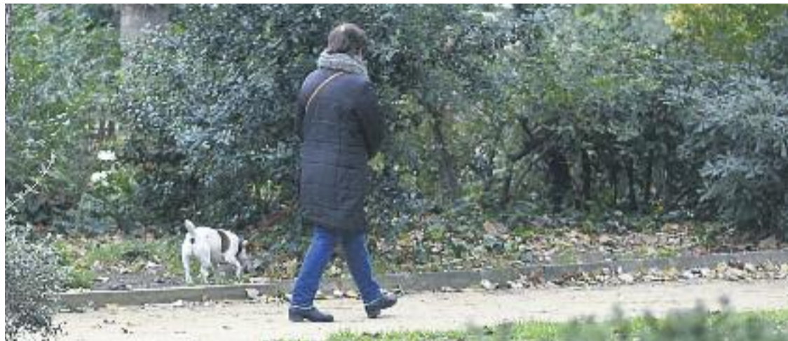
Actualment molts veïns fan servir el Turó Park per passejar el gos.

EQUIPAMENTS ▶ La reforma del Turó Park es posarà en marxa a partir del pròxim mes de juliol. Així ho va avançar l'Ajuntament als veïns a mitjans de gener, en una trobada durant la qual els representants de les entitats veïnals i els comerciants van poder conèixer els detalls d'una proposta que contempla la prohibició d'accés als gossos un cop s'inauguri el nou parc.