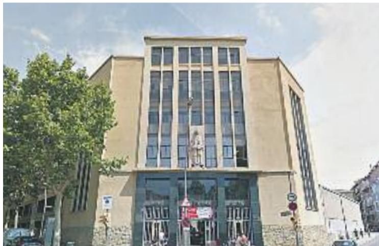
El centre serà un dels punts de la cursa.

L'edat mínima per participar en aquesta competició serà de 3 anys i les inscripcions es podran formalitzar al portal web de l'escola [ www.salesianssarria.com ] fins al pròxim dia 25. El preu de participació variarà en funció de l'edat del participant, en una