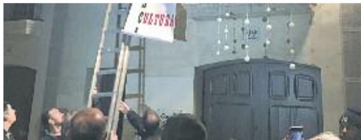
Imatge del dia de l'entrega simbòlica de claus.