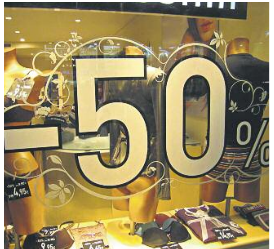
Els comerciants estan fent descomptes al voltant del 50%.