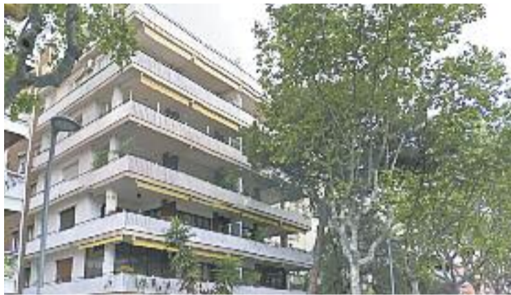
Imatge d'un pis situat al passeig de la Bonanova.

Així doncs, el 2016 es va acabar amb el preu del metre quadrat al districte enfilat fins als 16 euros, quan a finals del 2015 aquesta xifra era de 14,5 euros. L'increment, doncs, ha estat del 9,3% en un any -tot i això, aquest augment està per sota de la mitjana de la ciutat, on ha pujat un 13,7%-. Tal com mostra l'estudi, Sarrià-Sant Gervasi només té per sobre, en tot l'estat, un altre districte barceloní: Ciutat Vella. El preu del metre quadrat en aquest districte és de 17,37 euros. El tercer districte també és de Barcelona, en