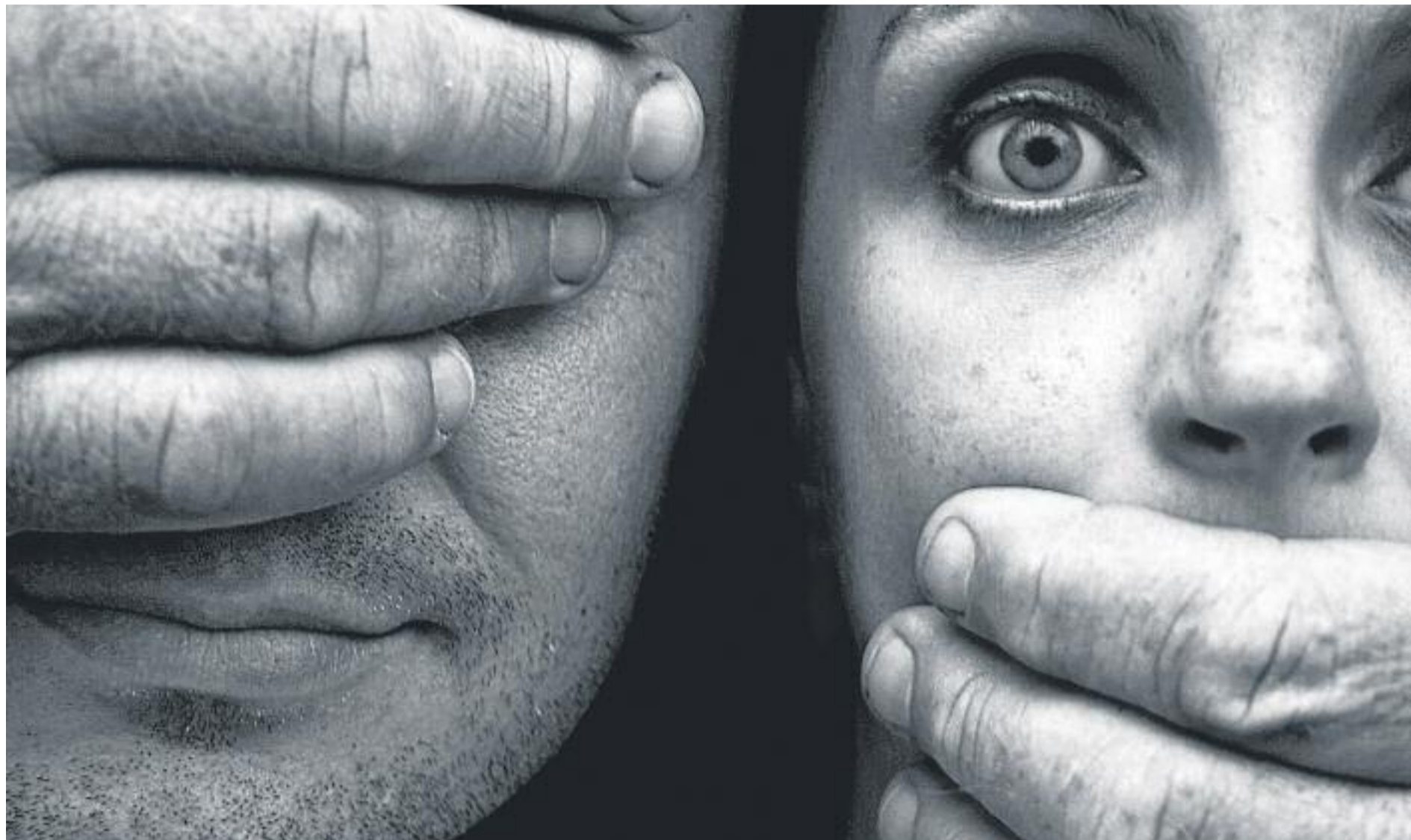
En el que portem d'any ja han mort cinc dones per violència masclista a la ciutat.