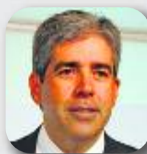
FRANCESC HOMS Democràcia i Llibertat

"El que acredita que el procés va en serio és que hi som nosaltres"