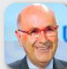
JOSEP A. DURAN I LLEIDA Unió Democràtica

"El 20 de desembre és el nostre gran moment pel canvi i ho hem de fer junts"