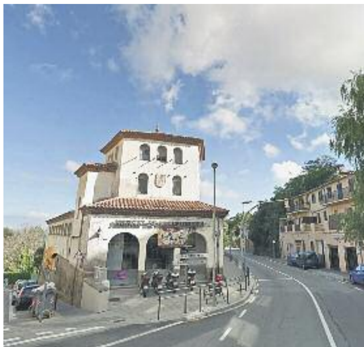
L'antic mercat de Vallvidrera fa sis anys que està tancat.