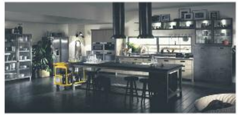
DIESEL SOCIAL KITCHEN