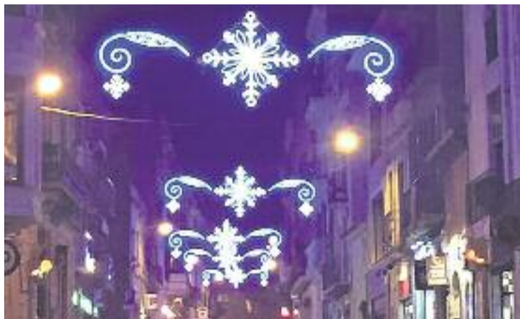
El districte també té instal·lats els seus llums.