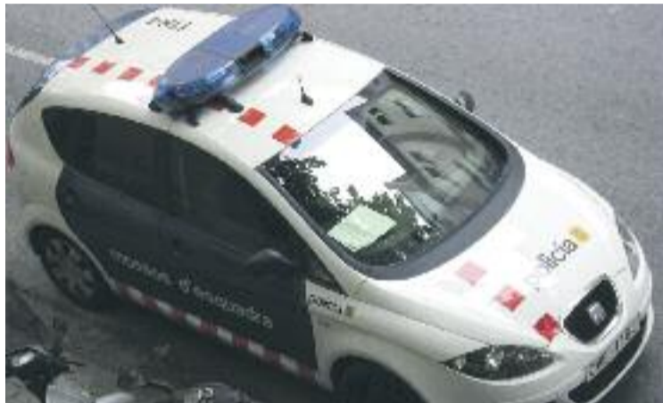
Els Mossos calculen que el valor dels objectes era de 200.000 euros.

La detenció es va produir gràcies a un dispositiu que incloïa policies de país i que va estar en marxa durant un parell de setmanes per poder identificar i detenir els autors dels robatoris que diferents veïns havien denunciat. El dia de la detenció agents de país van detectar dos homes que es movien pel carrer de forma sospitosa. Gràcies al discret seguiment que se'ls va començar a fer, la policia va poder veure com