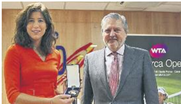
Muguruza, amb el ministre Méndez de Vigo.

Muguruza, que també va poder xerrar amb el Secretari d'Estat per a l'Esport, Miguel Cardenal, va agrair el reconeixement i va assegurar que aquesta mena de premis l'esperonen a