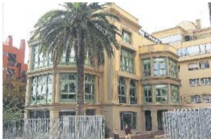
La Casa Orlandai és un centre cultural municipal.

En veure's sorprès pels agents de la policia, el presumpte autor dels robatoris va intentar amagar l'eina que feia servir per forçar els panys de les portes. Un cop detingut la policia també va descobrir que portava 350 euros a sobre, l'origen dels quals la Guàrdia Urbana encara està investigant.