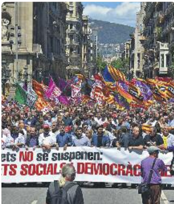
Una imatge de la protesta del dia 29.

La segona concentració, la que es va organitzar diumenge 29, va ser molt més nombrosa (60.000 assistents segons els organitzadors, 8.000 segons la Guàrdia Urbana). Sota el lema 'Els drets no se suspenden: treball digne, drets socials i democràcia real', més de 40 sindicats i entitats socials i sobiranistes van convocar aquesta manifestació com a resposta a les suspensions de les lleis d'emergència energètica i habitacional i de la llei d'igualtat per part del Tribunal Constitucional. La manifestació va començar a la plaça Urquinaona, va baixar per la Via Laietana i va acabar al Pla de Palau, davant la seu de la Delegació del govern espanyol a Barcelona.