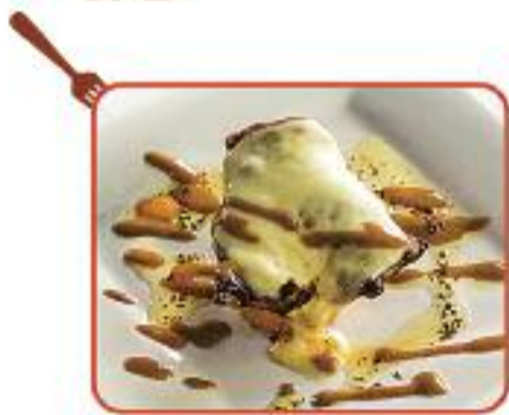
CAFÉ BAR SOLÉ Huelva, 65 Tel. 933.030.418 de 19 h. a 21 h. "MONTADITO" SECRET ADOBAT I FORMATGE