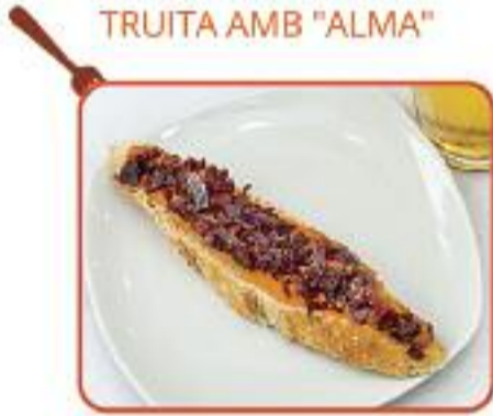
¡MIARMA! QUIN PERNIL Selva de Mar, 251 Tel. 937.014.193 de 19 h. a 21 h. TAPA DE MIARMA