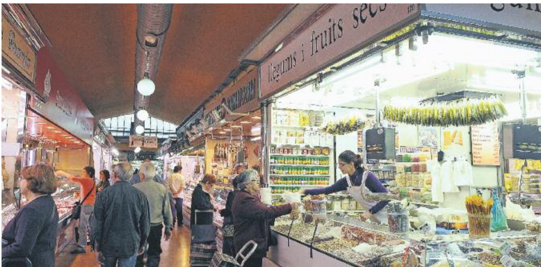
Els paradistes del mercat també formen part de l'Eix Sant Martí.