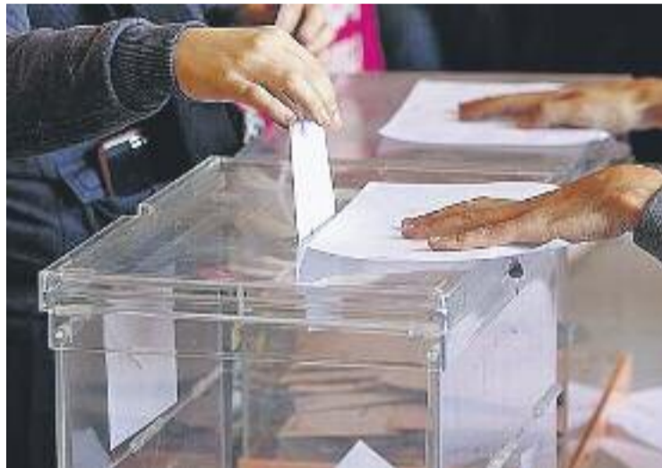
La participació al districte va ser del 68,54%.

Una de les notícies de la jornada va ser el 'sorpasso' que va fer ERC al PSC en la lluita per la segona posició. Els republicans van aconseguir 19.833 vots (17,51%) -el 20D en van treure 18.508 (15,23%)-, mentre que el PSC es va quedar en 18.310 vots (16,17%). En els anteriors comicis els socialistes van aconseguir 200 vots més que els republicans, però en aquesta ocasió no van saber mantenir el segon lloc.