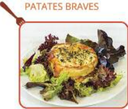
CA L'ESTRELLA Concili de Trento, 131 Tel. 932.509.051 de 19 h. a 21 h. "ZORZA"