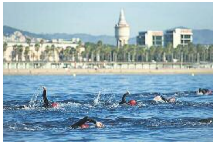
La Neda el Món aplega sempre un bon nombre de nedadors.

Dilluns passat va ser l'últim dia de les inscripcions.