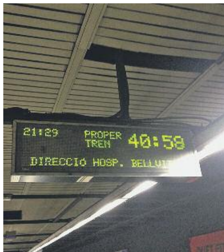
Els usuaris del metro han hagut de conviure amb aglomeracions i retards durant els dies de vaga.