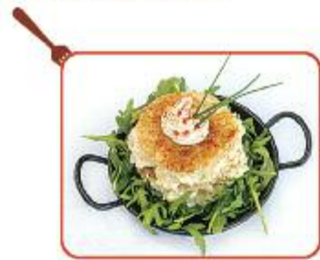
BAR REST. EL MANOLO Rbla. de Guipúscoa, 29-33 Tel. 933.560.238 de 19 h. a 21 h. ENSALADA DE "EL MANOLO"