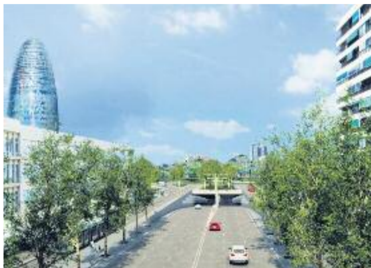
Reproducció virtual de l'entrada dels futurs túnels.

Ara la petició de l'Ajuntament està pendent de l'aprovació defi-