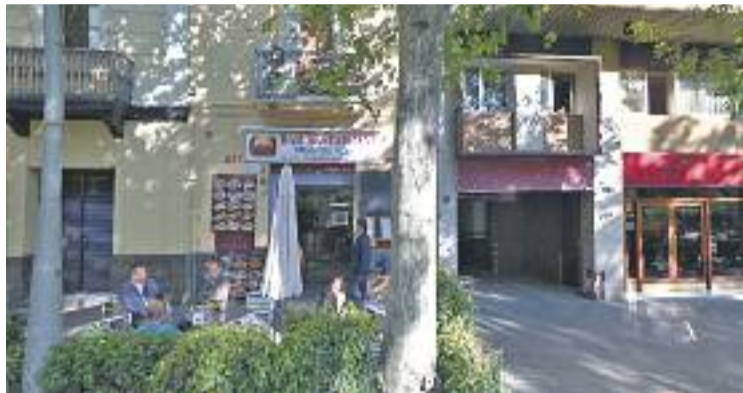
El Suyapa, al carrer Mallorca, acollirà la trobada.

L'acte estarà obert a la participació de tothom i de repre-