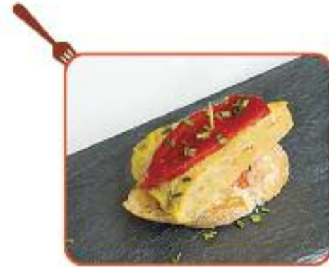
XURRERIA ALMA Av. Gran Via de les Corts Catalanes, 1072 Tel. 930.219.768 de 19 h. a 21 h. TRUITA AMB "ALMA"