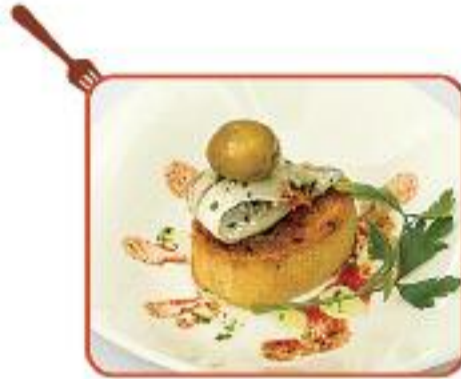
CERVESERIA LA CANTONADA DE PRIM Rambla Prim, 160 Tel. 932.780.106 de 19 h. a 21 h. SEITÓ DE MAMA JÚLIA