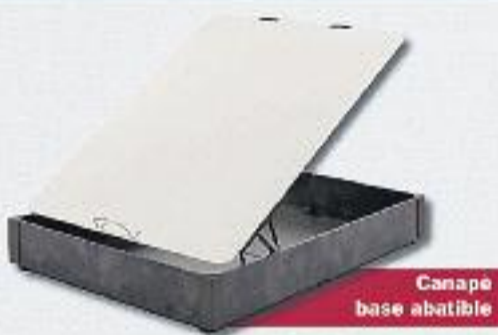
Canape base abatible

PRESENTANT AQUEST CUPÓ OBTINDRÀS UN OBSEQUI*