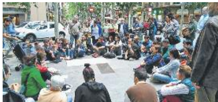
Un moment de l'assemblea veïnal.

PROTESTA ▶ Una cinquantena de veïns del Poblenou van celebrar abans-d'ahir a la rotonda del Casino de la rambla una assemblea veïnal per denunciar la "massificació turística" que consideren que pateix el barri.