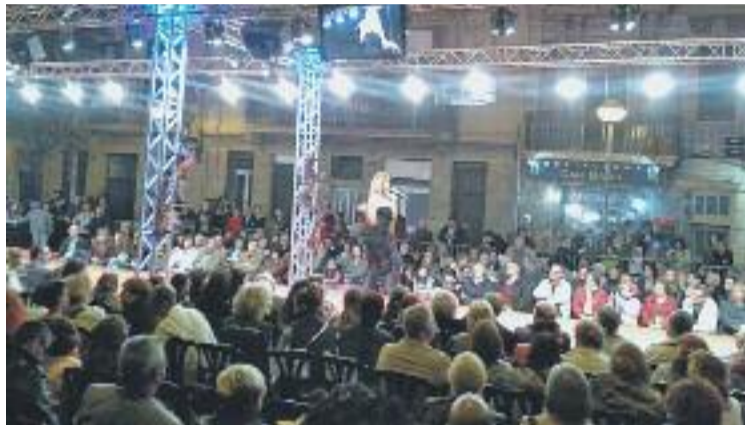
Un moment de l'anterior desfilada de l'associació.

A l'esdeveniment hi participaran 25 botigues associades a l'Eix Clot, entre les quals hi ha joieries, perruqueries, comerços de moda i complements i floristeries que decoraran la tarima per on desfilaran els models professionals. Uns models que mostraran les últimes tendències de cara a la temporada d'estiu dels botiguers de la zona, una roba que es podrà comprar més endavant a botigues de proximitat.