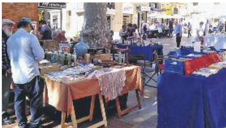
El Clot ha acollit diferents actes.

Fins al cinc de juny algunes de les activitats més destacades