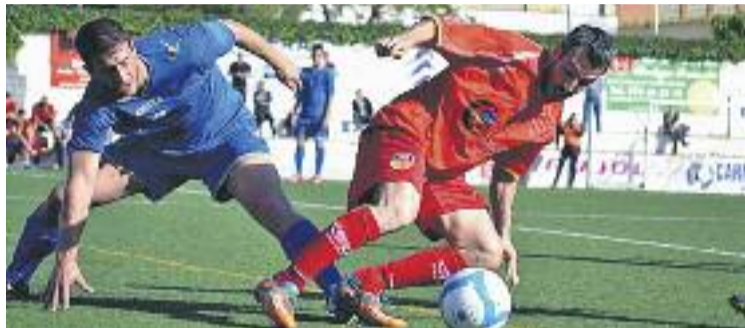
El Martinenc es va quedar amb la mel als llavis per pujar.

Per la seva banda, l'històric Martinenc tampoc ha pogut assolir les places per tornar a Tercera divisió. Ara per ara és sisè amb 52 punts, a cinc de la segona plaça i a set de la primera, les dues que permeten pujar. En el cas dels vermells encara han de jugar un partit, que es disputarà aquest diumenge al migdia al Camp del Telègraf contra l'Avià,