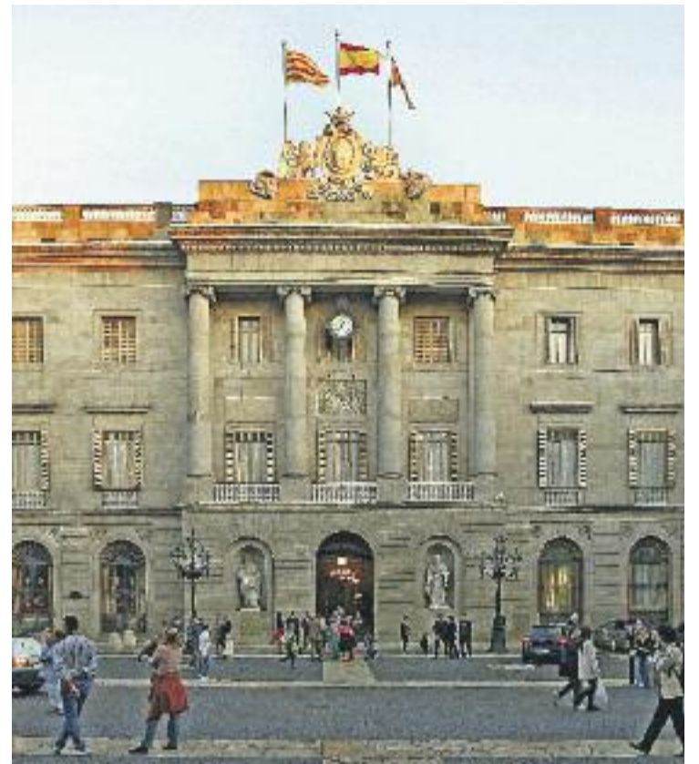
Les empreses que vulguin obtenir algun contracte de l'Ajuntament (esquerra) hauran de ser més transparents amb el consistori (dreta).