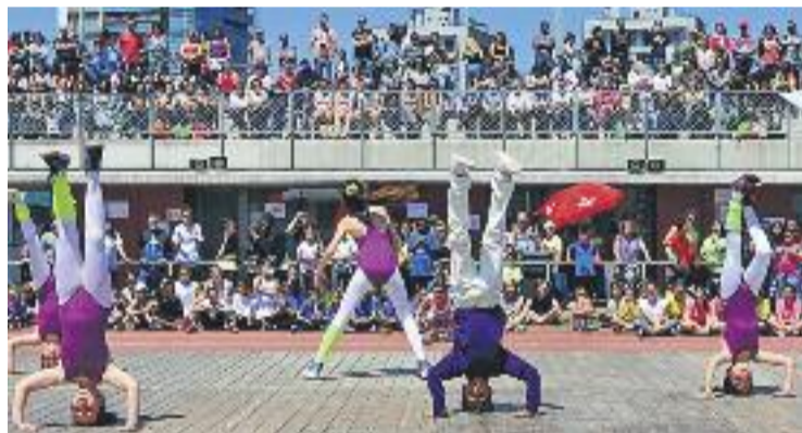
Exhibició de dansa durant la festa.

POLIESPORTIU ▶ La Mar Bella va acollir el passat dissabte dia 21 de maig la festa Convivim, l'acte que posa el punt final a la temporada esportiva escolar.