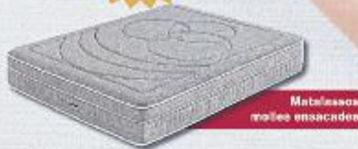
Matalassos molles ensacades