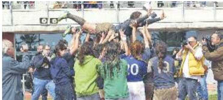
L'Enginyers apunta alt després de guanyar la Copa Catalana.

Les del Poblenou van completar un torneig immaculat, després de derrotar a semifinals