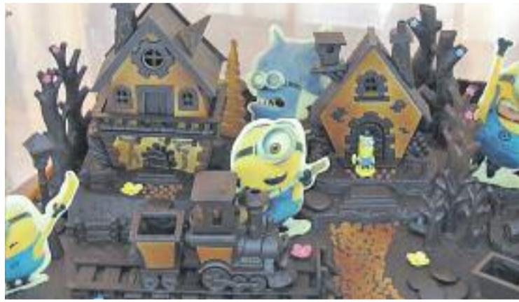
Segons l'eix, han fet falta 50 hores de feina per fer la mona.

La Palma ha fabricat per a l'ocasió una mona de 30 quilograms, batejada com La Ciutat dels Minions, que ha estat possible gràcies a 50 hores de feina. Tots els veïns i veïnes que vulguin un tros d'aquest dolç, hauran de fer una donació d'algun tipus d'aliment sec i envasat, com ara lleties, arròs, oli o conserves, entre altres. Aquests aliments, més tard, seran catalogats