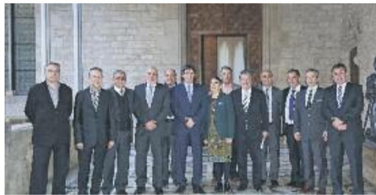
Puigdemont amb els representants comercials.