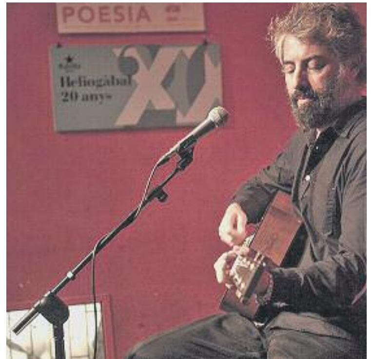
El Jamboree i l'Heliogàbal són dos dels locals referents de la música en viu de la ciutat.