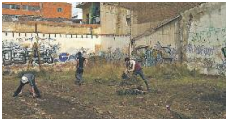
La Flor de Maig ha marxat del solar que havia ocupat.

Des de la Flor de Maig no tenen cap dubte que les amenaces