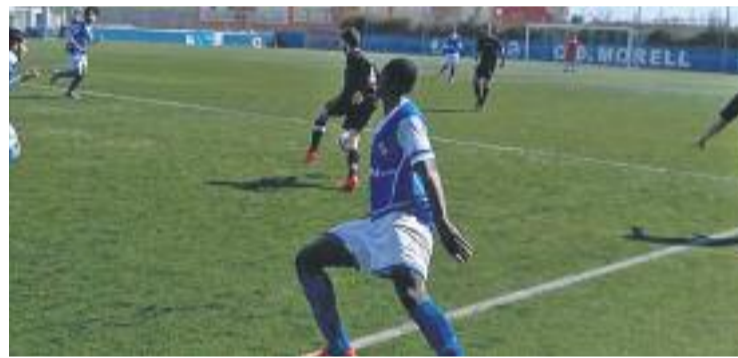
El Júpiter ve de guanyar el Morell a la lliga.

FUTBOL ▶ No val a badar. El Júpiter torna a la competició regular aquest diumenge després de l'aturada de Setmana Santa. Els gris-i-grana s'enfrontaran a domicili al Santfeliuenc, quart per la cua i que també necessita vèncer per allunyar-se de les places de descens.