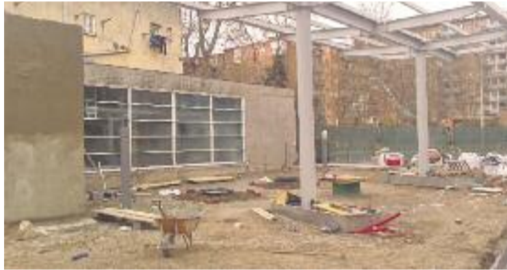
Els veïns volen que s'aturi la construcció de la benzinera.

La Comissió d'Ecologia, Urbanisme i Mobilitat de l'Ajuntament va aprovar a proposta d'ERC el passat 23 de març –amb els vots a favor d'ERC, PSC, C's i PP i l'abstenció de BComú i CiU– una proposició que demana que s'aturin les obres i es retiri la llicència de la benzinera. La proposta va arribar a la comissió després que ERC alertés al govern municipal sobre un possible error administratiu en la documentació que atorgava la llicència. En una primera revisió del document l'Ajuntament va trobar una