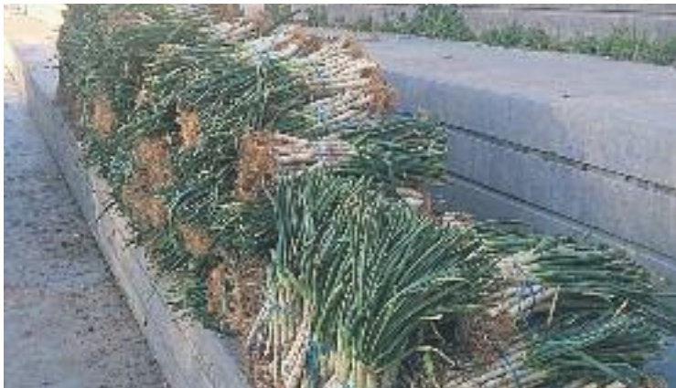
Imatge dels calçots que es van repartir entre els assistents.

En un d'ells es van sortejar 100 euros en vals de compra per bescanviar a les botigues de l'Eix