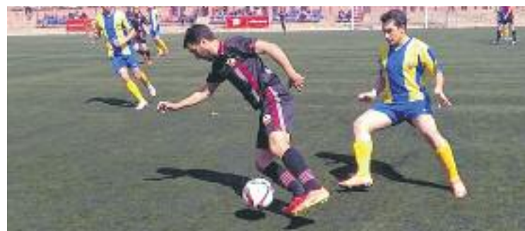
El Júpiter va caure per 1 a 2 contra el degà del futbol català.

FUTBOL ▶ Tercera derrota consecutiva. El Júpiter va caure contra el Palamós a casa per un gol a dos de la forma més dolorosa: amb un gol in extremis al minut 90. I de xilena.