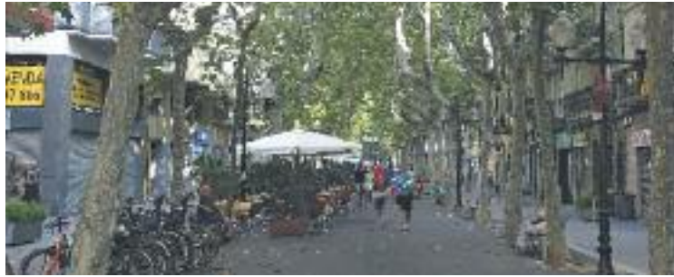
El Poblenou, un dels barris on es limitaran les places hoteleres.

Es tracta dels barris de la Vila Olímpica del Poblenou, el Parc i la Llacuna del Poblenou, el Poblenou i Diagonal Mar i el Front Marítim del Poblenou. En aquestes quatre zones només quan un establiment es doni de baixa se'n podrà fer un altre amb, com a màxim, el mateix nombre de places. A la resta del districte, l'Ajun-