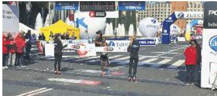
Entrada de Sefir a la meta.

Aiyabei va aconseguir la victòria en solitari després de marcar de dues de les grans favorites de la jornada, les etiòps Aynalem Kassahun –guanyadora de l'any passat– i Motu Megeresa. L'aragonesa Marisa Casa-