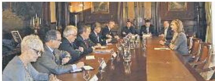
Un moment de la reunió amb la Delegació del govern espanyol.