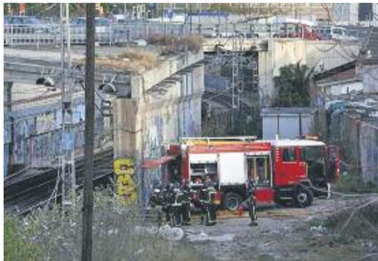
Imatge de la zona on va començar l'incendi.