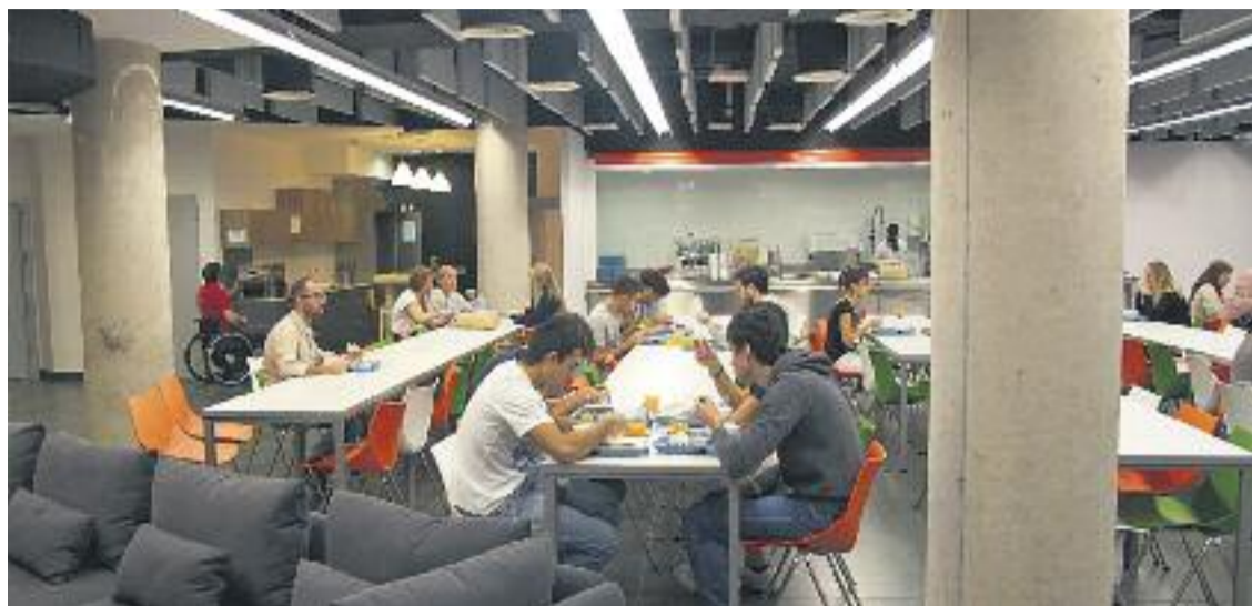
El Twentytú és al carrer Pamplona del barri del Parc i la Llacuna del Poblenou.