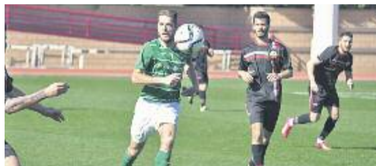
La intensitat va marcar el partit contra l'Ascó.

FUTBOL ▶ El Júpiter va empatar a zero al camp de l'Ascó diumenge passat, un resultat que deixa els martinencs setens amb 38 punts, a sis de les places de play-off.