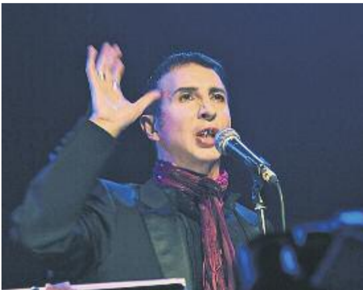
Marc Almond, en una imatge d'arxiu.

Un dels moments destacats de la nit va arribar quan Almond li va dedicar "Burn bright" a David Bowie, mentre que al tram final del concert va acabar mostrant un exemplar d'una revista musical amb una portada de Bowie que algú del públic li va donar.