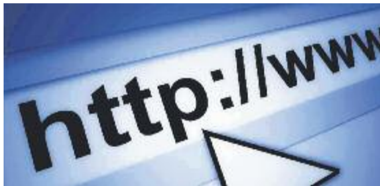
Aquest projecte millorarà la geolocalització de les botigues.

INTERNET ▶ Geolocalitzar les botigues barcelonines a la xarxa i fer-les més accessibles per a tothom. Aquest és l'objectiu del programa Comerç a la xarxa, una iniciativa impulsada per Barcelona Activa amb la col·laboració de la Fundació Barcelona Comerç. Després de la prova pilot que es va efectuar als eixos comercials del districte de Sants, ara aquest projecte arriba a Sant Martí.