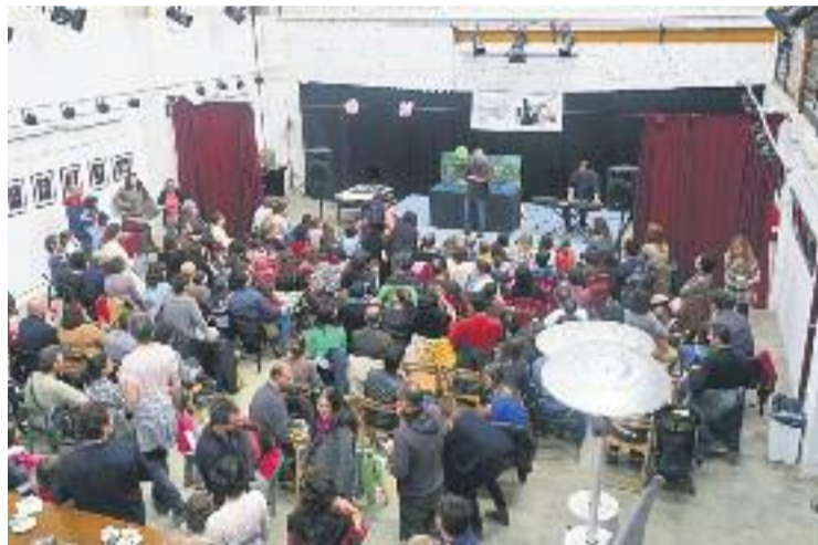
L'Ateneu del Clot és una de les entitats més dinàmiques del barri.

De moment la iniciativa ja compta amb el suport de 165 persones. Un dels signants recorda que "l'activitat cultural que ens ofereix l'ateneu és de caràcter plural i per a tots els públics", mentre que un altre remarca que "l'ateneu és una entitat històrica del barri molt activa, amb més de 40 anys d'existència nascuda dels moviments populars veïnals de resistència a l'antic règim".