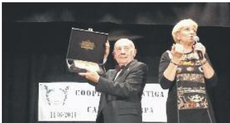
Entrega d'una placa durant la festa de diumenge.

La diada es va haver de celebrar, un any més, a La Formiga Martinenca, ja que la seu històrica de l'entitat fa més de cinc anys que està tancada. La cooperativa no pot pagar les obres de rehabilitació i fa més d'un lustre que va cedir l'edifici a l'Ajuntament a canvi que fos el consistori qui s'ocupés de la necessària rehabilitació. L'acord que van firmar l'entitat i l'Ajuntament establí que la gestió de l'equipament passaria a mans municipals durant, com a mínim, 15 anys però les obres ni s'han fet ni estan pressupostades.