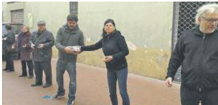
Una cadena veïnal va traslladar els llibres.

CULTURA ▶ La llibreria no Llegiu es va traslladar el passat cap de setmana de la seva antiga ubicació del carrer de l'Amistat, al barri del Poblenou, al seu nou espai, l'edifici Juanita -un històric comerç de roba del barri- del carrer Pons i Sobirà. I ho va fer de la manera més original possible: una cadena humana que va servir per traslladar tots els llibres.