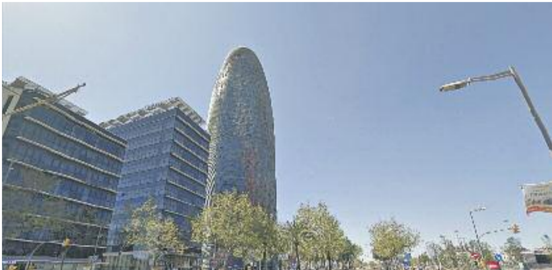
La Torre Agbar es convertirà en un hotel de luxe.