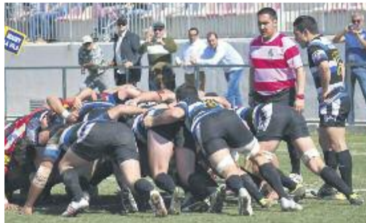
Els del Poblenou no van donar cap opció al rival.