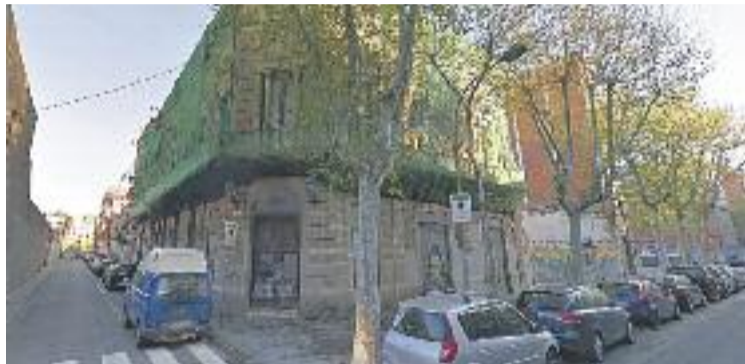
La cooperativa de consum la Flor de Maig va néixer el 1890.

L'entrada i el primer pis de l'edifici són propietat municipal, mentre que la resta de l'edifici és de propietat privada. Precisament des de la Flor de Maig, en un comunicat emès després del desallotjament, atribueixen la situació a "l'enèsim estratagema de la propietat de l'immoble, la família Aguilar, que ha estat percebent rendes en concepte de lloguer per part de l'Ajunta-