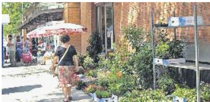
Segons l'IcoB, la recuperació del comerç no acaba d'arribar.

ESTUDI ▶ El petit comerç no se'n surt encara. Aquesta és la conclusió més clara que es pot extreure de l'últim estudi de l'IcoB, presentat ahir i que feia referència al quart trimestre de l'any passat.