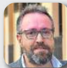
JUAN CARLOS GIRAUTA Ciutadans (C's)

"Som els hereus del catalanisme polític, a diferència dels que volen trencar Espanya"