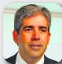
FRANCESC HOMS Democràcia i Llibertat

"El que acredita que el procés va en serio és que hi som nosaltres"