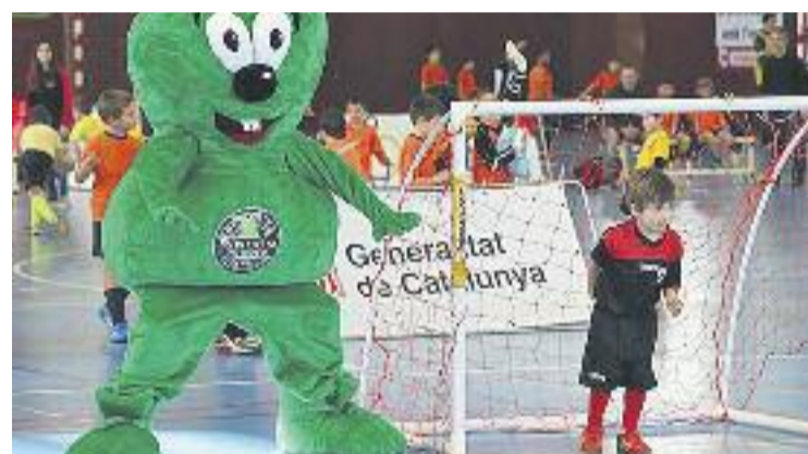
Aquesta va ser la primera trobada de la temporada.

PROMOCIÓ ▶ El poliesportiu de la Mar Bella va acollir dissabte passat la primera trobada Menuts i Menudets de la temporada del Consell de l'Esport Escolar (CEEB).