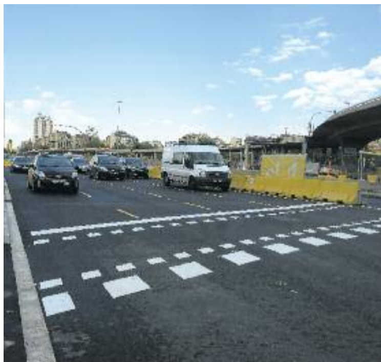
L'Ajuntament vol prendre mesures per reduir el trànsit a la zona.