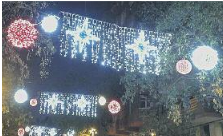
El districte ja té instal·lats els seus llums.