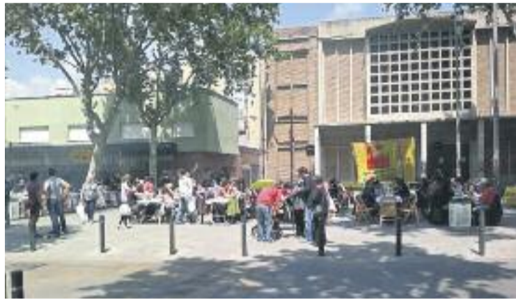
Imatge d'una de les protestes veïnals a davant l'església.