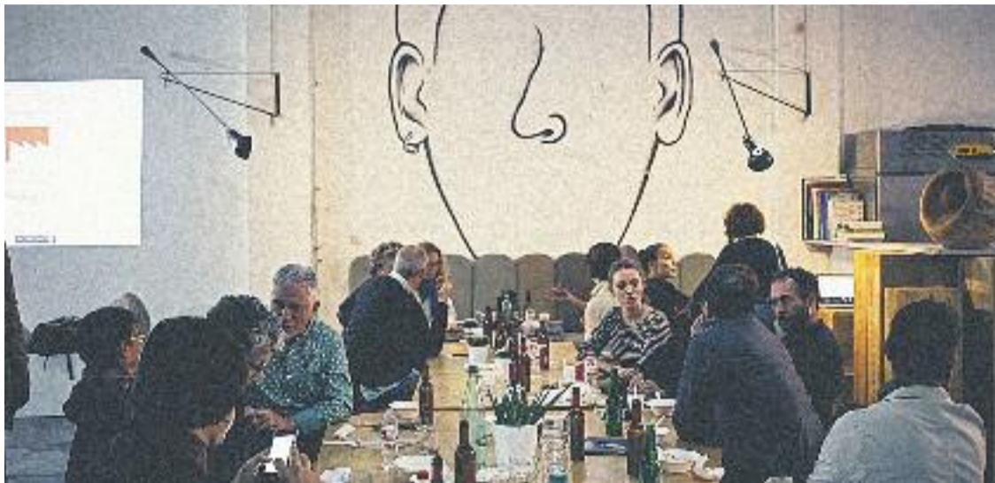
Imatge d'un moment de l'Open Night de l'any passat.