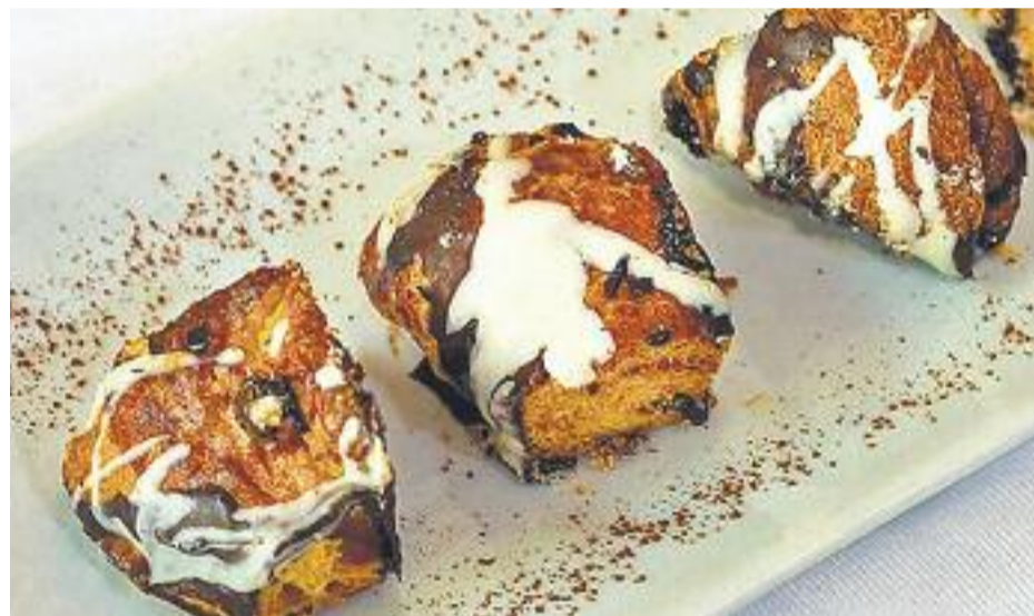
El Tria Tapes permet degustar plats dolços i salats.