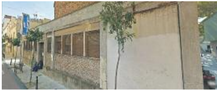
L'església de Sant Bernat Calbó no es convertirà en un monestir.