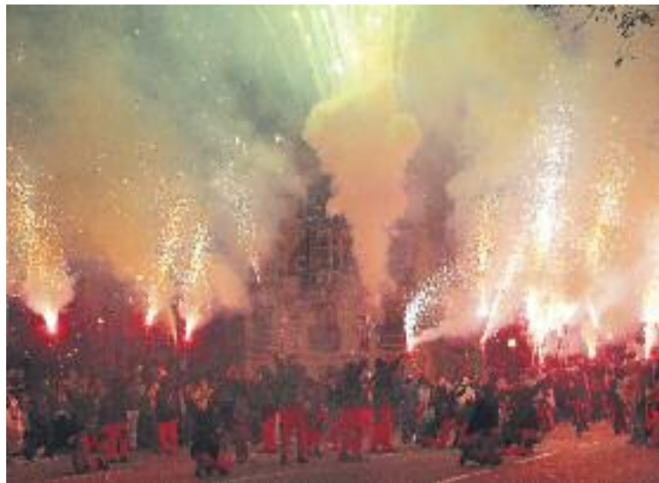
El correfoc del Clot i del Camp de l'Arpa, un clàssic de la Festa Major.

Pel que fa a la de Sant Martí de Provençals-La Verneda, organitzada per la coordinadora VERN, va fer el seu tret de sortida dilluns amb la dotzena Trobada de Corals, el recital de poesia i la inauguració de l'exposició 'Vivències, contrastos del nostre entorn'. Ahir va ser el torn de l'homenatge als veïns que han fet 90 anys i als que han celebrat els 50 de casats, mentre que demà el protagonisme serà pel ball de la gent gran i un cicle de concerts. Un dels dies més potents de la Festa Major serà aquest diumenge, quan se celebrarà, entre altres activitats, la botifarrada popular, la Mostra d'Entitats, la concentració de gegants, gegantons i capgrossos, la cercavila, sevillanes i la can-