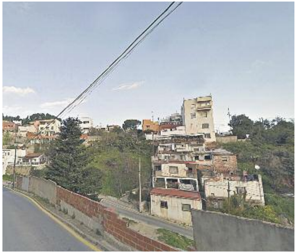
A l'esquerra, Pedralbes, el barri amb una esperança de vida més alta. A la dreta, Torre Barró, on l'esperança de vida és més baixa.