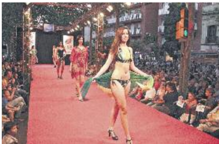
Les desfilades del Moda al Carrer arriben al Clot.

Aquest esdeveniment, que forma part del cicle BCN Moda al carrer de la Fundació Barcelona Comerç, aplegarà un total de 24 botigues de l'eix, de les quals 19 mostraran les seves propostes de cara a la nova temporada de tardor-hivern i unes altres cinc ajudaran al correcte desenvolupament de l'acte. Sobre aquestes últimes, es tracta de perruqueries, botigues de maquillatge, de flors –que guarniran la passarel·la– i una altra que oferirà un pisolabis en finalitzar l'esdeveniment. L'acte que també donarà la benvinguda a la Festa Major del Clot i el Camp de l'Arpa.